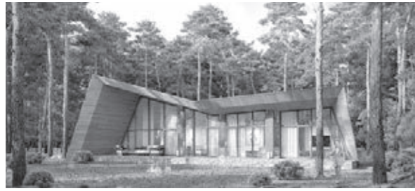
■ Эскиз проекта.