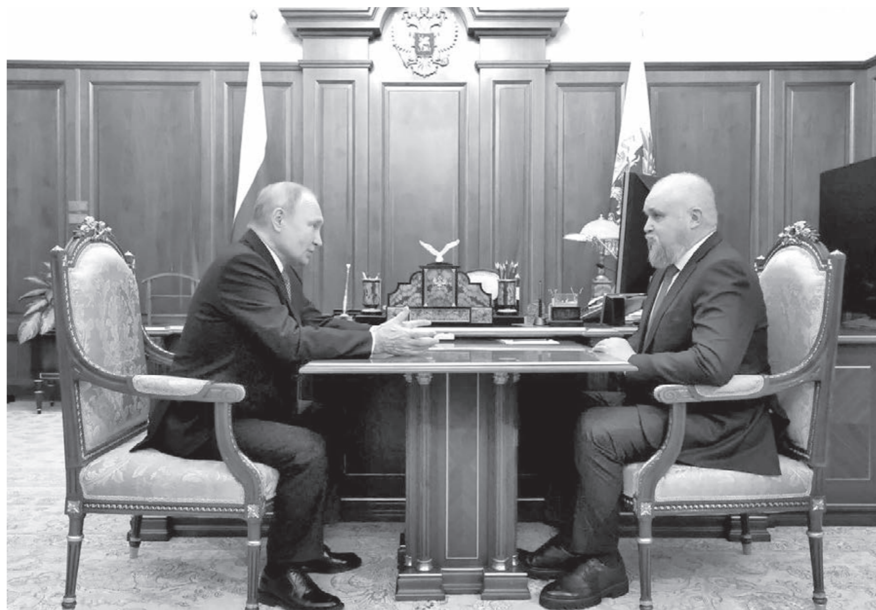
■ Основные направления социально-экономического развития Кузбасса Владимир Путин и Сергей Цивилев обсудили во время рабочей встречи 23 марта 2023 года.

Владимир Путин дал поручение продлить Программу социально-экономического развития нашего региона до 2030 года. В документе, опубликованном на сайте Кремля, определён ряд проектов, которые получат поддержку от Правительства России за эти годы.