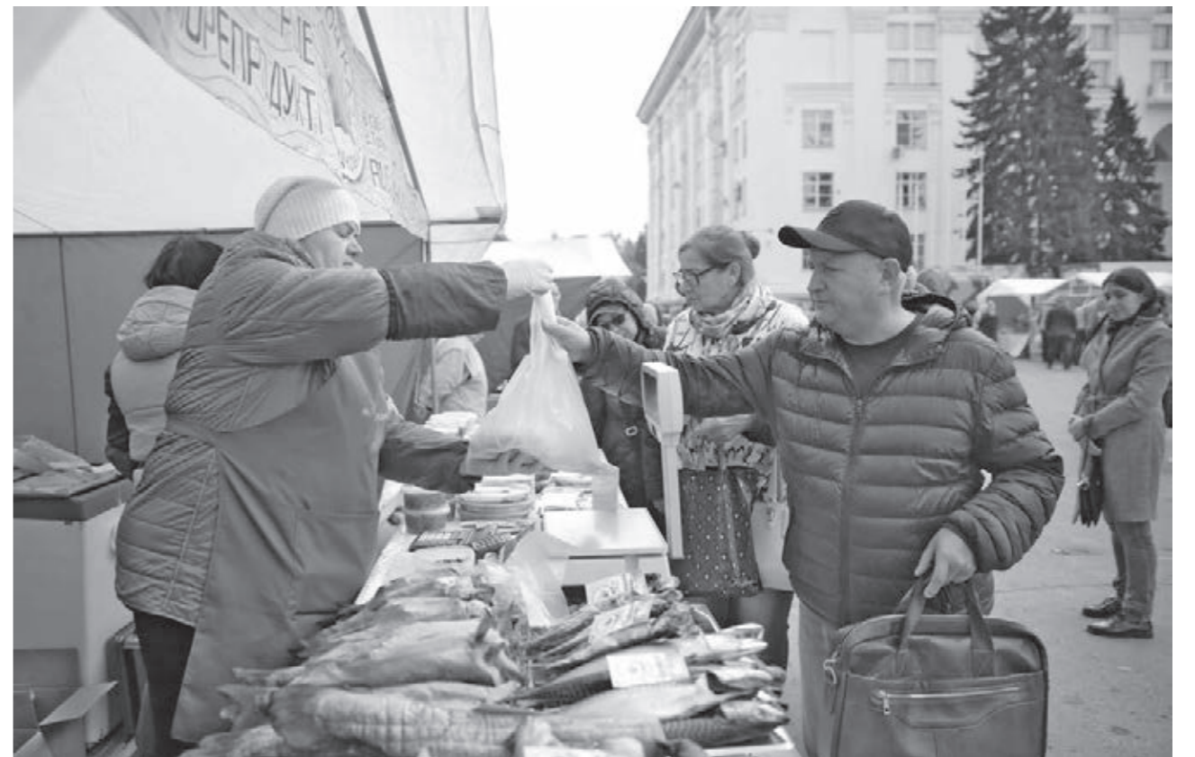
■ Праздничные ярмарки в честь Дня работника сельского хозяйства и перерабатывающей промышленности состоялись в Кемерове, Новокузнецке, Белове, Прокопьевске, Киселёвске, Анжеро-Судженске, Междуреченске. Кузбасские предприятия и фермеры представили собственную продукцию по доступным ценам – на 10–15 процентов ниже рыночных. Напомним: в нашем регионе крупные торжества в честь данного праздника традиционно проводятся после завершения уборочной.