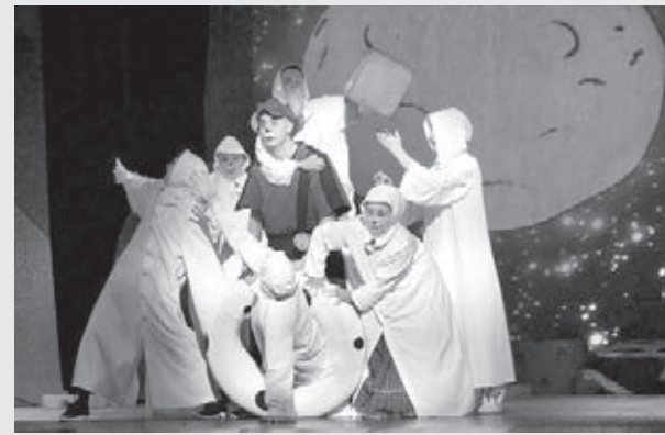
Полосу подготовила Анна Тимошук.

И детям, и взрослому зрителю эта забавная сказка предлагает повеселиться и поразмышлять на вполне серьёзные темы. Действие сказки происходит в сыроварне — истинном раю для мышей. А они здесь двух мастей: серой и белой. Их дети влюбляются друг в друга, несмотря на вражду родителей. Война продолжается довольно долго, пока в события не вмешивается некое удивительное существо. Кто он и чем закончится сказка, узнают те, кто посмотрит спектакль! Постановка хороша для семейного просмотра.