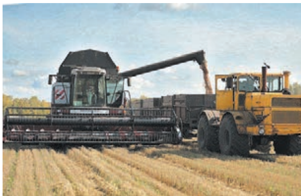
■ Фото пресс-службы АПК.

«Ряд сельских муниципалитетов идут с опережением графика уборки – Тисульский, Тяжинский, Яйский, Крапивинский, Гурьевский, Яшкинский округа. Там обмолочено более 60 процентов зерновых и зернобобовых. Хозяйства региона обеспечены всем необходимым для проведения уборочной: есть необходимая техника, ГСМ, зерносушильные комплексы. В сельском хозяйстве региона работают настоящие профессионалы своего дела, которые с заботой относятся к земле и выращенному на ней урожаю. Несмотря на сложное по погодным условиям лето, Кузбасс не останется без продовольствия», – приводит слова