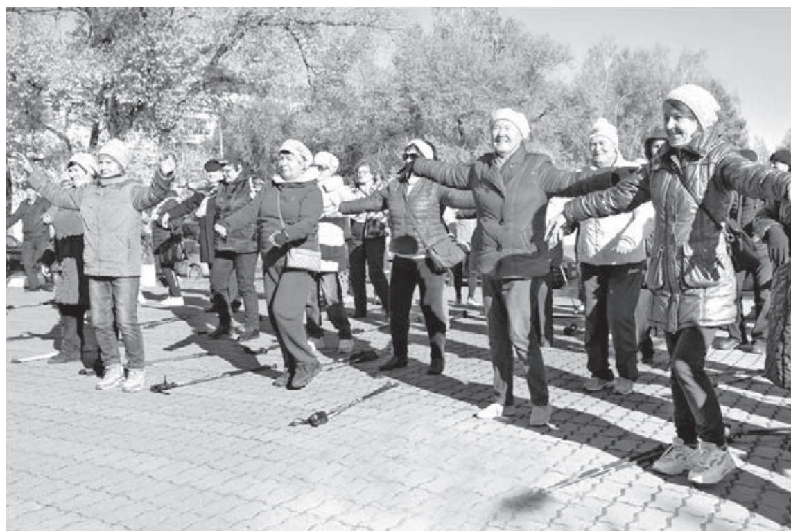
■ Фото Сергея Гавриленко.