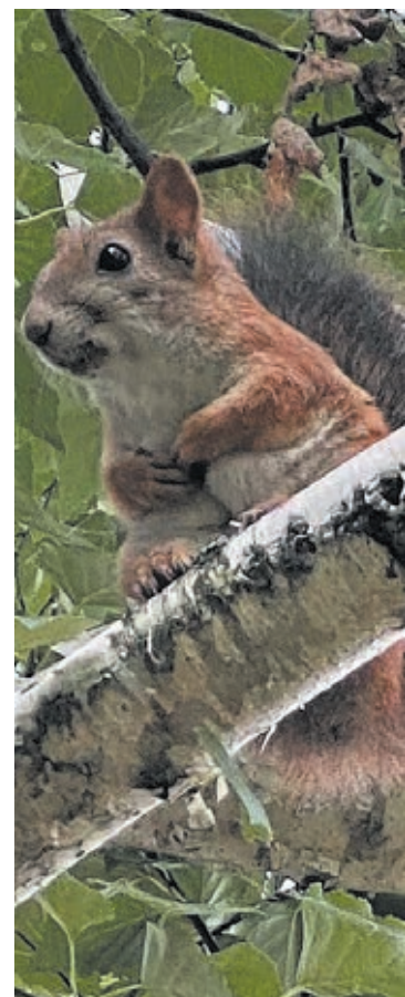
■ Фото из семейного архива.