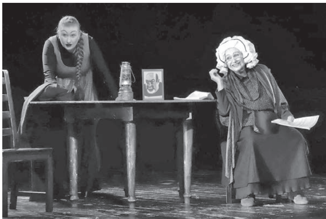
■ Эскиз «Коробочка». Зал был в восторге.