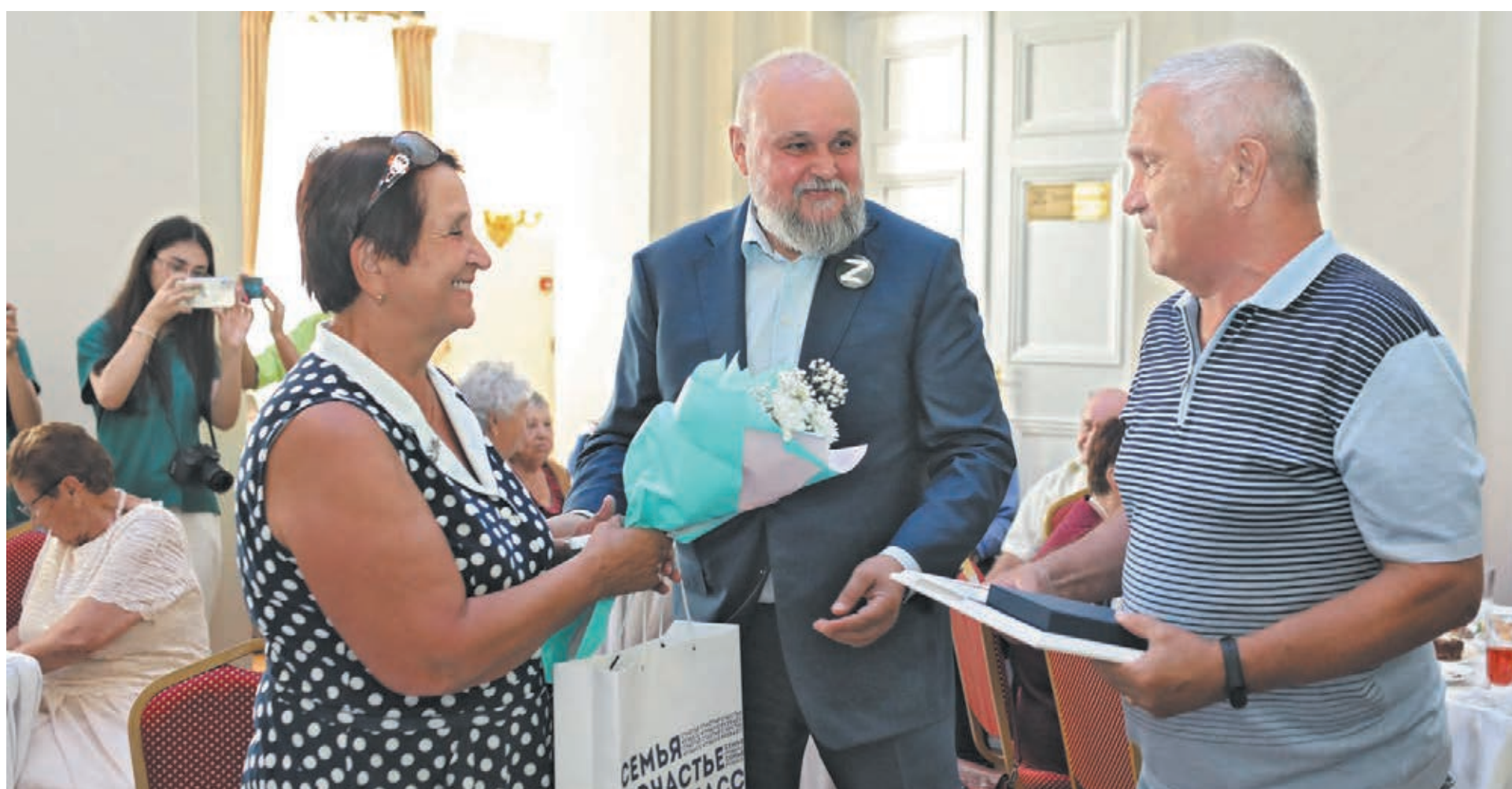
■ Фото Сергея Гавриленко.