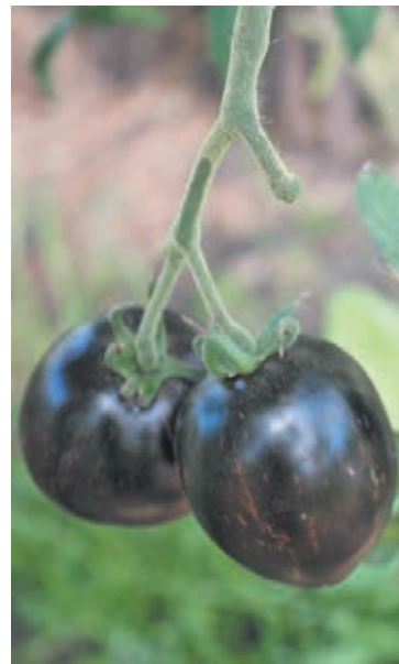
■ Фото Виктора Сохарева.