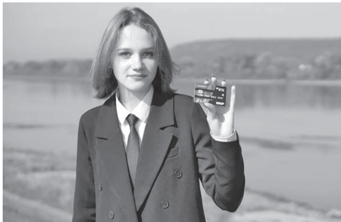
■ Фото Сергея Шпица.