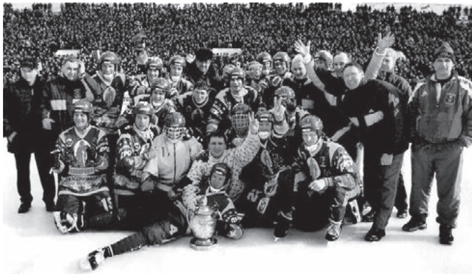
10 марта 2001 года. Хоккейный «Кузбасс» после победного финала Кубка России.

Почётный гость турнира – заслуженный мастер спорта СССР, восьмикратный чемпион мира Валерий Маслов отметил отличную организацию соревнований, поздравил «Кузбасс» и его болельщиков с блестящей победой: