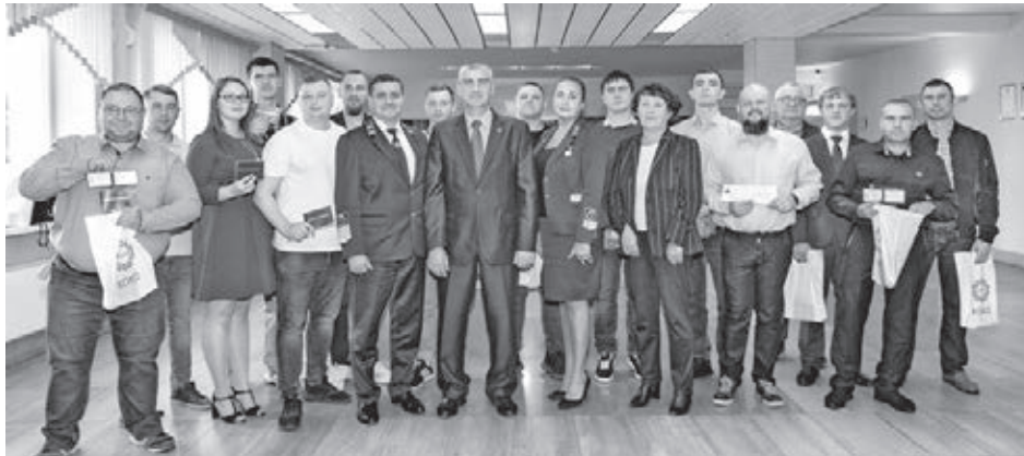
14 работников ПАО «Кокс» стали студентами КузГТУ.

Неотрывность учебного процесса от работы на предприятии практиковалась ещё в советское время – для рабочих-новаторов производства разрабатывались специальные программы обучения, после прохождения которых они сдавали технический экзамен и тем самым повышали квалификацию. Практика начинать карьерный рост с рабочей специальности и при этом регулярно повышать про-