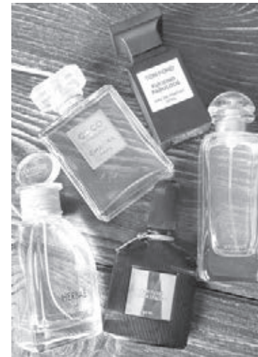
■ Любимые ароматы подчеркнут очарование осени.

– Цветные и акцентные носки давно перестали быть уделом модников, а сейчас, когда мир становится всё более и более расслабленным, носить разноцветные носки и гольфы может позволить себе любой! Белые, чёрные, разноцветные, весёлые и однотонные – выбирайте те, которые соответствуют вашему стилю. Для ценителей классики модники предлагают модные носки с шахматным рисунком. Они прекрасно дополняют строгий офисный стиль или добавляют изюминку в повседневный образ.