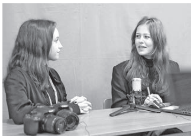
■ Фото учеников детского медиацентра «В центре событий».

«Профессия специалиста медиасреды предполагает постоянное обучение чему-то новому, к тому же в наше время, когда появляются новые каналы и формы рас-