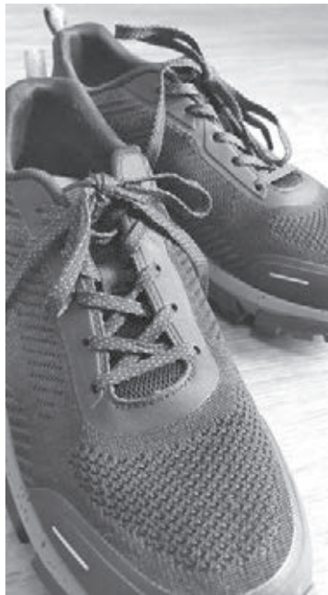
■ Трендовая обувь осеннего сезона практична и удобна.

– Мужской портфель или сумка-папка – универсальный аксессуар, отличающийся компактностью, чёткой геометрической формой и вместительностью. Портфель стоит выбирать тот, который будет гармонично сочетаться с классическим стилем и одеждой в стиле casual. Изделие лучше покупать из хорошей