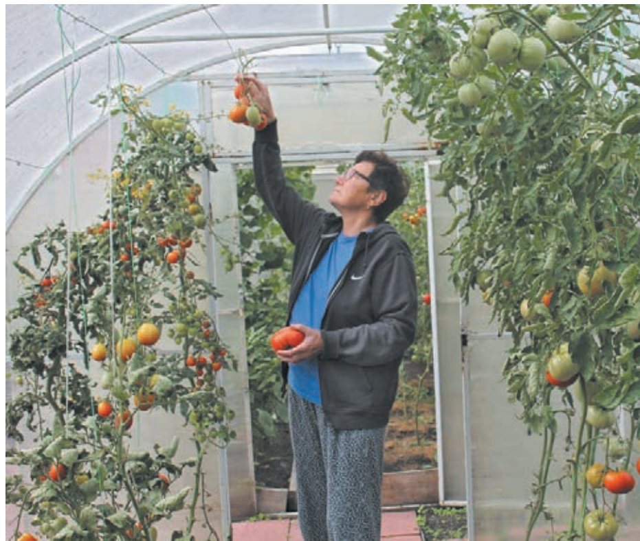
■ Фото Виктора Сохарева.