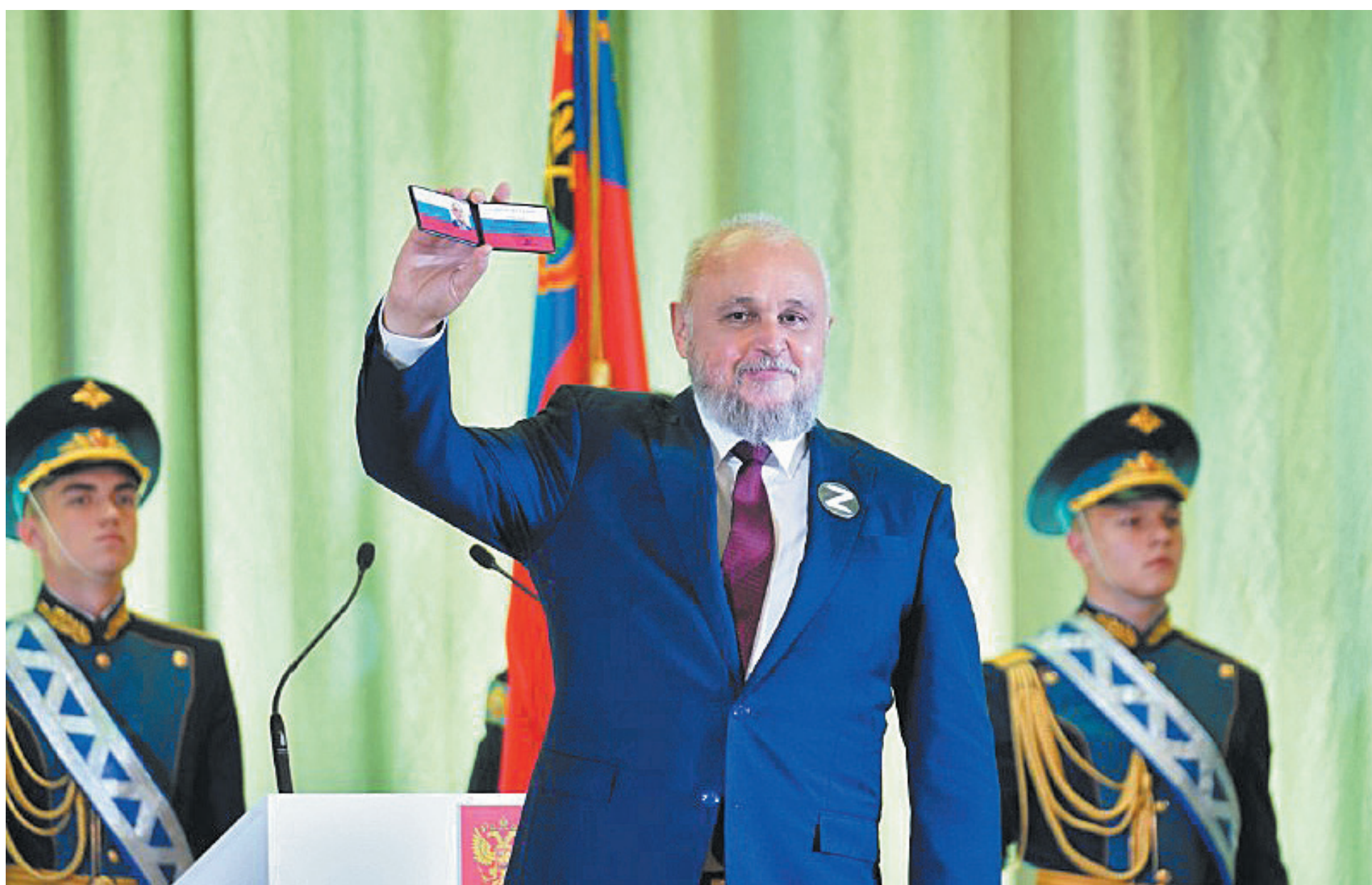
■ Фото Константина Полюцкого.