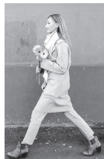
■ Фото автора.