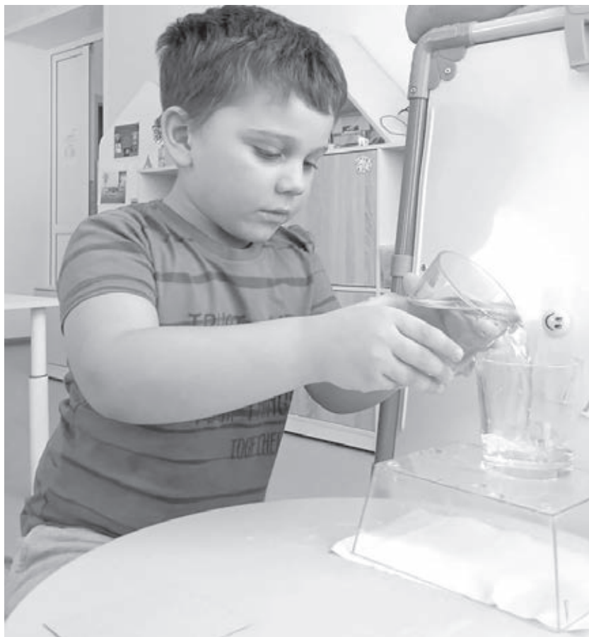
■ Фото пресс-службы г. Кемерово.