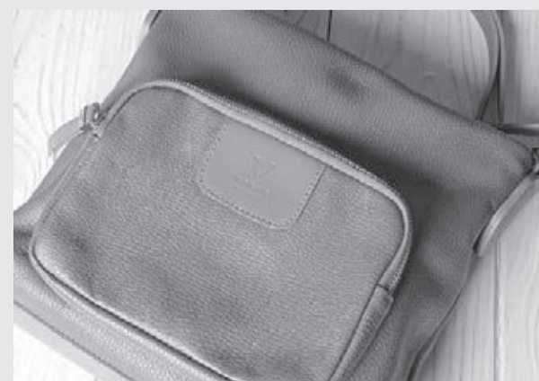
Полосы подготовила Анна Тимошук.

В этом сезоне продолжают впечатлять XXL-шопперы из ткани и кожи, вызывают восторг у зрителей. Они огромные, но при этом шикарные, бесконечно практичные и всё же сохраняют элегантность. Осенняя мода для девушек подготовила сюрприз, который позволит носить с собой много нужных вещей.