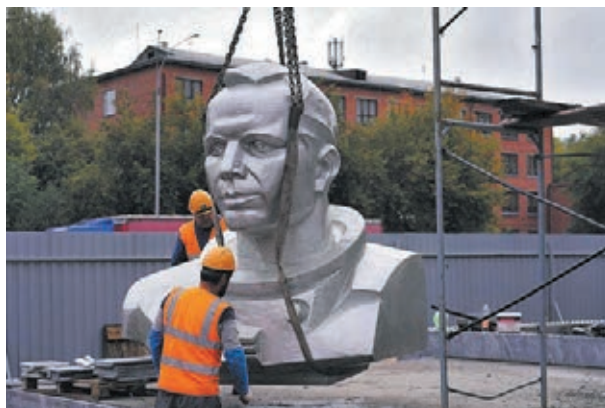
■ Фото пресс-службы администрации Кемерова.

Скульптурный комплекс – объект культурного на-