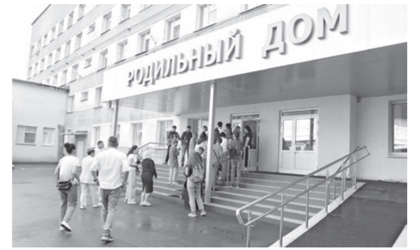
Обновлённый родильный дом распахнул двери.

Реконструкция поликлиники № 5 идёт поэтапно.