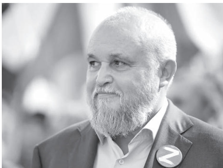
■ Фото Константина Полюцкого.

Теперь для раскрытия своего потенциала не нужно уезжать в другой регион. Самое современное оборудование, опытные педагоги, все необходимые условия есть здесь, в Кузбассе. Новые площадки решают вопрос обеспечения доступности дополни-