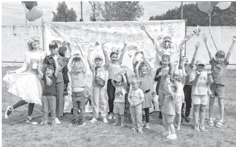
Для детей заводчан на празднике работало множество развлекательных площадок.