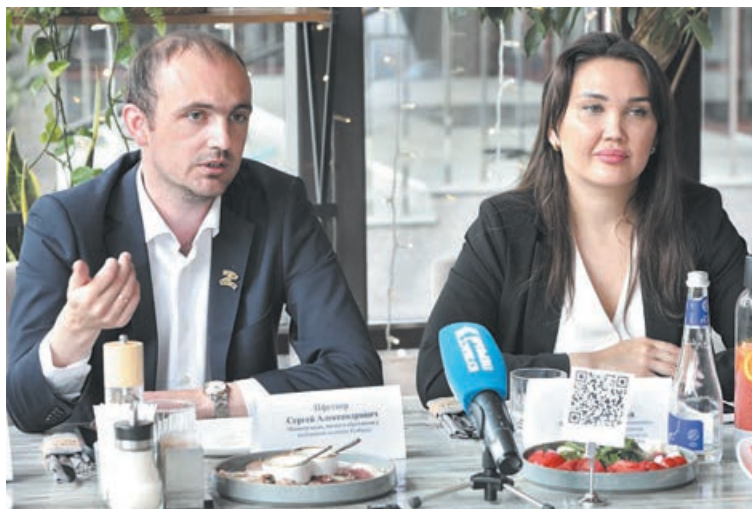
■ Момент пресс-завтрака.

Также министр добавил, что в Кузбассе на сегодняшний день проживает порядка 700 тысяч человек в возрасте от 14 до 35 лет. Задачи конкурса – помочь как можно большему числу молодых людей реализовать свои задумки, определить карьерные перспективы и быть полезными обществу. Важный нюанс: заявки принимаются только от некоммерческих организаций, у которых нет штрафов, задолженностей и прочих «минусов». Все заявки будут тщательно образом проверяться экспертной комиссией.