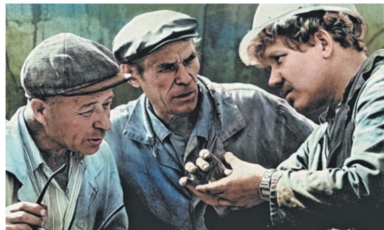
■ Снимок сотрудников Кемеровской ТЭЦ предположительно 1970-х годов нейросеть сделала более чётким, цветным и объёмным.

В сентябре 1955 г. заработала Ново-Кемеровская ТЭЦ. В областном центре эта электростанция – самая молодая и первая по установленной электрической мощности.