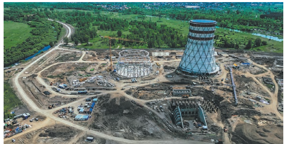
■ Один из важных проектов энергетики Кузбасса сегодня – модернизация Томь-Усинской ГРЭС.