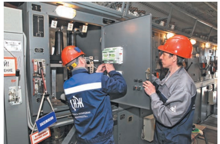
■ Установка вакуумных разъединителей в трансформаторных подстанциях.