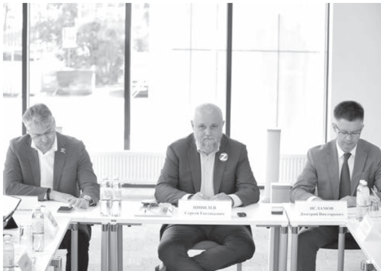
■ Фото пресс-службы АПК.

«Для повышения безопасности ведения угледобычи президентом России даны поручения всем компетентным ведомствам и службам, руководству угольных компаний. Необходимо