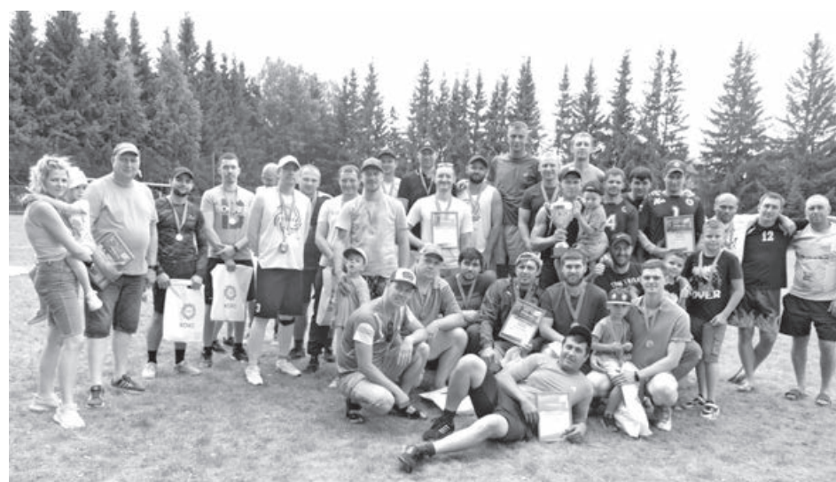
Победители и призёры Кубка металлургов в ПАО «Кокс».

Следующим видом спорта, в котором состязались коксохимики, стал мини-футбол. По итогам игр четвёртое место досталось команде ЦУХПК № 1. В борьбе за бронзу их обыграла сборная заводоуправления. За первое место сразились, как и в прошлом году, самый горячий цех и АГСС. К сожалению, удача опять отвернулась от команды АГСС. Победа на футбольном поле и золотые медали достались коксовому цеху – играли Ан-