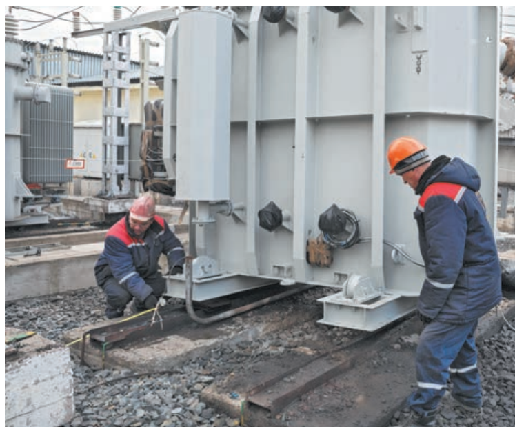
■ Установка нового трансформатора на подстанции «Новая».

«Кемеровская горэлектросеть» работает под управлением СКЭК с 2003 года. Это одно из ведущих предприятий компании. Свою историю начинает с 1936 года. Как и 87 лет назад, предприятие занимается техническим обслуживанием и ремонтом электросетевого хозяйства Кемерово, обеспечивая бесперебойное снабжение жите-