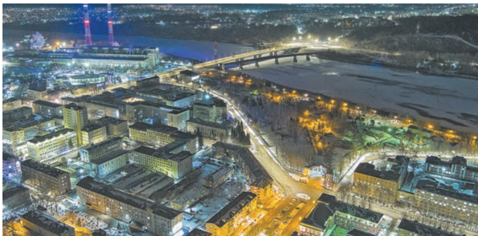
■ Предприятия энергетики – надёжная опора жизни всего региона. И 80 лет назад, и сегодня.