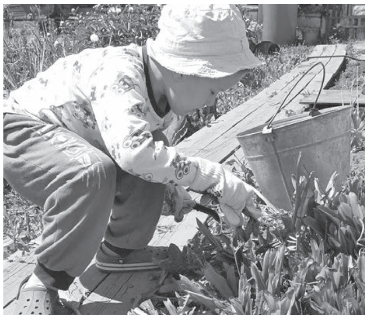
■ Фото автора.

На даче под вашим присмотром разрешайте детям пользоваться простыми садовыми инструментами, а мальчикам – забивать гвозди, пилить, разжигать вместе с вами костёр. Ведь навыки, полученные в детстве, – самые крепкие!