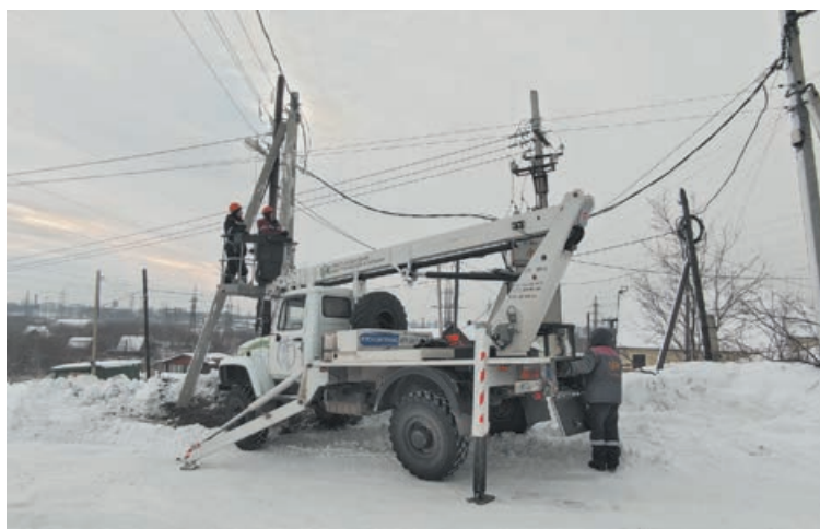
■ Монтаж СИП.

Для надёжного электроснабжения потребителей в цен-