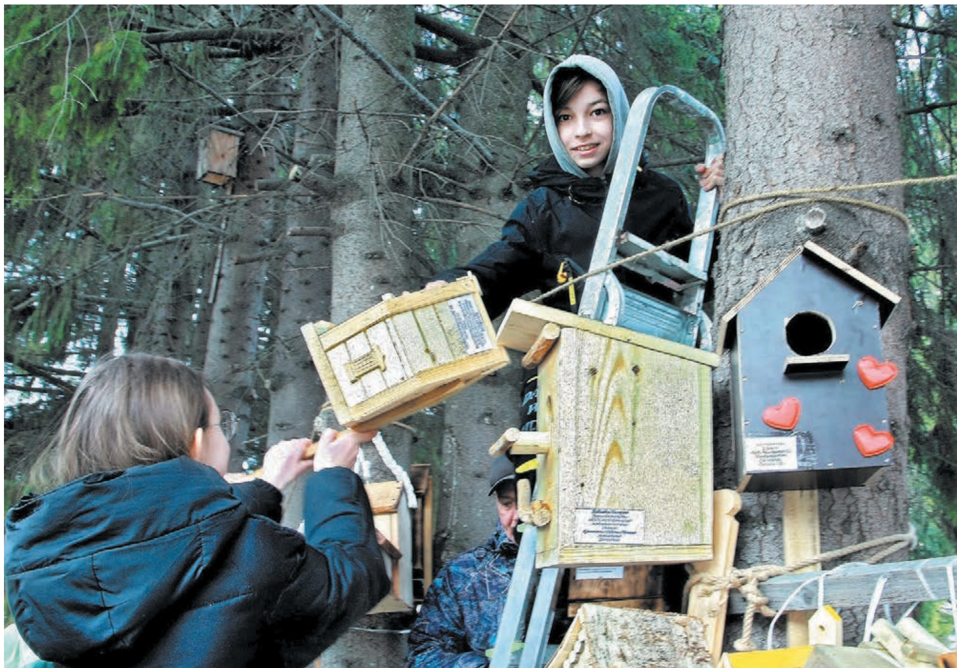
■ Фото Федора Баранова.