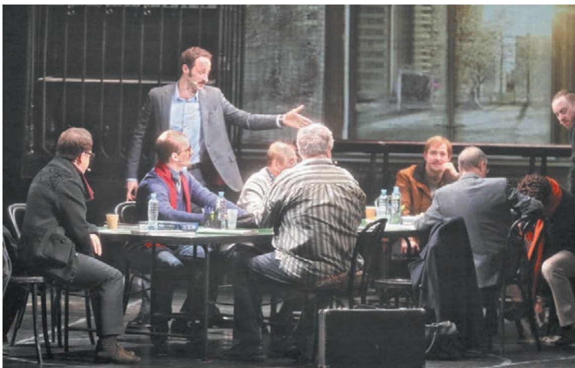
■ Фото Максима Киселева.

В финале, когда чеченского подростка выпускают из «зала суда», его, растерянного и дрожащего, встречает герой Никиты Михалкова. Он и забирает мальчишку к себе. И случается очень неожиданный поворот – финальный чеченский танец, который исполнили юные танцоры, включая подсудимого Умара. И этот танец вызвал шквал эмоций у зрителей – это был и восторг, и удивление, и радость, и слёзы! Танец-свобода, танец-победа, танец-жизнь.