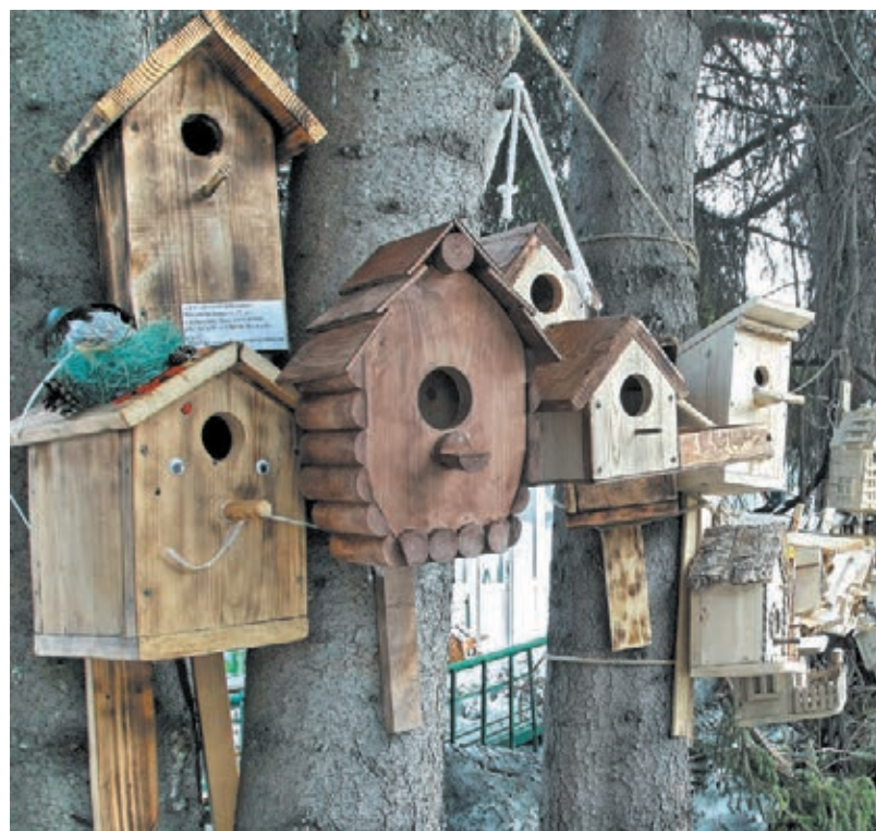
■ Фото Федора Баранова.