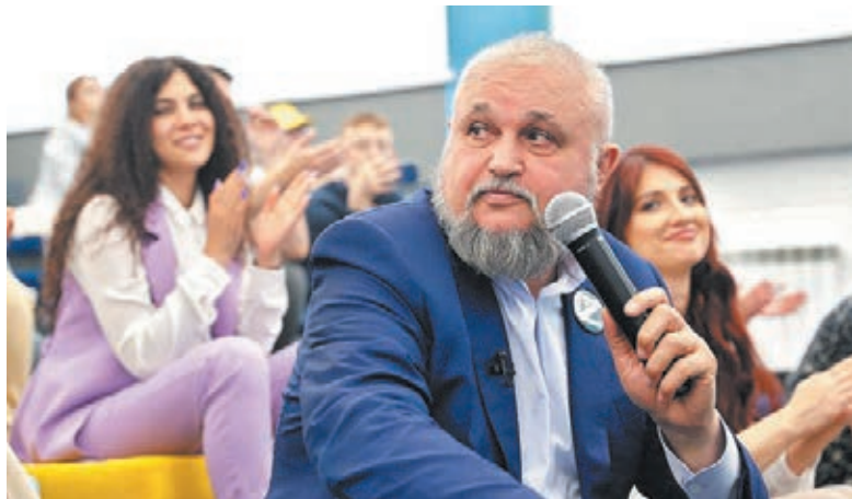
Губернатор часто встречается со студентами и отвечает на их вопросы, в том числе о востребованности молодых профессионалов.

Основная группа участников чемпионата «Профессионалы» – студенты профессиональных образовательных организаций. Они будут соревноваться в 95 компетенциях, среди которых: электро-