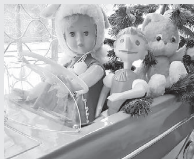
Полосу подготовила Анна Тимошук.

В экспозиции – игрушки советской эпохи с 1950-х до начала 1990-х. Посетители могут поближе разглядеть образцы ивановских пресс-опилочных кукол, кукол производства Ленинградской фабрики («Ленигрушка»), производства ГДР и колясок для них, неваляшек, медведей (в том числе опилочных), героев мультфильмов, настольные игры, игровую приставку «Денди» и даже детский транспорт – педальные «Москвич» и трактор. Отдельный фрагмент экспозиции посвящён местному производству – Кузнецкой фабрике игрушек, производящей известные всей стране куклы и сувениры с 1953 по 1994 год. Здесь представлены пресс-опилочный Дед Мороз, «боди» (мягкие игрушки с пластмассовым лицом и ручками) и другие. Выставка будет работать в Обер-офицерском доме до 1 мая.