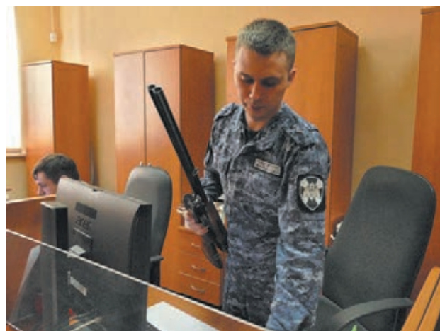
Сотрудники лицензионно-разрешительной работы Росгвардии ведут приём владельцев оружия в Кемерове.

В прошлом году от жителей Кузбасса в рамках проводимой профилактической операции «Оружие» было принято 126 единиц самых разных