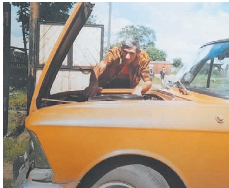
■ Владимир Набоков знает о машинах всё.