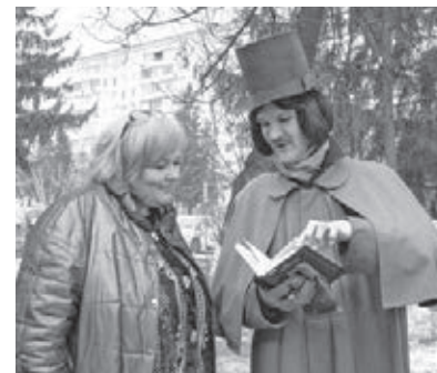
■ Фото предоставлено библиотекой.

Муниципальная информационно-библиотечная система города Кемерово 1 апреля с 12.00 до 14.00 приглашает горожан на яркий праздник – фестиваль «Загадочный Гоголь». Он традиционно пройдёт в библиотеке им. Н.В. Гоголя на пр. Ленина, 135.