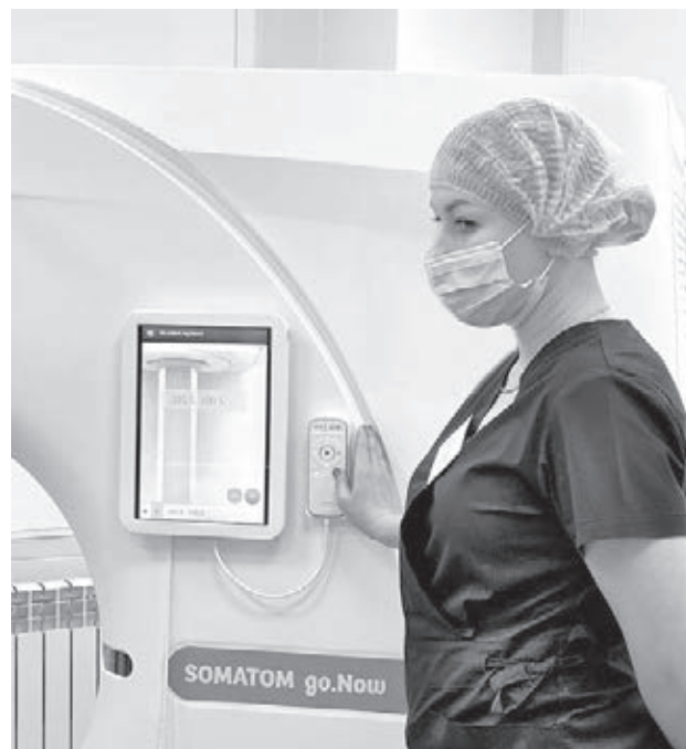
■ Фото пресс-службы Минздрава Кузбасса.

– фактором риска считается также детский или пожилой возраст, так как иммунитет у детей и пожилых обычно слабее, чем у взрослых.