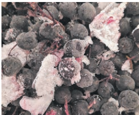
■ Фото Алены Смирновой.

Присылайте рецепты и снимки на электронный адрес: alena-fedotova@yandex.ru с пометкой «С огорода на кухню». Или по почте: 650991, Кемеровская обл., г. Кемерово, пр-т Октябрьский, д. 28, редакция газеты «Кузбасс», кабинет 403. Не забудьте указать свой населённый пункт, а также контактный телефон, чтобы в случае победы журналист мог связаться с вами.