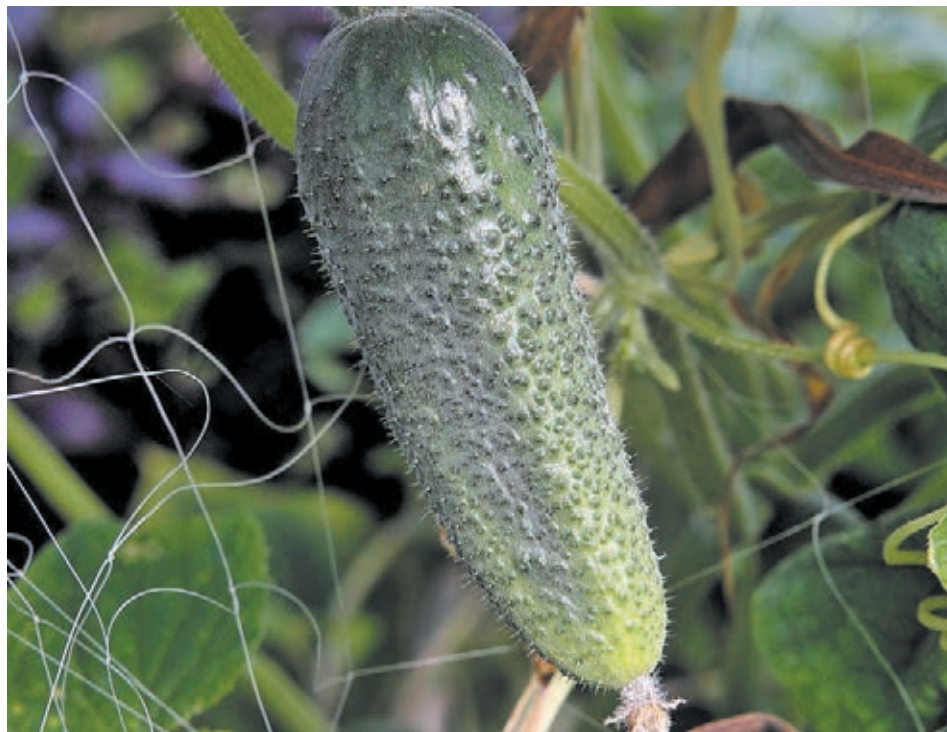
■ Хрустящее настроение.

«Далее подушку сена засыпаем землёй и засеваем посадочным материа-