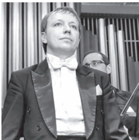
■ Фото предоставлено филармонией Кузбасса.