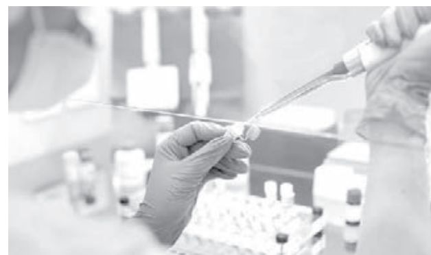
■ Фото предоставлено КемГМУ Минздрава России.

– Натуральный сок получают прессованием хвойной древесной зелени под определённым давлением. Это происходит с помощью пресса непрерывного действия или с использованием коллоидной мельницы. В составе конечных продуктов все полезные вещества сохраняются именно в том виде, в котором они находятся в живой пихтовой клетке. Благодаря обширному составу биологически активных веществ данные продукты позволяют активировать дыхание тканей, нормализовать процессы обмена веществ, улучшить трофику тканей, предотвратить усиленное накопление в тканях и клеточных структурах организма перекисей и свободных радикалов. Присутствующие в составе клеточного сока флавоноиды предотвращают накопление токсичных перекисных