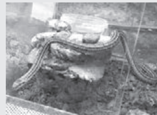
■ Узорчатый полоз.