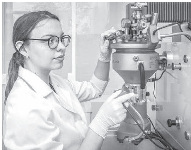
■ Фото из архива КемГУ.