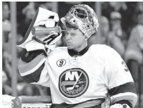
■ Олимпийский чемпион-2018 Илья Сорокин впервые назван в числе участников Матча звёзд НХЛ.

Капитан «Айлендерс» Андерс Ли считает нашего 27-летнего земляка лучшим