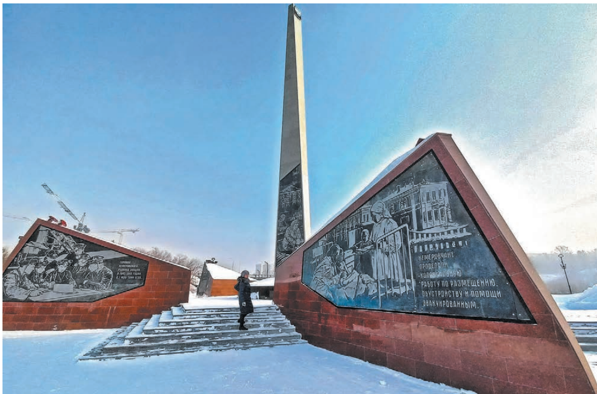
■ Фото Фёдора Баранова.