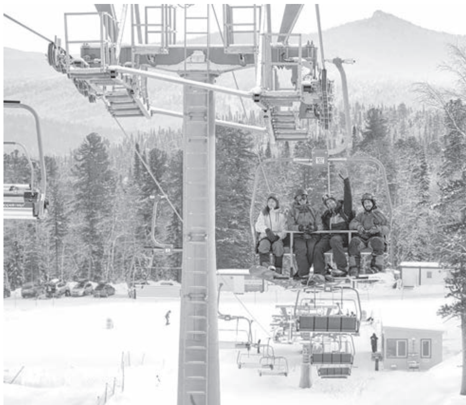
■ Фото дирекции СТК Шерегеш.

Несомненно, гостей привлекают различные зимние мероприятия и активности, которые регулярно проходят на курорте. Так, 11 февраля будут отмечать 42-й день рождения «Шерегеша», с 23 февраля по 5 марта будут проходить II Международные спортивные игры «Дети Азии» – Шерегеш примет соревнования по волейболу на снегу. Также в этом горнолыжном сезоне гости смогут побывать на финале чемпионата России по снежному волейболу 2 апреля, приехать на традиционные масленичные гулянья.