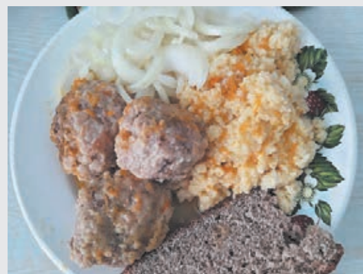
■ Фото Алены Смирновой.

Рецепты блюд принимаются разные: это могут быть и солёности, и запечённости, и копчёности, и варёности, и сладости, – словом, не смеем ограничивать ваши кулинарные таланты. И другой важный момент: не забудьте приложить к рецепту снимок приготовленной вкуснятины.