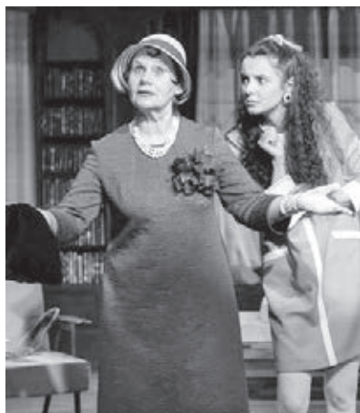
■ Сцена из спектакля «8 любящих женщин».

Благодаря этому у прокопьевского Ленкома появилась возможность совершенствовать свой сценический опыт, выезжая на гастроли не только в соседние, но и в