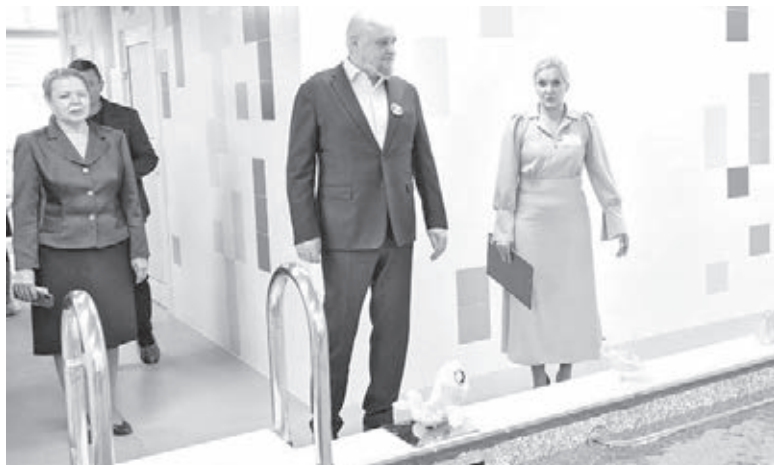
■ Фото пресс-службы АПК.

«Мы последовательно выполняем поручение президента по обеспечению детей Кузбасса местами в дошкольных учреждениях. Создаём необходимые условия для воспитания и развития наших ребят. С открытием детского сада в Центральном районе очередность детей в возрасте от 1 года до 3 лет будет ликвидирована полностью. Здесь оборудованы просторные группы и спальные помещения, многофункциональные залы, установлено современное оборудова-