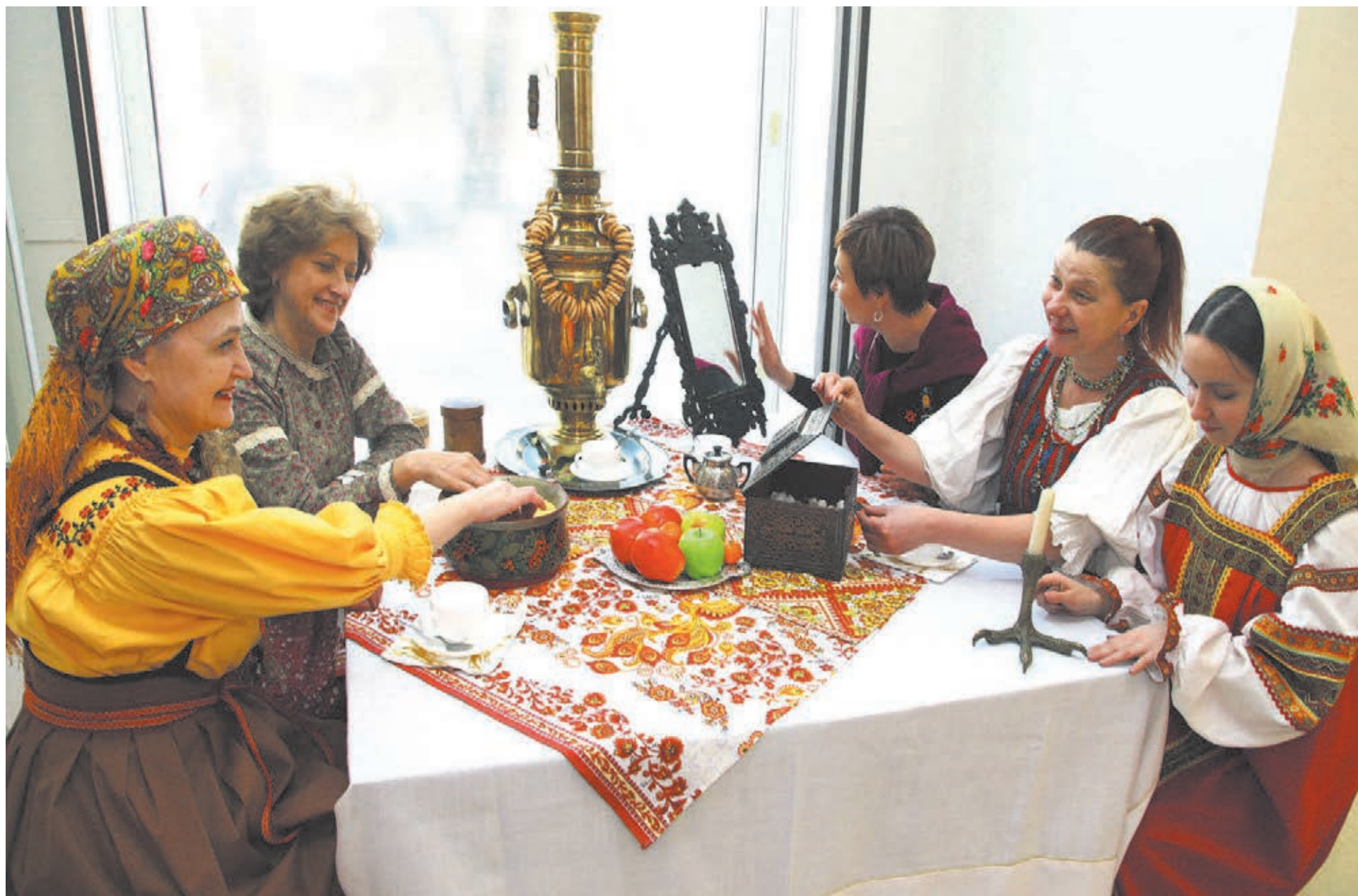
■ Фото Федора Баранова.