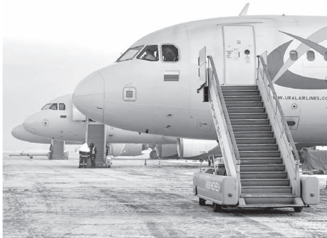
■ Фото предоставлено пресс-службой Международного аэропорта Новокузнецк.