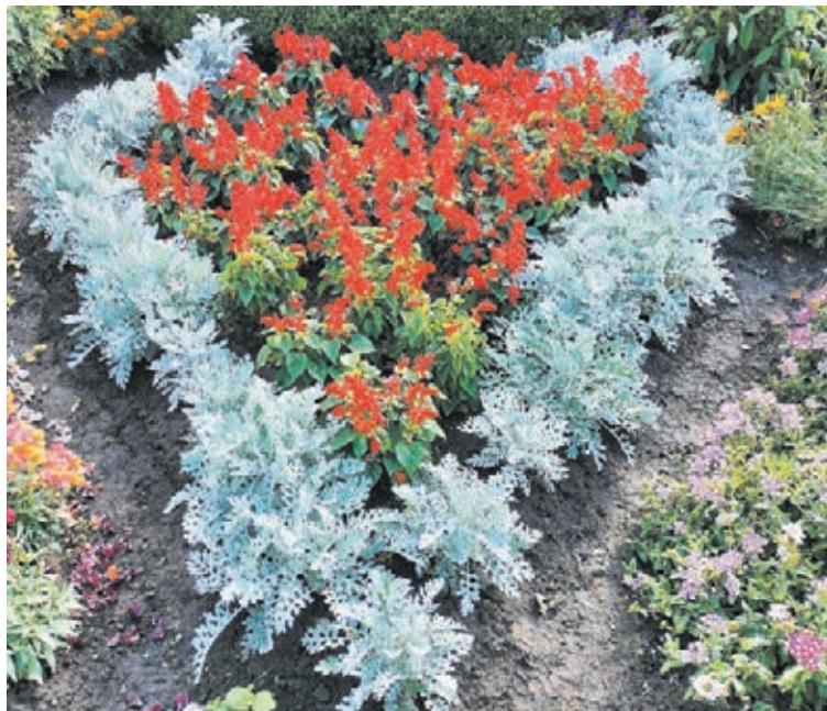
■ Из цветов получается много потрясающих композиций.

Кроме того, у Татьяны благодаря новой земле появилось и новое увлечение: садовод-любитель стала размножать декоративные кустарники методом зелёного черенкования. «В летние месяцы