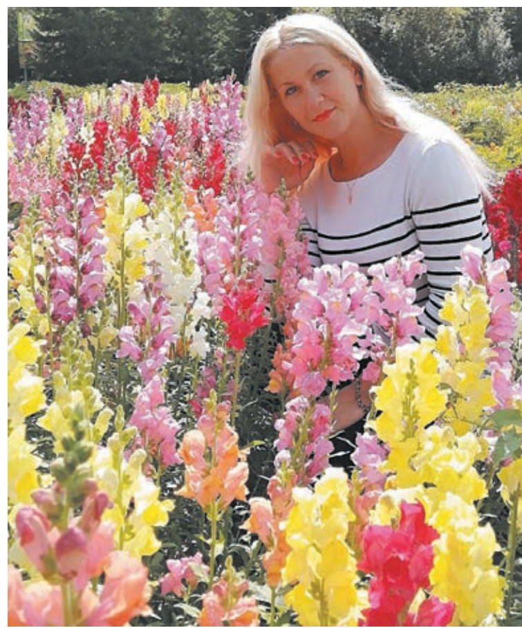
■ Цветочное море смотрится эффектно на любом участке.

«Мои прежние интересы самым непосредственным образом применяются и на новом месте работы, – добавила она. – Сейчас мы с ребятами мечтаем принять участие в чемпионате «Абилимпикс» в компетенции «Флористика». Тренд данного направления – экостиль, который воплощает связь человека с природой. А это значит, что приветствуется большое количество цветов широкой палитры оттенков, в том числе дикоросов, и минимальная упаковка. Примечательно, что в дан-