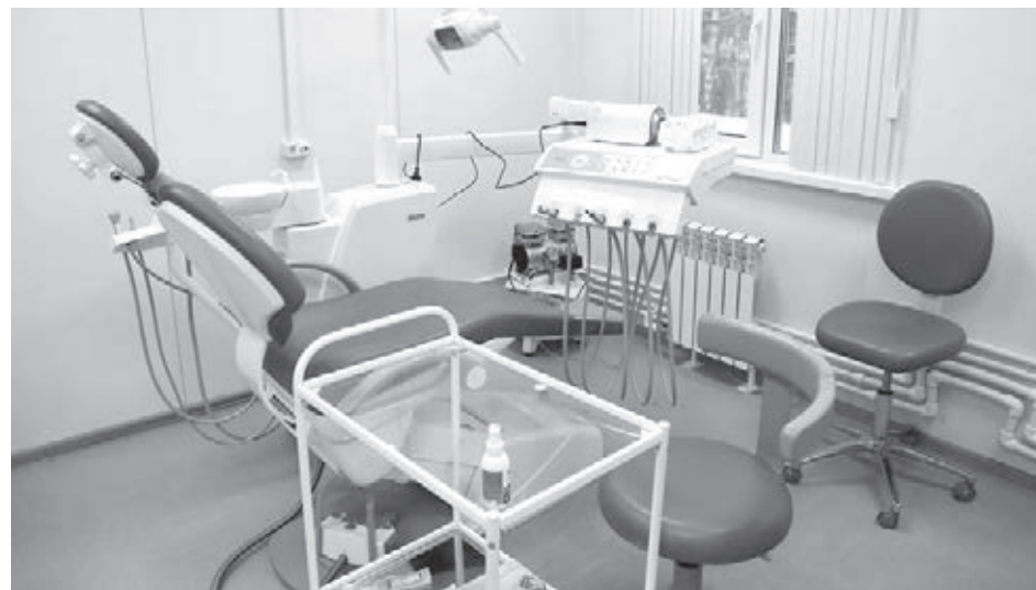
■ Особенно жителей Барановки обрадовал новый стоматологический кабинет.