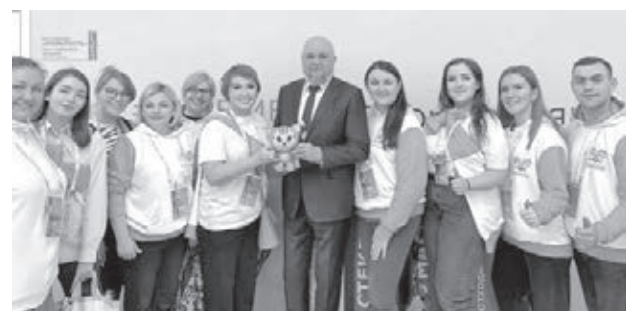
■ Фото Дирекции «Дети Азии-2023».