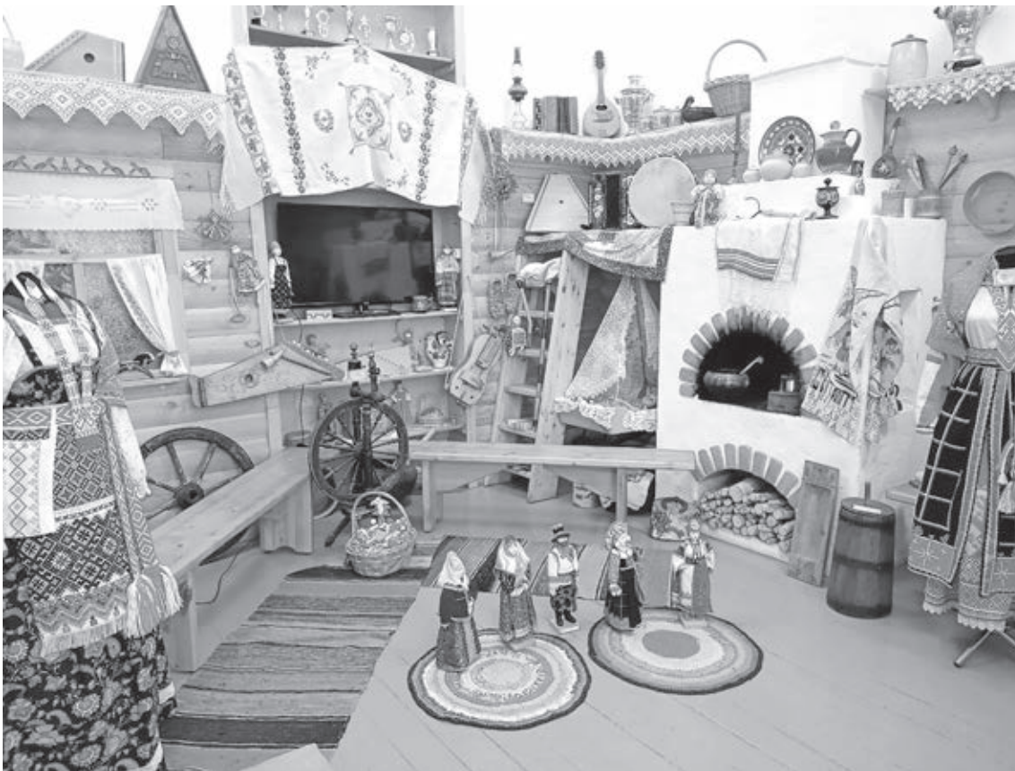
■ У каждого экспоната есть своя удивительная история.