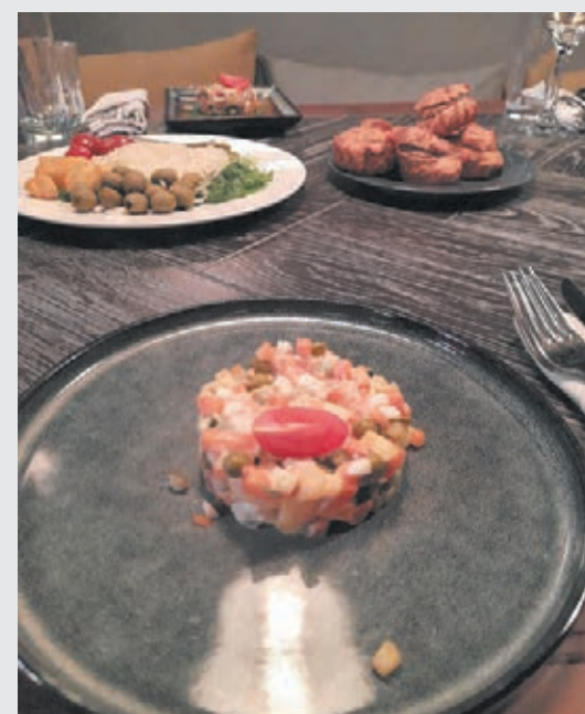
■ На конкурс принимаются рецепты самых разнообразных блюд.

Сроки проведения конкурса: с 12 января по 31 марта 2023 года. Итоги подведём в начале апреля. Имена и фамилии победителей будут размещены в газете. Для вручения наград триумфаторов пригласим в редакцию или отправим подарки по почте. С нетерпением ждём рецептов ваших кулинарных шедевров!