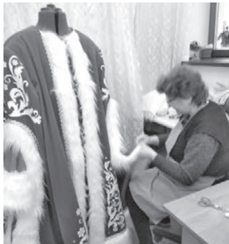
■ В театре готовятся не только к премьере, но и к представлению с Дедушкой Морозом в фойе.

– Например, спектакль «Путешествие Нильса с дикими гусями» по сказочной повести С. Лагерлёф. Когда мы над ним работали, никто и не думал о каких-то фестивалях. Просто сочиняли спектакль, в котором было много театрального хулиганства, живой театральной игры. Думали о том, чтобы не было мёрт-