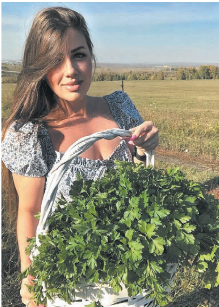
■ Фото из личного архива Анастасии Никольской.

Кстати, широкое применение на участке Анастасии нашли органические удобрения. «В нынешнем сезоне тестировала добавку «ЦИОН», – уточнила блогер. – Стоит она недёшево,