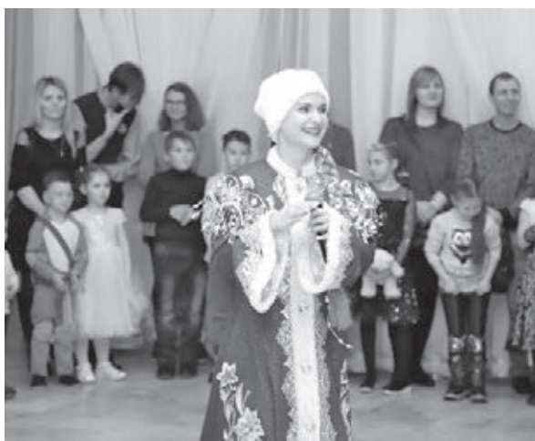
Новогодние программы в театрах - это всегда хоровод у ёлки и Дед Мороз.

25 декабря здесь же – новогоднее представление «История Герды». Эта волшебная зимняя картина создана по мотивам сказки Г.Х. Андерсена «Снежная