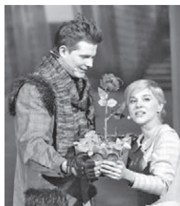
Сцена из постановки музыкального театра «История Герды».

С 19 по 29 декабря Государственная научная библиотека