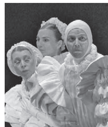
«Квест под Рождество» покажут в филармонии.

Кузбасса им. В.Д. Фёдорова покажет новогодний детский спектакль «Кто-нибудь видел кролика?». Это предновогодняя история о том, как Тигрица и Кошечка потеряли кролика, без которого начало Нового года просто невозможно. Как они выйдут из этой ситуации? Об этом можно узнать, если прийти в библиотеку на сказочное событие. Весёлые игры, новогодняя сказка и встреча с Дедом Морозом и Снегурочкой – большие новогодние программы будут проходить в Фёдоровском зале библиотеки с понедельника по пятницу в 11.00, 14.00 и 16.00.