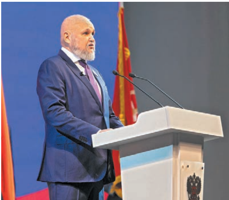
■ В бюджетном послании губернатор Сергей Цивилев обозначил важность вопроса газификации.

Как сообщил заместитель председателя правительства Кузбасса – министр промышленности Кузбасса Леонид Старосвет, в регионе отсутствуют свободные мощности для предоставления газа крупным потенциальным потребителям и инвесторам. Необходимое суммарное увели-