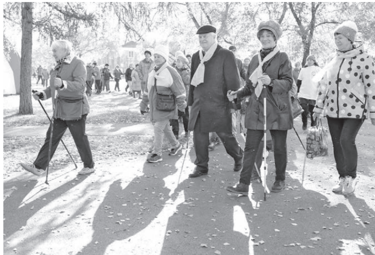
ПРИЯТНАЯ И ПОЛЕЗНАЯ ПРОГУЛКА. В регионах страны и в Кузбассе отмечают Всемирный день ходьбы. Жители областного центра вчера присоединились к всероссийской акции «10 тысяч шагов к жизни». У Дворца молодёжи собрались любители физкультуры и спорта, которые вместе сделали зарядку и совершили пешую прогулку. На мероприятии можно было получить консультации специалистов по вопросам ЗОЖ и ГТО.