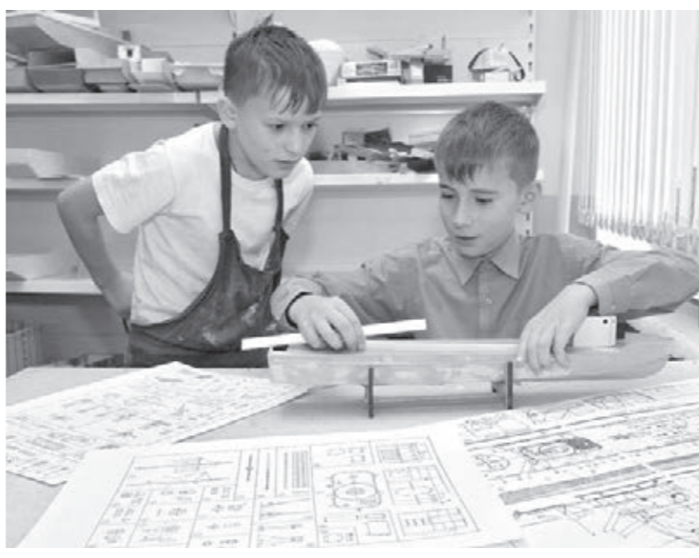
Создание модели судна, как военного, так и гражданского, предшествует изучению его истории.

Пожалуй, и обобщить излишне, что успех всякой студии или творческого объединения напрямую зави-