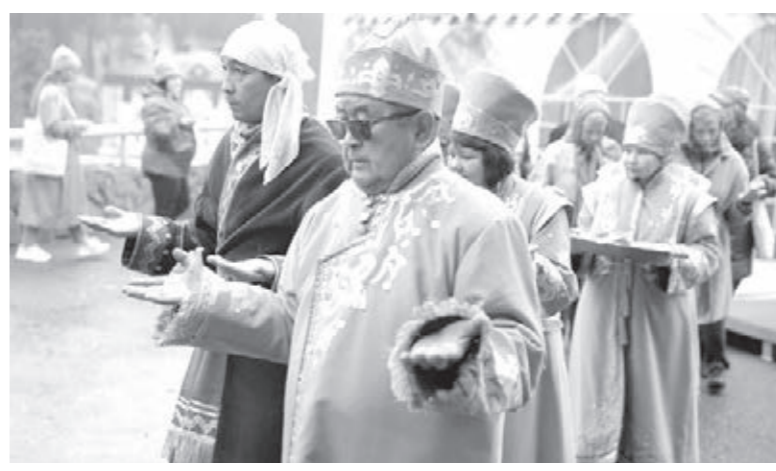
Без шорских национальных обрядов никакой конгресс нельзя начинать!

«За последние 5 лет интерес к курорту сильно вырос, и текущих мест размещения уже не хватает. Есть необходимость в появлении