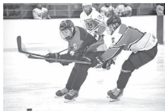
В последние Трудармейский состоялся международный турнир по хоккею с шайбой.

нашего региона Анастасия Кривошея положительно оценила выступления подопечных: – Ребята показали себя до-