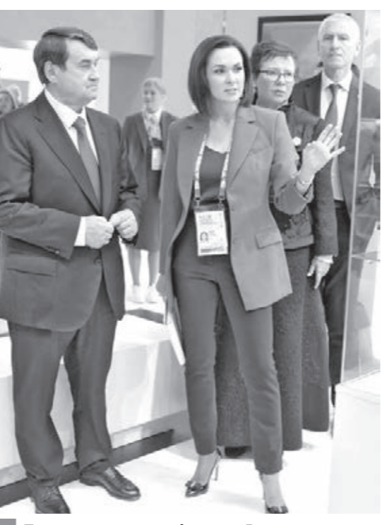
Почётными гостями форума «Россия – спортивная держава» стали помощник президента РФ Игорь Левитин и министр спорта Олег Матыцин.