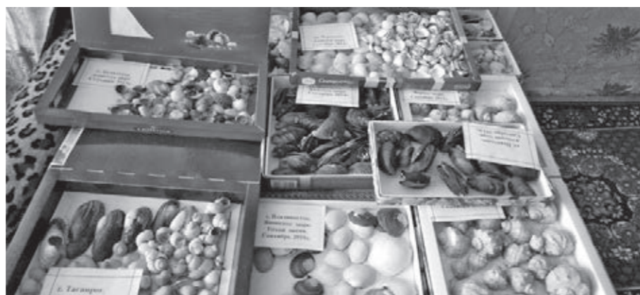
Она собрала в морях, океанах мира 2407 ракушек. И в ее коллекции – ни одной одинаковой!