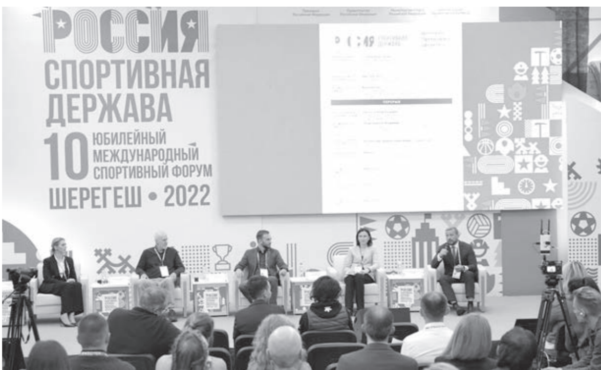
На обсуждение всесезонной работы курортов в Шерегеше собрались эксперты со всей России.

Все инфраструктурные объекты расположены вблизи действующих подъёмников «Sky Way» и «Панорама», что обеспечит доступ резиден-