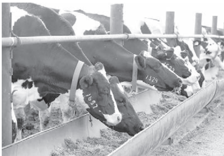
■ Фото пресс-службы АПК.

На данный момент Кузбасс обеспечен молоком собственного производства на 50%. Дефицит дополняется ввозом молочных продуктов из других областей. Средняя молочная продуктивность в сельхозорганизациях продолжает расти и приближается к 6000 кг на одну корову. Для повышения эффективности предприятиям требуется улучшение условий действующих и строительство новых ферм. Мероприятия программы направлены на обеспечение условий для повышения производства молока, создание условий для реализации инве-