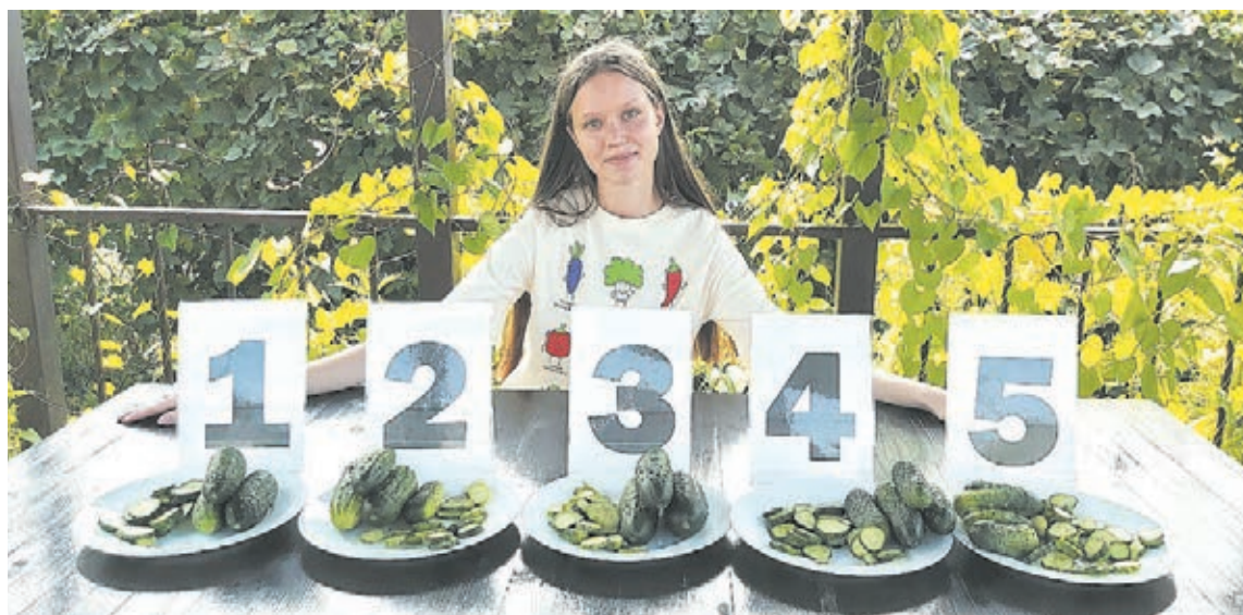
Ребята довольны результатами проделанной работы.