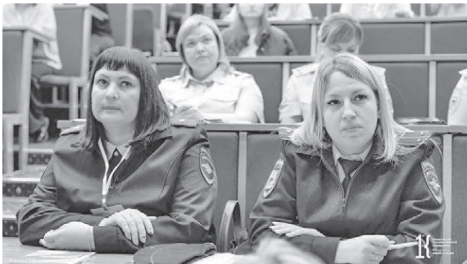
■ Фото Первичной профсоюзной организации студентов КемГУ.