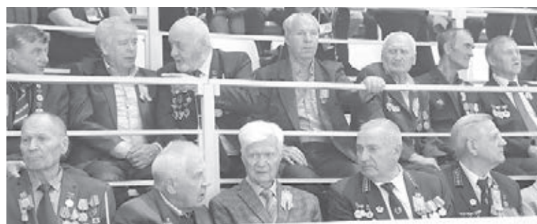
■ Фото автора.