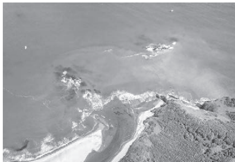
■ Камчатка, у Старичкова острова. Недавно орловские и камчатские дайверы обследовали место, заявив, что здесь погиб корабль «Юнона».

– Есть версия, что «Юнона» попала у Камчатки в цунами. Но подтвердить или опровергнуть её некому. «Юнона» была в месте безлюдном... – поясняет Ермолаев.