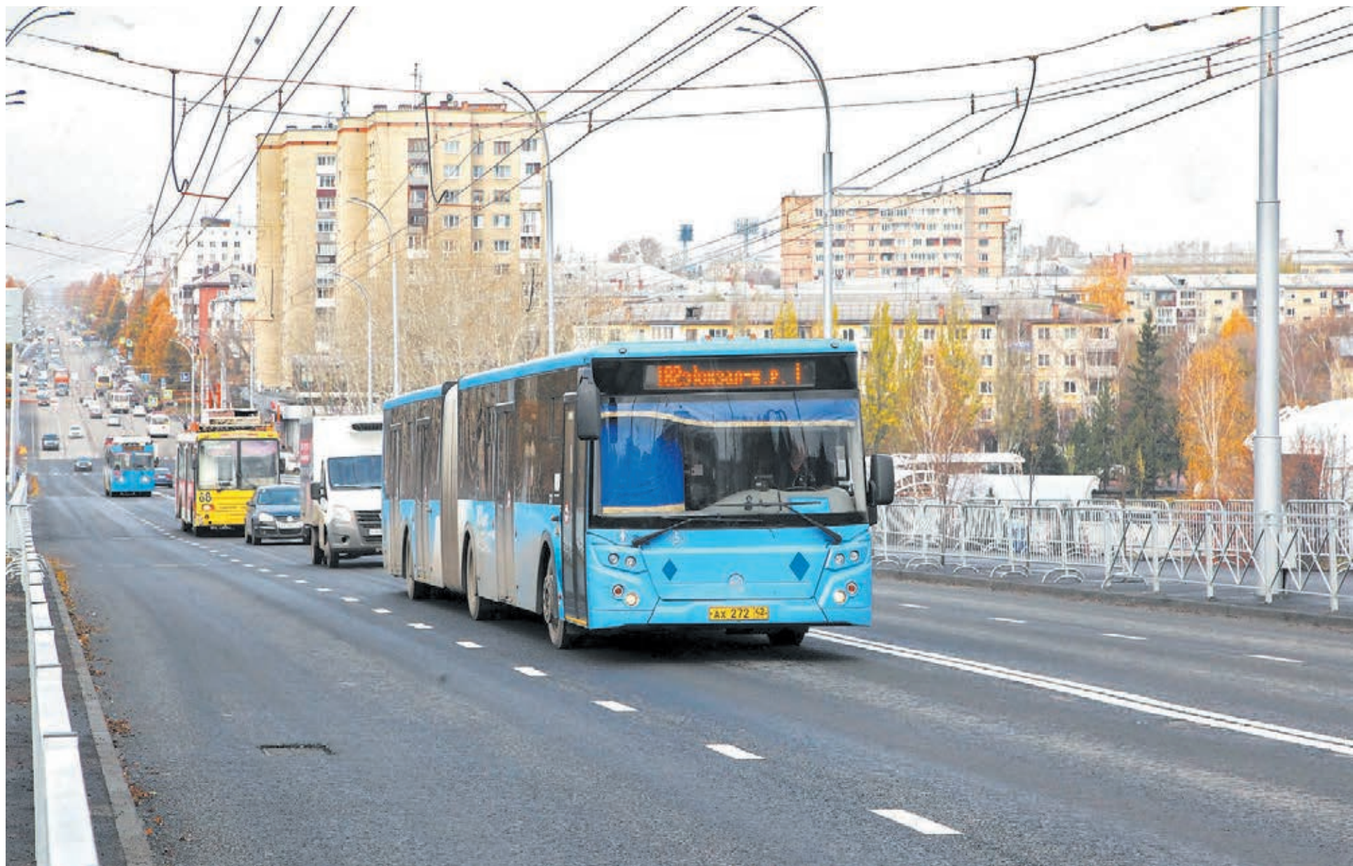
■ Открывшийся после ремонта Красноармейский мост.