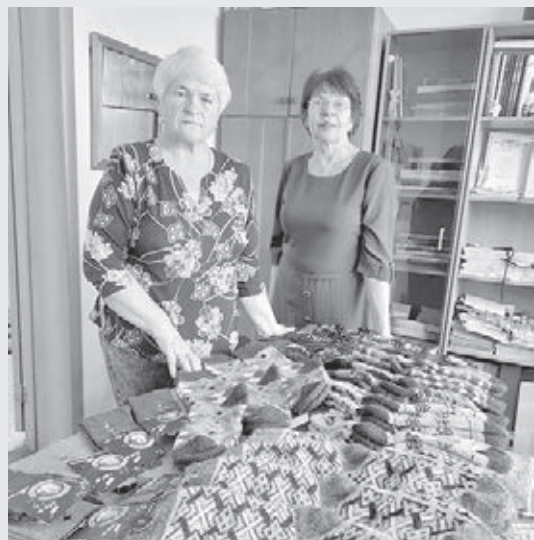
■ Фото совета ветеранов.

ЖЕНЩИНЫ КУЗБАССА ВЯЖУТ НОСКИ, РУКАВИЦЫ, ПЕРЧАТКИ, ШАРФЫ; ШЬЮТ УТЕПЛЁННЫЕ БАЛАКЛАВЫ, ТОЛСТОВКИ ДЛЯ МОБИЛИЗОВАННЫХ БОЙЦОВ, КОТОРЫЕ ОТПРАВИЛИСЬ В ЗОНУ СПЕЦИАЛЬНОЙ ВОЕННОЙ ОПЕРАЦИИ.