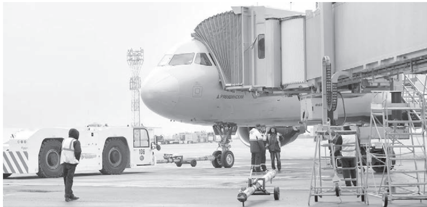
■ 2023 году финансирование программ субсидирования региональных авиаперевозок вырастет более чем в два раза – до 300 миллионов рублей. Это позволит увеличить число регулярных рейсов из аэропортов Кемерова и Новокузнецка.

местится в комплексе «Velka» в «Шерегеше». Пассажиры, прилетающие на юг Кузбасса, смогут получить свой багаж непосредственно на курорте.