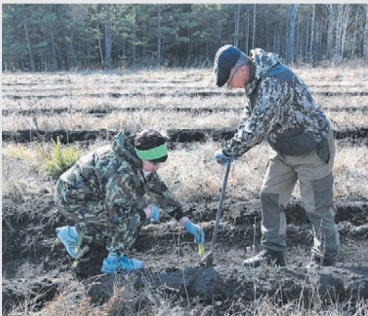
■ Фото с сайта пресс-службы АПК.