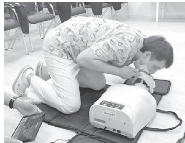
■ Фото из архива КемГМУ.