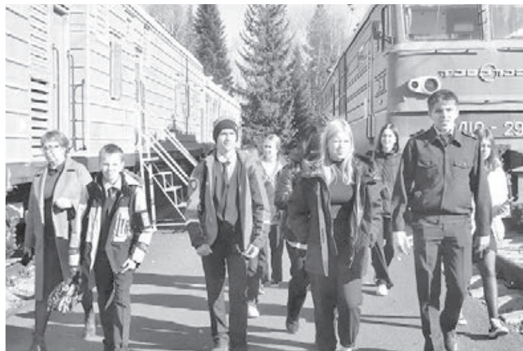
■ Фото Тайгинского института железнодорожного транспорта.