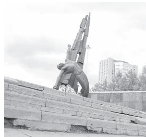
■ Фото пресс-службы АПК.