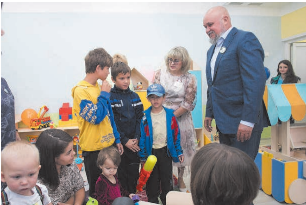
■ Фото Сергея Гавриленко.