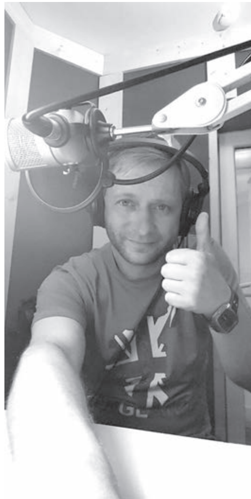
■ Фото со странички Вячеслава Щенина «ВКонтакте».