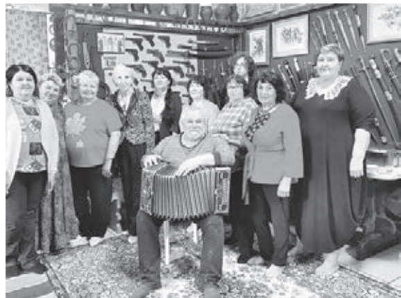
■ Фото совета ветеранов.