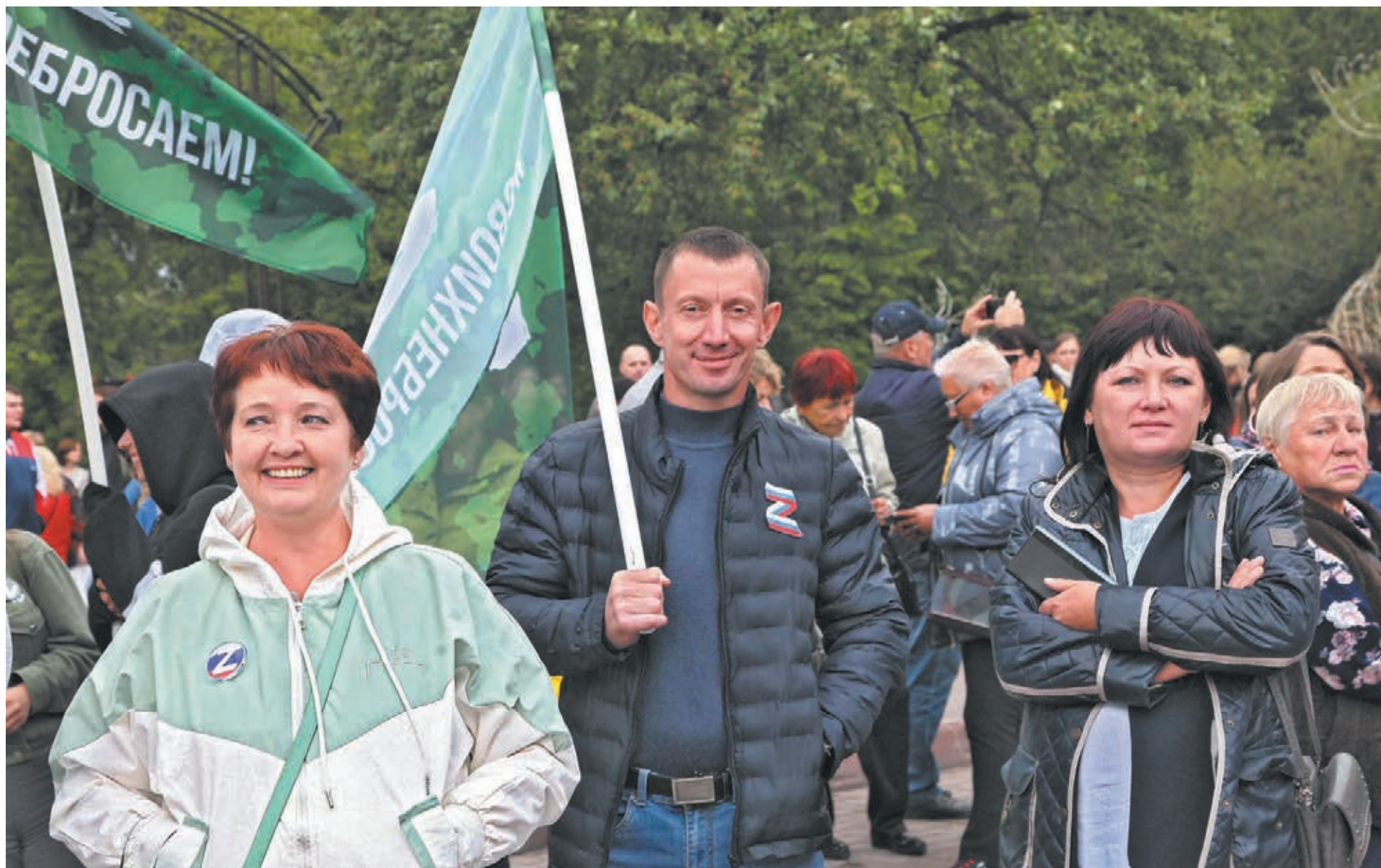
■ Митинг-концерт в Кемерове.