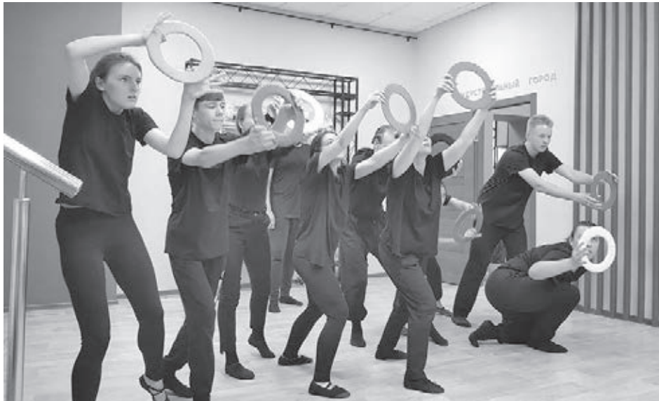
■ Момент репетиции.

Между тем с начала июня в Кемерове работает театральная лаборатория KUZBASSING. Её участники – обыкновенные горожане, создающие спектакли о городской истории. Результатом лаборатории станет фестиваль, который пройдёт уже в грядущие выходные в Кемерове на двух площадках: в парке «Антошка» и горсаду. Как отметила Ярослава, идея фестиваля родилась во время изучения истории города, когда коллектив делал спектакль «Красная горка». Тогда труппа узнала о существовании слова kuzbassing – в АИК «Кузбасс» приезжали иностранные специалисты, работать в сибирском городе им было непросто.