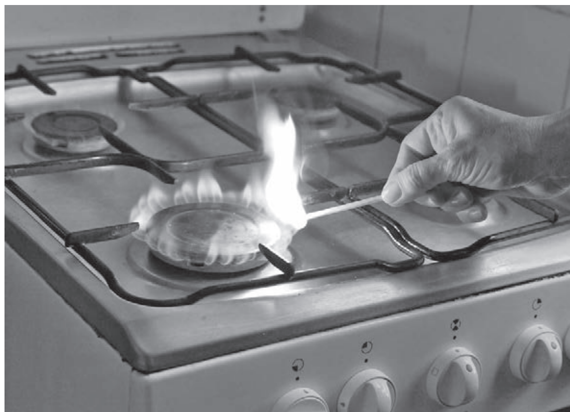
■ Подать заявку на газификацию можно на портале госуслуг, на сайтах газораспределительных организаций, а также в МФЦ.

» «КУЗБАСС – СТРАТЕГИЧЕСКИЙ РЕГИОН. У НАС ДЕЙСТВУЮТ ЧЕТЫРЕ ТЕРРИТОРИИ С ОСОБЫМ НАЛОГОВЫМ РЕЖИМОМ – ЭТО ТОСЭР. ПРИ ГАЗИФИКАЦИИ РЕГИОНА ДОЛЖНЫ БЫТЬ УЧТЕНЫ ВСЕ ИХ ПОТРЕБНОСТИ, НАША ЗАДАЧА – ОБЕСПЕЧИТЬ ПРОЕКТЫ НЕОБХОДИМЫМИ МОЩНОСТЯМИ. РАЗВИТИЕ ЭТИХ ТЕРРИТОРИЙ ПОВЛИЯЕТ НА СИБИРЬ И ДАЛЬНИЙ ВОСТОК. КРОМЕ ТОГО, НУЖНО УЧИТЫВАТЬ НЕОБХОДИМОСТЬ ДАЛЬНЕЙШЕЙ ГАЗИФИКАЦИИ НАСЕЛЁННЫХ ПУНКТОВ», – ГУБЕРНАТОР КУЗБАССА СЕРГЕЙ ЦИВИЛЕВ.