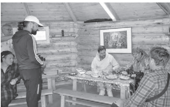
■ Фото с сайта Министерства культуры и национальной политики Кузбасса.