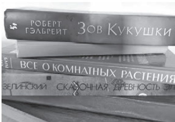
■ Фото Анны Тимошук.

В эту субботу, 20 августа, в государственной научной библиотеке Кузбасса им. Фёдорова впервые пройдёт фестиваль «Swap book». Его тема – «Истоки читающей нации».