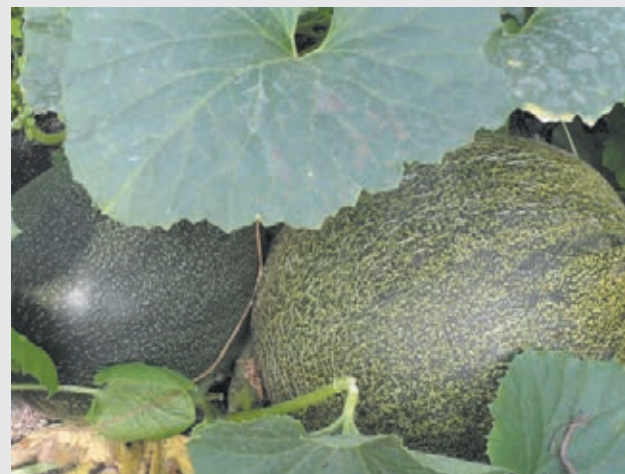
■ Вот такие фото даров садово-огородного сезона прислала на конкурс жительница Промышленновского муниципального округа Людмила Новикова.