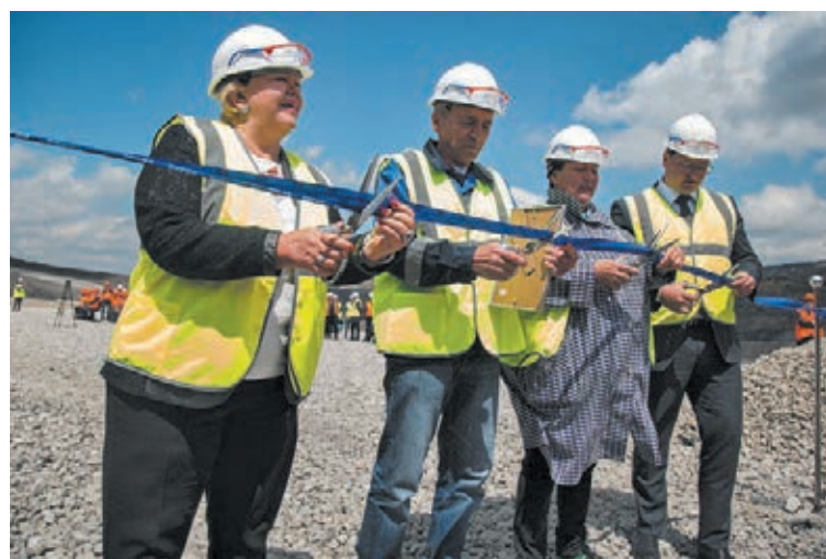
■ Почетными гостями торжественного запуска именного самосвала стали дети легендарного горняка (на фото – в центре).