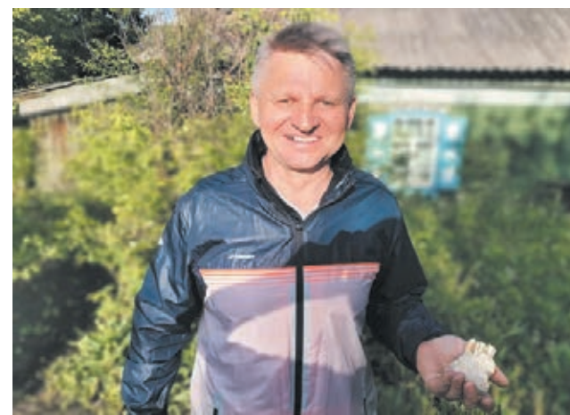
Фото из личного архива Евгения Федосова.