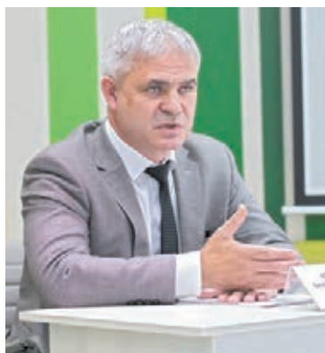
■ Министр сельского хозяйства и перерабатывающей промышленности Кузбасса Андрей Ариткулов.

Ежегодно Кузбасс и так обеспечивает себя этим сельхозтоваром в полном объёме, и даже с избытком. Но в этом году соберут ещё больше. К примеру, на нужды жителей региона требуется в пределах 900 тысяч тонн зерновых. В прошлом году собрали 1 миллион 550 тысяч тонн зерна, в этом году – уже в пределах 1 миллиона 700 тысяч тонн. Это при том, что в рамках реализации федеральной программы обеспечения продовольственной безопасности перед регионом была поставлена задача собрать не менее 1 миллиона 200 тысяч тонн зерна. Соответственно, у кузбасских сельчан есть возможность продавать зерно