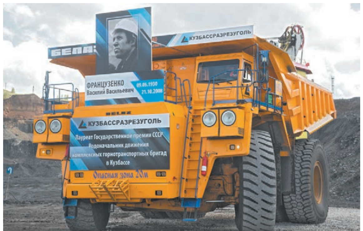
■ На Краснобродском угольном разрезе будет работать именной БЕЛАЗ «Василий Французенко».