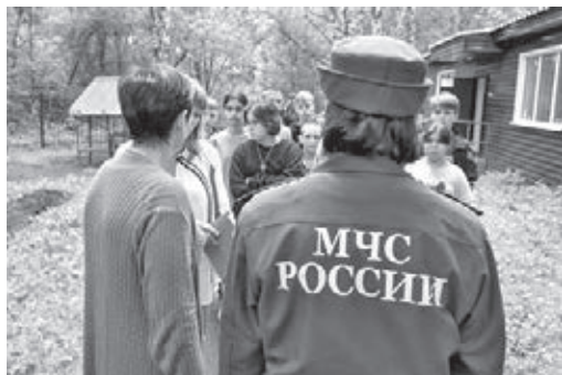
■ Фото предоставлено ГУ МЧС России по Кемеровской области.

– Профилактическая работа в области пожар-