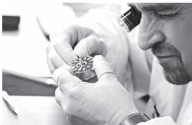
■ Фото пресс-службы ЦБРФ по Кузбассу.

В 2021 году Банк России провёл исследование тенденций на рынке ломбардов. Выяснилось, что каждый третий ломбард сталкивался с недобросовестной конку-