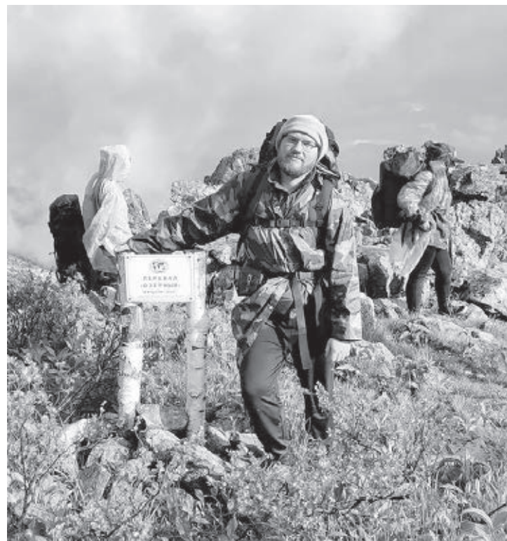
■ Фото из личного архива Михаила Игнаткова.