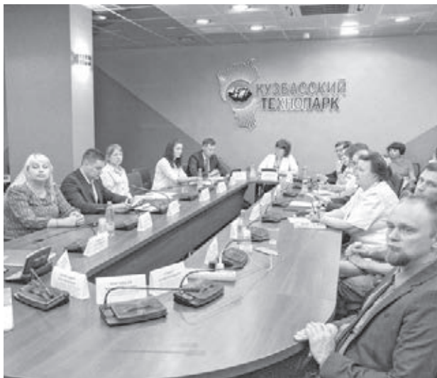
Участники круглого стола на экологическом форуме.

– Я – молодой специалист, пришла работать в ПАО «Кокс» лаборантом в экоаналитическую лабораторию ПАО «Кокс». Мой муж тоже работает на заводе. Лабо-