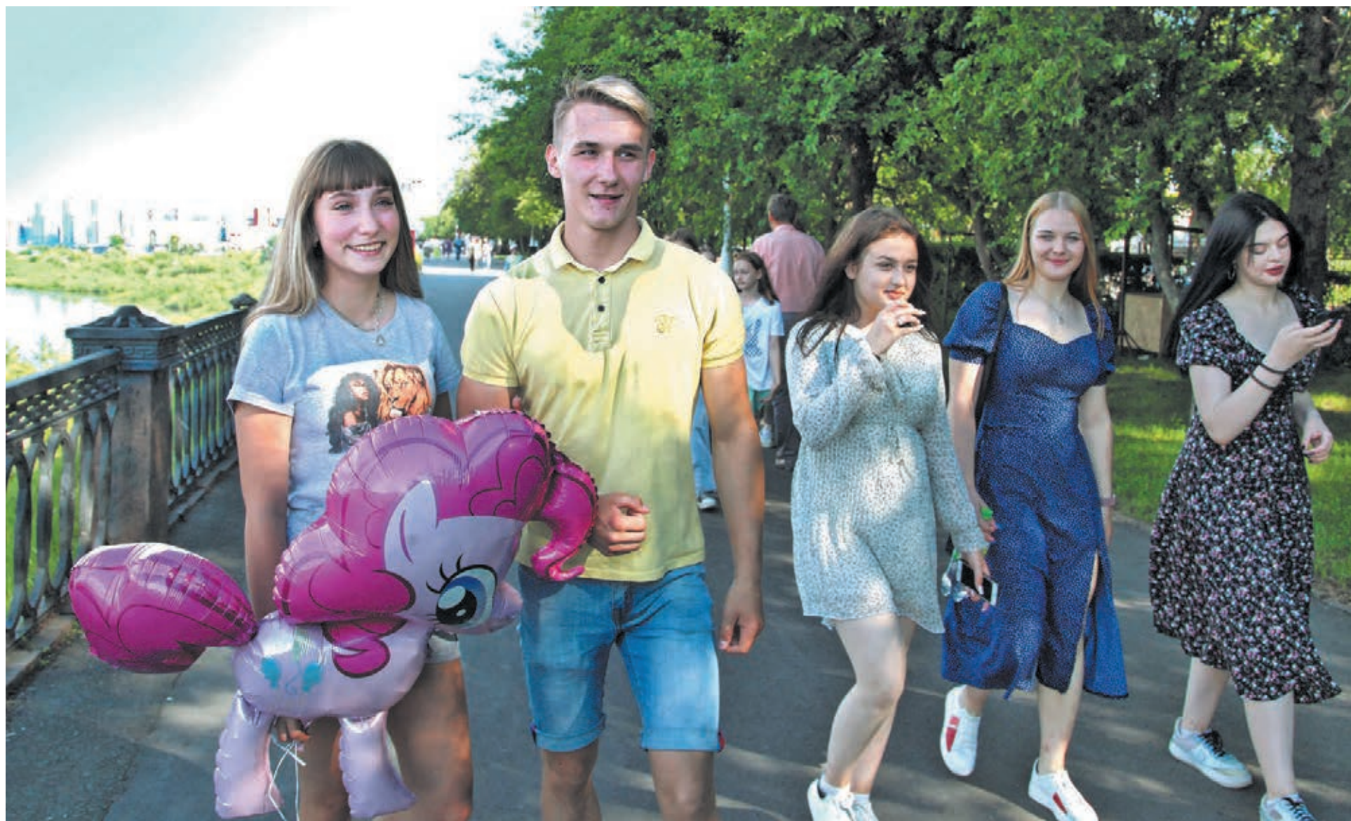
■ Фото Федора Баранова.