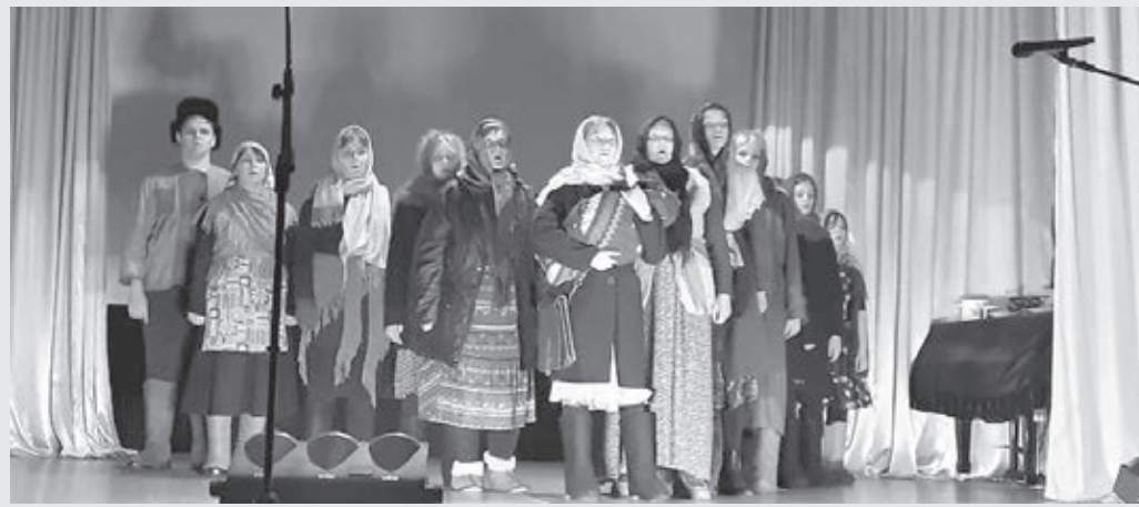
■ Спектакль о блокадном Ленинграде в клубе села Атаманово.

Самодеятельные артисты из клуба села Степного представили спектакль о блокадном Ленинграде, который растрогал до слёз. Продолжилось мероприятие в фойе, где были накрыты столы. Ветераны пели песни военных лет, читали стихи,