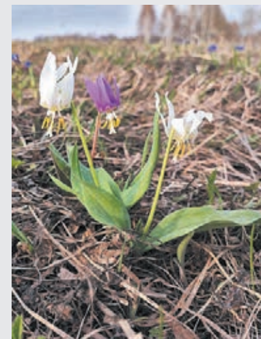
■ Нектаром кандыка активно и с удовольствием лакомятся различные насекомые, даже божьи коровки, которые обычно поедают тлю.

«Ботаники подтвердили, что это довольно редкие альбиносные формы кандыка», – подчеркнул Дмитрий Сущёв.