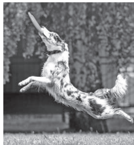
■ Фото Анны Жидковой.

бордер-колли, бельгийские овчарки маинуа.