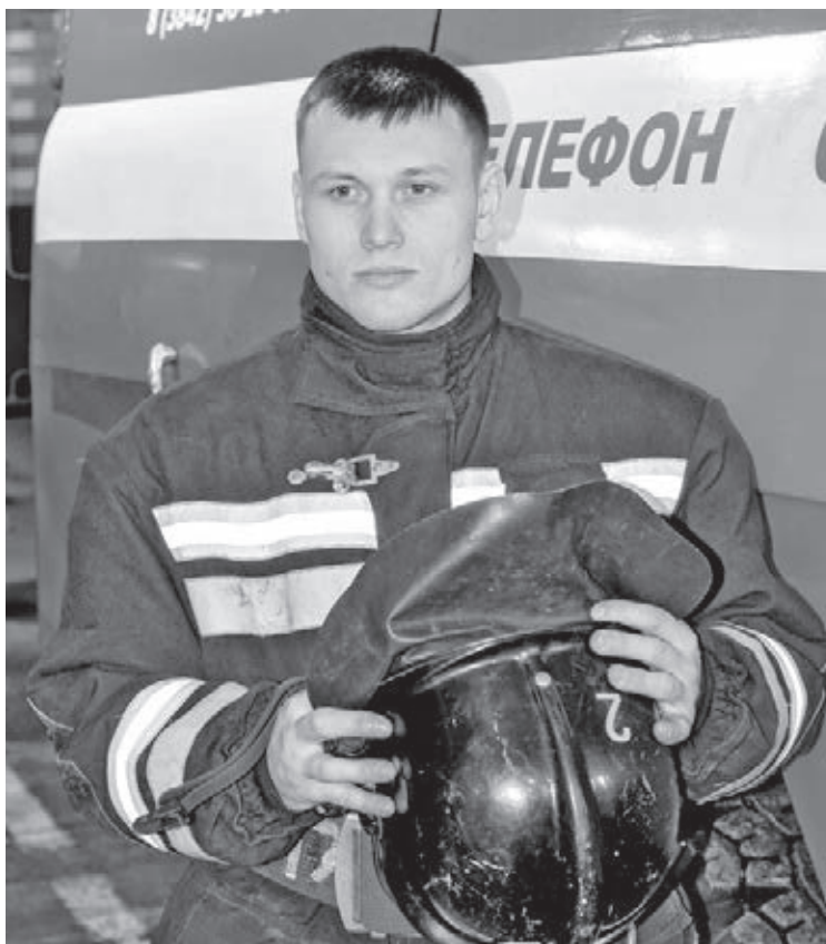
■ Фото Михаила Петрина.

Сам Павел Зенков работает в пожарной охране уже десять лет. В детстве он совсем не мечтал об этой профессии. Парень очень любил работать руками и видел