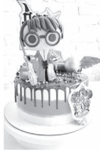
■ Фото из личного архива Вероники Володченко.