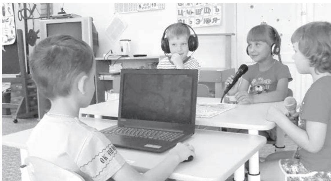
■ Фото администрации Юргинского городского округа.

Затем изучили литературу, выбрали оборудование, детей познакомили с профессиями, связанными с мультиплика-