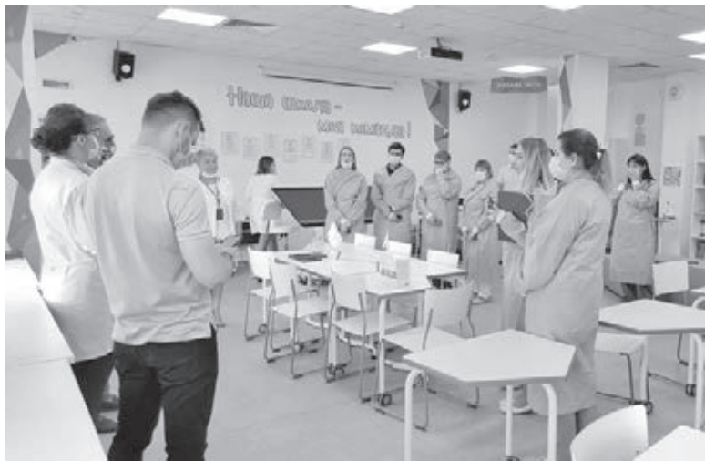
■ Фото пресс-службы АПК.