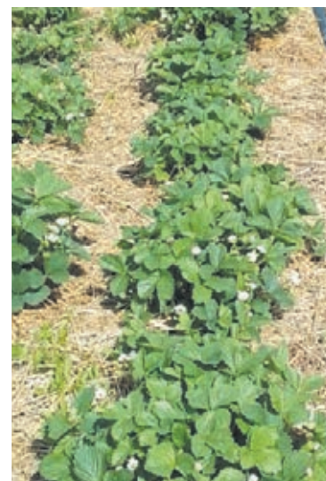
■ Образцово-показательный участок.

данным удобрением нет. А вот куринный помёт, как известно, более жгучий, едкий. Потребуется пол-литра угощения, разводив также десятью литрами чистой водицы. В ход такая подкормка идёт весной. Когда начинается цветение, покупаю гумат калия и вношу строго по инструкции: орошаю через голден спрей – специальный шланг для полива. А фосфорное удобрение пускается в дело осенью, когда ягода уже полностью отходит», – рассказал о тонкостях процесса огородник.