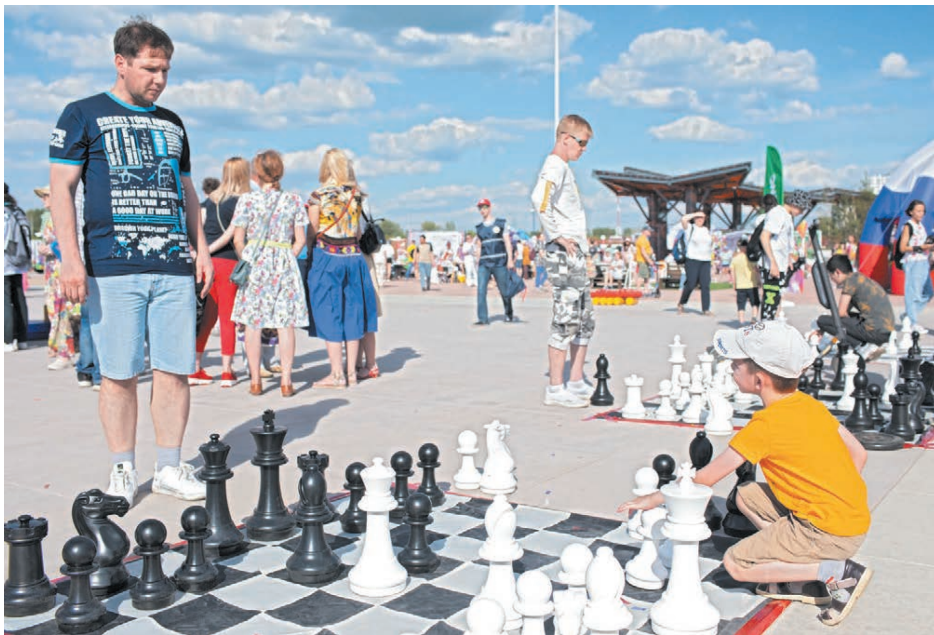
■ На Московской площади в День России.