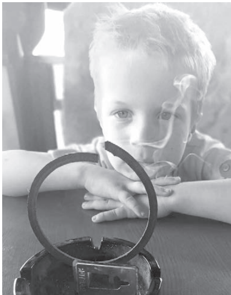
■ Дымовые спирали отлично спасают от комаров.

– Это называется крупная реакция (более 2 см). Оказывается, она связана с образованием иммуноглобулина Е и G к белкам слюны комара. И, как правило, реакции эти не опасные. А самое главное, в течение около 5 лет развивается десенсибилизация. То есть организм при повторных укусах умеет сам сбалансировать эти реакции и остановить гиперпродукцию этих иммуноглобулинов, развивается иммунитет, устойчивость. Начинаются реакции у детей, которых кусают впервые, или у людей,