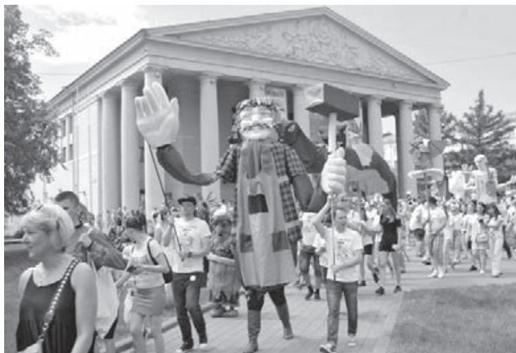
■ Фото Виктора Сохарева.