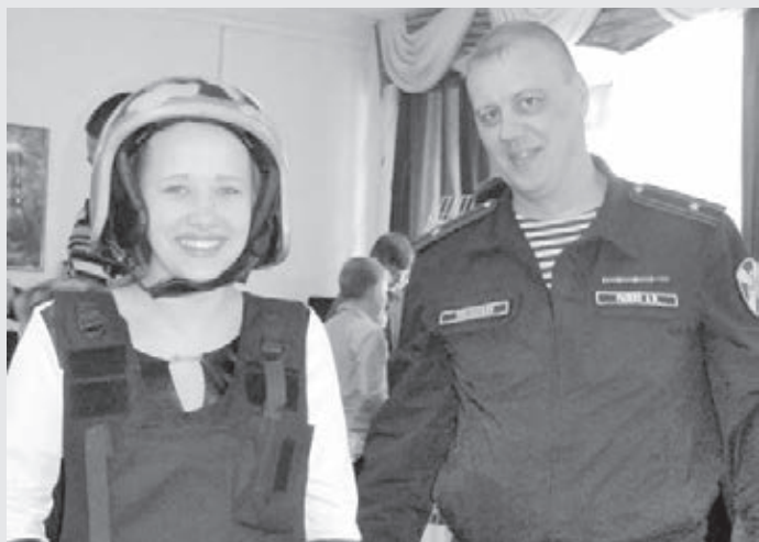
■ Фото Росгвардии Кузбасса.

СОТРУДНИКИ ВНЕВЕДОМСТВЕННОЙ ОХРАНЫ РОСГВАРДИИ ИЗ ЛЕНИНСКА-КУЗНЕЦКОГО БОЛЕЕ ДЕСЯТИ ЛЕТ ВЕДУТ ДРУЖБУ С ОДНИМ ИЗ ОТДАЛЁННЫХ ДЕТСКИХ ДОМОВ В ПРОМЫШЛЕННОВСКОМ МУНИЦИПАЛЬНОМ ОКРУГЕ.