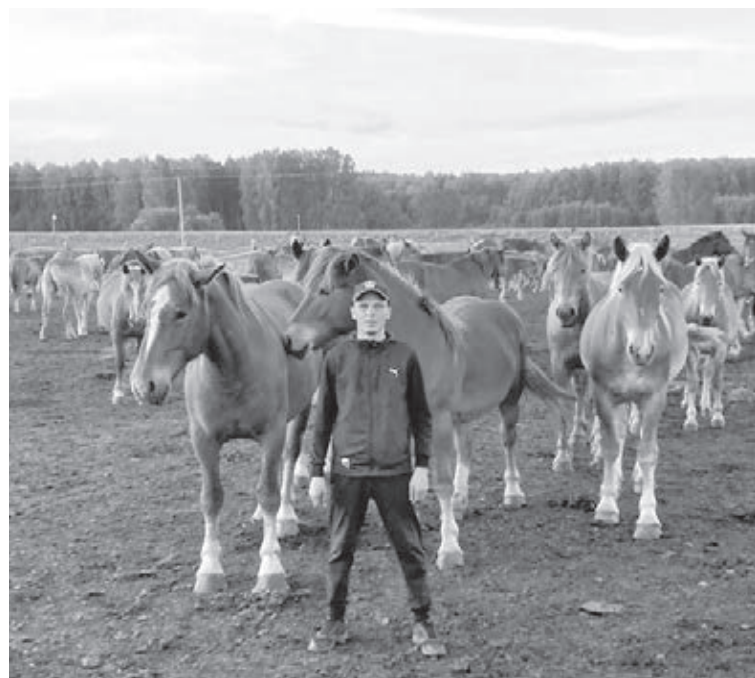
■ Фото из личного архива Максима Торгунакова.