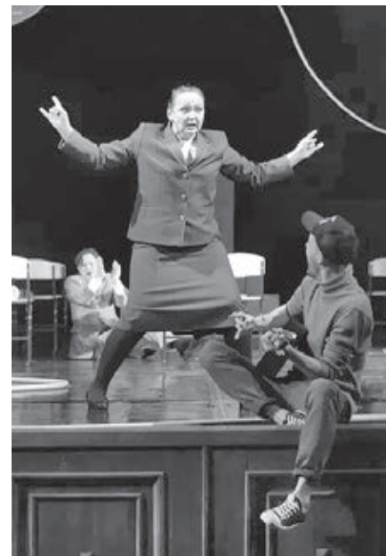
■ Сцена из спектакля «История от Матвея».