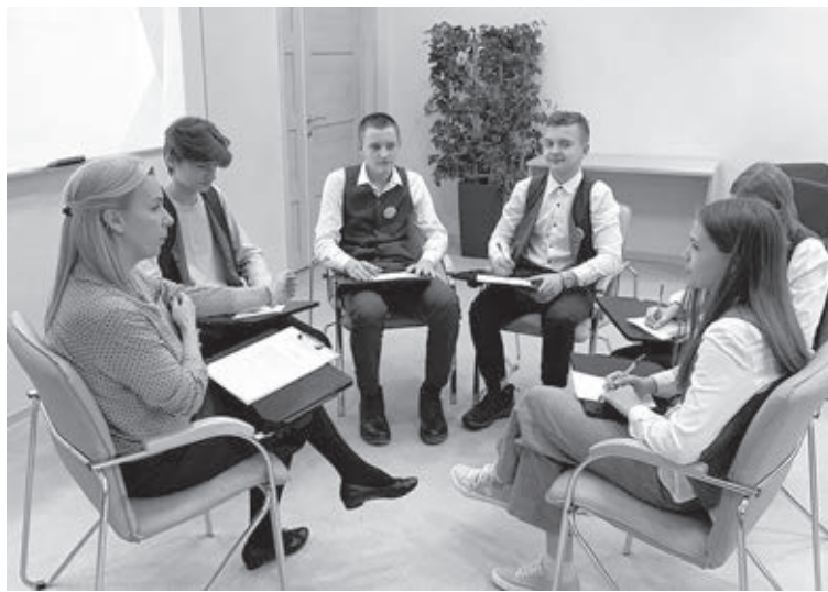
■ Момент занятия.