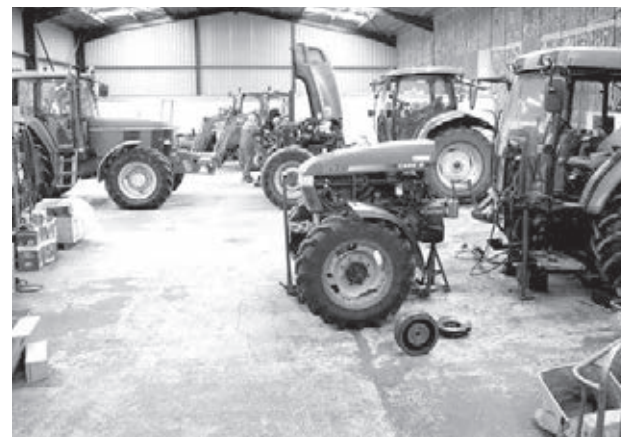
■ Для приобретения техники сельхозпроизводители пользуются льготным кредитованием.