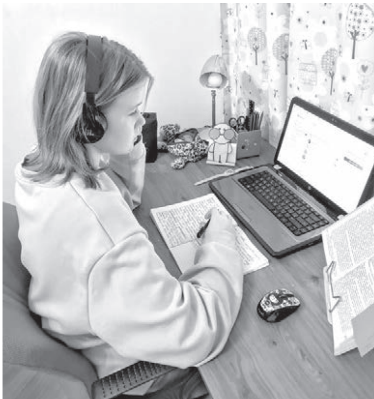
■ Фото из архива Анны Аредаковой.