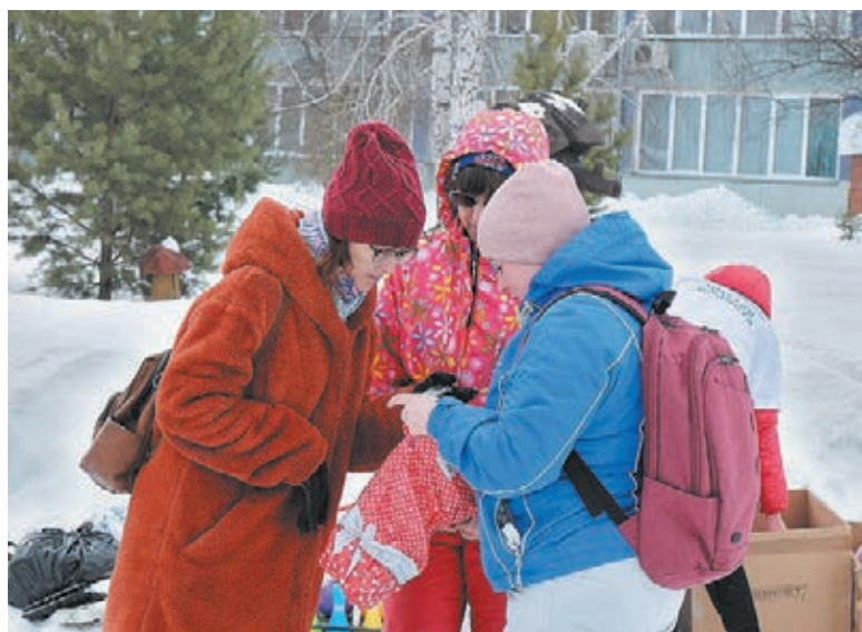
■ Фото из архива организации «ЭкоКемерово».