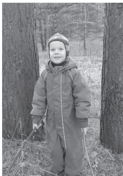
■ Прогулки на свежем воздухе – хорошая профилактика бронхита.

– Кашель. Этот ужасный кашель! Который, на самом деле, наш друг. Ведь при бронхите воспаляется слизистая оболочка бронхов, начинает в них вырабатываться мокрота, которая и лечит бронхи (в ней много важных веществ, убивающих микроорганизмы и восстанавливающих клетки). Но эту мокроту нужно постоянно удалять. А всё потому, что скопление большого количества мокроты чревато ухудшением дыхания и даже развитием пневмонии. И удалением мокроты как раз и занимается кашель. Поэтому не надо от него пытаться избавиться. В большин-