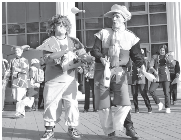
■ В рамках презентации маршрута был показан перформанс «Старый цирк».

онерские барабаны. В Офицерском доме всегда было много ребятшек. В послевоенные годы семьи были полные, большие, по трое, по пять детей в каждой. Учиться ходили в школу № 4 (на Черняховского) и в школу № 40 (на проспекте Кузнецком). По выходным и в каникулы одна из офицерских жён собирала детвору в пионеротряд. Квартира у