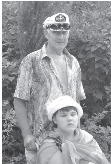
■ Казалось, впереди только счастье! Но летом 2021-го от коронавируса умер папа.

для Яны оптимальную программу для укрепления ног и назначили... переезд на юг, и море, и дельфина.