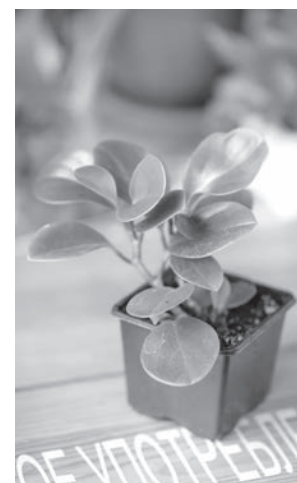
■ Фото Анны Осиповой.

Обычно на своп приходят совершенно разные люди: школьники и цветоводы со стажем, девушки, которые хотят завести своё первое домашнее