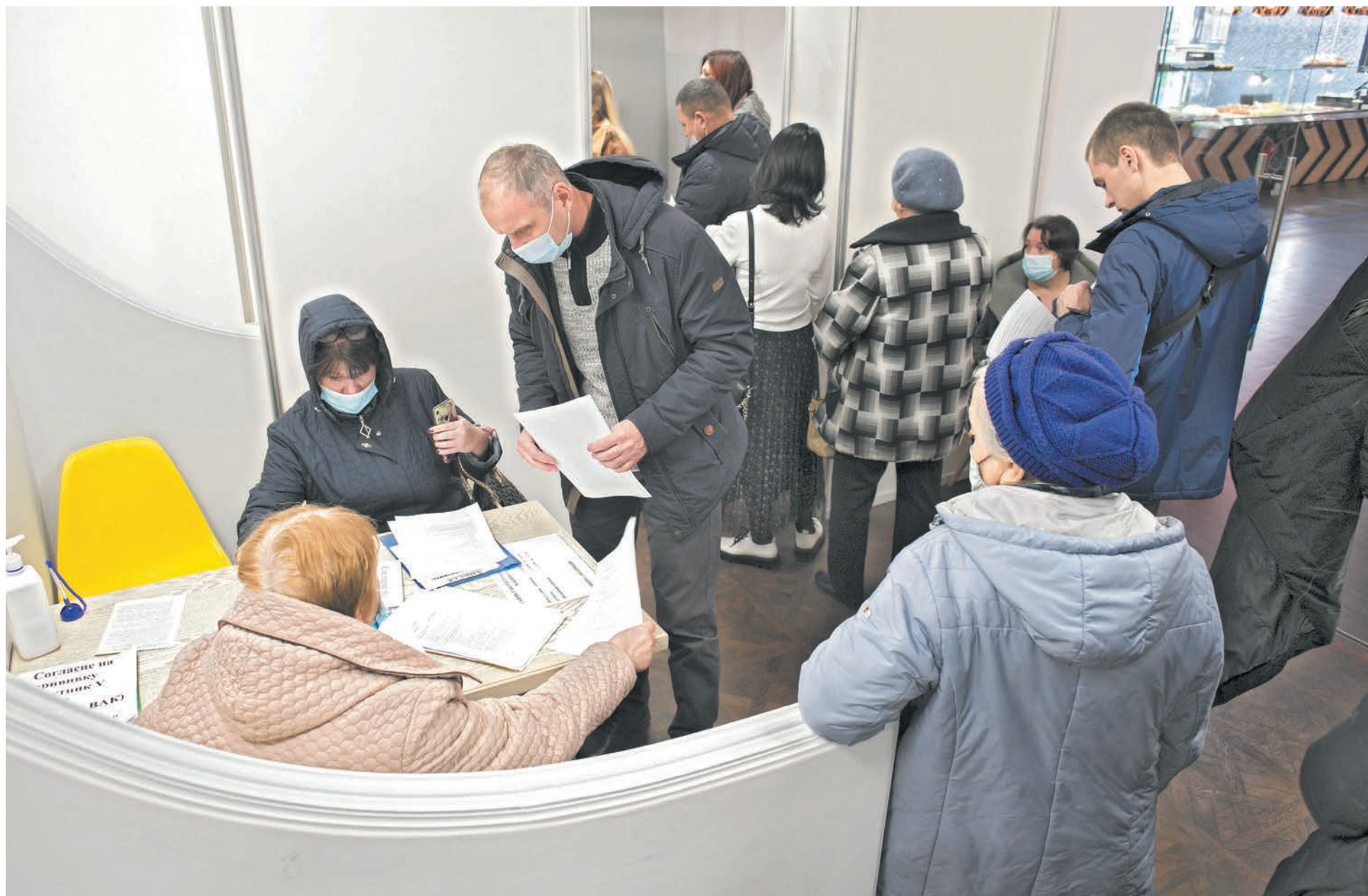
■ С подъёмом заболеваемости ковидом в Кузбассе выросло число желающих поставить прививку.