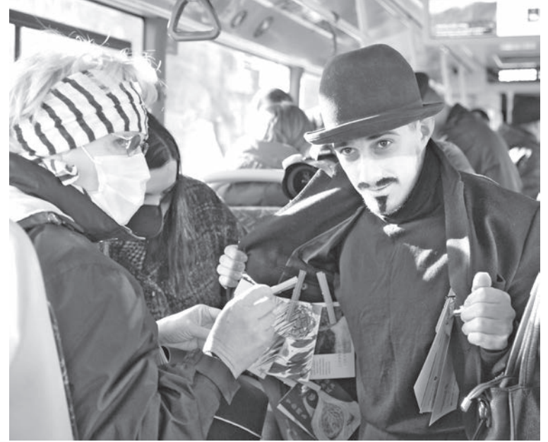
■ Зарисовка «Продажа из-под полы уникальных открыток».