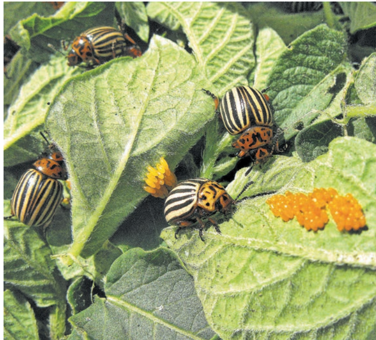
■ Хотя и жалко этих красавцев, но в борьбе за урожай хороши всякие средства.

– На ферме у нас небольшой цветник. Эту локацию называем местом медитации. Долго думали, чем оригинальным его украсить. Есть у нас здесь и мелкие камешки, и керамическая крошка... Хотелось разнообразить уголок, но при этом сильно не