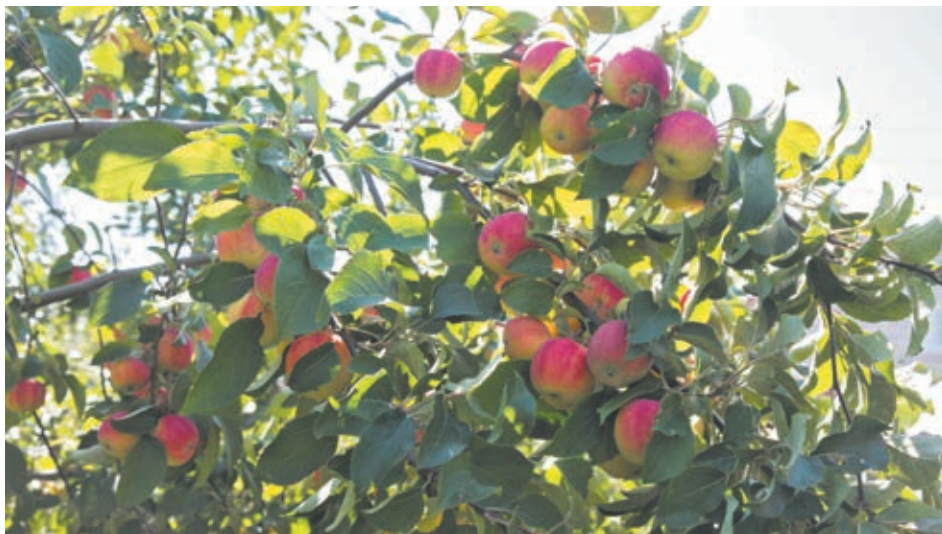
■ Фото Сергея Гавриленко.

Второе волшебство происходит 19 сентября, в Михайлов день. Как отметила эксперт, работать нельзя, нужно отдыхать и заниматься планированием дел на будущую весну. «В этот день происходят первые михайловские морозы, – уточнила огородница. – Конечно, небольшие, ночные. Уже утром может быть потепле-