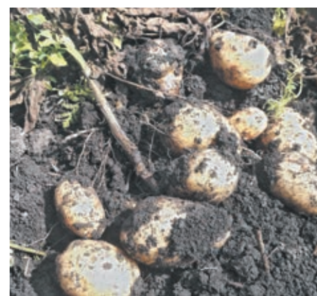
■ Фото Федора Баранова.

Также Ольга Георгиевна рассказала и о другом золотом правиле: если дерево не плели до пятилетнего возраста, то в последующем этого делать уже и вовсе не стоит.