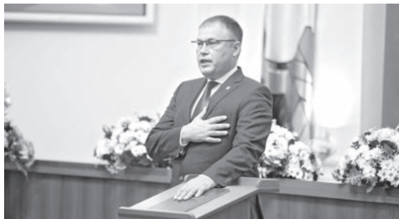
■ Фото Сергея Гавриленко.

Это по-настоящему знаковое событие. Ведь ранее мэр столицы Кузбасса избирался кемеровчанами прямым голосованием. Так было всегда в постсоветской истории. Но в начале 2019 года областной парламент проголосовал за изменения в статью 2 закона Кемеровской области от 13 ноября 2014 года «Об отдельных вопросах организации и деятельности органов местного самоуправления муниципальных образований», упразднив пункты, касающиеся выборов глав Кемерово и Новокузнецка. Теперь вместо непосредственно кемеровчан глав города выбирают депутаты местного совета. Простым голосованием.