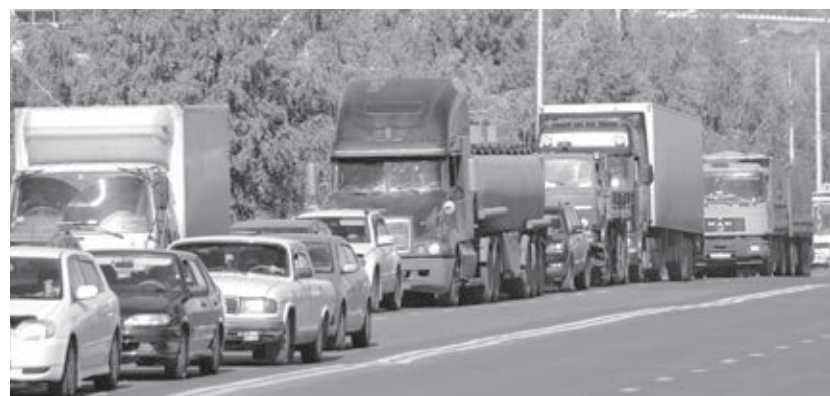
■ Фото Федора Баранова.