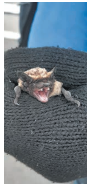
■ Фото МБУ «Кемеровская служба спасения».

Набеги летучих мышей на городские квартиры – явление рядовое, повторяющееся из года в год. Как рассказывают зоологи, в начале осени летучие мыши ищут место, где устроиться на зимовку. К этому моменту подрастает молодое поколение, которое по неопытности вместо природных укрытий выбирает форточки многоэтажек. При встрече с ночным гостем специалисты советуют не паниковать, а попытаться поймать его: в перчатках или накрыв тканью, чтобы не повредить хрупкие крылья и не дать себя укусить. Выпустить летучую мышь лучше подальше от