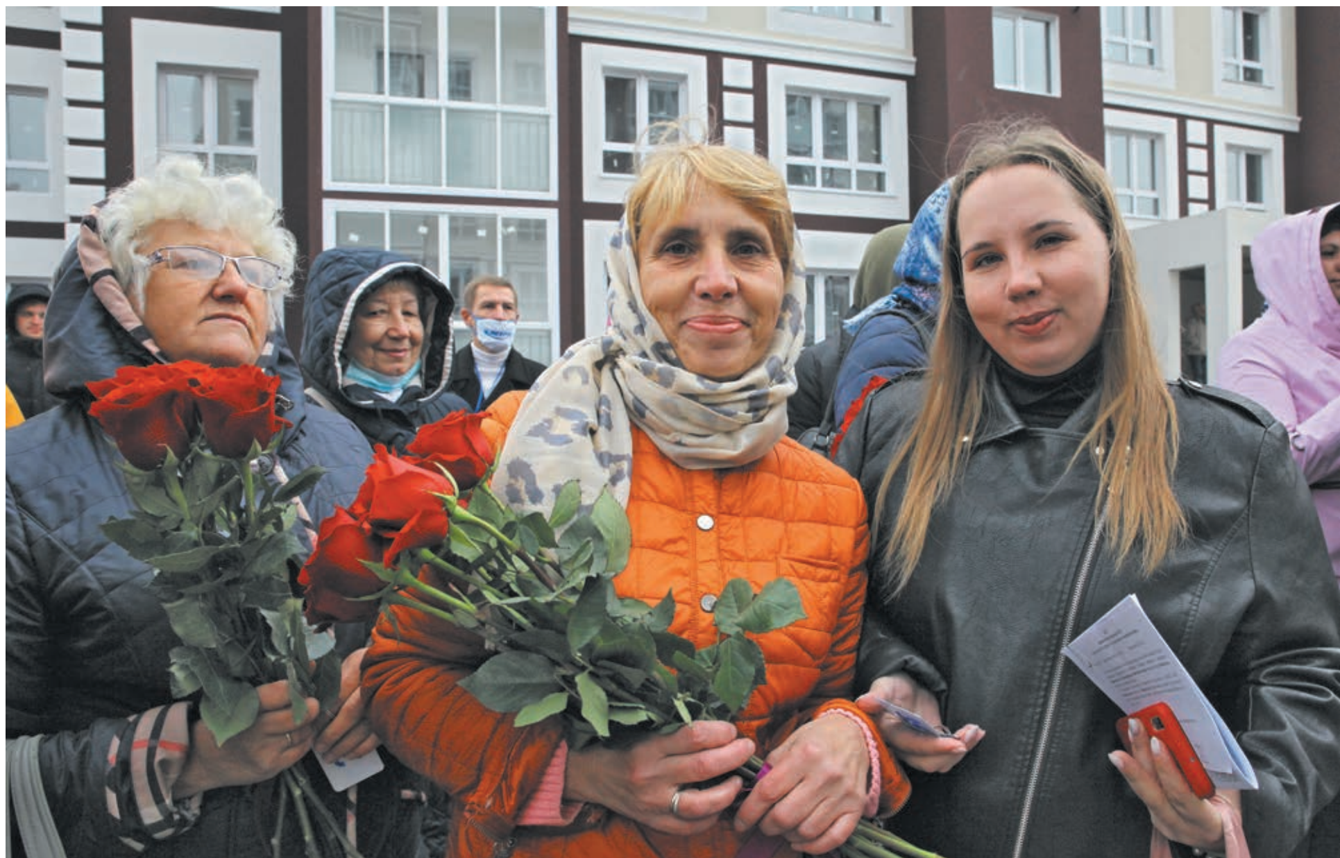
■ Фото Федора Баранова.