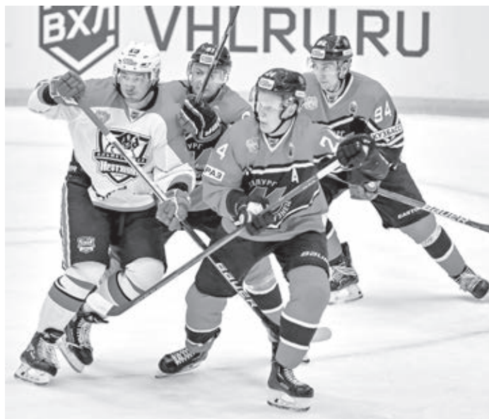
■ Защитник Кирилл Маслов (№ 24) – автор первого гола новокузнецчан в матче открытия домашнего сезона.