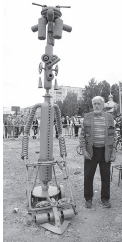
Вот такой получился Благоустроитель.

На аллее Интернационалистов в посёлке Зеленогорском прошёл первый в Кузбассе Межрегиональный конкурс актуального искусства из металлолома «Железное кружево». Для укрощения негугтаперчевого материала собрались пять умельцев из Кузбасса и Новосибирской области. Им удалось не только привлечь внимание к своему невероятному творчеству (или всё-таки ремеслу?), но и подогреть интерес участников события мастер-классами.