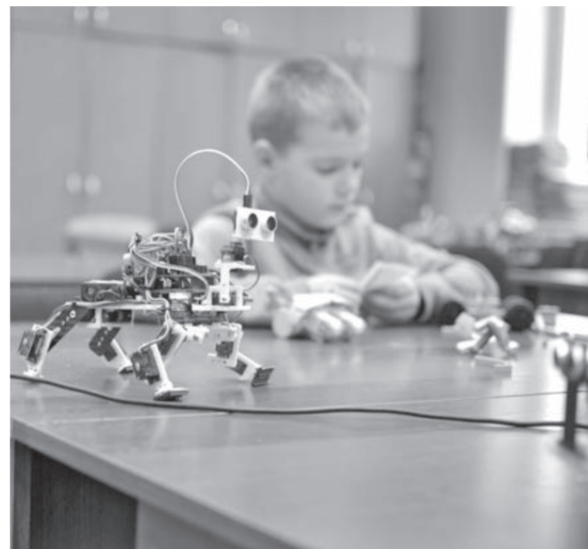
Наглядный пример цифрового помощника.

Добавим, что все вышеперечисленные программы разработаны для того, чтобы школьники могли углубленно и с интересом изучать такие предметы, как математика, физика, информатика, программирование. Педагоги уверены, что это поможет воспитать высококвалифицированных специалистов в будущем. Алена ФЕДОТОВА.