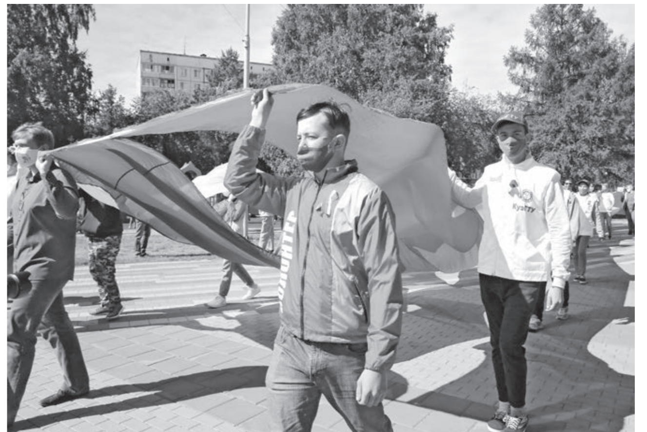
«ФЛАГ ДЕРЖАВЫ – СИМВОЛ СЛАВЫ!» – акция с таким названием прошла в Кемерове. Под звуки гимна Российской Федерации на бульваре Строителей был развернут 56-метровый триколор.