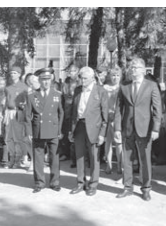
Вместе со знаменитым космонавтом Борисом Во-лыновым в торжествах участвовали главы городов и районов южной агломерации, представители правительства Кузбасса.

Борис Валентинович Во-лынов родился 18 декабря 1934 года в Иркутске. Семья переехала в Прокопьевск, когда ему не было и года. В 1953 году Борис Во-лынов окончил 24-ю военную авиационную школу первоначального обучения лётчиков ВВС При-волжского военного округа в