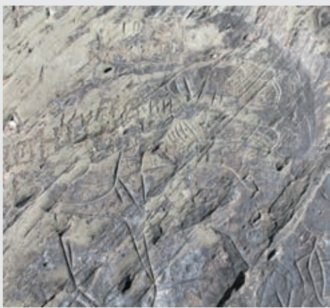
■ Фото Виктора Сохарева.