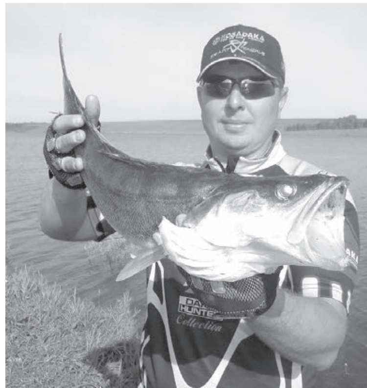
■ Среди личных рекордов – немало разных трофеев.

дидата в мастера спорта. Теперь цель – мастер спорта. К слову, звание даётся уже на всю жизнь, подтверждать его не надо.