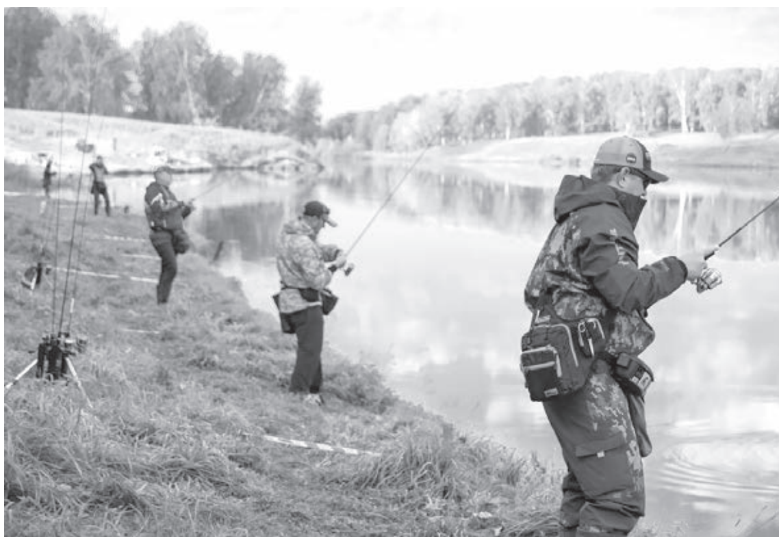
■ Момент соревнований.