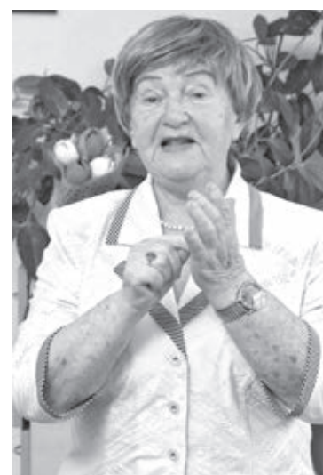
■ На встрече со школьниками.