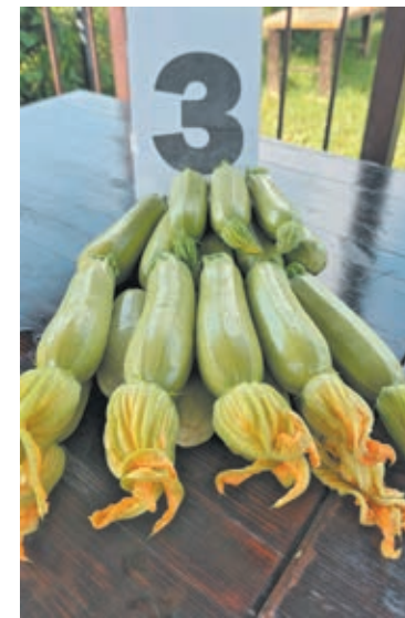
■ Вкусные результаты кропотливой работы.

В очередной раз команда убедилась, что агроволокно – отличный материал, который помогает избавиться от сорняков и сохранить влажность почвы на долгое время. «Нам удалось оградить себя от постоянной прополки и частого полива. К тому же на подложке из агроволокна даже после дождя наши кабачки остаются чистыми! Очень рекомендуем такой способ выращивания», – заключила Наталья Игнатъева.