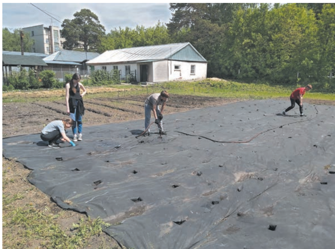
■ Момент эксперимента.