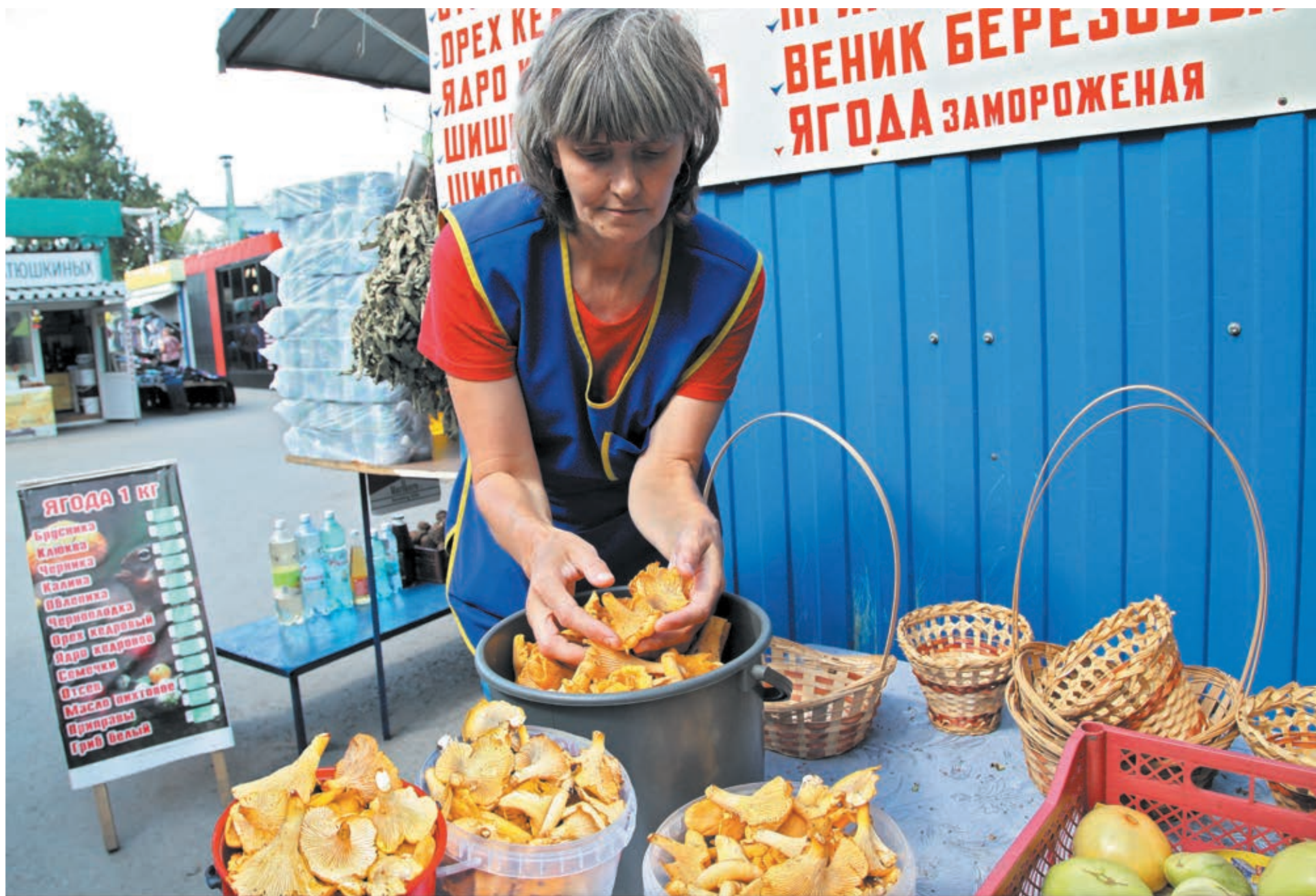
■ Эти рыжие красавцы попались охотникам близ села Барановна Кемеровского муниципального округа.