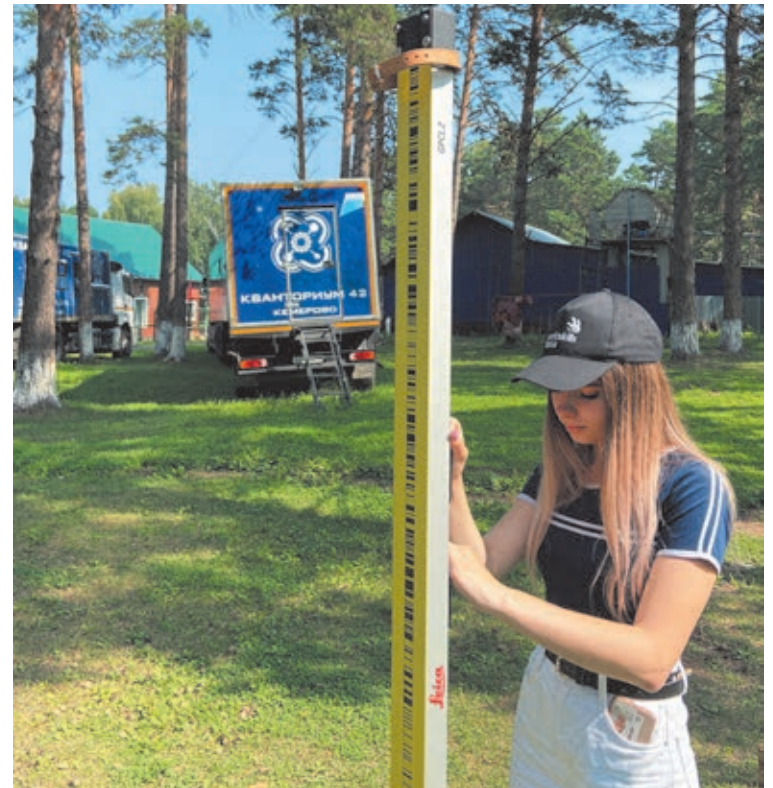
■ Профессия геодезиста требует точности и выносливости.