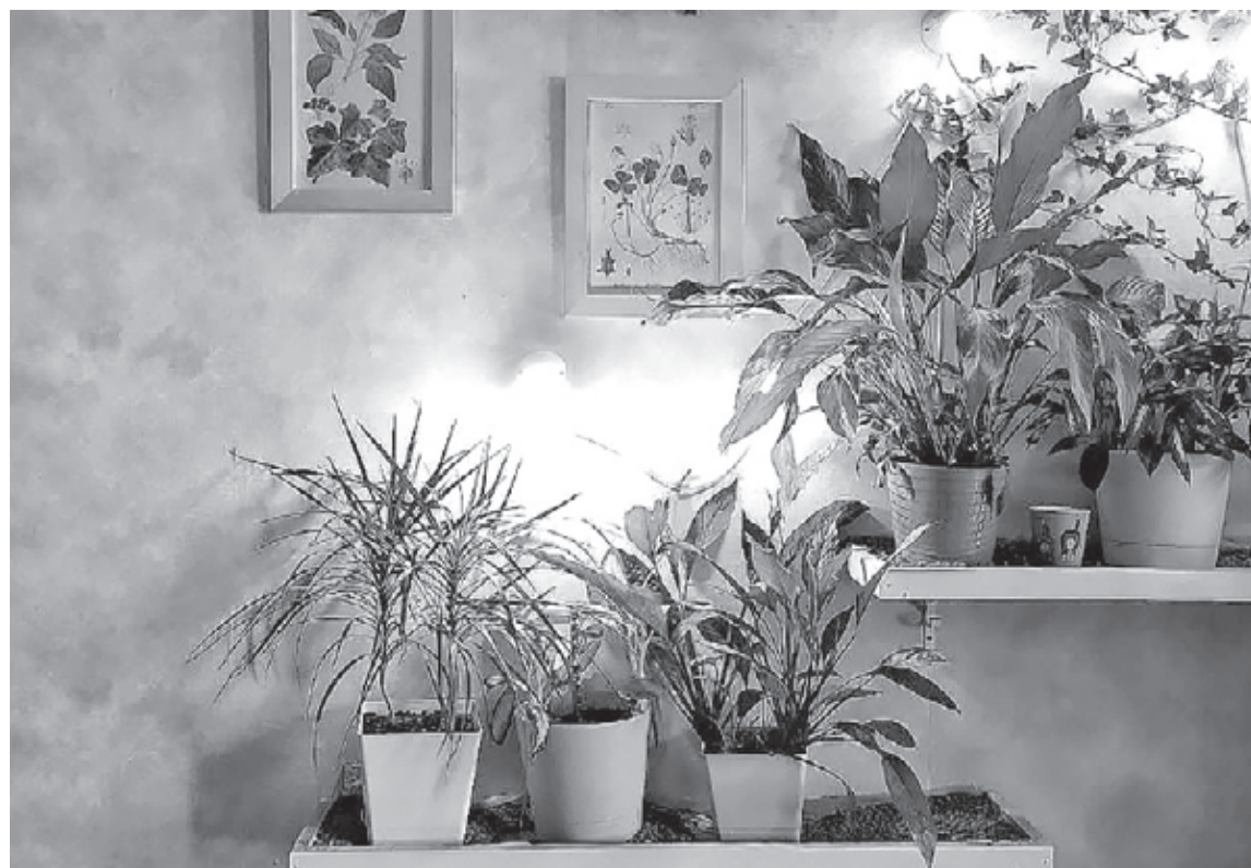
■ Стена в спальне.