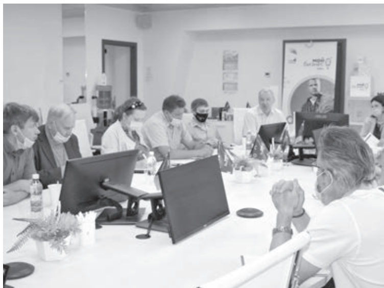
■ Фото Виктора Сохарева.

За круглым столом в формате утреннего кофе журналисты, социологи, политологи обсудили избирательную кампанию, которая сейчас проходит в Российской Федерации. Поводом стал недавно опубликованный доклад Фонда исследования проблем демократии, в котором были обозначены основные тренды. Среди них – увеличение числа политических партий и конкурентности в политической борьбе, ответственность кандидатов перед избирателями, легитимность выборов, электоральная активность, в том числе