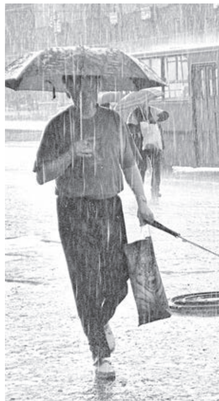
■ Полис страхования должен защищать клиента от финансовых проблем, как зонтик – от дождя.

После похорон приятельница посетила офисы его кредиторов и предоставила туда копии свидетельства о смерти должника. И в банке, и в пункте приёма платежей МФО её поблагодарили за