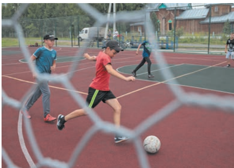
■ По областной программе в Зеленогорском открыли новую площадку ГТО и отремонтировали хоккейную коробку на стадионе.