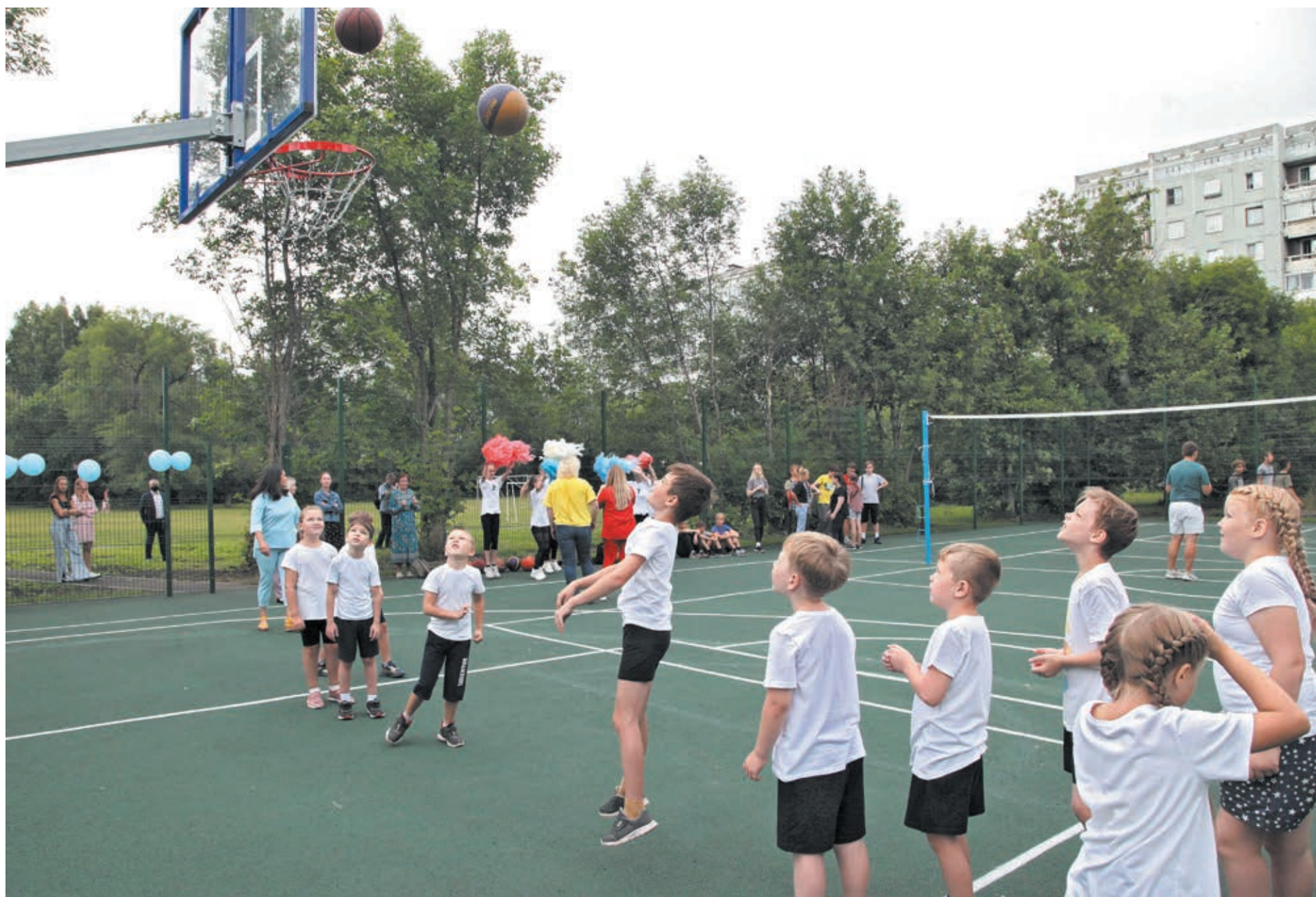
■ Ребята с удовольствием проводят время на новой площадке.