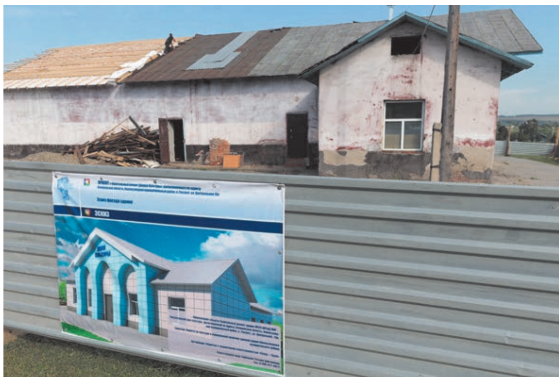
■ В Доме культуры в посёлке Рассвет Новокузнецкого района на ремонт идёт в рамках частно-государственного партнёрства.