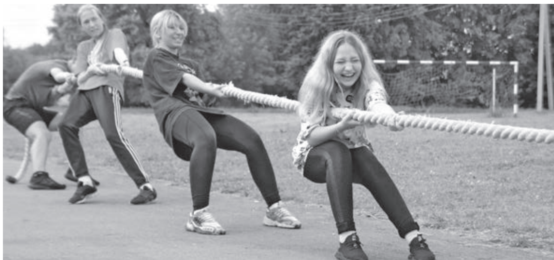
■ В Кузбассе каждая семья может найти подходящий летний лагерь для детей.

На крышах домов и стройках полицейские обнаружили 21 несовершеннолетнего, причём 16