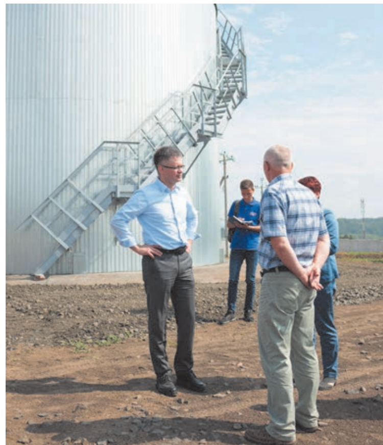
■ С запуском насосно-фильтровальной станции третьего подъёма в Крапивинском улучшилось качество питьевой воды.

Но не жилищно-коммунальными вопросами едиными. За последние годы в районе по федеральным и областным про-