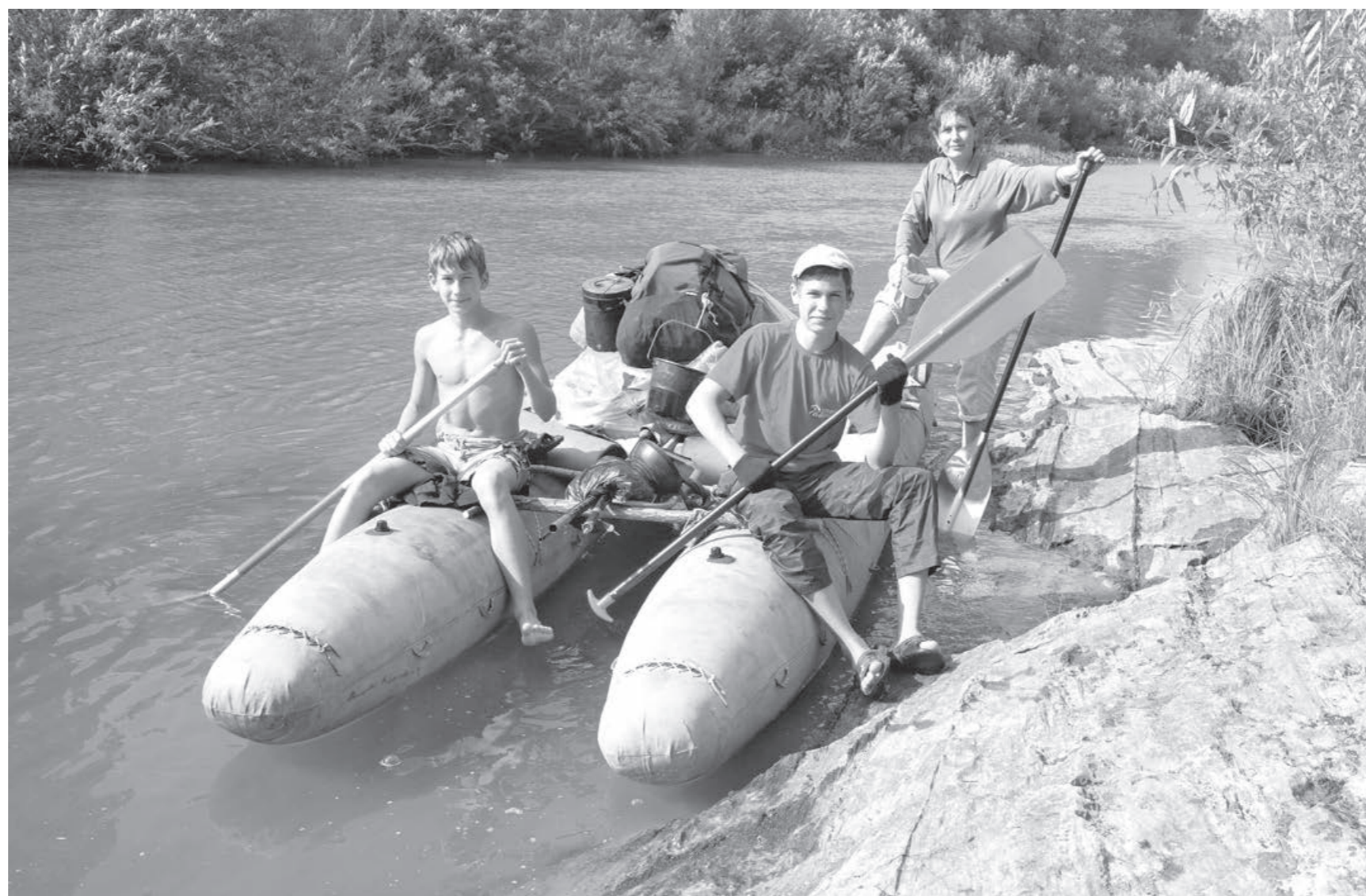
Некоторые кузбассовцы решили провести отпуск, не выезжая за пределы региона. А для этого есть много возможностей.

Этим летом кузбасские туристы имеют куда больше возможностей, по сравнению с прошлым годом, проводить отпуск в самых разных местах страны и даже выезжать на отдых за рубеж