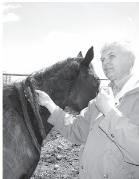
А это косы в гривах, появляющиеся в США сейчас... Исследователи считают, что их плетут йети.

– И лошади невидимые хрустят, траву дергают, фыркают. Один жеребёнок вдали закричит – мать отзовется, другой голос подаст... – и уже его мать ответит... А слышно хорошо – ночью отдаётся по степи далеко... И лошади отдыхают, кто стоя, кто лежат... И я наездник, проверяя, особенно тех, которые бродят в логах, но которых постарался ещё в начале ночи попутать, чтобы сильно от всех не ушли... – вспоминает Разгонов... – И вот я – за день работы в колхозе, в поле уставший, убедившись: вокруг всё в порядке, под куст прилечь. А чтобы дежур-