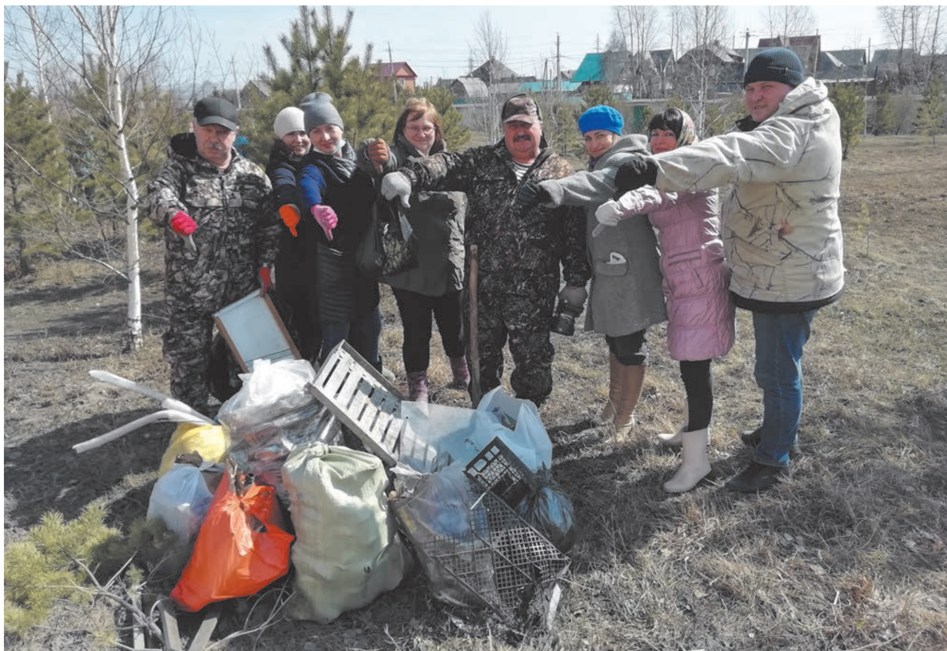
Первый весенний субботник прошёл и в Полысаеве. Пример празднака труда показал: соблюдать экологическую дисциплину просто, не требуется никаких сверхусилий для того, чтобы очистить территорию в том месте, где ты живёшь.