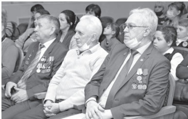
■ Мероприятие «Чернобыльский набат».

Также в Кемерове накануне этой трагической даты на линию вышел