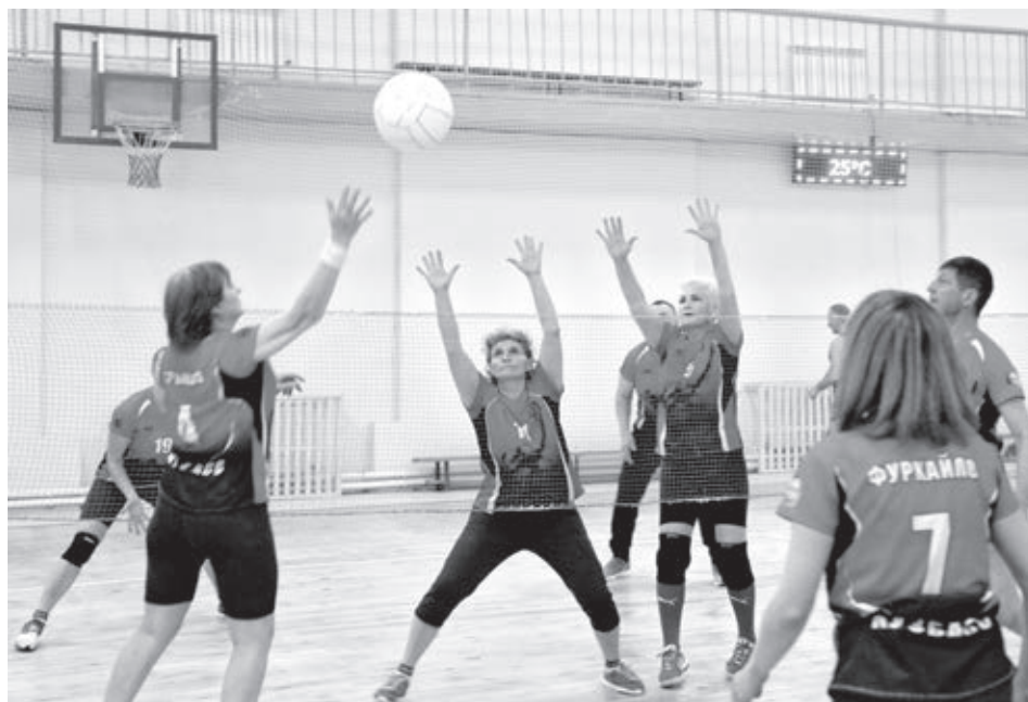
■ Кемеровский округ – мини-волейный центр Кузбасса.

Необязательно иметь за плечами опыт в стандартном волейболе и отменную физическую форму, чтобы начать играть в мини-волей. Главное, чтобы было желание, а мастерство и спортивная подтянутость придут позже. Причём, как показывает практика, времени для этого требуется не так уж и много. Мини-волей развивается в Кемеровском округе всего пару лет, и за столь короткий срок наши спортсмены-любители добились впечатляющего успеха. На Кубке России, который состоялся в Сочи меньше месяца