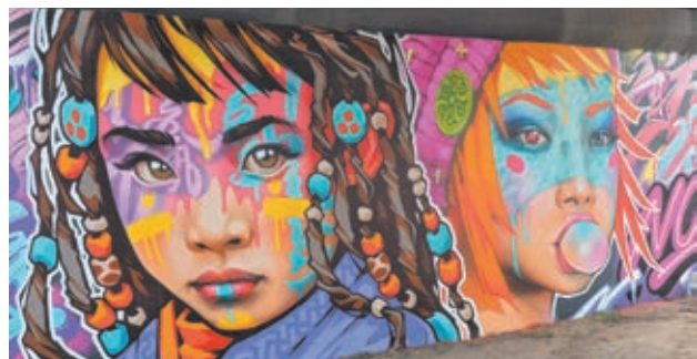
■ Фото из личного архива Вадима Кулишова.