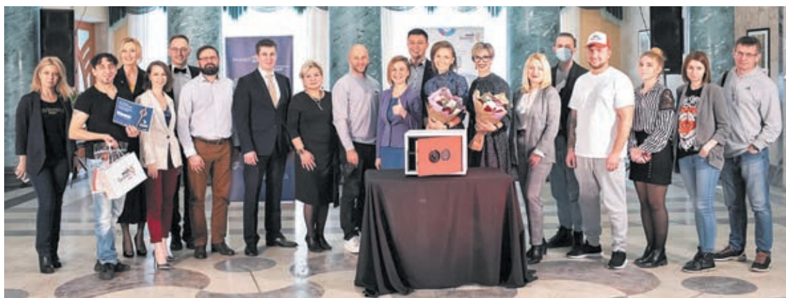
■ По мнению создателей проекта, финальная шестая серия получилась самой зрелищной.