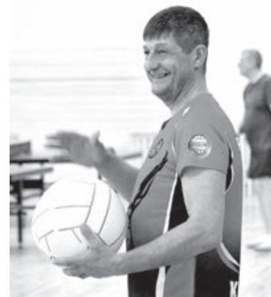
■ Мяч для мини-волея обладает уникальными характеристиками.

Мини-волей – совершенно новый для Кузбасса вид спорта, который культивируется в нескольких поселениях Кемеровского округа. Однако наши спортсмены-любители уже громко заявили о себе на всероссийском уровне