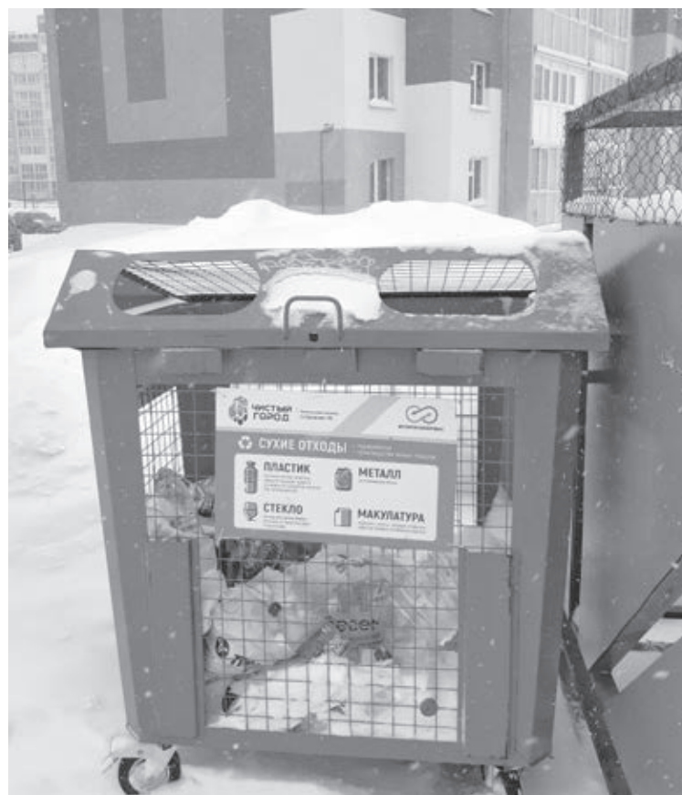
■ По оценкам регоператора зоны «Север», 97% контейнерных площадок во дворах областной столицы оборудованы емкостями под вторсырье.

В основном в Кузбассе заготавливают вторсырье, которое отправляется на переработку в другие регионы. Продукцию из ТКО, в основном – бумажную, делают несколько предприятий. В банке данных юристов и ИП, принимающих и перерабатывающих отходы на территории области (его ведет областное Минприроды) по состоянию на начало 2021 года, 185 организаций занимаются обработкой и обезвреживанием промышленных отходов и металлолома.