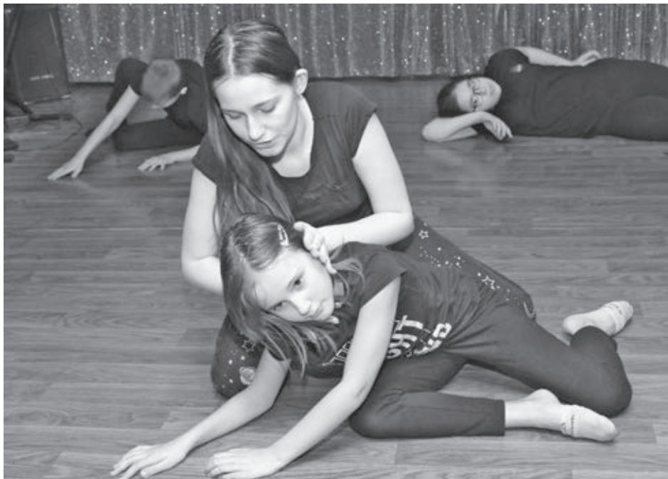
■ Занятия в детской театральной студии - это всегда весело и интересно.

- Очень часто мы после спектаклей слышим от людей, которые выходят из зала: