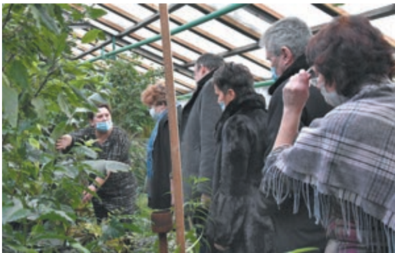
■ Фото из архива Минобрнауки Кузбасса.