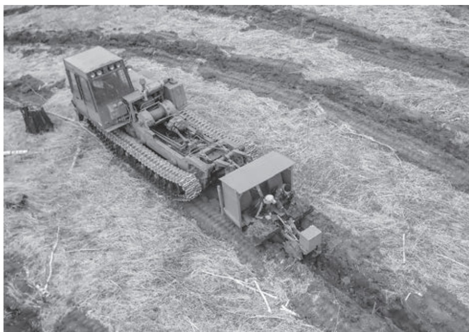
■ Работы по лесовосстановлению в Кузбассе проводятся в рамках регионального проекта «Сохранение лесов» нацпроекта «Экология».

- Факторов несколько. Прежде всего, лесозаготовка. В регионе 226 предприятий среднего и малого бизнеса, которые заготавливают и перерабатывают древесину. Кроме того, жители Кузбасса ежегодно заключают порядка 12 тыс. договоров купли-продажи лесных насаждений, готовят порядка 300 тыс. кубометров для собственных нужд. В мае 2020 года из-за урагана в Мариинском и Тяжинском лесничествах погиб древостой на площади почти 2 тыс. гектаров. Сейчас в Кемеровском и Яшкинском лесничествах усыхают кедровые боры из-за нашествия стволовых вредителей. От пожаров леса в Кузбассе гибнут чрезвычайно редко. В Кузбассе минимальные показатели горимости по Сибири и Дальнему Востоку. В прошлом году в лесах Кузбасса было 64 пожара на площади 358,3 га. Эти возгорания случаются весной, горит сухая трава, и сами деревья обычно не повреждаются. Главную опасность огонь несет для молодых хвойных посадок, они могут погибнуть из-за весенних палов травы.