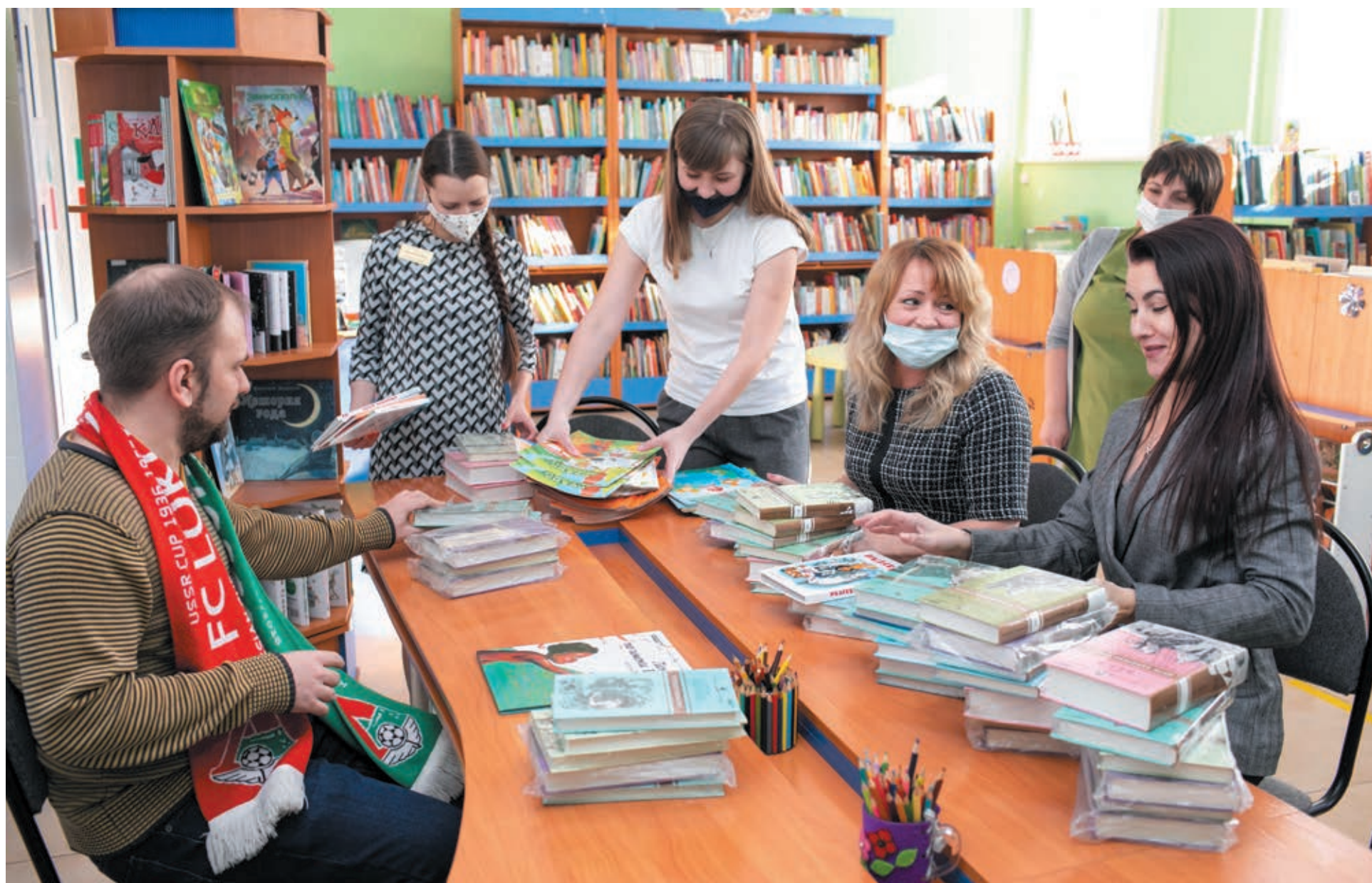
■ Сотрудники Государственной библиотеки Кузбасса для детей и молодежи с радостью встретили журналистов «Кузбасса», прибывших с книжным грузом.