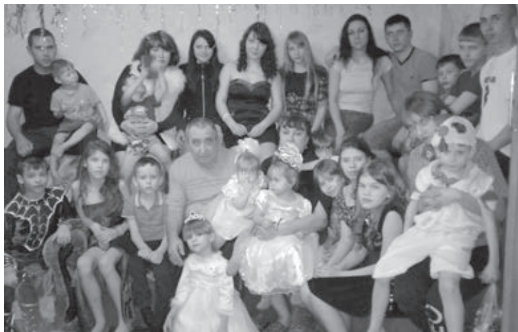
■ И это еще не все дома!