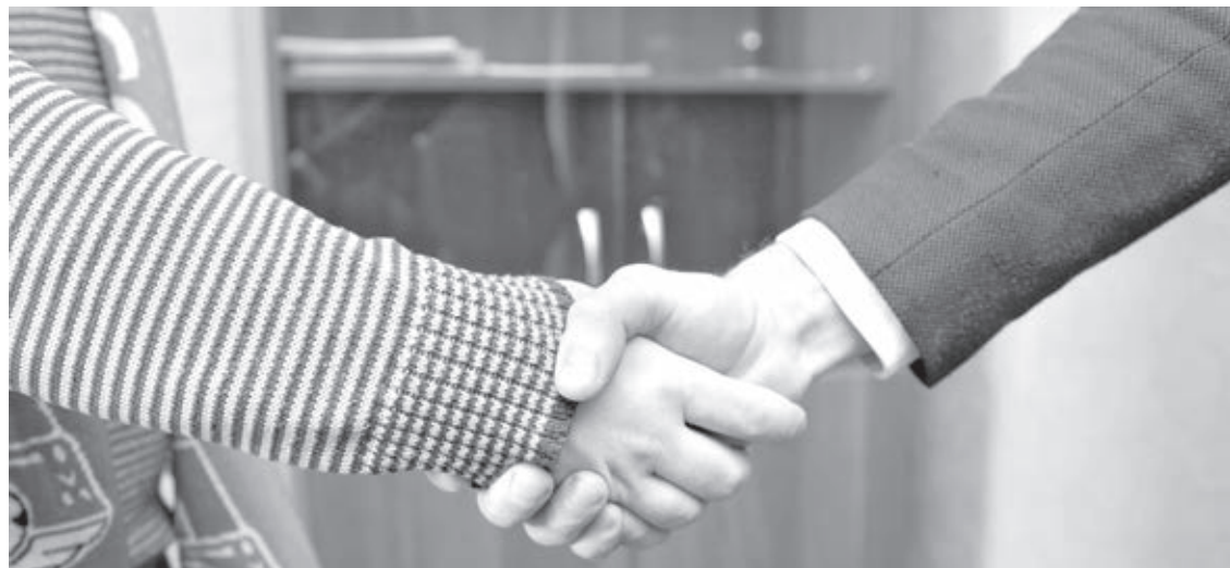
■ Фото Сергея Гавриленко.

Однако надо иметь в виду, что, выбирая в качестве зарплатной карту «другого» банка, вы можете лишиться льгот, которые первый банк предоставил участникам своего зарплатного проекта. Сюда может входить отмена комиссии за годовое обслуживание карты, бесплатное снятие наличных в банкоматах сторонних банков, бесплатные пуш-уведомления о движении средств на карте и т.д. В индивидуальном порядке кредитные организации такие бонусы клиентам, как правило, не предлагают.