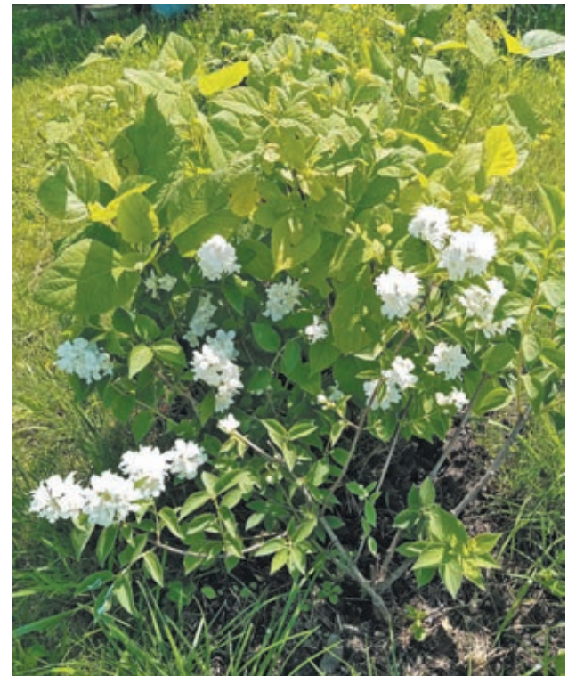
■ Чубушник махровый.

«Таким же способом укореняю и хвойные, например,