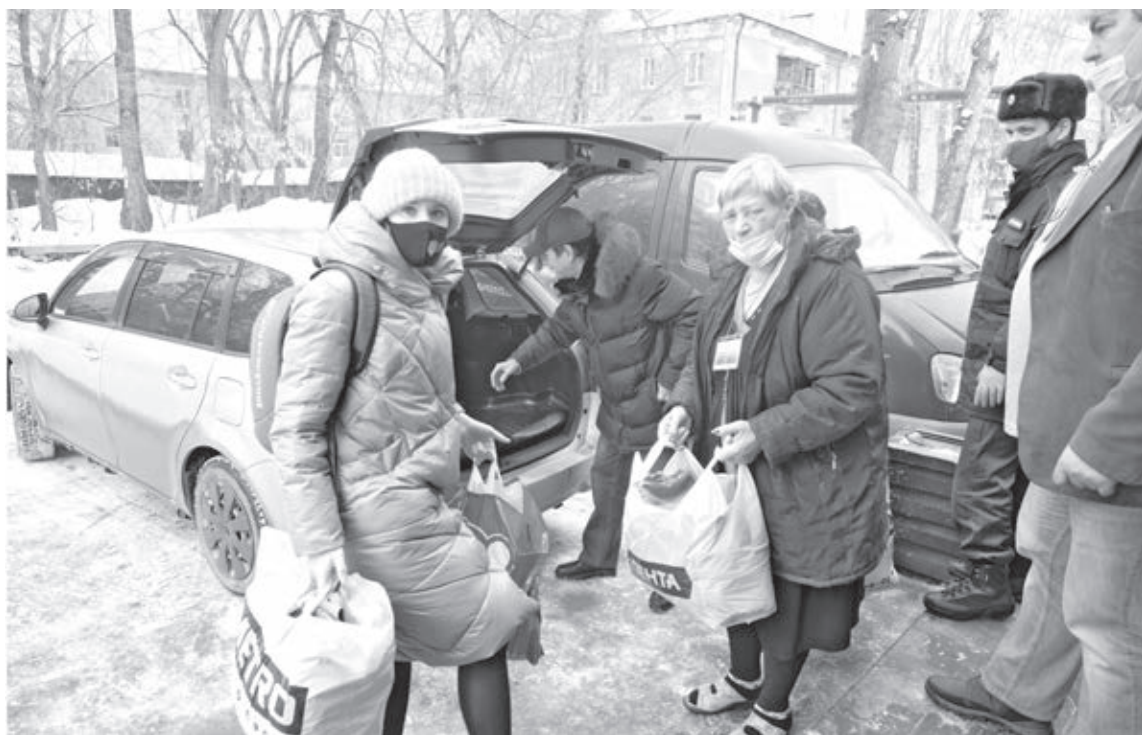
■ Сотрудники редакции собрали для бездомных несколько пакетов добротных вещей.