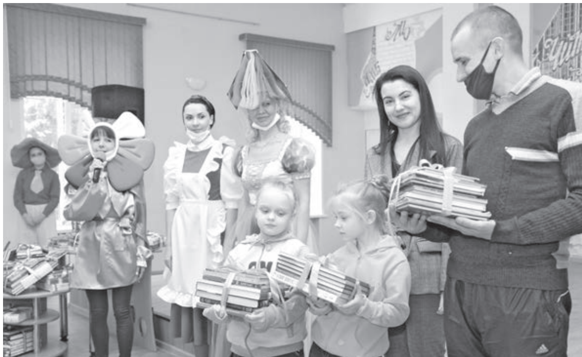
■ Газета «Кузбасс» внесла свою лепту в дело книгодарения в рамках благотворительного марафона «Сто добрых дел к столетию «Кузбасса».

цифру, но, по последним исследованиям, информация из бумажной книги воспринимается лучше. А ещё это хранитель истории, культурных знаний. Даже президенты и главы городов и районов, вступая в должность, произносят клятву на бумажной книге, не на виртуальной.