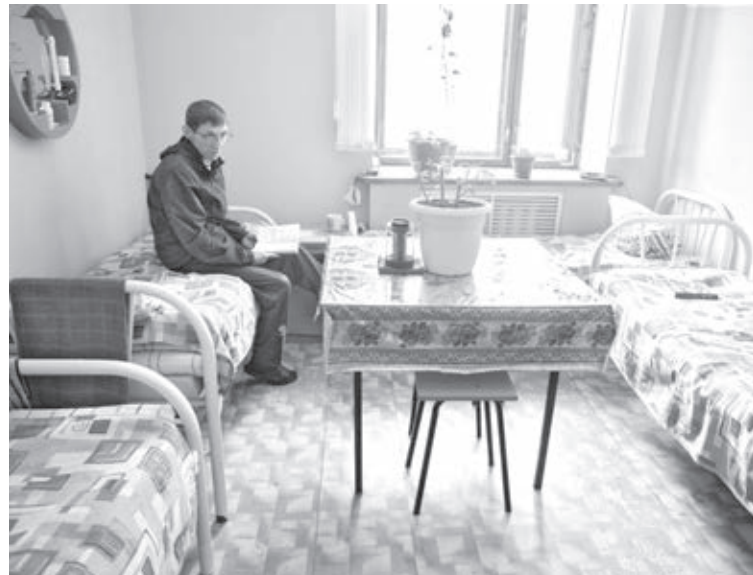
■ В социальном общежитии можно бесплатно жить до полугода. Дальше – за небольшую плату.