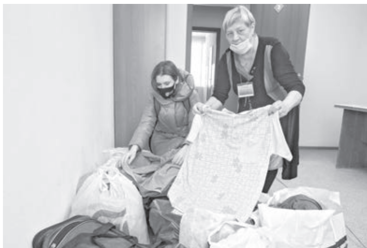
■ Одежда, в особенности мужская, центру социадаптации нужна всегда.

Центр социальной адаптации населения рассчитан на 120 человек (60 мест в отделении «Социальное общежитие», 45 – в социальной гостинице, 15 – в отделении социального ухода). По состоянию на 16 февраля, в центре проживало 48 человек: 43 мужчины и 4 женщины. Причём отделение социального ухода, куда поступают люди, которые не могут себя обслуживать сами, заполнено всегда. Здесь предоставляют медицинские услуги с элементами долговременного ухода. Реабилитологи пытаются хотя бы отчасти восстановить способность таких пациентов к самообслуживанию, чтобы потом им было проще жить в домах-интернатах.