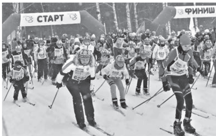
■ Около 600 человек приняли участие в центральном старте кузбасской «Лыжни России-2021» в Топках.