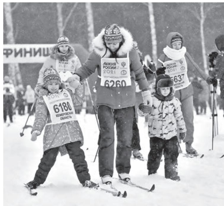
■ Самым маленьким лыжникам всего по 3-6 лет.

регистрироваться и получить медицинскую справку о допуске к состязаниям. Даже для совсем маленьких организовали отдельный забег. Именно дошколята в возрасте от трёх до семи лет открывают соревнования. Свои 300 метров, символизирующие грядущее трёхсотлетие Кузбасса, малыши преодолевают с завидным упорством. Пусть у них в руках пока нет лыжных палок и дистанцию они проходят очень аккуратно, стараясь не упасть, но первые шаги на пути к спорту самые юные лыжники уже сделали. Победы достойны все, поэтому на финише каждому вручают медаль и специальный приз в виде мягкого игрушечного быка – символа 2021 года.