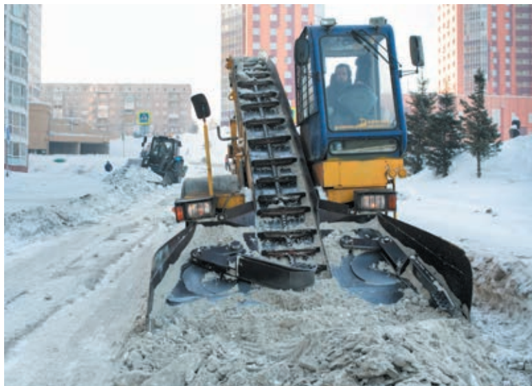
■ Фото Сергея Гавриленко.

«За утро я получил в социальных сетях огромное количество обращений о неудовлетворительной и несвоевременной уборке снега. Так, в Кемерове пробки достигали девяти баллов, в Топках из-за заснеженных дорог не вышел на маршрут рейсовый автобус № 10, в Междуреченске на центральных улицах сугробы, в посёлках Металлплощадка и Новостройка Кемеровского округа на дорогах остались снежные валуны, в Мариинске не чистят пешеходные тротуары, и людям приходится передвигаться по проезжей части. Всем главам сразу же после селектора необходимо объехать улицы своего муниципалитета и лично проверить качество уборки и вывоза снега, особое внимание при этом уделить обра-