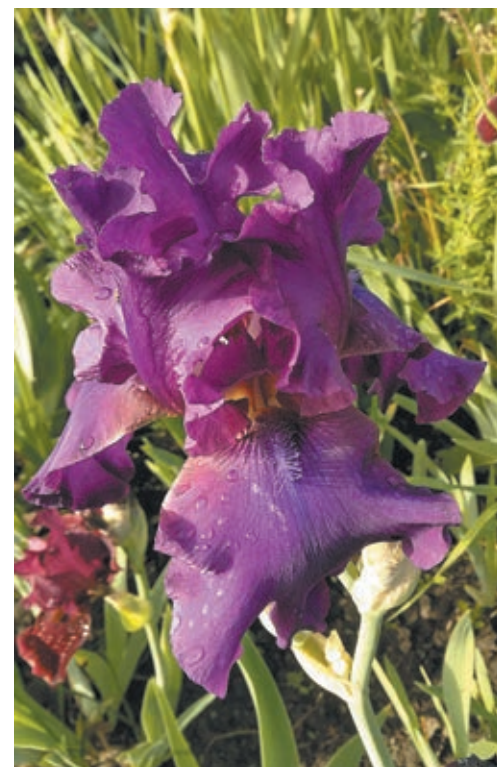
■ Ирис известен человечеству с древнейших времен.