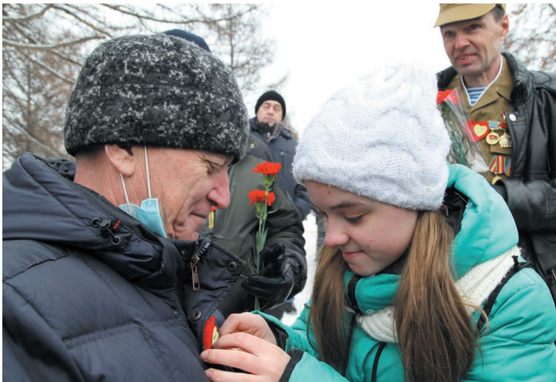
■ В знак благодарности волонтеры дарили героям сердечки.