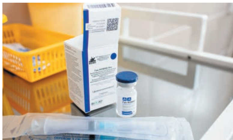
■ На днях в Кузбасс поступило еще более 15 тысяч доз вакцины «Спутник V».

В общей сложности в область начиная с осени прошлого года поступило уже 29637 доз вакцины «Спутник V» (из них 15300 доз