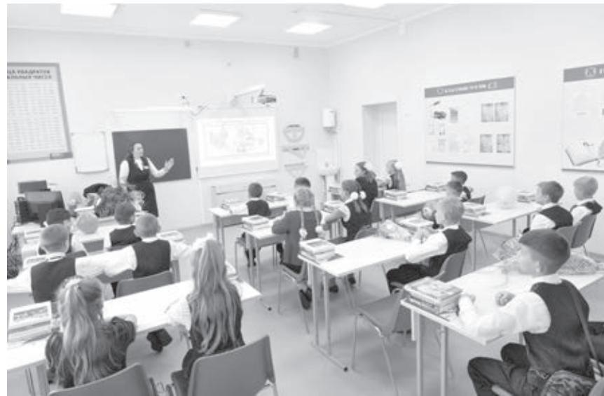
■ Фото из архива Минобрнауки Кузбасса.

Право преимущественного приема на обучение по образовательным программам начального общего образования получили дети, прожи-