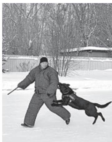
■ Для немецкой овчарки Геры «задержание фигуранта» дело пары секунд.

в Центре кинологической службы определили, какая собака отправится на задание.