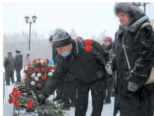
■ Возложение цветов в Кемерове.