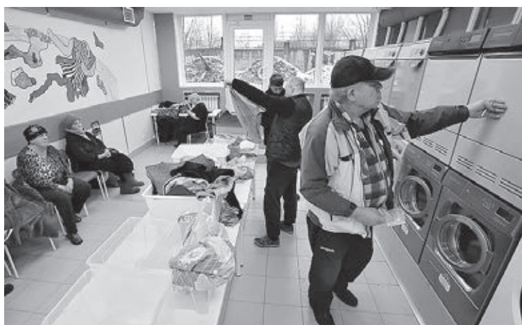
■ В Санкт-Петербурге любой нуждающийся может бесплатно постирать одежду и принять душ.

Уровень образования бездомных, по нашей статистике, такой же, как у населения в целом. 12%