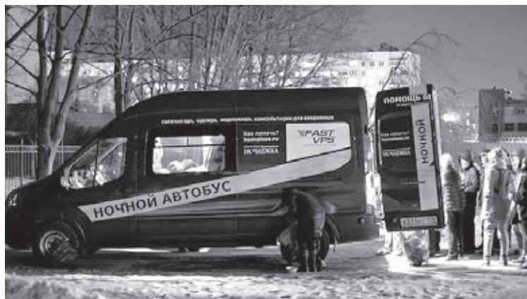
■ По результатам опроса, проведенного «Ночлежкой» в 2019 году среди 1337 человек, наиболее распространенные причины бездомности – неудачный переезд в большой город (38,2%) и проблемы в семье (35,8%).

Мы отдаем себе отчет в том, что не все люди, которые приходят к нам за тарелкой супа, съедят его и тут же перестанут быть бездомными. Бездомность – проблема очень многофакторная, и решение ее тоже должно быть комплексным. И тут, к сожалению, существенную роль играет факт выгорания сотрудников