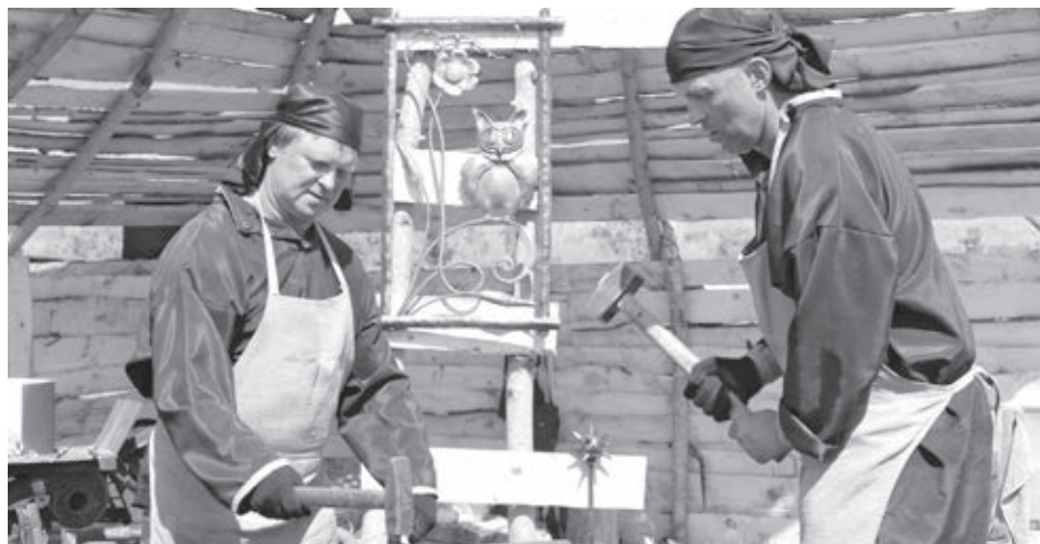
■ Фестиваль «В гости к динозавру» (Чебулинский район) ежегодно собирает гостей и умельцев со всей Сибири. Из-за коронавируса в этом году такого масштабного праздника, как обычно, не проводили.