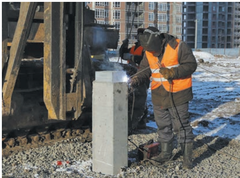
■ Первые сваи забиваются на месте будущего образовательного учреждения.

Проект этой школы – типовой. Здание будет иметь усиленный сейсмостойкий каркас и утепленные кирпичные стены. При под-