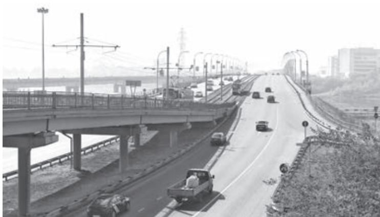
■ До конца текущего месяца водители грузовиков должны оборудовать машины тахографами.

Срок установки тахографов на автобусы, которые имеют более