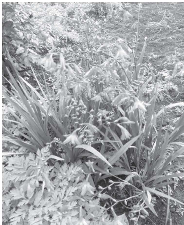
■ Крокосмия не останется незамеченной на дачном участке.