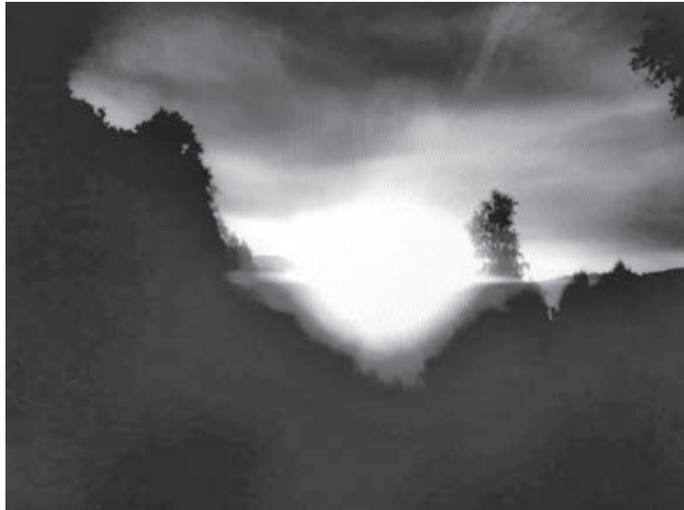
■ Кадр уже с усилением контрастности. Лик стал виден четче...