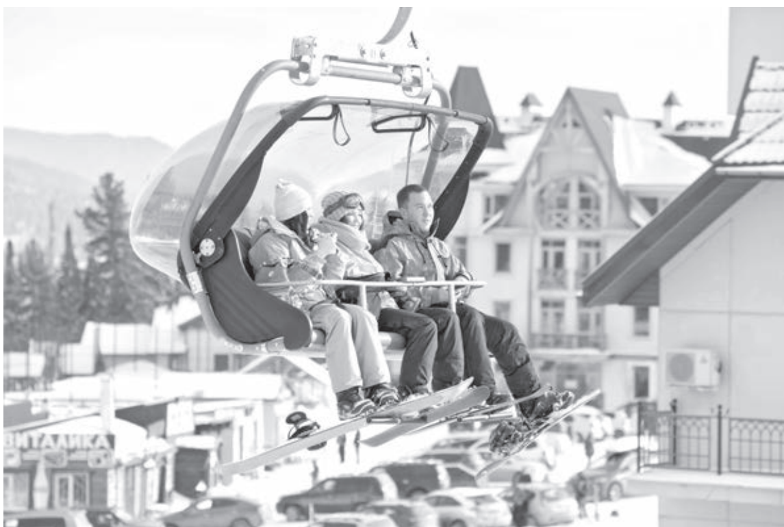
■ Фото Сергея Гавриленко.