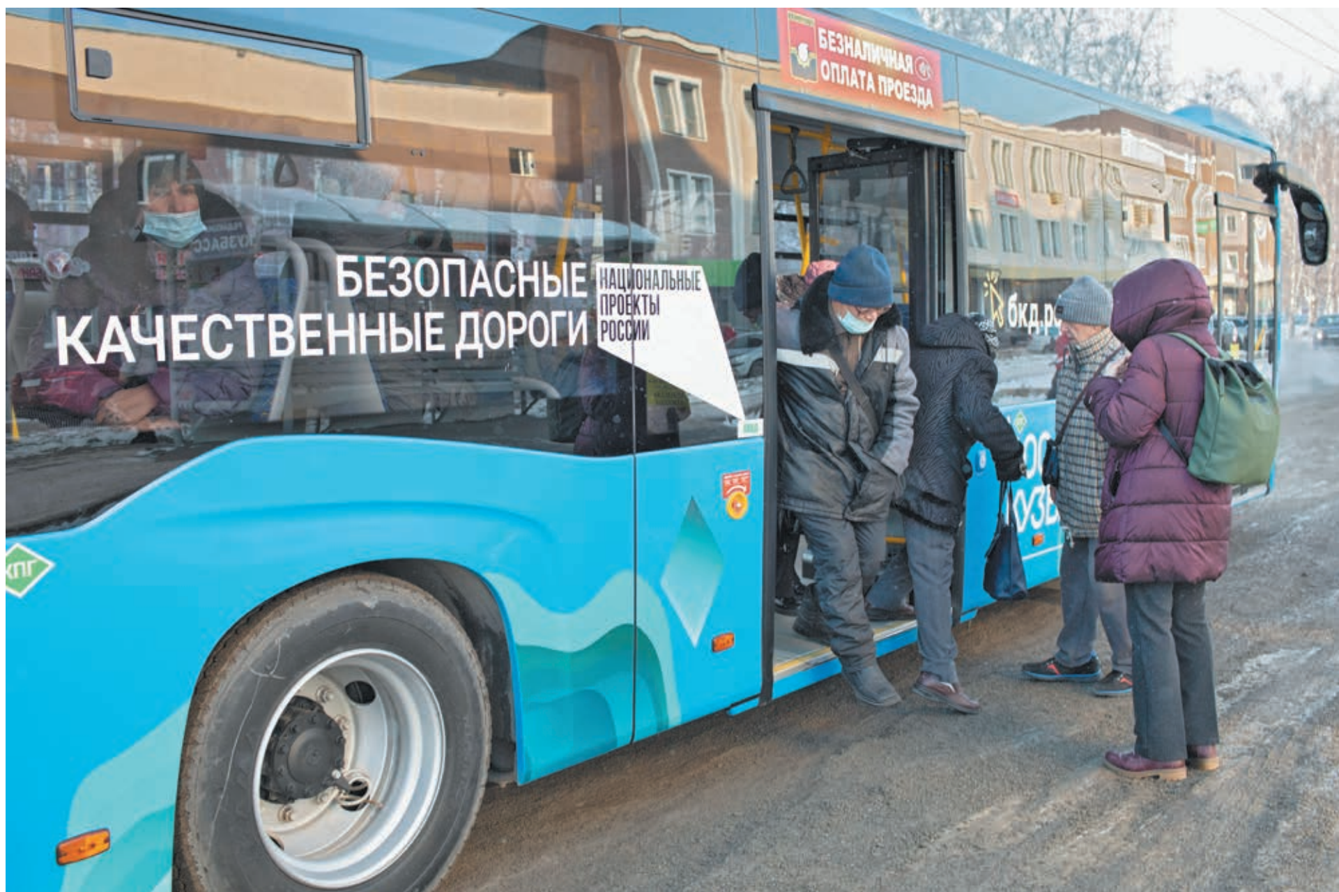
■ Многие кузбассовцы уже смогли оценить удобство новых автобусов.