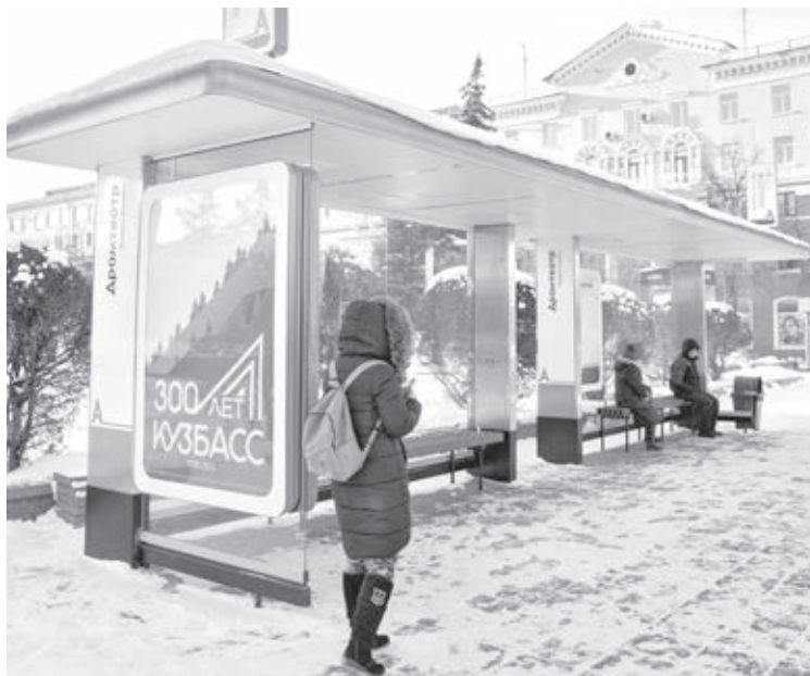
Остановочные павильоны оборудованы USB-разъемами.

Вот, к примеру, в Кемерове к зиме на всех 820 остановках обновили таблички с графиком движения, так как городской пассажирский транспорт переведен на зимнее расписание. Но если по какой-то причине такой информации нет в павильоне, то пассажир может воспользоваться информацией из мобильного приложения. В режиме реального времени видно, где находится транспорт и сколько времени требуется, чтобы подойти на остановку к его приходу. Словом, постепенно меняются не только