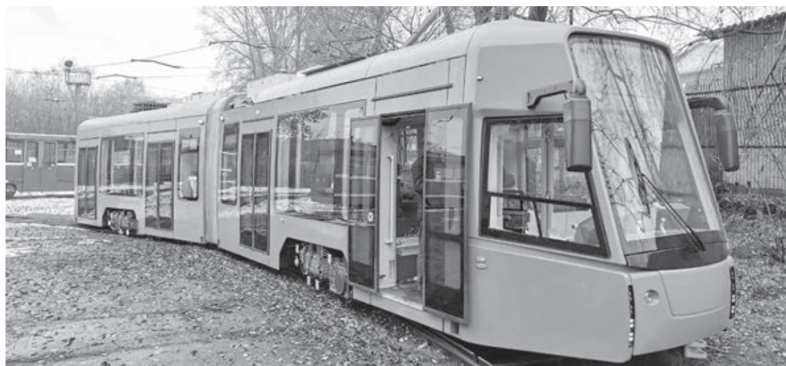
У трамваев, поступивших в Новокузнецк, гораздо ниже уровень энергопотребления. Срок его эксплуатации почти в три раза превышает «жизнь» автобуса. К тому же это экологически чистый транспорт.

В работе транспортников случаются сбои, как это произошло в Новокузнецке. Там вчера стартовала транспортная реформа, в городе изменились графики движения транспорта, маршруты, способы оплаты проезда. Организации-перевозчики, победившие в электронных аукционах (компания «Питеравто», ИП Потанин, ИП Тибейкин, ООО «ГК «Профи»), выпустили на линии автобусы средней, большой и особо большой вместимости. Но их оказалось недостаточно. «На сегодняшний день автоперевозчик не смог обеспечить в полном объеме выпуск запланированных автобусов на линии, сейчас в Новокузнецке организован штаб под управлением главы города для обеспечения выпуска транспорта в полном объеме», – приводит комментарий министра транспорта Кузбасса Сергея Рубана пресс-служба администрации города. Министр лично курирует работу городского штаба. «Весь процесс находится на контроле у глав районов и специалистов администрации Новокузнецка. Они готовы объяснять и разъяснять жителям города, как действовать и передвигаться по городу в условиях новой транспортной системы», – сообщает пресс-служба. При всех возникающих вопросах горожане могут позвонить по телефонам горячей линии: (8-384-3) 740-195 и 8-800-600-4770.