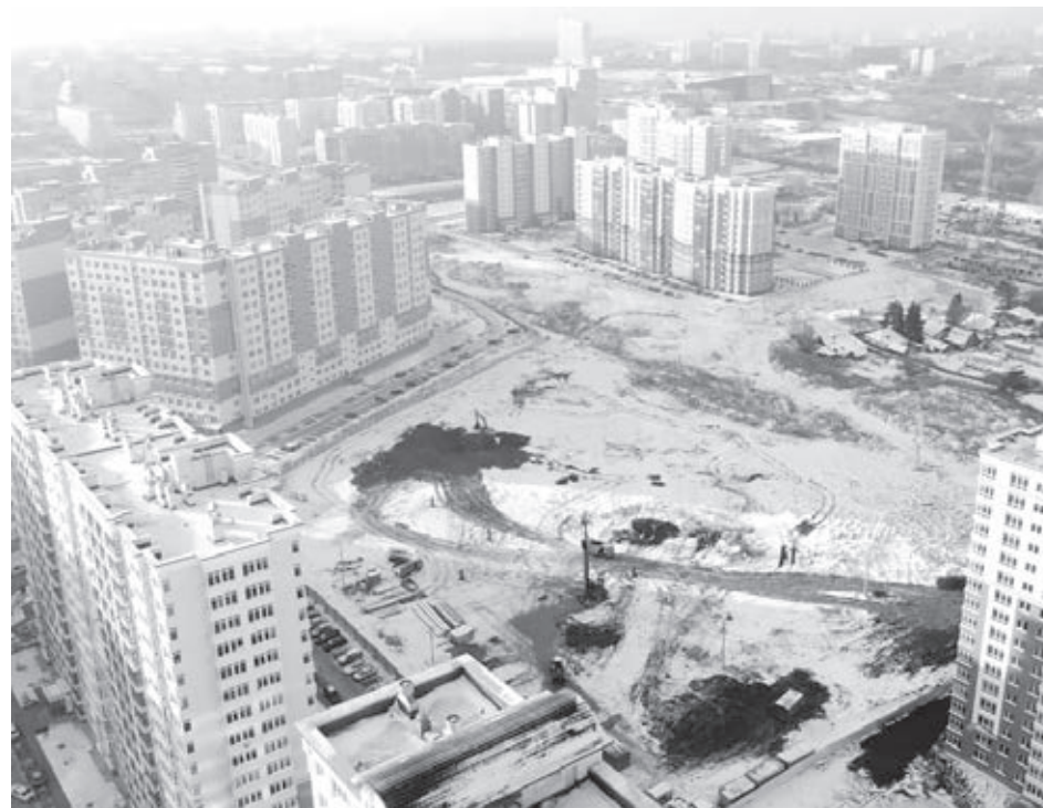
■ По проекту закона, комплексно застраивать и развивать будут территорию, не менее половины которой занято непригодным жильем, подлежащем сносу.

В середине сентября председатель Комитета ГД РФ по транспорту и строительству Евгений Москвичев и группа сенаторов внесли в нижнюю палату парламента проект поправок в Градостроительный кодекс и отдельные законодательные акты РФ. Как говорят авторы законопроекта, его главная цель – ускорить программу расселения ветхого и аварийного жилья в РФ, уводя новую застройку с окраин. «Предусмотренные сегодня Градостроительным кодексом механизмы по комплексному устойчивому развитию территорий малоэффективны, – сказал во время защиты концепции законопроекта на пленарном заседании Госдумы 17 ноября сенатор Олег Мельниченко. – За более чем 14 лет они получили штучное применение. И такая ситуация сложилась по причине отсутствия механизма расселения домов, не признанных аварийными. И законопроект предлагает единый механизм комплексного развития территорий (КРТ)».