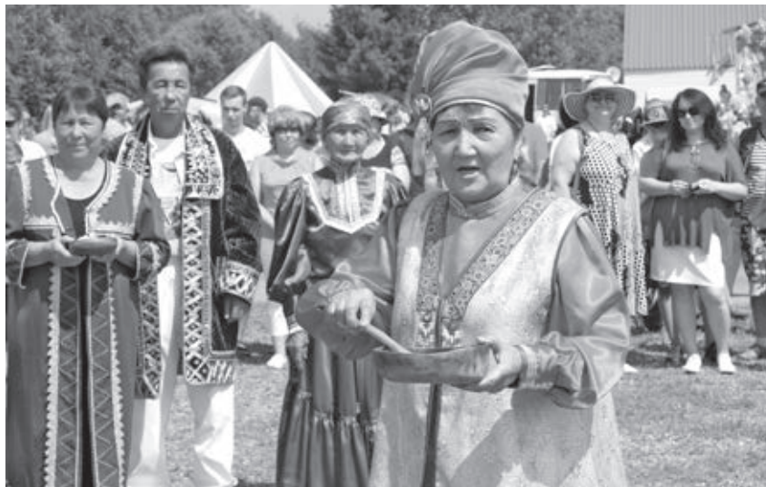
■ Этнографический туризм – одно из направлений, которое развивается в Кузбассе.