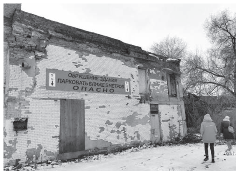
Момент рейда.

О назначении постройки по адресу: Володарского, 10а/21, в «Молодежке ОНФ» могут только догадываться. Нежилое здание обнес-