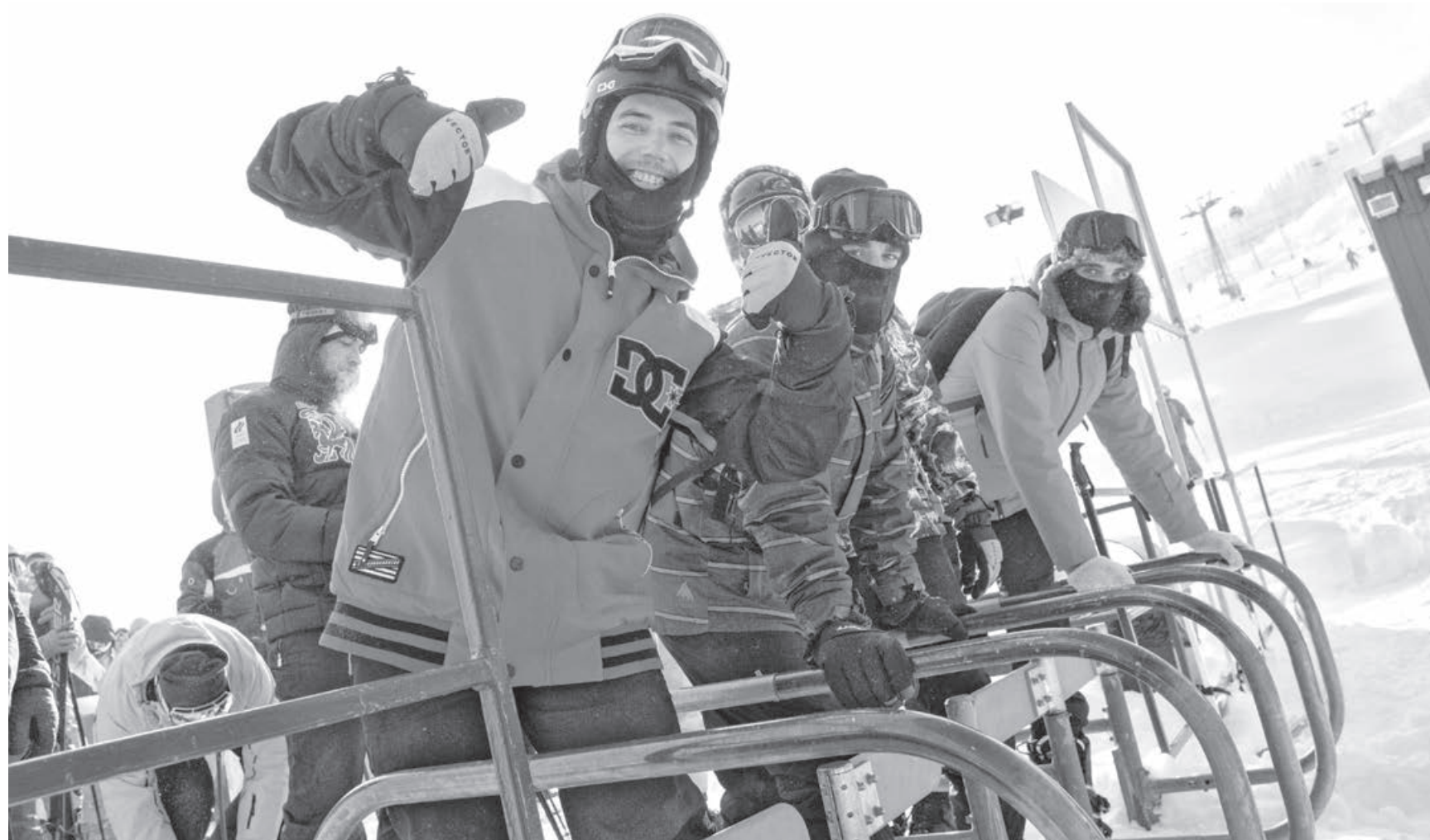
Естественный, легкий и пушистый снег Шерегеша привлекает туристов со всего мира.

С фестиваля «Шерегешфест» в Кузбассе на этой неделе стартует горнолыжный сезон