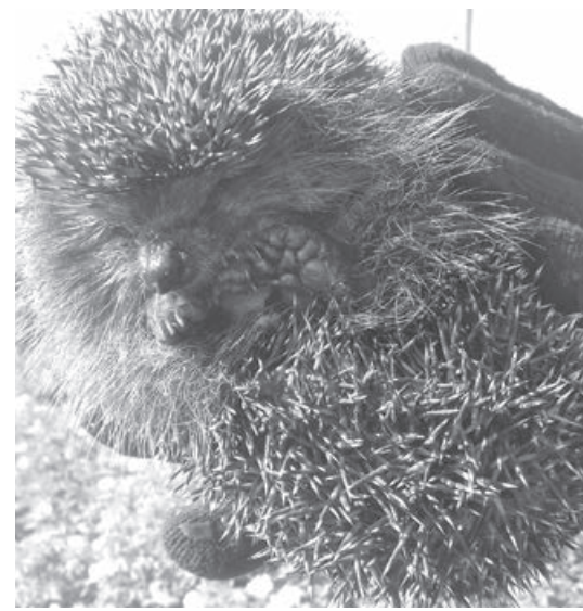
В такую погоду не спится и ёжикам.

Также отмечается, что осенью такие случаи ре-