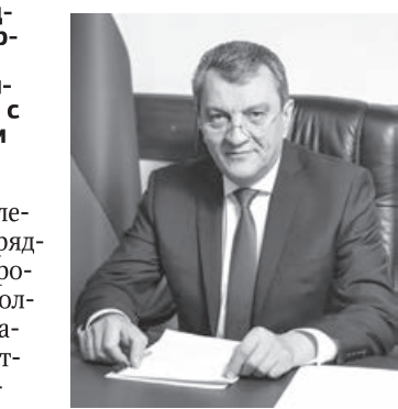
Полномочный представитель президента Российской Федерации в Сибирском федеральном округе С. Меняйло.