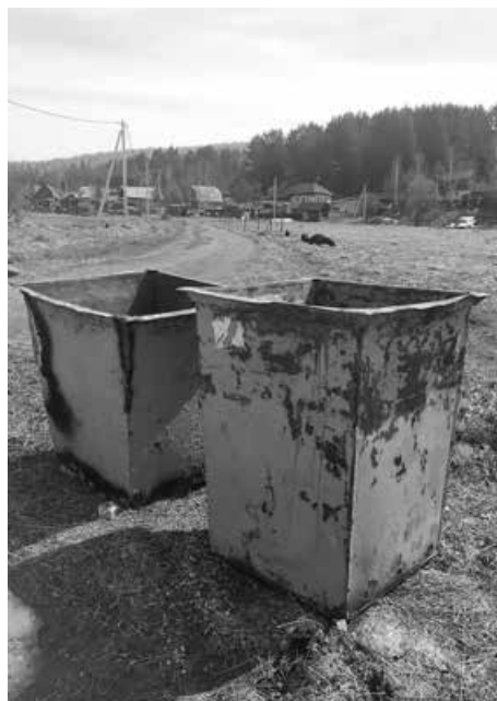
■ Уже полученные контейнеры – не новые, но хорошо, что появились хоть они.

Также в постановлении №1039 говорится, что места накопления отходов должны соответствовать требованиям