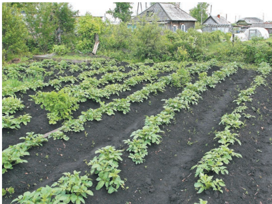
■ Картофель – четвертая по популярности продовольственная культура в мире (уступает только рису, пшенице и кукурузе). А у нас в Сибири и за пальму первенства поспорит!