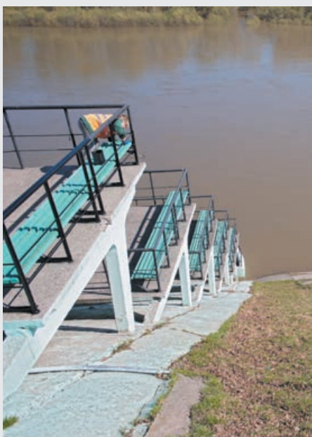
■ Выходить на «большую воду» пока нельзя!