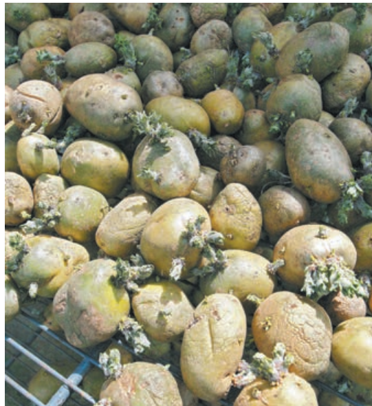
■ Для посадки лучше использовать проросшие клубни.

Поливается и пропалывается картофель на его участке только по мере необходимости. При этом начинающим огородникам опытный хозяин напоминает, что поливать эту культуру следует вечером, когда уже спадает жара.