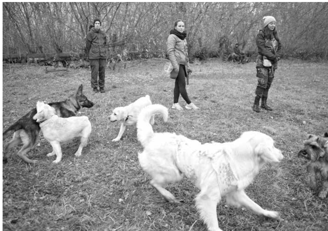
■ Выгул собаки – легальная возможность выйти из дома во время обязательной изоляции.