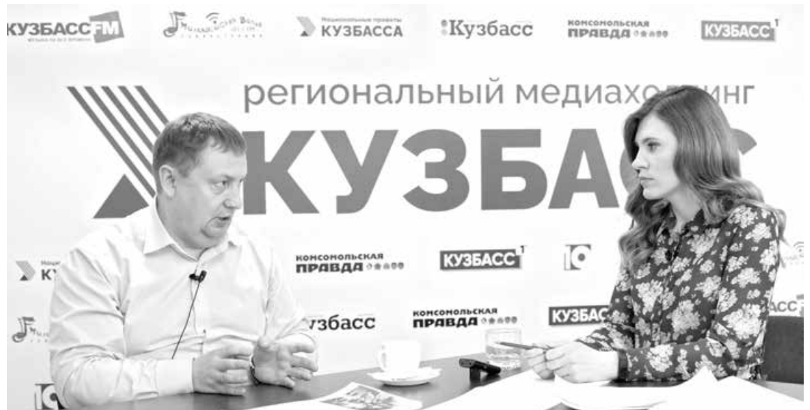
■ Полное интервью смотрите на YouTube-канале «Кузбасса».

– У нас такой продукт есть, и к нам обращались несколько предпринимателей, но ни один из них не относился к отраслям, определенным правительством как пострадавшие. И только поэтому им было отказано в предоставлении