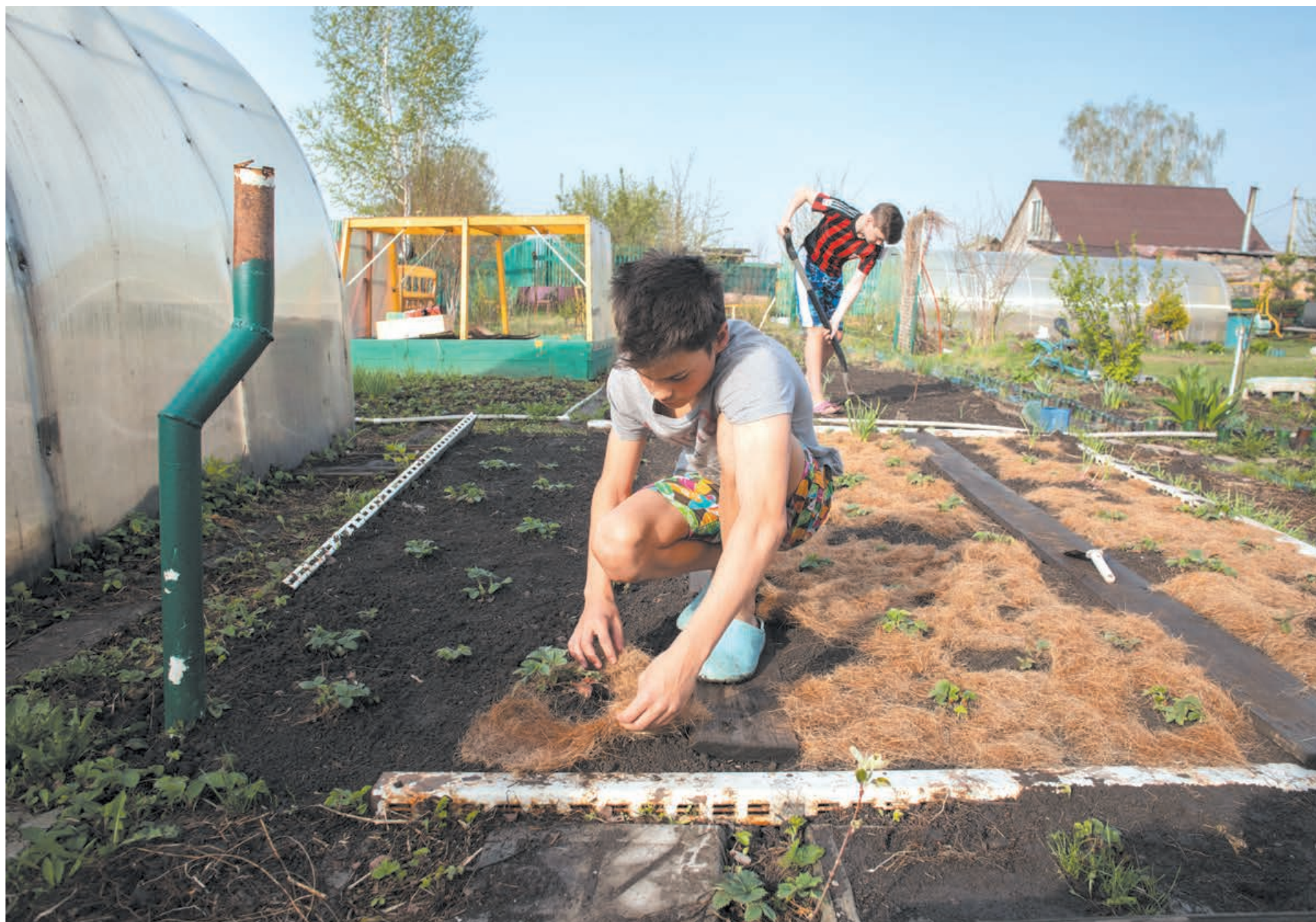
Дачный сезон только начинается, но у тех, кто без проблем может попасть на свой участок, уже переделано много дел.