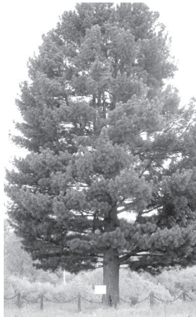
Кедр, растущий в городе Берёзовском, уже стал известен на всю Россию.