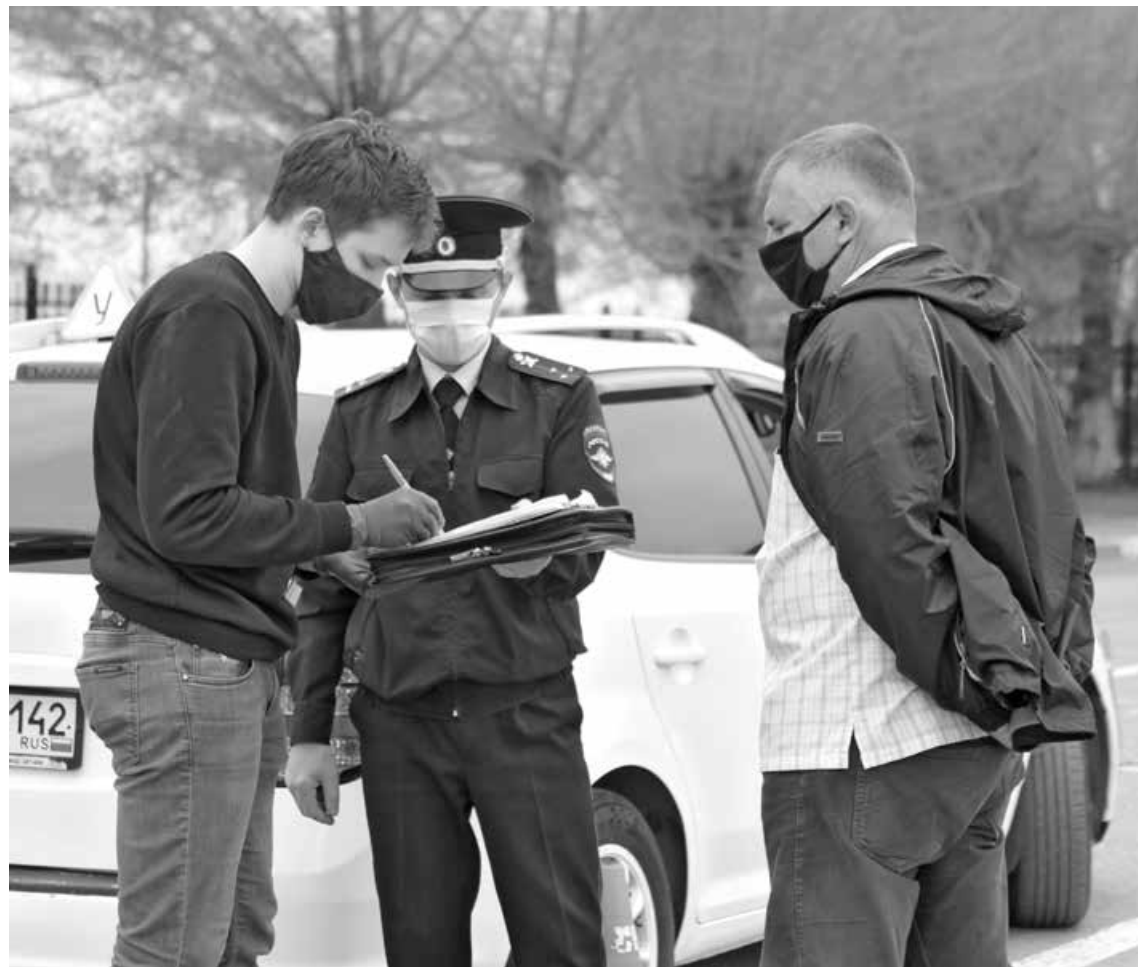
■ Госавтоинспекция Кузбасса и сейчас проводит прием экзаменов на право управления транспортом.