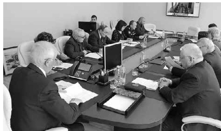
■ Первое онлайн-заседание областной комиссии по помилованию.

Однако специальная палата в одной из колоний общего режима уже подготовлена. Хорошо, если она так и останется пустышкой. Приобретены и тесты. Есть и своя (то есть находящаяся в одной из колоний) лаборатория, оборудованная по последнему слову медтехники. Вообще, стоит отметить, что и до карантинных мер лечением осужденных занимались основательно. До зоны некоторые и не знали о своих «букетах» болезней. Ведь на воле задумываться о здоровье было некогда. Если что, «лечились» алкоголем или нарко-