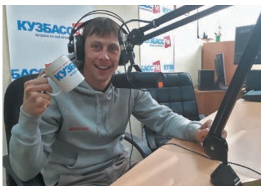
■ Прославленный лыжник Александр Бессмертных – в числе лучших друзей радиостанции.