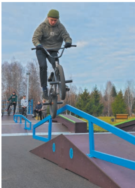
Скейт-парк облюбовали и велосипедисты, и экстремалы.