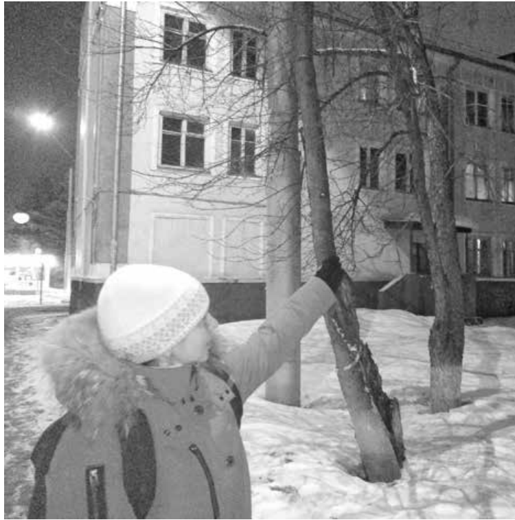
■ Мама показывает то самое окно эвакогоспиталя (третий этаж, горит свет), которое вспомнил сын...

Тогда, в 2007-м мама с ребенком, только переехав, еще ни с