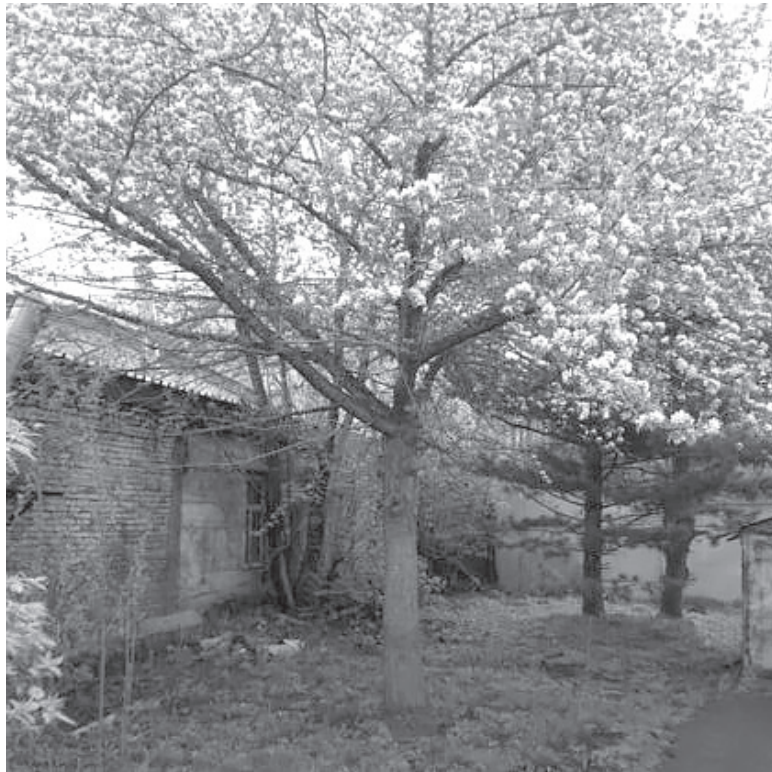
■ Яблони зацвели в Кемерове.

«Действительно, из-за мощной волны тепла, которую принес антициклон из Южного Казахстана, в Кузбассе в апреле 2020 года отмечаются очень высокие температуры – до +30 градусов. Мы еще не считали, но по предварительным оценкам, средняя температура третьей декады месяца будет значительно выше нормы. Благодаря этому практически летнему теплу вегетация началась раньше средних многолетних сроков примерно на две-три недели», – поясняет начальник отдела гидрометеобеспечения Кемеровского гидрометцентра Светлана Наумова.