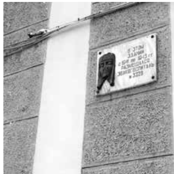
■ Новокузнецк. Памятная доска на Кирова – об эвакогоспитале № 3329.