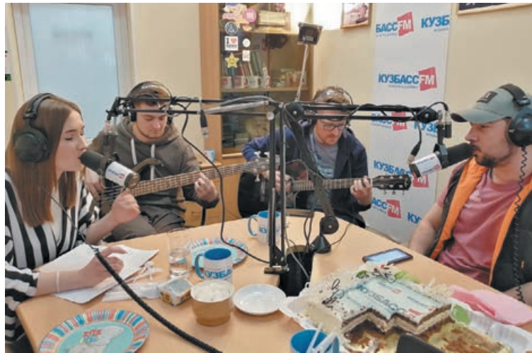
■ Живой звук – в прямом эфире (год назад, 19-й день рождения радиостанции).

За 20 лет много воды утекло: какие-то программы продолжают годами, другие – уже в архиве, но не забыты. Менялся и коллектив – это неизбежно. Но свое лицо самая кузбасская радиостанция сохранила. Наверное, поэтому и слушатель здесь – преданный и, несмотря на нынешнее большое число радиостанций в FM-диапазоне, выбирает именно эту, любимую частоту. (Уточним, что «Кузбасс FM» вещает на всей территории региона, но в разных городах использует разные частоты.