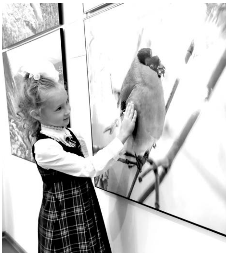
На ближайшем заседании Парламента Кузбасса рассмотрят проект закона, дающего право всем многодетным семьям бесплатно посещать музеи.

По данным областного департамента социальной защиты населения, на региональном уровне для семей, имеющих трех и более несовершеннолетних детей, установлены специальные меры социальной поддержки: 30-процентная скидка на оплату коммунальных услуг; бесплатные лекарства, приобретаемые по рецептам врачей, для детей до 6 лет; ежемесячная денежная выплата в размере 1000 рублей; областной материнский капитал на улучшение жилищных условий семьи (130 тыс. рублей); ежемесячная денежная выплата при рождении третьего ребенка или последующих детей до достижения ребенком возраста трех лет и другие меры. Кроме того, нуждающимся семьям ежемесячно выплачивается пособие на каждого ребенка. С 1 января 2020 года размер пособия увеличен на 10% и составляет от 340 до 780 рублей в зависимости от категории и состава семьи.