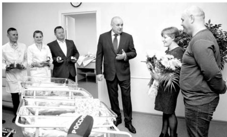
В Кузбассе более 50 тысяч семей имеют троих и больше детей.

Бюджет несет большие затраты на содержание сирот в детских домах. При этом детей, оставшихся без родителей, в них около 10%. 50% – это социальные сироты, мать и (или) отец которых лишены родительских прав. А еще 40% детей попадают в детдома, потому что семья оказалась в трудной жизненной ситуации. «Поэтому мы должны решать проблему не помещением детей в детские дома, а другим комплексом мер, который в том числе можно реализовать через учреждения соцзащиты, – считает депутат. – Сейчас создана межведомственная группа, где структуры образования, соцзащиты и здравоохранения