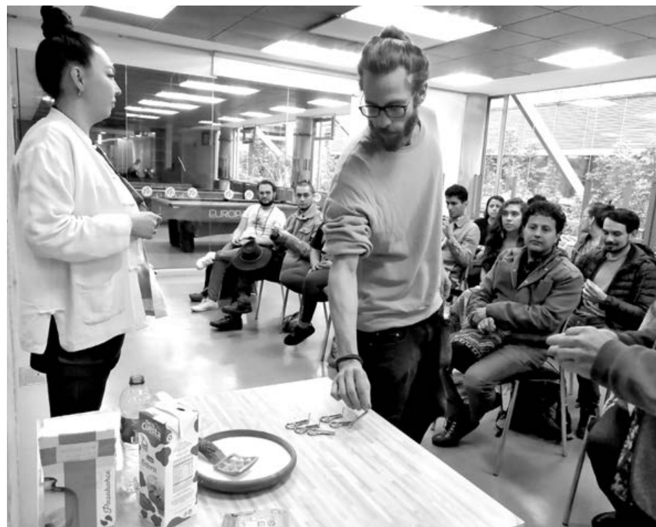
■ Желающие принять участие в мастер-классе сибирячки с любопытством разбирали привезенные ею комузы.