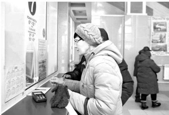
■ За три дня «Сбербанк» оснастил платежными терминалами автовокзалы и станции по всей области.

54 платежных терминала установили во всех кассах девяти автовокзалов, 17 автостанций Кузбасса, а также в автокассах поселков Итатский и Панфилово (Ленинск-Кузнецкий район) и села Красное (Тяжинский район). Таким образом, возможность безналичной оплаты появилась во всех филиалах «Кузбасспассажиротранса». Причем на Кемеровском автовокзале оборудованы все восемь билетных касс, в Новокузнецке – четыре.