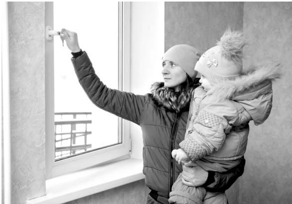
■ Первые кузбасские новосёлы 2020 года осматривают новую квартиру.

Сегодня практически в каждом учебном заведении есть кабинет, где дети осваивают азы программирования, а в школе №6 создан класс не просто информатики, но и робототехники – единственный в Мариинском районе. Для обучения иностранным языкам приобретён мобильный лингфонный комплекс, в музыкальном классе появилось электронное фортепиано – здесь будут проходить занятия в рамках дополнительного образования, посещать их смогут все желающие юные горожане. А педагоги будут помогать коллегам из других образовательных учреждений муниципалитета осваивать новейшее оборудование. К слову, на ремонт и оснащение школы №6 было потрачено около 150 миллионов рублей.