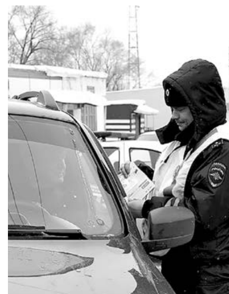
■ Внимание, идет операция!