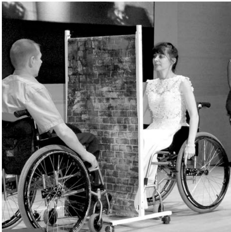
■ Кадр из того самого танца, со свадьбы...

– И в пути сломалась запчасть, которая колесо держала. И всё. Ушли в кювет. Я сидел сзади. Когда всё закончилось, меня зажало вниз, на полу, и я