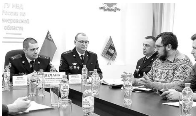
■ Момент брифинг-конференции.

«Нельзя забывать один очень важный факт: любой сотрудник Госавтоинспекции в первую очередь всегда остается полицейским. Управление ГИБДД – это структурное подразделение Министерства внутренних дел. Наши сотрудники имеют полное и законное право задерживать подозреваемых в преступлении граждан. Часто мы работаем совместно с другими правоохранительными и надзорными органами, например, с инспек-