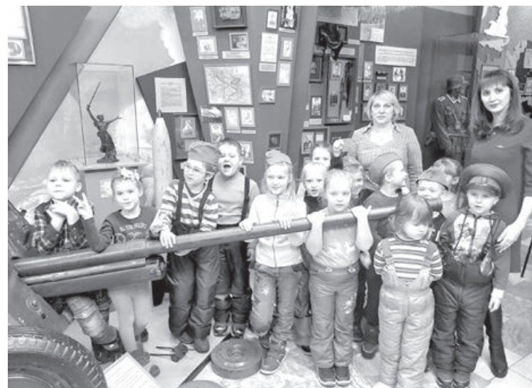
■ Уроки мужества в отделе военной истории Кемеровского областного краеведческого музея собирают даже самых маленьких «почемучек».