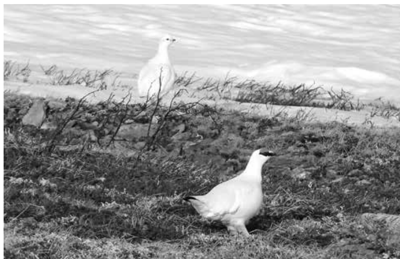
■ Тундряная куропатка, занесенная в Красную книгу Кемеровской области.

Вчера в России отмечали День орнитолога. Это особый день для работников заповедника «Кузнецкий Алатау», где обитает много редких пернатых.