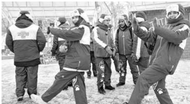
Подведение итогов акции в Кемерове превратилось в весёлый праздник.