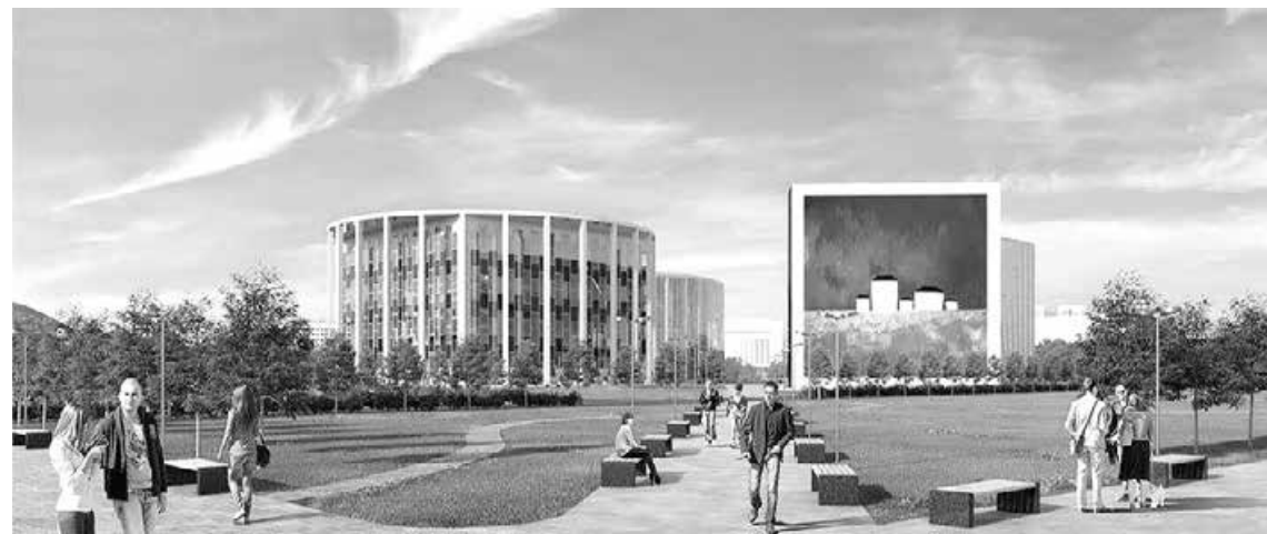
Вот так будет выглядеть Сибирский кластер искусств в Кемерове.