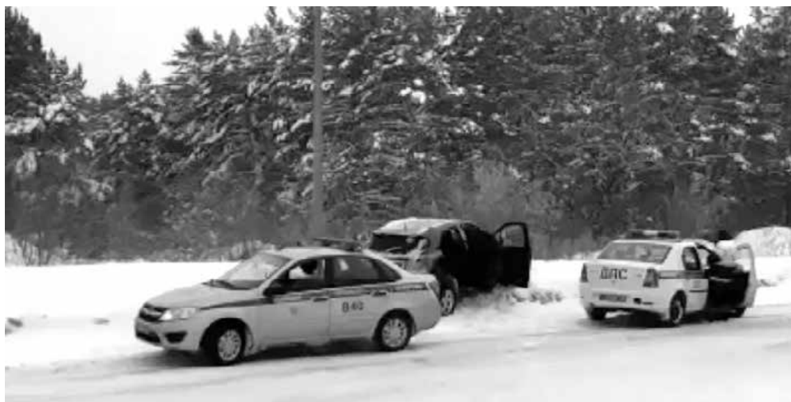
■ Угнанное авто в кювете.

автомобиля – это когда машина была припаркована в малоллюдном, слабоосвещенном месте, да еще и без установленной сигнализации. Но бывают и нетиповые случаи. Один такой произошел в Ленинском районе областной столицы.