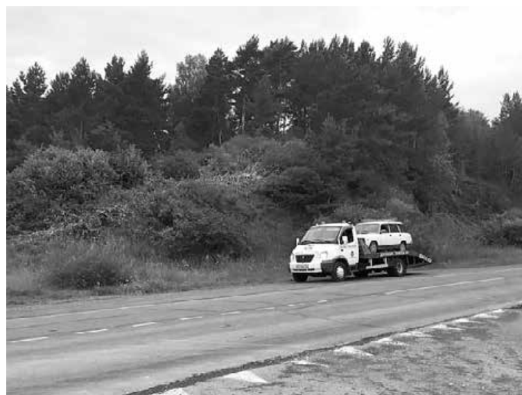
■ Эвакуация автомобиля без пьяного водителя.