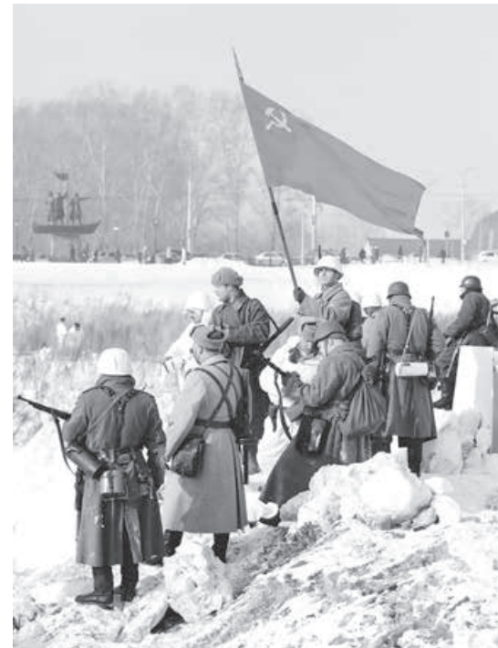
■ Момент реконструкции.