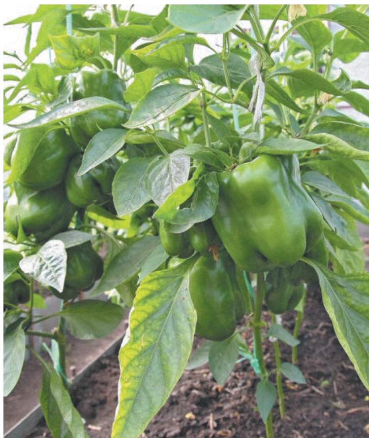
■ Перцы у нас в Сибири лучше выращивать в теплице.

В нашем регионе самыми подходящими являются поликарбонатные теплицы. В них перцы можно высаживать в конце мая или в первой декаде июня – здесь всё зависит от погоды. «Перцам