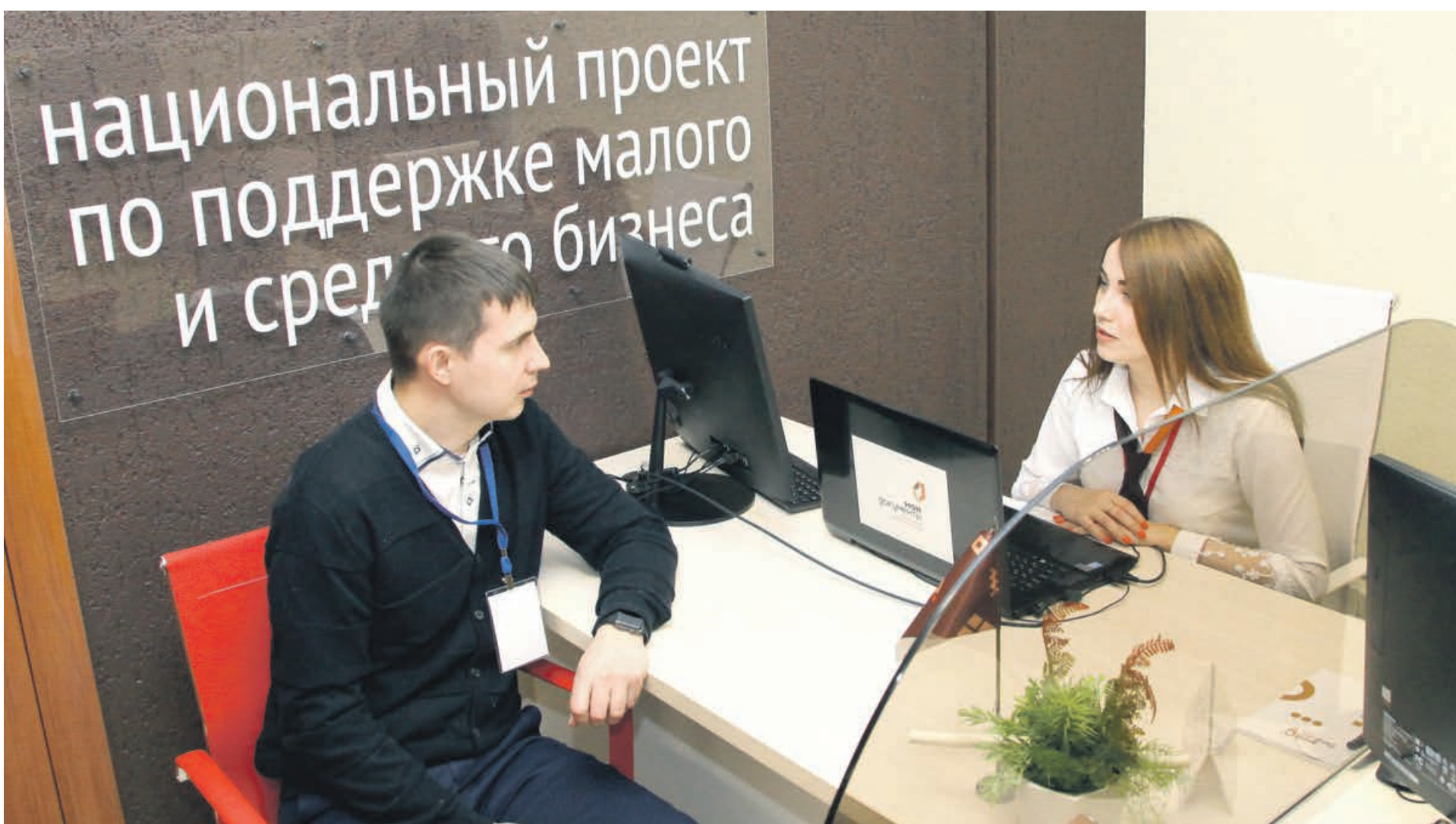
◆ Первый кузбасский «дом предпринимателя» работает в тестовом режиме.