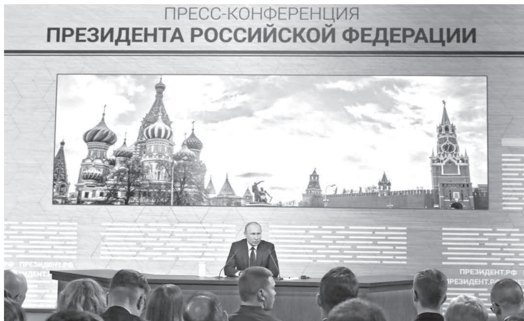
Пресс-конференция Владимира Путина длилась более четырех часов.

В Москве на минувшей неделе прошла Большая пресс-конференция президента России Владимира Путина. Среди журналистов, приехавших в Москву, чтобы задать самые важные для региона вопросы, был и корреспондент нашего издания