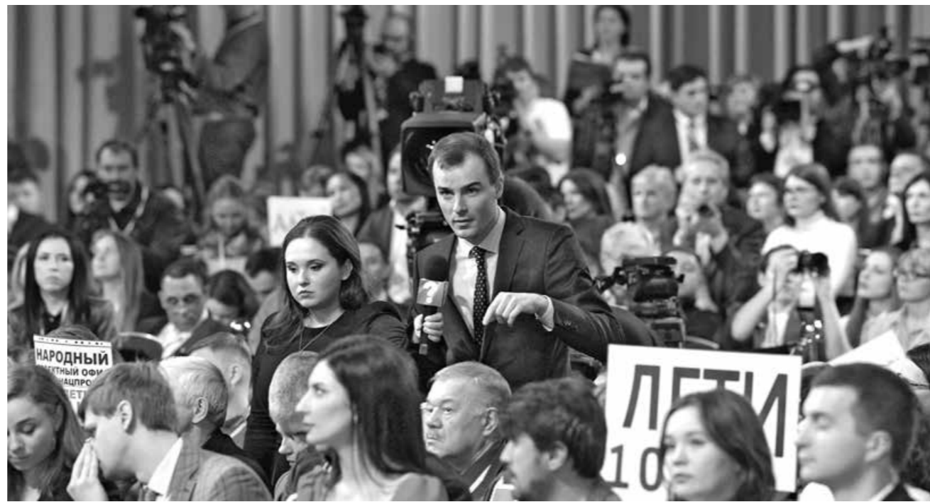
Почти две тысячи журналистов приняли участие в пресс-конференции.