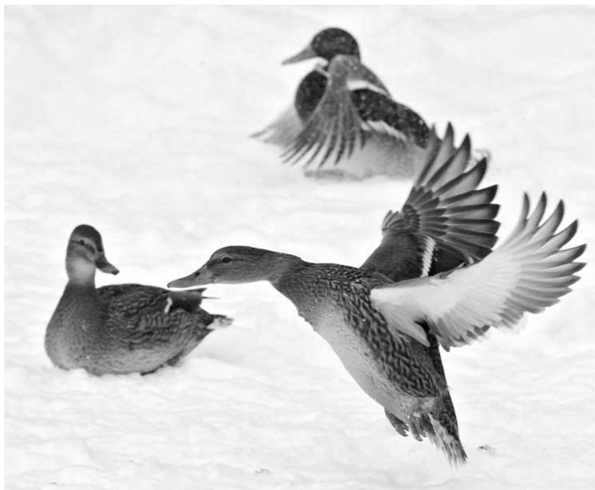
■ По официальным данным, кузбасские охотники сегодня бьют примерно столько же утки, как в годы, когда птиц было в два раза больше.