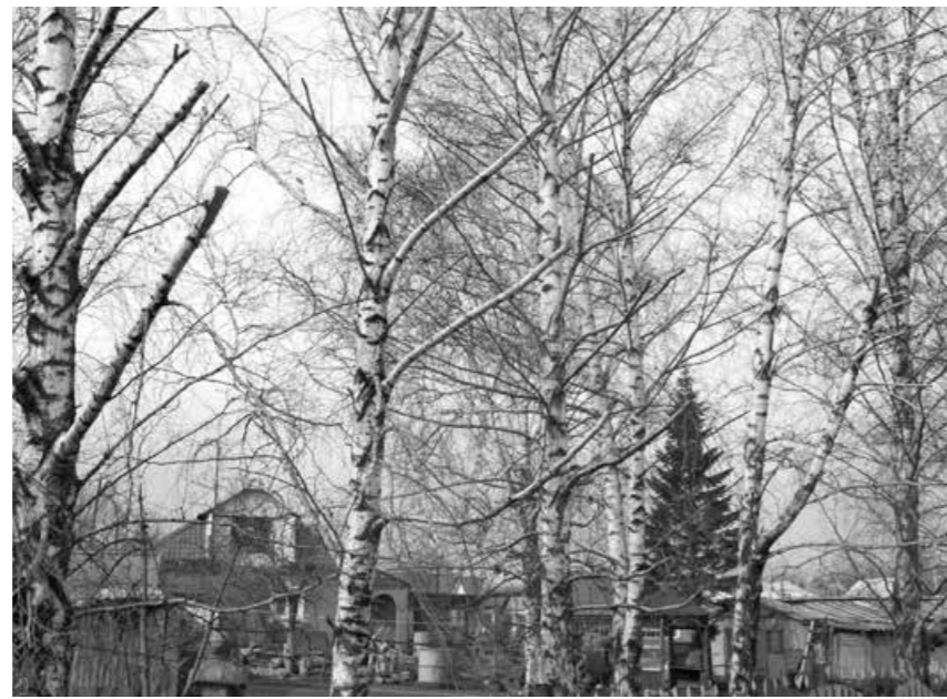
Березы у дома В.Ф. Тумандеева.

Дать более подробный комментарий в организации отказались. К сло-