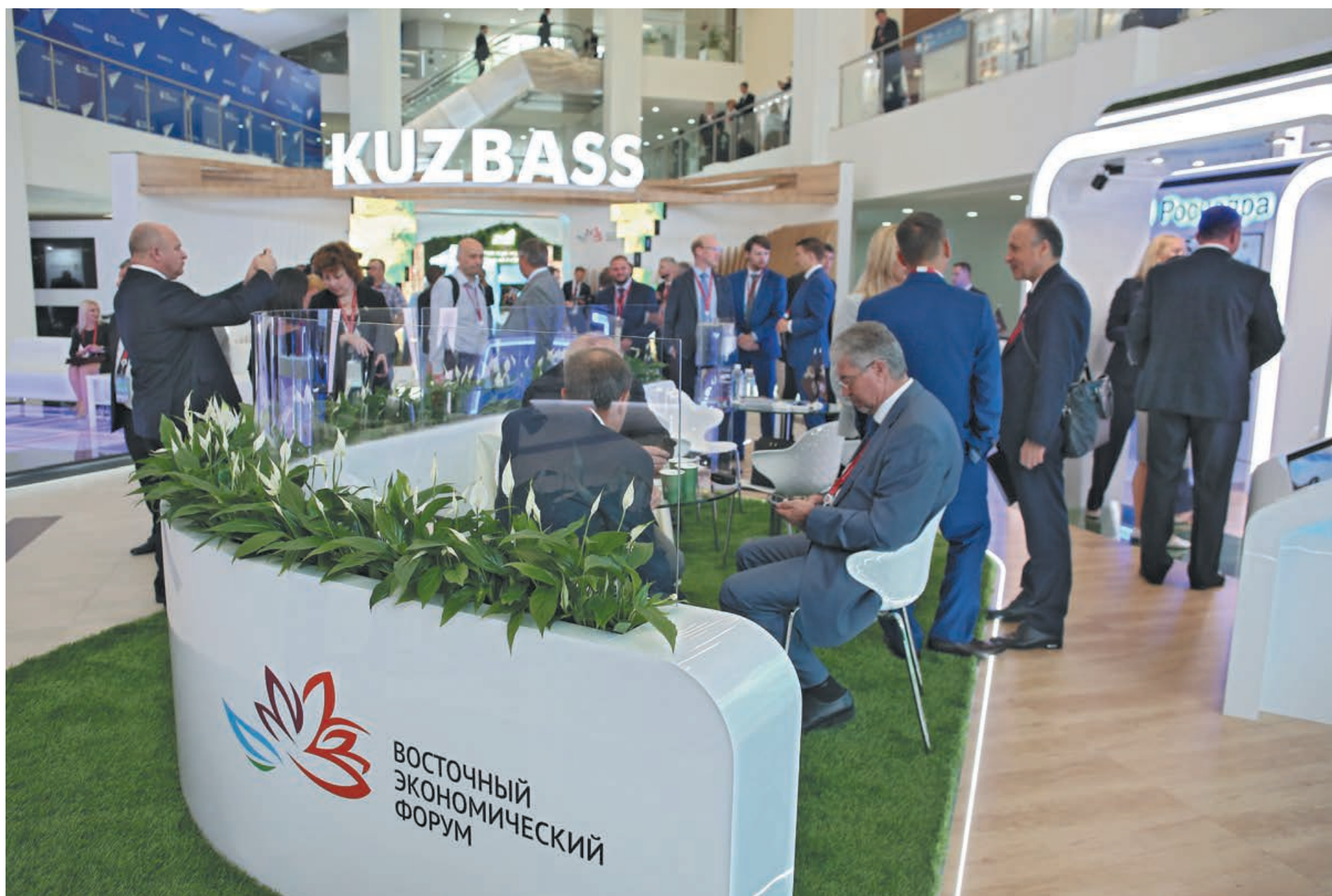
■ Делегация из Кузбасса принимает участие в Восточном экономическом форуме уже во второй раз.