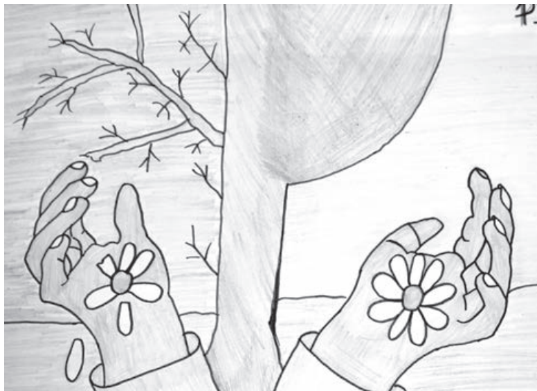
■ Одна из работ, поступивших на конкурс.

А вот гости-горожане смогут приобрести детские работы за ту сумму, которую определяют сами. На вырученные средства медиахолдинг купит энергосберегающие лампы для одного из