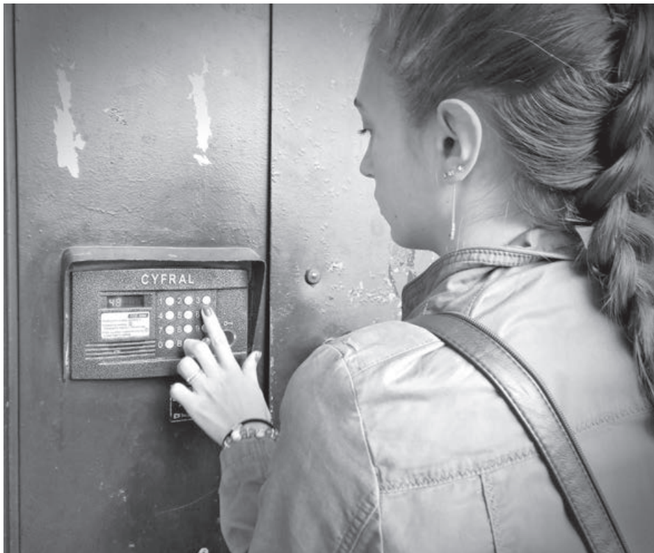
■ Собственники платили за обслуживание домофонов в пользу поставщика, которого не выбирали.

Наша читательница обратилась в суд: как и положено в таких случаях, иск она подала к инициатору собрания. Естественно, та полностью поддержала исковые требования – признать решение недействительным, а председатель собрания и секретарь подтвердили в суде, что к собранию и протоколу никакого отношения не имеют. В отличие от них, представитель РЭУ-7, должным образом уведомленный судом, на заседание не явился.