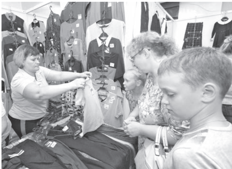
■ Школьная ярмарка в рамках акции «Первое сентября – каждому школьнику» в Кемерове.

Как пояснил Артур Чепкасов, нуждающиеся семьи, которые не попали в число участников областной акции, получают помощь из муниципального бюджета и от спонсоров. Так, по состоянию на