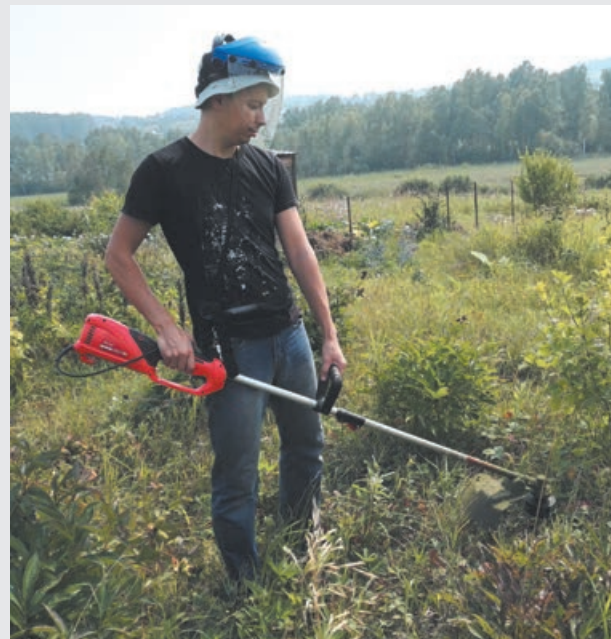
■ Сорнякам – бой!