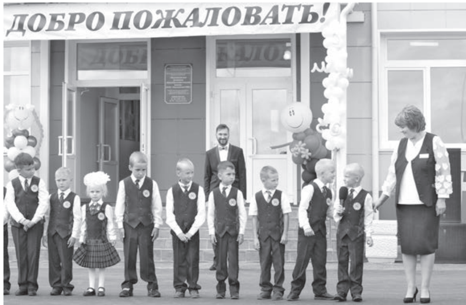
■ Учитель – проводник в Страну Знаний. Обсуждать с ребенком (и тем более осуждать!) эту сакральную фигуру нельзя!

– Общение! Связь между вами. Разговаривать, обсуждать и анализировать школьные ситуации, рассказывать о своей работе, интересоваться жизнью в школе, помогать разрешать конфликтные ситуации. Но ни в коем случае нельзя с ребенком обсуждать учителя – эта тема под категорическим запретом. Если необходимо, родителям лучше поговорить об этом наедине, без детей, чтобы не разрушить важный образ учителя.