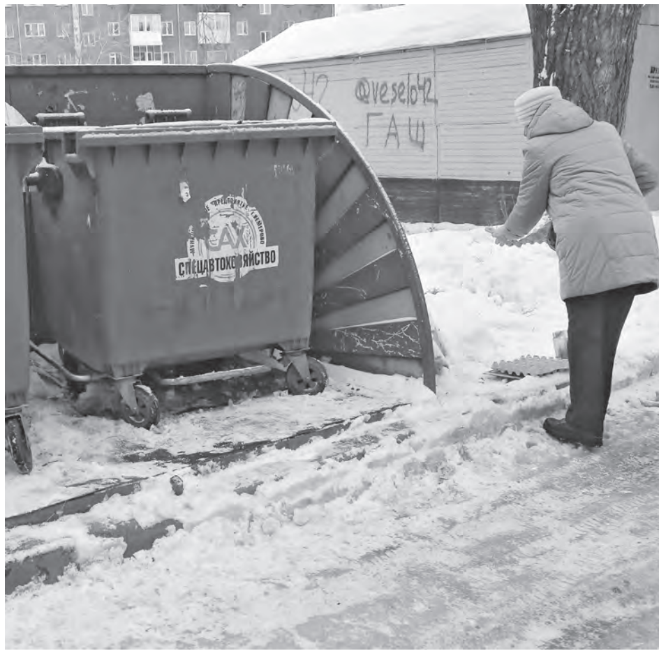
■ С 1 января весь мусор на контейнерных площадках в кузбасской зоне «Север» будет вывозить оператор, но собственники по-прежнему могут сдавать вторсырье за деньги.