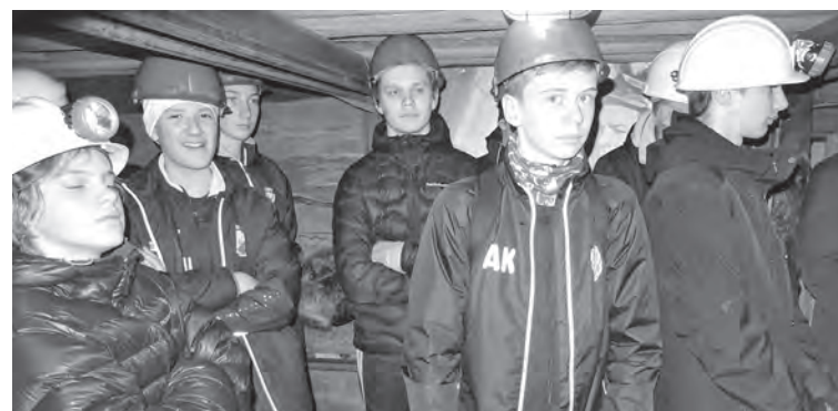
■ На экскурсии в музее.

Почему скандинавы выбрали для поездки именно наш областной центр? Рассказывает старший тренер «Кузбасса»