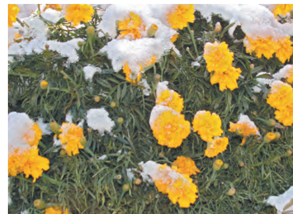
■ Ноябрь уж наступил...