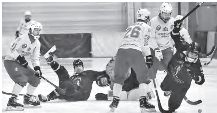
■ Домашний матч «Кузбасса» (в тёмной форме) с «Уральским трубником» прошел в жёсткой борьбе. Одно время на скамейке штрафников едва устроились сразу четыре хоккеиста гостей, что, впрочем, послужило дополнительной мотивацией для «Трубника», одержавшего победу.