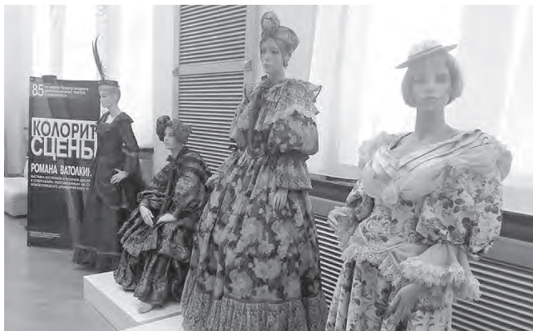
■ Выставка костюмов в Новокузнецком драмтеатре.

«У нас планов всегда много. Стараемся ставить и высокохудожественные спектакли, чтобы не только было интересно, но и театр шагал в ногу со временем, был интересен жителям и гостям города, а также имел вес и в театральном сообществе. Не только в юбилейные годы, каждый год мы анализируем предыдущий сезон, проводим мониторинги, анкетирование среди главного нашего богатства – зрителей. Благодаря им мы существуем, развиваемся и для них работаем», – отметила