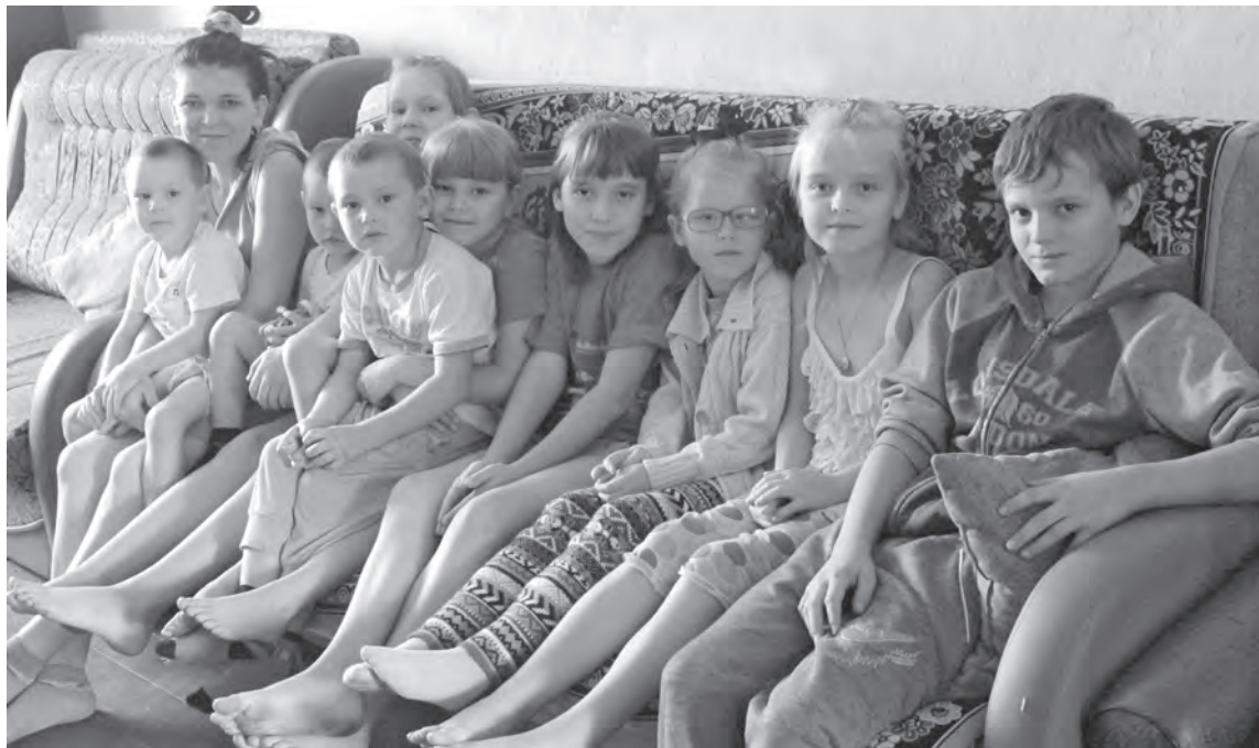
■ В тесноте, но не в обиде.