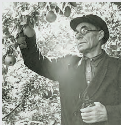
■ Знаменитый прокопьевский мичуринец.