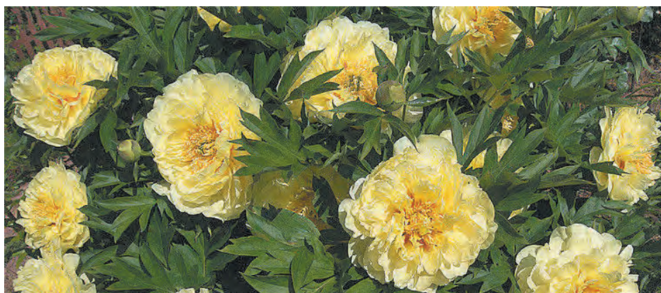
■ ИТО-гибрид пиона – Бартзелла.

Сегодня счет сортов травянистых пионов идет на тысячи: в соответствии с регистром сортов Американского общества любителей пионов, их около 6000. В России среди любителей-коллекционеров широкое хождение имеют около 500 сортов – как зарубежной, так и отечественной селекции.