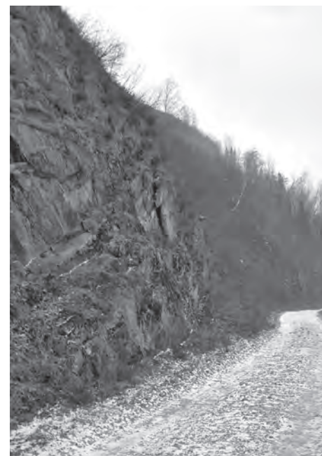
■ Скалка. То самое место, где произошла авария.

на Даньку, выброшенного ударом вперед, очнувшегося в одиночестве и бросившегося за подмогой в село.