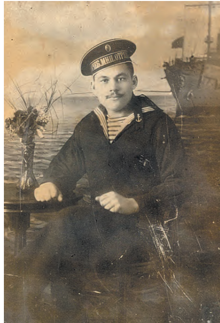
■ Г.Г. Добротворский – матрос революционного экипажа крейсера «Аврора», 1917 г.

Прокопьевск (Спец. корр. «Кузбасса»). В Прокопьевске живет и работает Гавриил Георгиевич Добротворский – бывший старшина-электрик легендарного крейсера «Аврора».