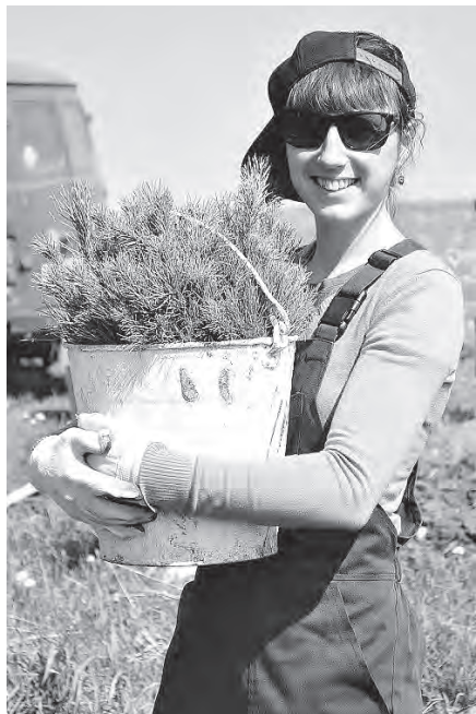
Школьные лесничества помогли бы решить кадровую проблему в лесном хозяйстве региона.

Сегодня в регионе осталось только два школьных лесничества, которые полностью соответствуют критериям Рослесхоза: там подростки трудятся в лесных питомниках, занимаются научно-исследовательской работой, участвуют в юниорском конкурсе «Подраст». Одно из них – «Терсинка» в Новокузнецком районе, при малокомплектной школе в поселке Осиновый Плес. В двух километрах от нее находится Терсинский лесхоз, где школьникам выделено десять гектаров.