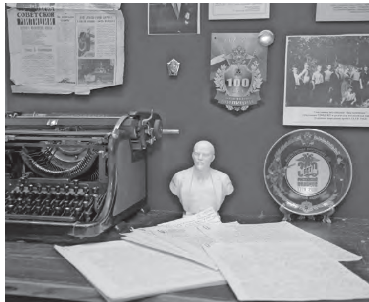
■ Экспонаты Музея боевой и трудовой славы органов внутренних дел Кемеровской области.