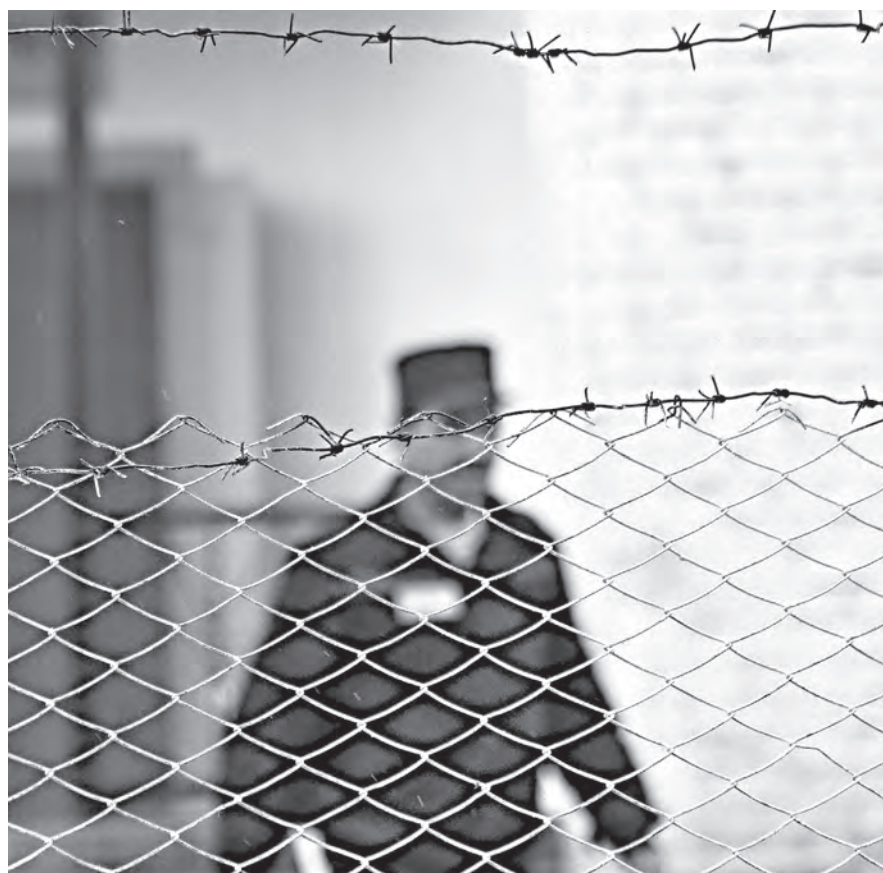
■ За убийство по найму можно получить вплоть до пожизненного лишения свободы.