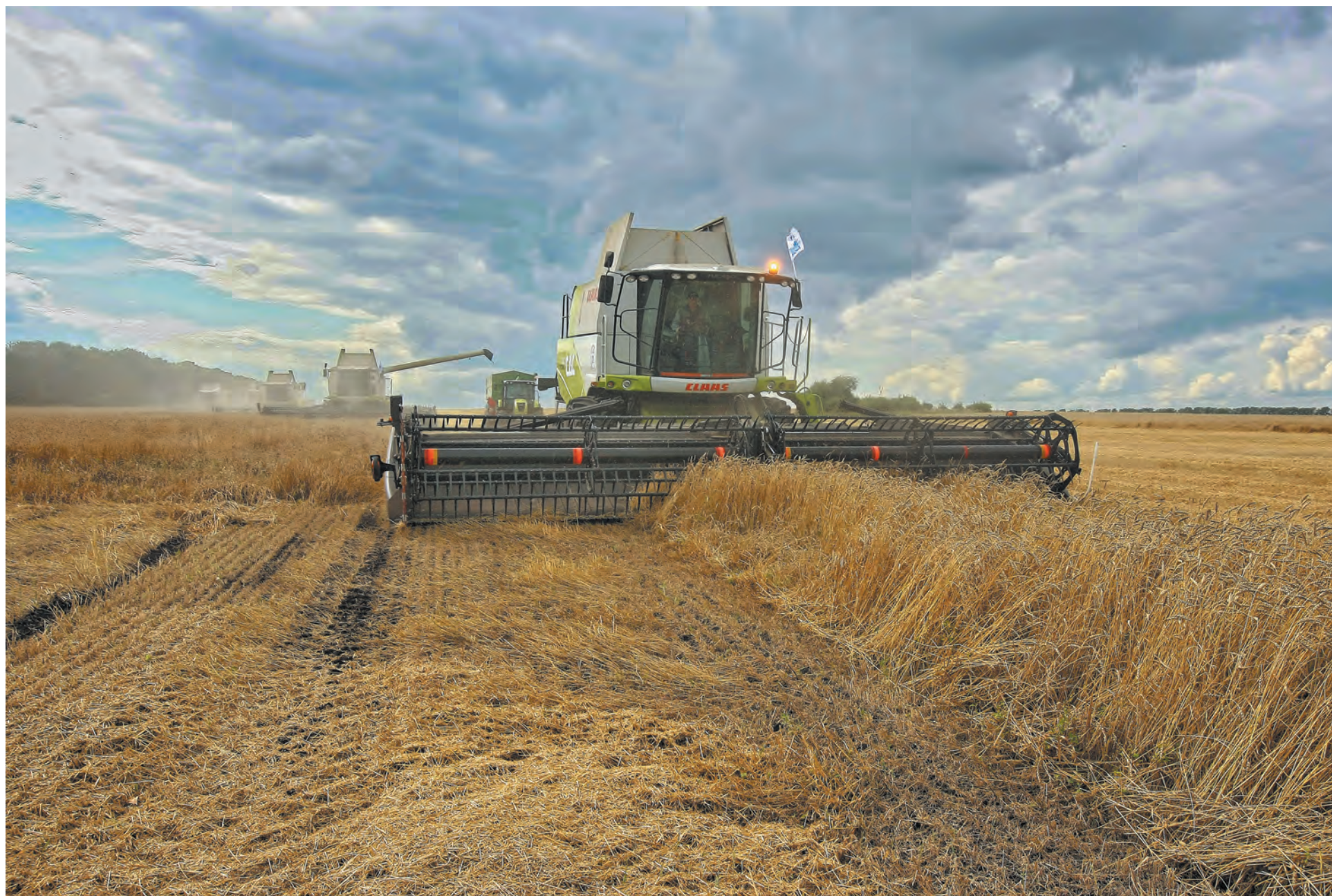
■ Стрда подходит к концу. Повезло бы с погодой!