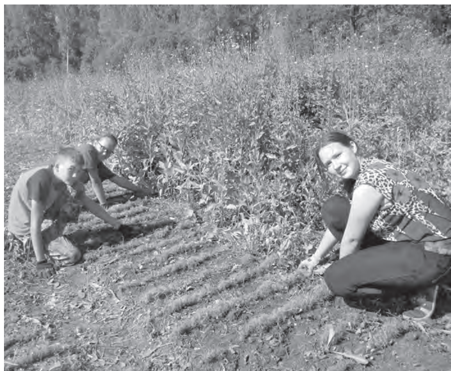
Трудовая бригада «Терсинки» на прополке в сосновом питомнике.