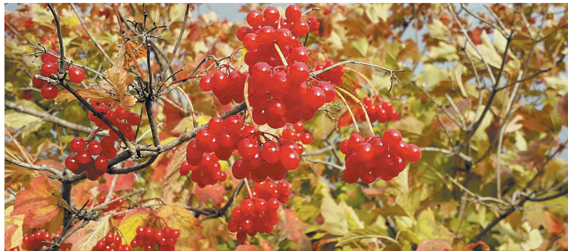
■ Краски осени.