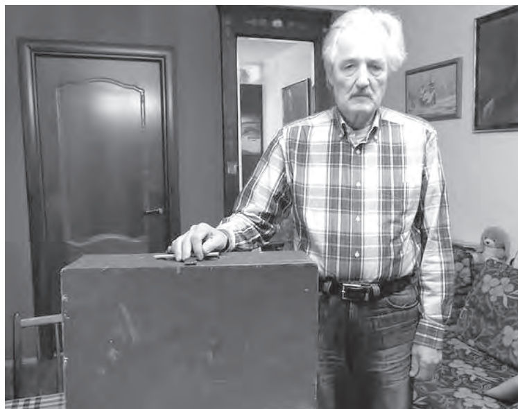
■ Голицын дома с лагерным чемоданом мамы.