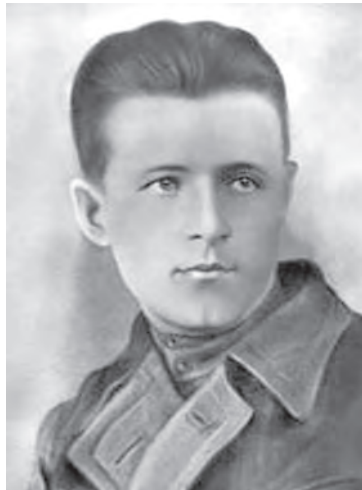
■ Александр Голицын, князь, актер, расстрелян в 1938 году.

«И вот однажды забежала к подруге в магазин. Выходит, смотрит, на крыльце – какой-то че-