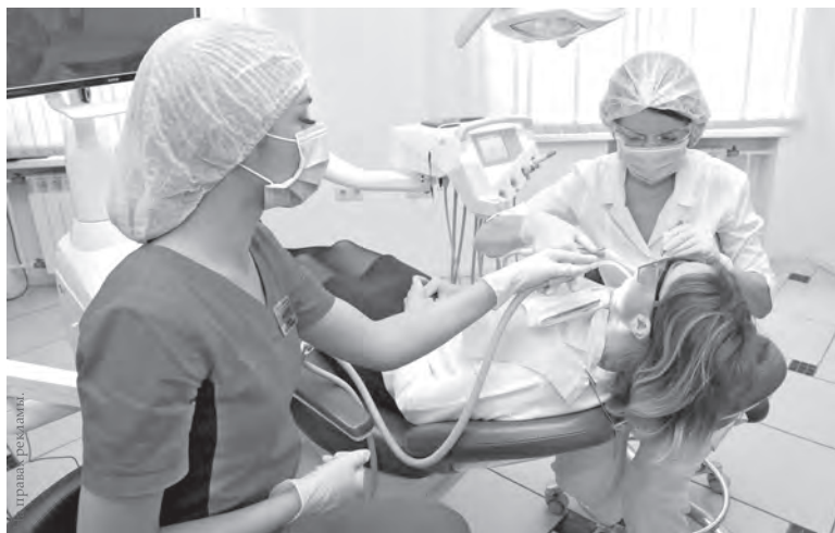
Современный стоматологический комплекс оснащен собственной системой дезинфекции.

Ежедневно ОКСП посещают около тысячи человек, в ее регистратуру поступает более 300 звонков. Внедрение сервиса «электронная регистратура» и установка инфомата в холле поликлиники позволили более рационально организовать потоки пациентов, предоставив желающим возможность для самозаписи на прием через информационный портал «Врач42». Также был организован call-центр для приема телефонных звонков и введена должность администратора. Это сократило очереди в регистратуру и в кабинеты врачей и почти вдвое сэкономило время пациентов.