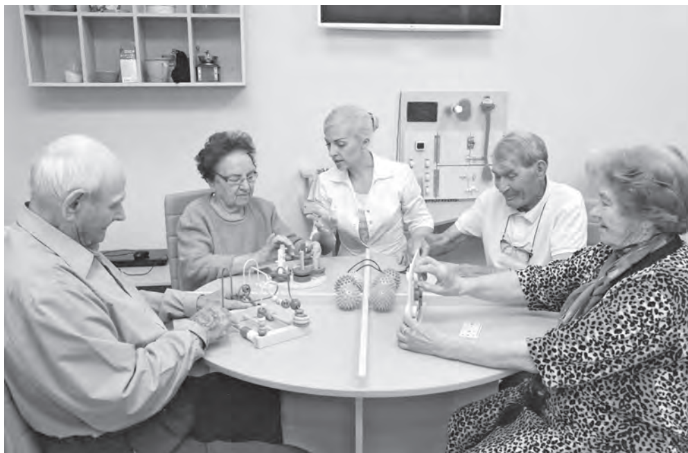
Занятие в кабинете реабилитации.

Лицензия ЛО 42-01-005259 от 21.12.2017 г. На правах рекламы.