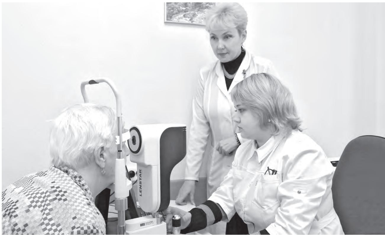
Офтальмологический комбайн для расчета оптики искусственного хрусталика может выполнять сразу три вида исследований.