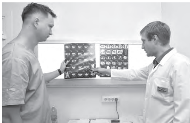
Рентгенологи областной клинической больницы могут выявлять онкопатологию на самых ранних стадиях.

«Что касается исследований брюшной полости, здесь золотым стандартом диагностики является КТ-