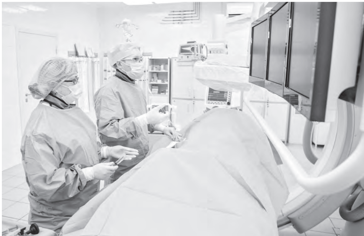
В операционной отделения рентгенэндоваскулярных методов диагностики и лечения.

рым за сутки приходится делать до восьми инъекций и жить в строгой зависимости от режима питания и графика введения инсулина. Недавно эту помощь могли оказывать кузбассовцам только в федеральных центрах. Сейчас данная услуга доступна в Новокузнецкой городской клинической больнице № 1.