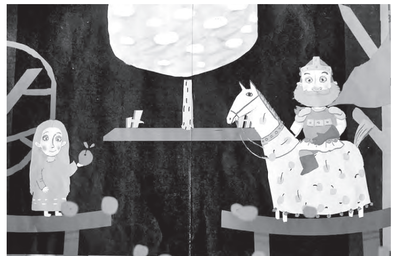
■ Момент спектакля «Крошечка-Хаврошечка».