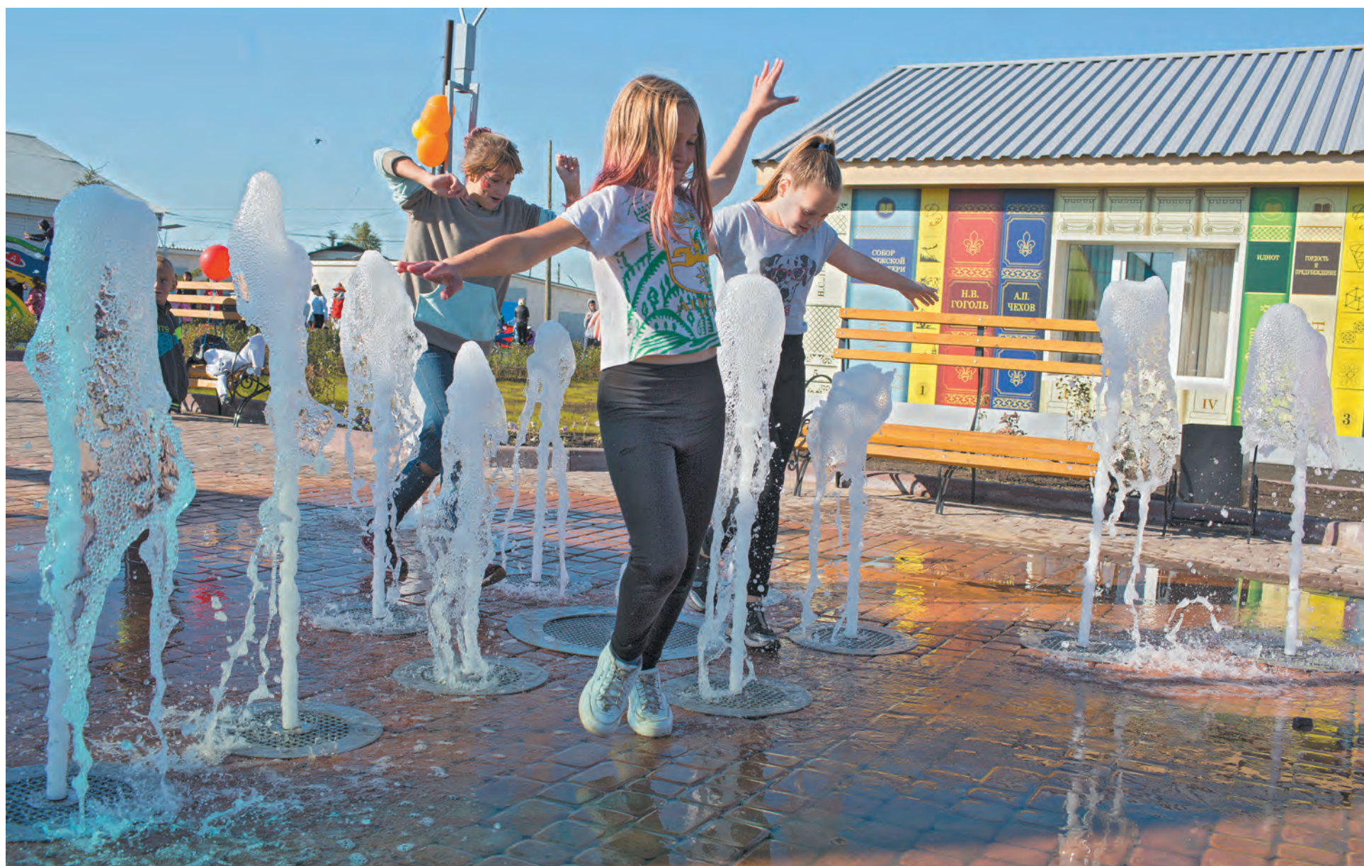
■ Фонтан в новом парке – самый необычный подарок жителям села Берёзово.