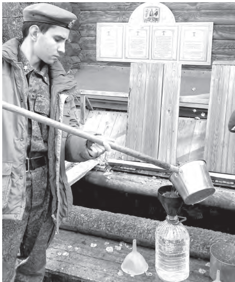
■ Святой ключ, место, где в 1960-х появился в сланце лик Богородицы.