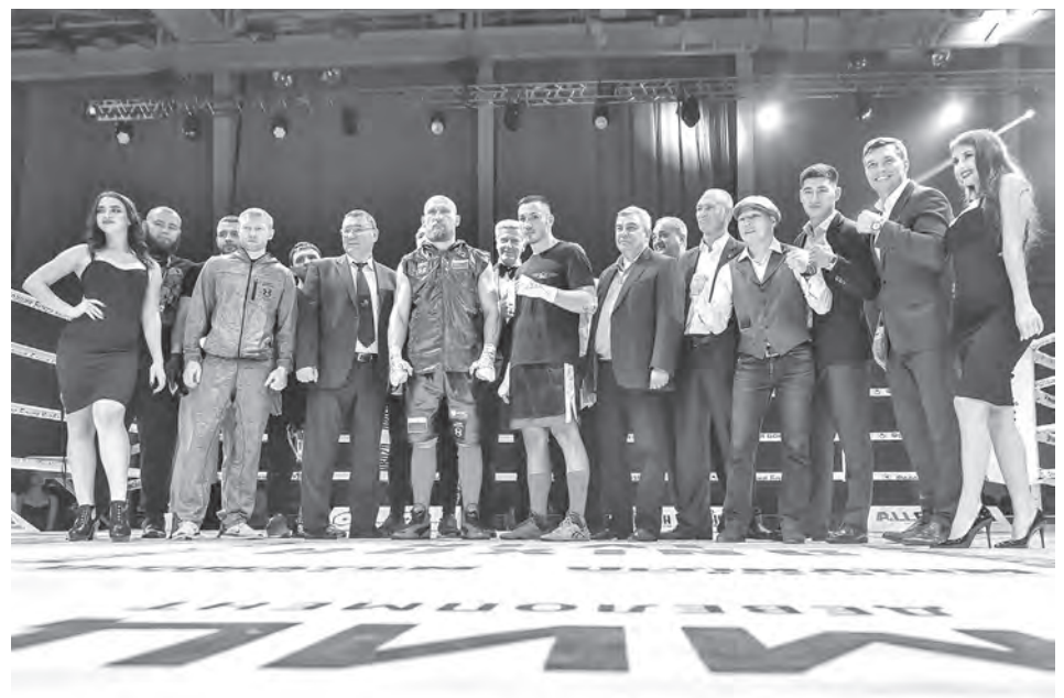
Вечер бокса «Real Boxing» собрал множество почетных гостей и именитых спортсменов.

По мнению президента Федерации бокса, проведение таких мероприятий, как «Real