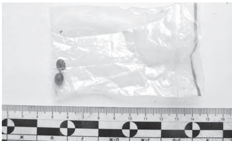
■ Камни из украденных золотых сережек, которые злоумышленник прятал в горшке с цветами. Фото из материалов уголовного дела.