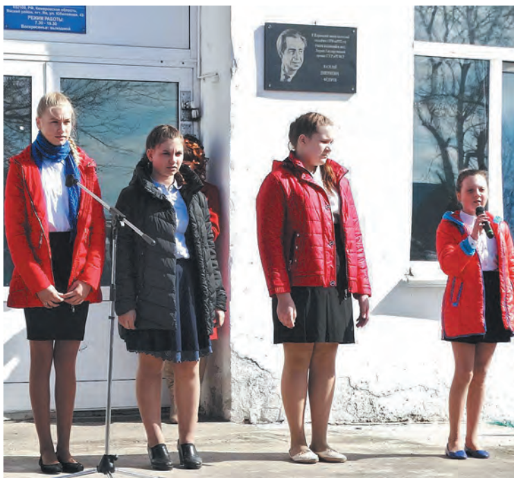
■ Памятная доска на школе.

Или вот еще факт. Первые книги их стихотворений увидели свет с небольшой разницей во времени: у Шарафа Рашидова поэтический сборник «Мой гнев» вышел в 1945 году, у Василия Федорова «Лирическая трилогия» – в 1947-м.