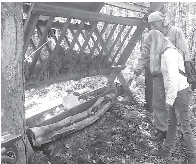
■ Ночью к кормушке на соль приходили лось с лосенком.