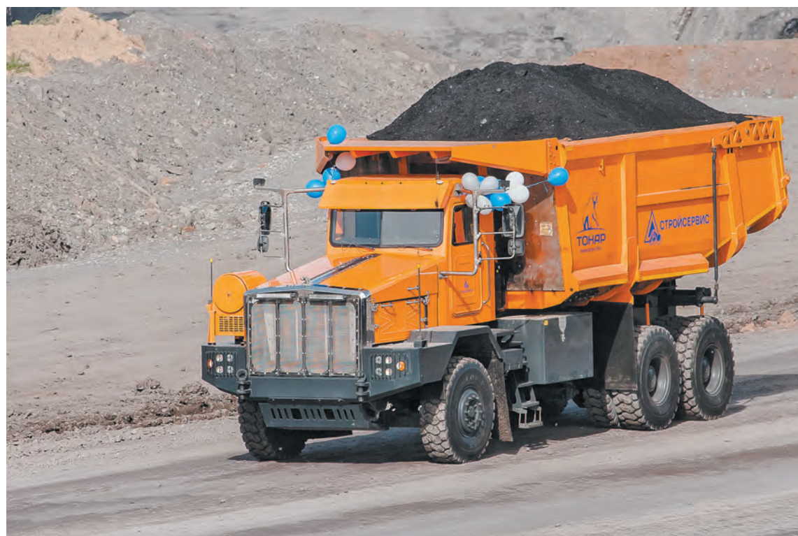
■ ТОНАР-7501 – настоящий 60-тонный «вагон на колесах».