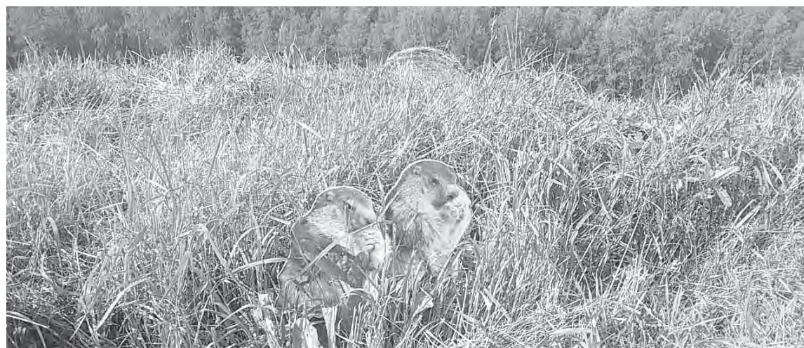
■ Настоящие сурки Кашенко уже крепко спят в своих норах, и в поле – только такие демонстрационные образцы из пластика.