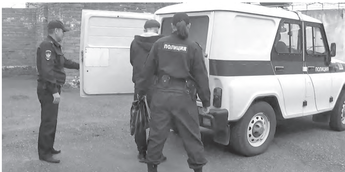
■ В ожидании начала судебного процесса поездной вор находится под стражей в следственном изоляторе.

Дерзость преступника (появление в вагоне под видом пассажира) и особые приметы (наклейки) красноречиво свидетельствовали о его «матерости».