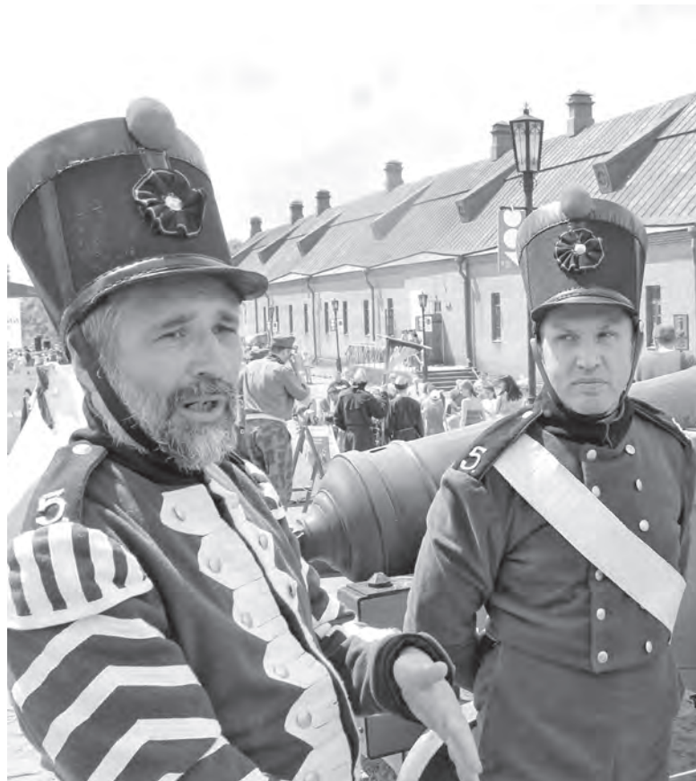
■ Момент фестиваля «Кузнецкий фронтир».

В номинации «Лучший региональный календарь туристического события» победу одержал календарь событийного туризма Кузбасса. Его разработали сотрудники областного центра народного творчества и досуга. В нем представлена информация об основных культурных событиях Кемеровской области. Это такие фестивали и конкурсы как