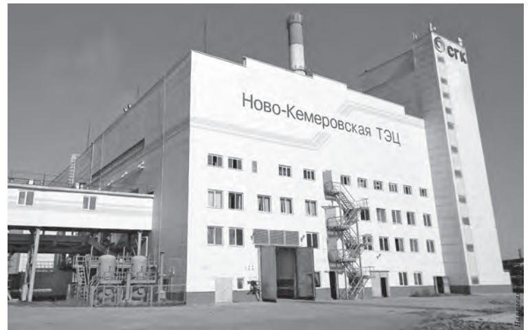
Ново-Кемеровская ТЭЦ обеспечивает теплом 40% жителей левобережной части Кемерово.

Как сообщил, подводя итоги подготовки к осенне-зимнему периоду 2018-2019 года, Юрий