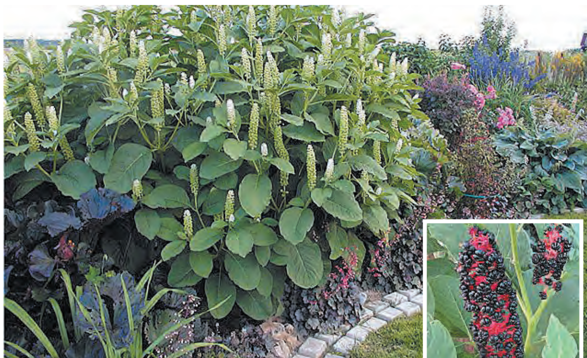
■ Фитолакка цветущая. Плоды фитолакки.