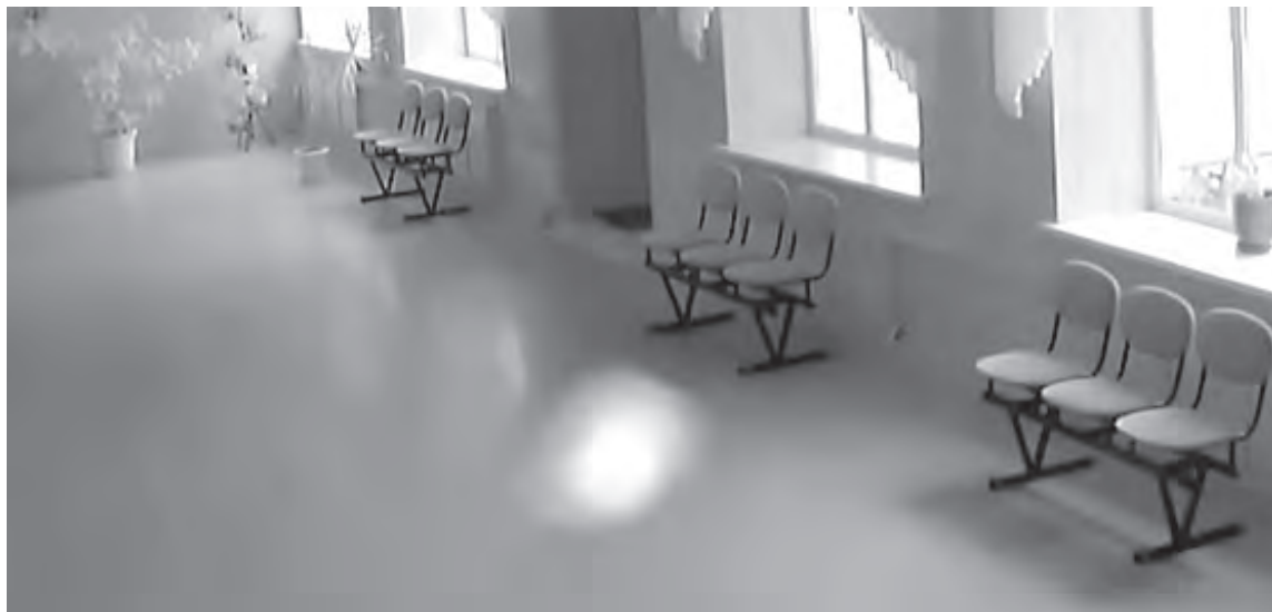
■ Шар не исчез, а вырос в несколько раз и, продолжая летать, показал... бьющие по воздуху крылья!