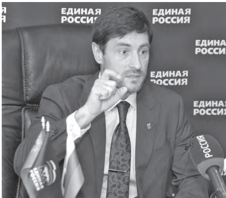
■ В новом составе облсовета региона у «Единой России» – 39 мандатов, 7 – у других партий.