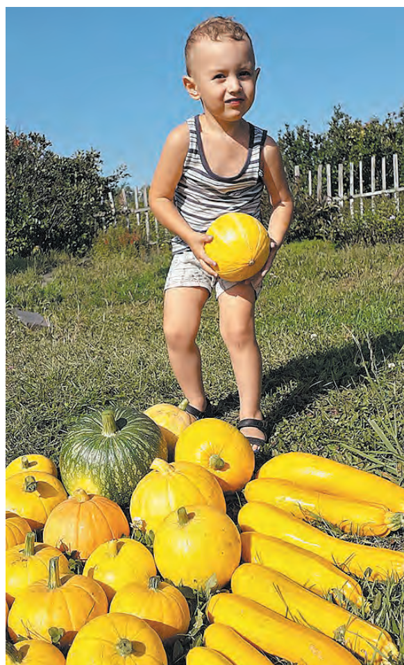
Золото осени.