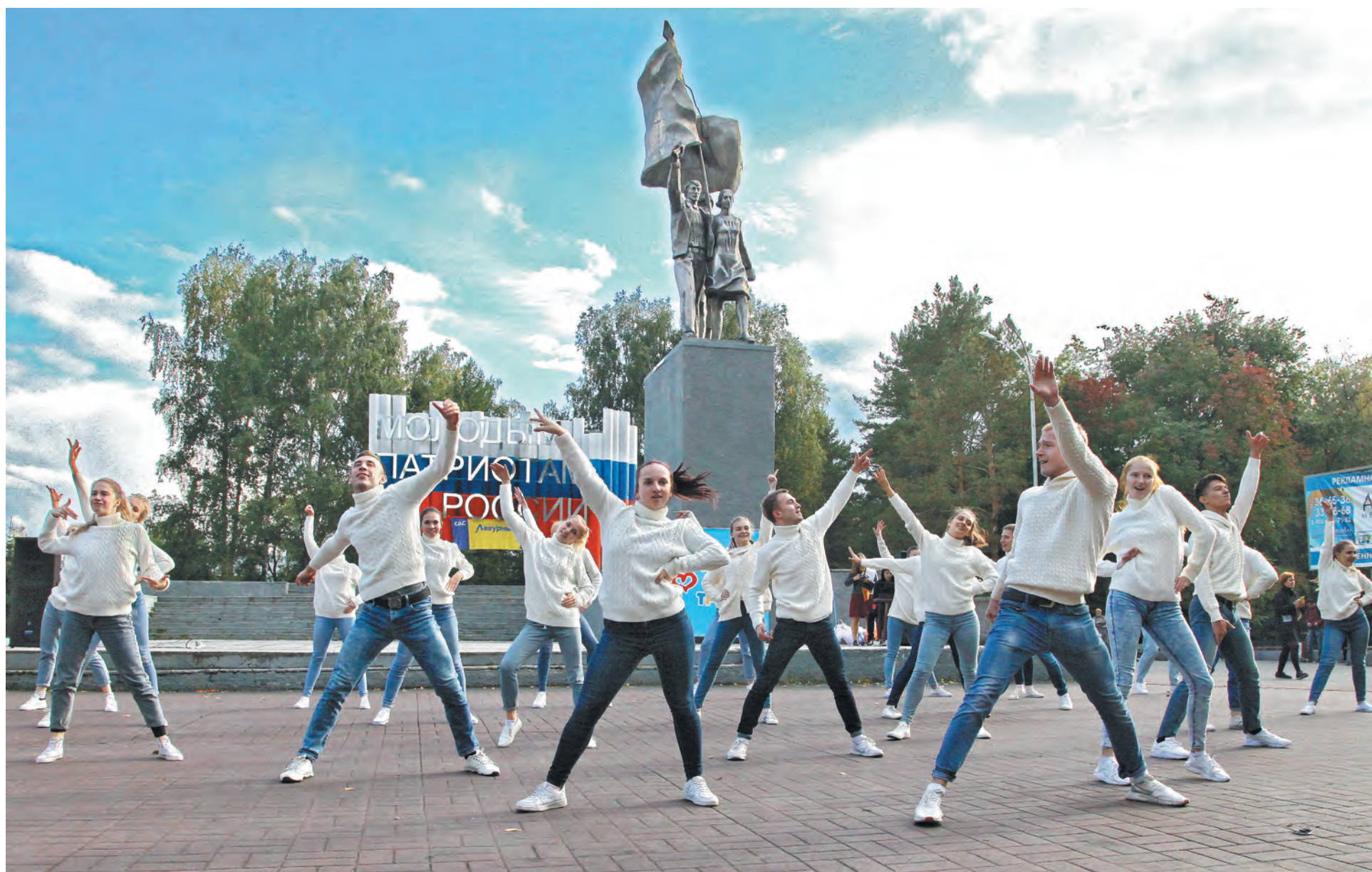
■ На фестивале увлечений и хобби «Радость жить трезво!» гостям подготовили концертную программу.