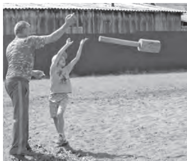
■ В будущем году организаторы планируют ввести в программу спартакиады еще один вид состязаний – традиционную борьбу тюркских народов куреш.

Организатор торгов – Межрегиональное территориальное управление Росимущества в Кемеровской и Томской областях в лице ООО «Выгодное решение» (ИНН 4205351328, ОГРН 1174205004665), действующее на основании Государственного контракта от 18.12.2017г., № К17-8/43, тел. 8-905-066-8772, e-mail: viodnoereshenie@gmail.com, сообщает об изменении в информационное сообщение, опубликованное в газете «Кузбасс» № 55 от 24.07.18 г. стр.3: