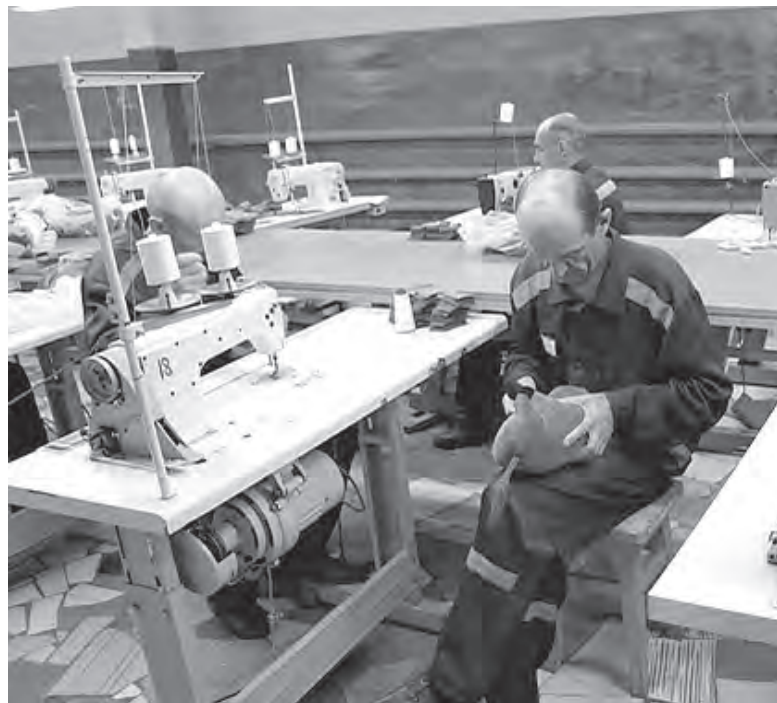
Мягкие кабанчики «Пумба» рождаются в цехе по производству мягкой игрушки в ИК-41 в Юрге.