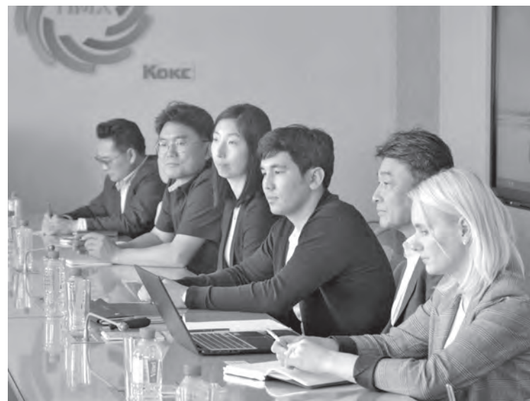
■ Рабочая встреча делегации с руководством ПАО «Кокс».