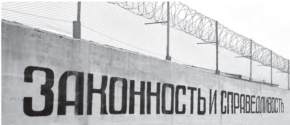
■ Реальное лишение свободы преступникам за применение насилия в отношении представителя власти встречается довольно редко.

Однако Н. неожиданно оттолкнул от себя полицейского, а затем несколько раз ударил его по голове. Тем не менее сотрудник полиции вместе с подоспевшими