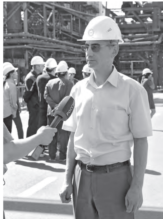
■ Начальник департамента природных ресурсов и экологии администрации Кемеровской области Сергей Высоцкий: «Кокс» неоднократно входил в ТОП первых по экологическому менеджменту, возможно, разработки корейских коллег покажутся для него интересными».