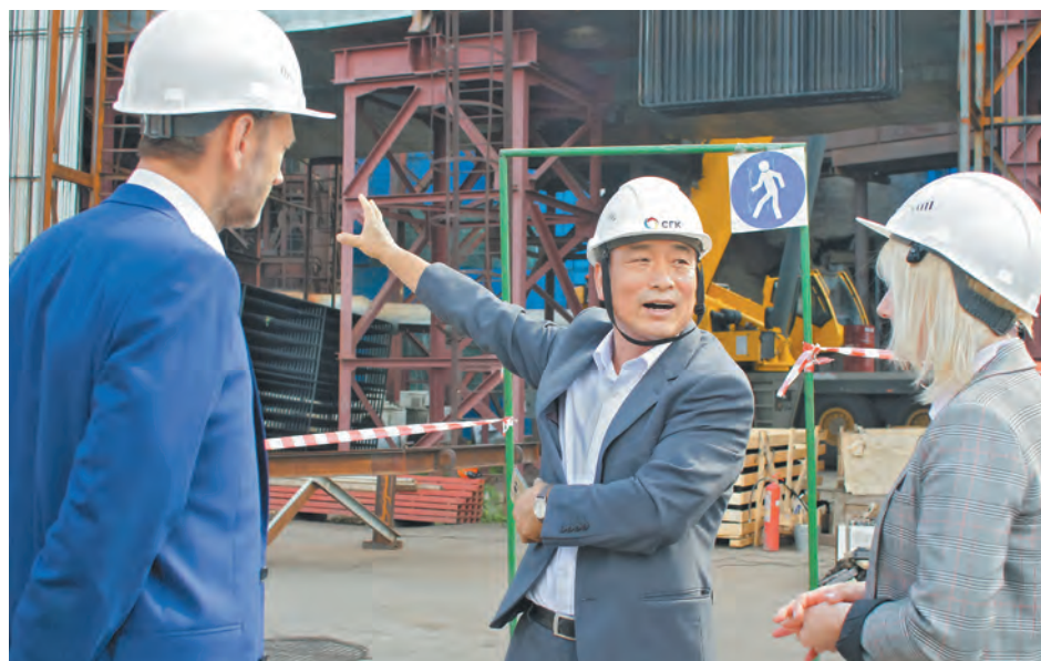
■ На южнокорейских ТЭС используются такие же электрофильтры, как в России.