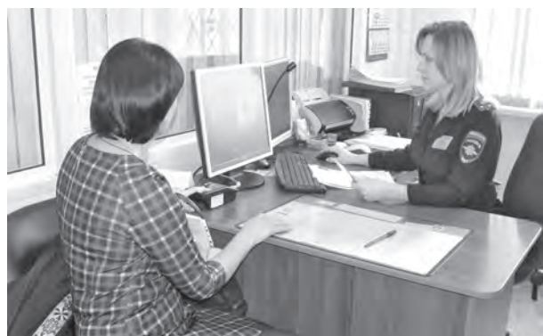
■ Процедура оформления биометрического загранпаспорта на личном приеме граждан занимает не более 15 минут.

Вот как ответили на этот вопрос в управлении по вопросам миграции ГУ МВД России по Кемеровской области: