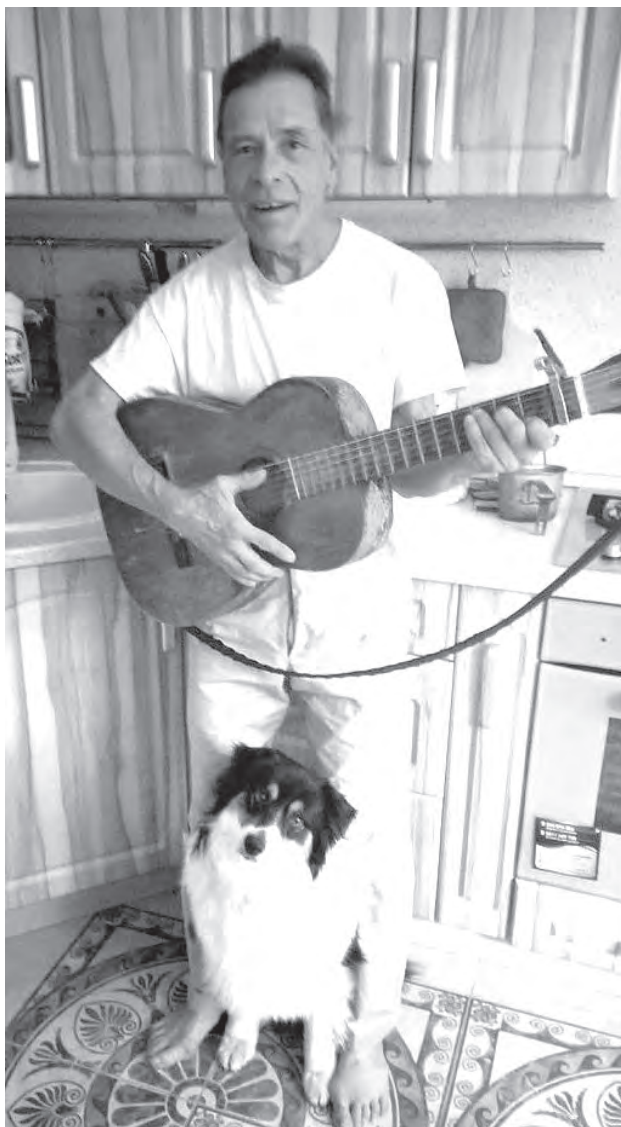
■ На русской кухне. Впереди – целая жизнь...

И возвращался вечером в «12 футов», чтобы утром отправиться по городу снова, черпая надежду в неслучайном совпадении названия его первого сибирского