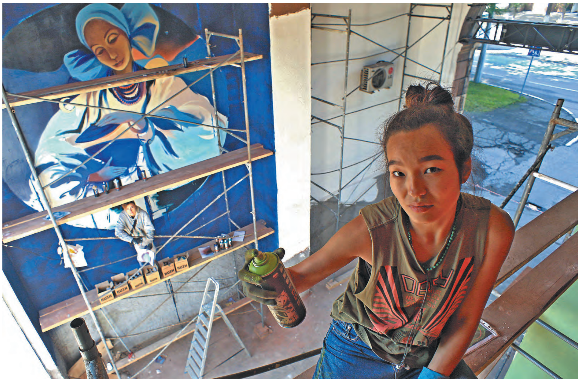
Художники работают над созданием галереи стрит-арта.