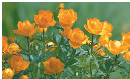
■ Жарки в саду.

Род горечавок обширен – более 12 тысяч видов, для наших – садовых – целей более всего подходят горечавки весенние и бесстебельные, цветки которых окрашены во все мыслимые тона синего цвета. А уж если они голубые, то это самый чистый