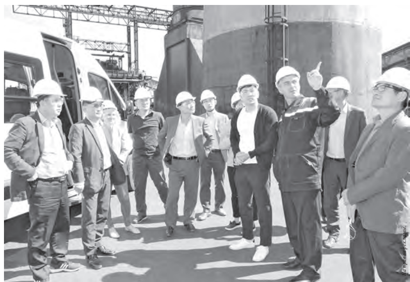
■ Экскурсия по предприятию.