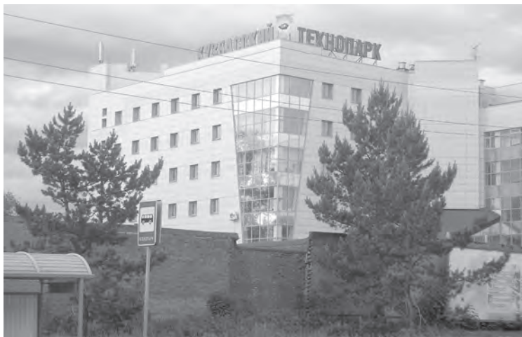
■ Кузбасский технопарк.

Согласно материалам следствия, в сентябре 2014 года высокопоставленная чиновница из корыстных побуждений фиктивно оформила в департамент водителем своего знакомого, деньги за которого в кассе она получала сама. В январе 2016 года она предложила своему знакомому открыть на свое имя специализированную фирму по организации закупок, пообещав ему обеспечение благоприятного режима для ведения бизнеса (в частности, помощь в получении статуса специализированной организации, доступ к информационным системам по государственным закуп-