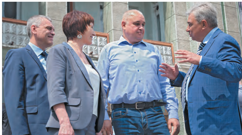
■ В ближайшее время ДК «Металлург» в Гурьевске преобразится.

Таковы некоторые главные итоги вчерашней рабочей поездки Сергея Цивилева по Гурьевскому району.