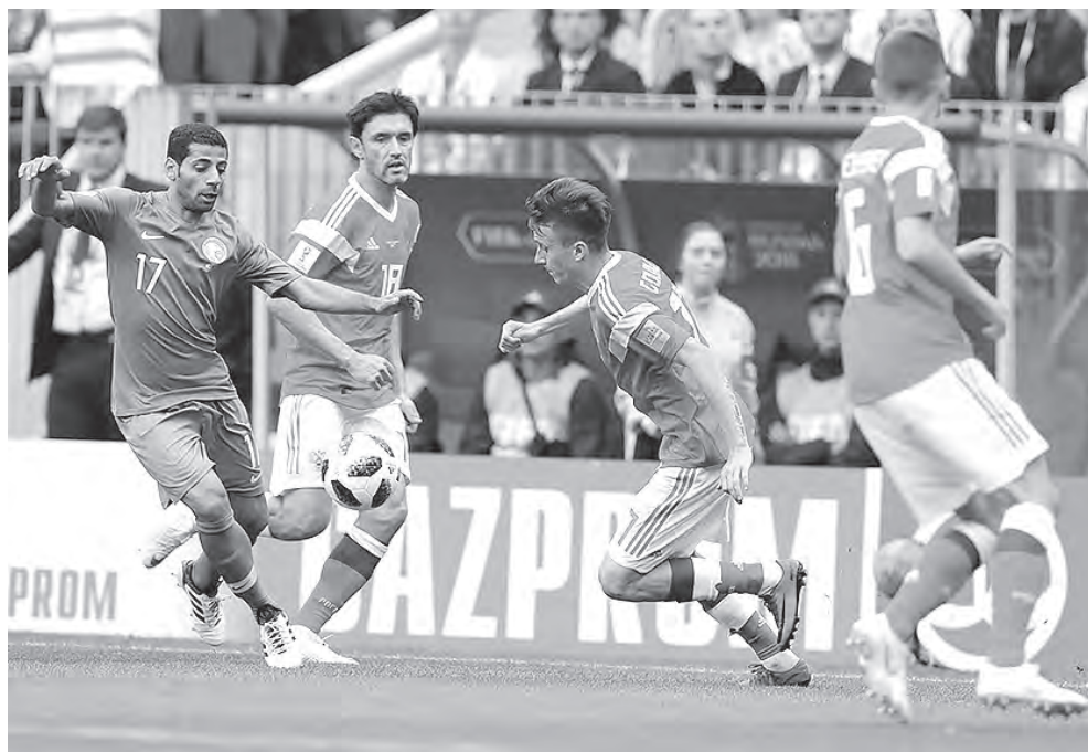
■ Наш 22-летний земляк Александр Головин (в центре) и его более опытный товарищ по команде Юрий Жирков (№ 18) наверняка сыграют в матче плей-офф чемпионата мира со сборной Испании.

– Думаю, нет. Вы видели, что даже в меньшинстве команда бежала вперед и хотела отыграться. Для усиления атаки сделали замены. Очень хотели забить один мяч, чтобы появился шанс на второй гол. Команда психологически достаточно крепкая, чтобы спокойно «перелопатить» внутри себя это поражение и сделать определённые