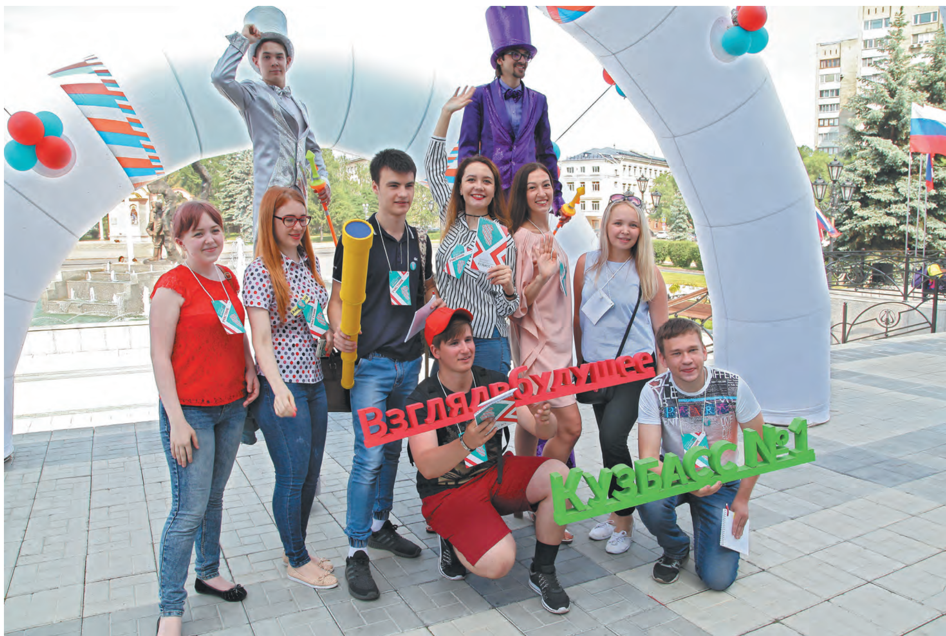
Молодежный форум «Кузбасс № 1» собрал лучшие творческие силы региона.