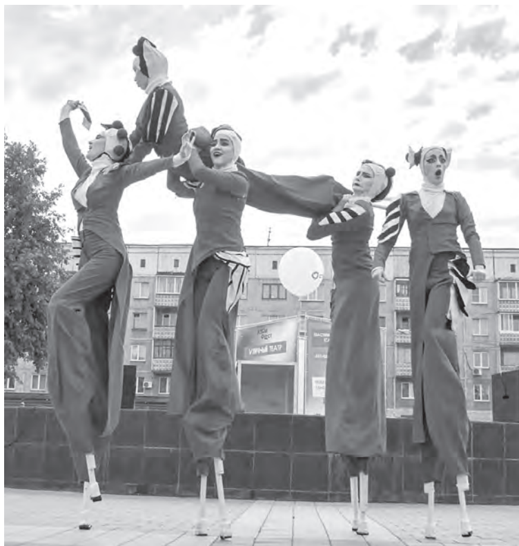
■ Театр «Пластилиновый дождь».

Пока этот вопрос остается открытым. «Качели» вряд ли оставят на бульваре. «Прозрачный город» тоже. Но в любом случае, «Прозрачный город» точно найдет свое место в городе. Если не на Бульваре, то где-то еще. Ну и надеемся, что с «Качелями» будет та же история. Потому что они масштабны, 5 метров в диаметре. На самом деле это важно, где арт-объект находится. Насколько он вписывается в среду. На бульваре Строителей «Прозрачному городу» хорошо, но есть нюансы, поскольку в нем очень важна архитектура, она должна просматриваться со всех сторон. Деревья немного сглаживают купол, если смотреть на него сбоку.