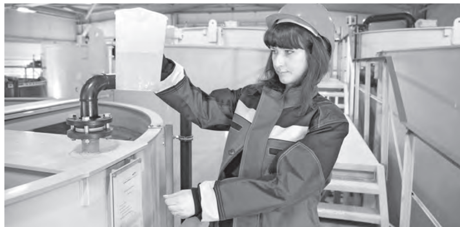
■ В приоритете – перевод земель в земли промышленности для строительства природоохранных объектов. Фото Сергея Гавриленко.

Мы уже рассказывали о том, что по распоряжению Сергея Цивилева в администрации области разработан новый подход к рассмотрению заявок предприятий на перевод земель сельскохозяйственного назначения в земли промышленности: отныне в дополнение к обязательным законодательным требованиям заявку будут изучать специалисты трех департаментов – угольной промышленности; сельского хозяйства и перерабатывающей промышленности; природных ресурсов и экологии. Это позволит организовать оптимальную среду для развития промышленности, комфортного проживания населения и сохранить земли для ведения сельхозработ. Как этот порядок будет действовать на практике, мы попросили рассказать врио заместителя губернатора Кемеровской области по ТЭК и экологии Евгения Хлебунова.