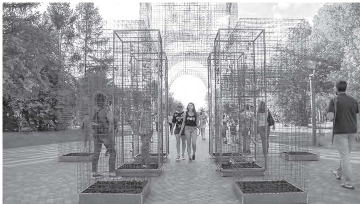
■ Арт-объект «Прозрачный город». Фото Евгения Огородникова.