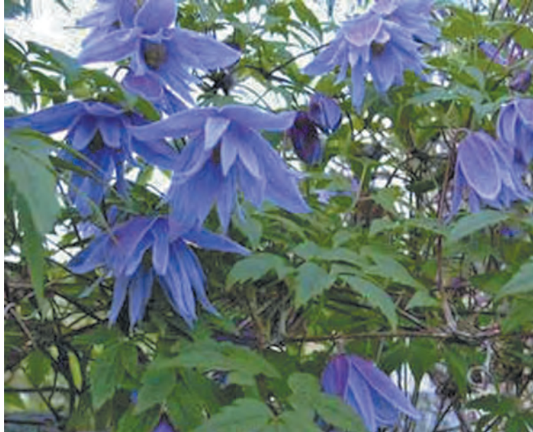
■ Княжик крупнолистный сорта Цецилла.

Вот тезисно ее наблюдения. Клематис и княжик – близкие родственники, но отличия имеются. Это строение цветка и листьев: у княжиков они сложные, тройчатые или дважды тройча-