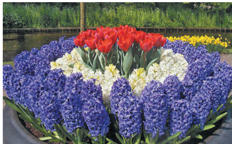
■ Гиацинты в цвету.

Желательно высаживать гиацинты по сухой ясной погоде. Луковицы обработать ярко-розовым раствором марганцовки или препаратом «Максим». На