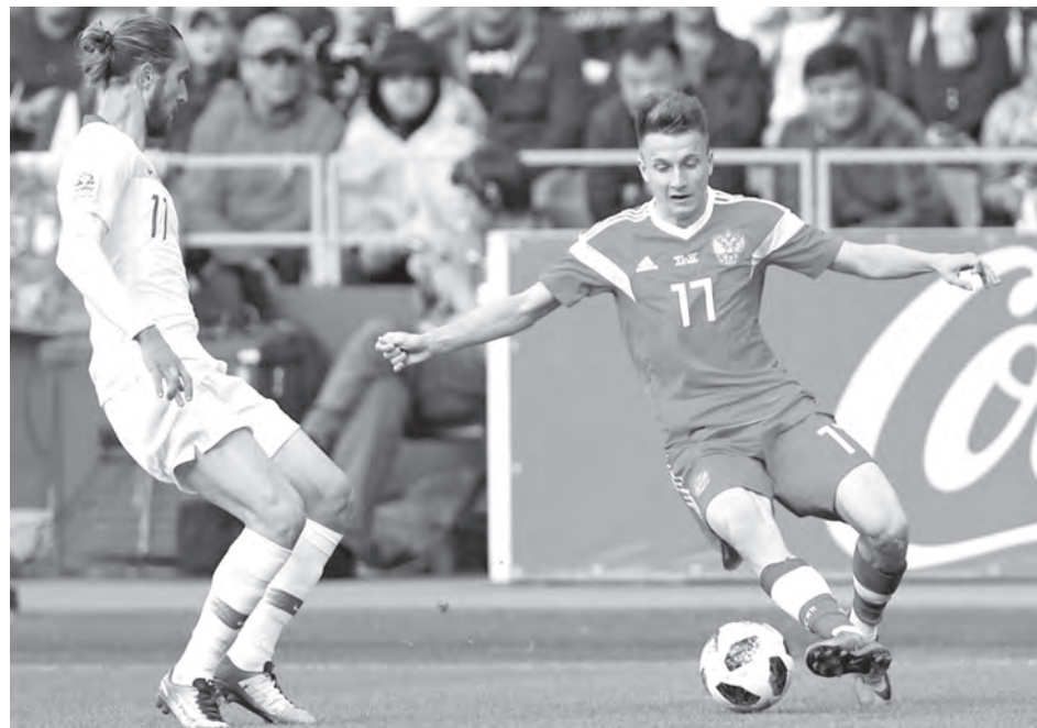
■ Чемпионат мира-2018 – третий официальный турнир для Александра Головина (№17). Ранее он играл на чемпионате Европы-2016 и Кубке конфедераций-2017. Всего в его послужном списке 19 матчей (2 гола) за главную команду страны.