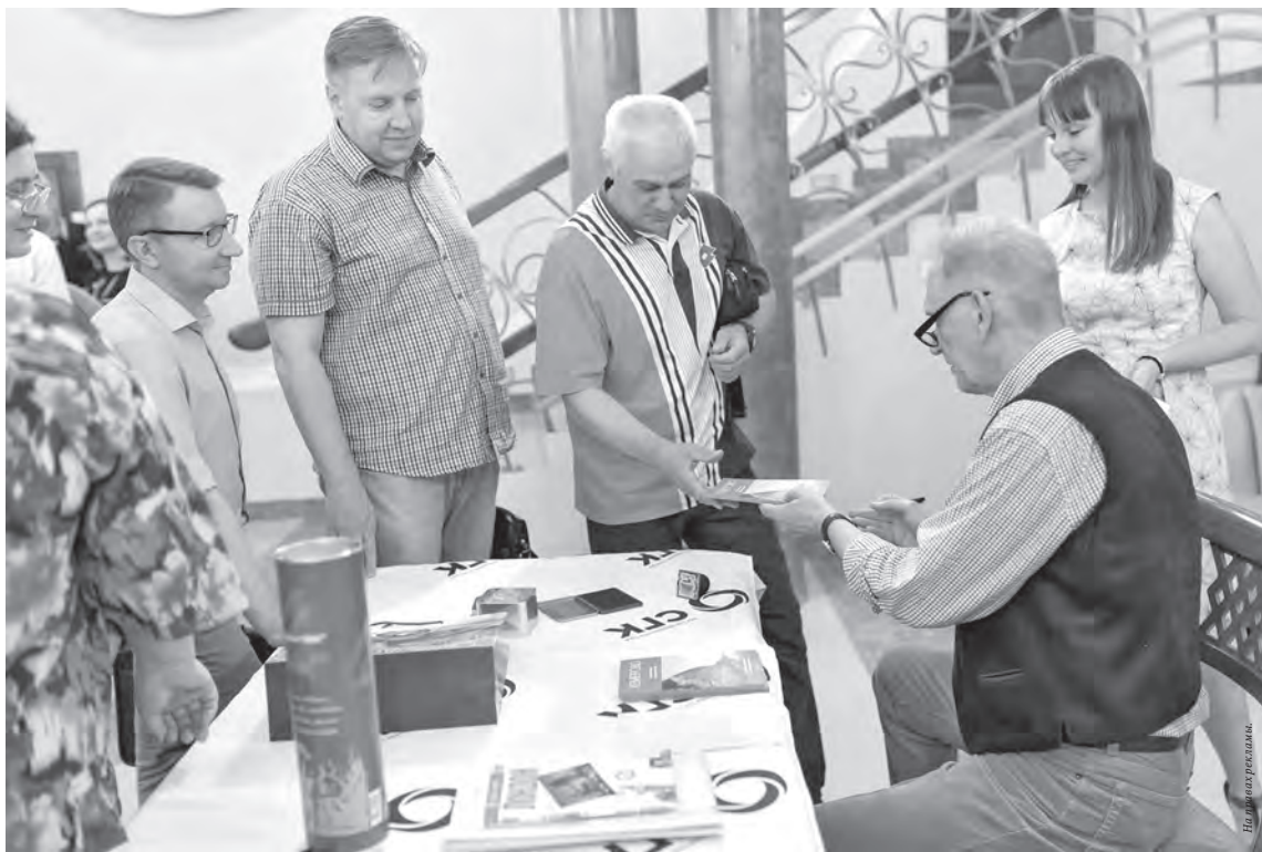
■ Первые экземпляры книги: от автора – истинным кемероволюбам.