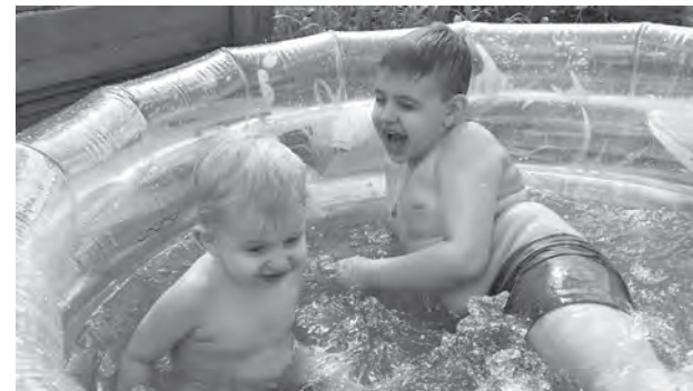
■ Несмотря на переменчивость погоды, у кузбассовцев все же была возможность погреться на солнце и даже искупаться.