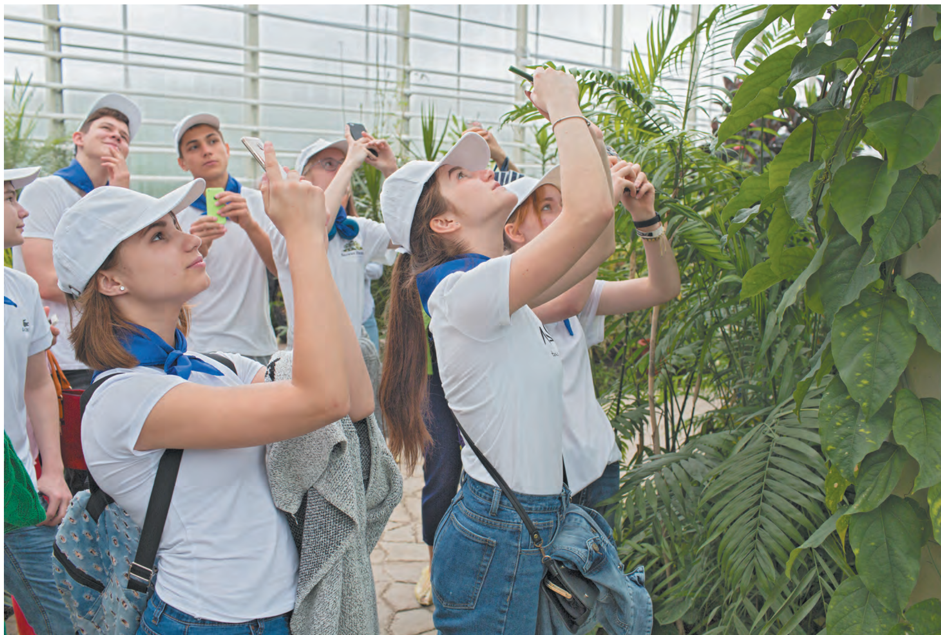
■ В числе первых посетителей нового Ботанического сада в Лесной Поляне – юные экологи областного центра.