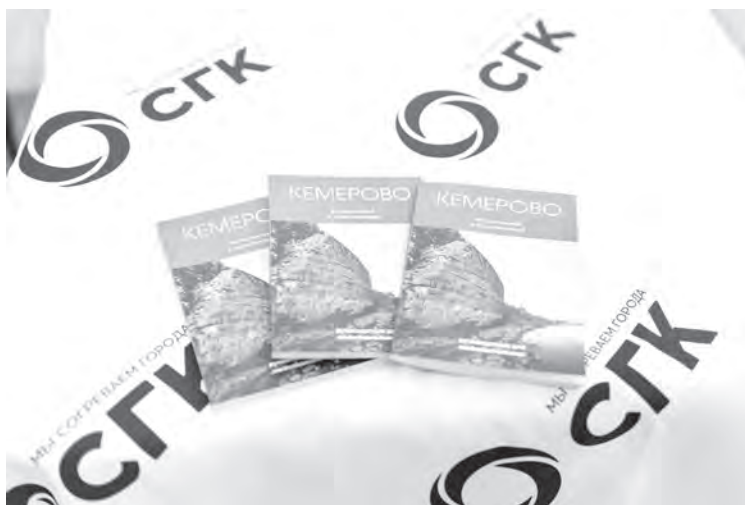
■ Первый путеводитель по городу Кемерово – совместный проект журналиста Владимира Сухацкого и Сибирской генерирующей компании.

на карте Ремизова в 1698 году. Иными словами, мы на пять лет старше Санкт-Петербурга. Для меня история города началась тогда, когда служивые люди Верхотомского острога начали осваивать благодатные земли Притомья, стали сооружать