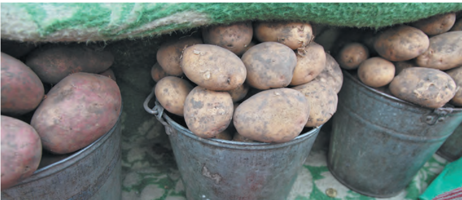
■ «Где мы будем хранить картошку и соленья?», - такой вопрос волнует сейчас членов кооператива.