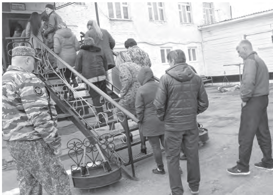
■ И сюда бывают двери открытыми.