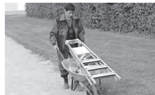
■ С приглашенными на работу мигрантами нужно обязательно заключить трудовой или гражданско-правовой договор.