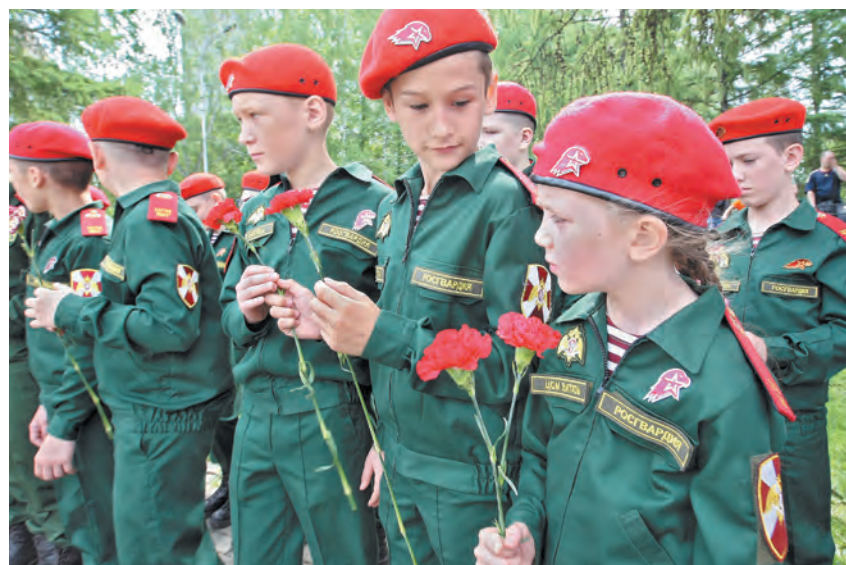
■ Впереди у ребят – 15 дней интересного и насыщенного отдыха в военно-патриотическом лагере.