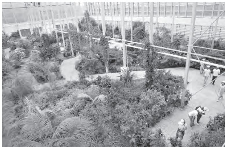
■ В новых оранжереях растениям просторно.