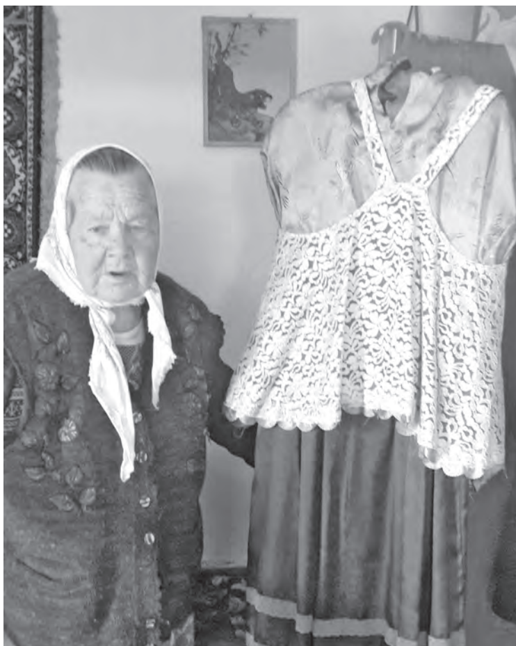
■ Ее шкаф набит старинными сарафанами, кофтами...

тровны повторили тёткины сарафаны точь-в-точь. Только шила она их не вручную, а на швейной машинке.