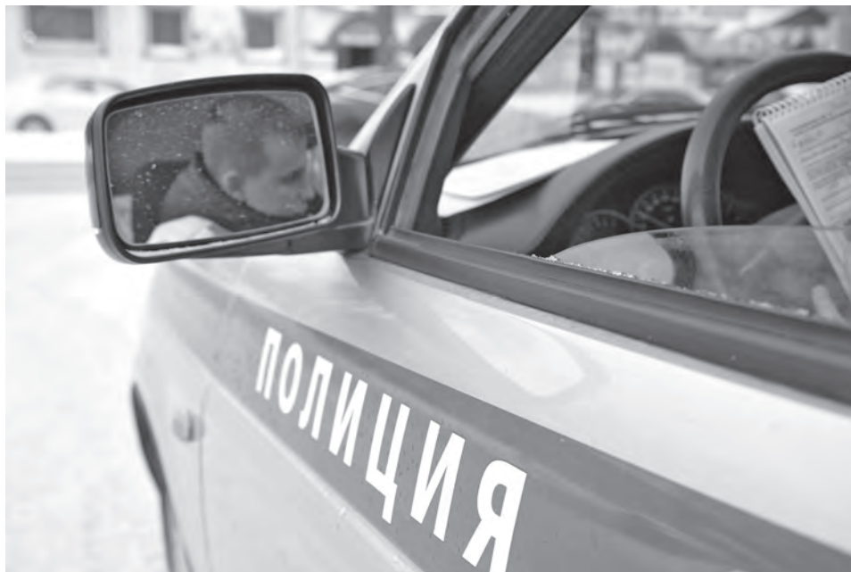
■ Как правило, поддельные полисы ОСАГО выявляют у водителей инспекторы ГИБДД.

Кстати, по Уголовному кодексу России, за использование заведомо подложного документа – а именно так по нашим законам квалифицируется езда с поддельным полисом ОСАГО – в качестве наказания можно получить от крупного денежного