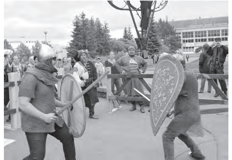
■ Фото автора.

нуться в глубину веков. Фестиваль так и назывался: «Живая история». Здесь была и экспозиция музея КемГУ, и мобильная площадка музея-заповедника «Томская писаница». А еще – походный лагерь варягов, рыцарская площадка. На ней всем смело предлагали примерять кольчугу, шлем и побиться на мечах с «противником». Мечи, правда, были совсем безопасные –