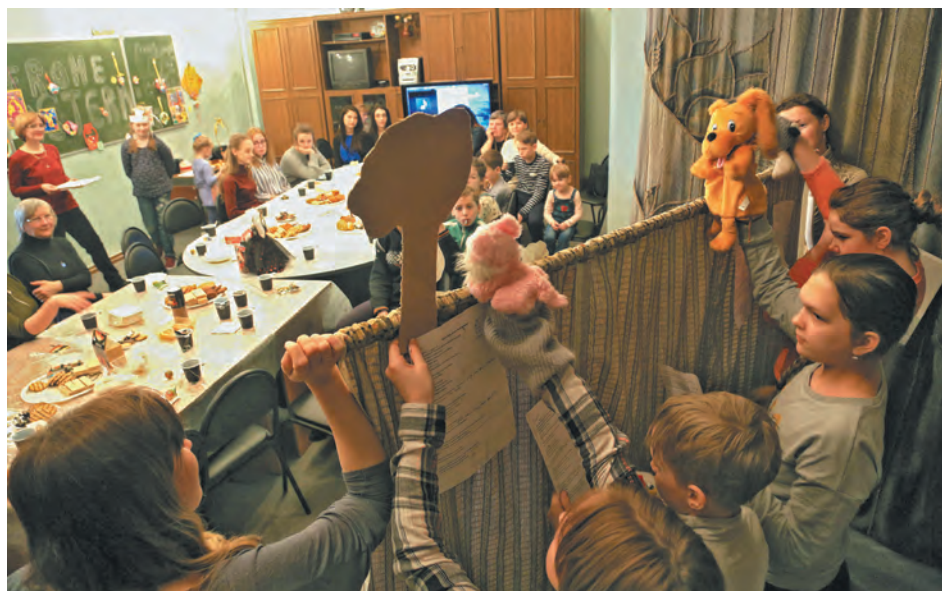
■ На премьере спектакля «Бременские музыканты» в новокузнецком Центре немецкой культуры.

Общество с ограниченной ответственностью «Кузбасская энергосетевая компания» доводит до сведения заинтересованных лиц (лиц, осуществляющих размещение сетей электросвязи и (или) их отдельных элементов), что информация об условиях и порядке доступа к инфраструктуре для размещения сетей электросвязи, в том числе: