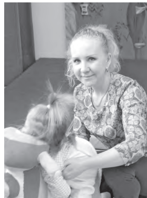
■ Чужих детей для неё не бывает.