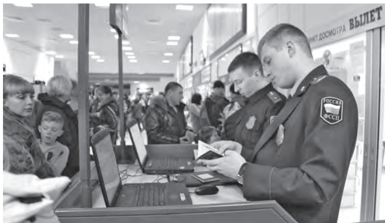
■ Проверка долгов в аэропорту.

Среди «невыездных» авиапассажиров больше всего задолжавших по алиментам, отмечают в УФСПП. При этом, по последним данным, опубликованным на сайте ведомства, количество таких должников не выросло. На первое полугодие 2017 года на исполнении находилось 36088 производств о взыскании али-