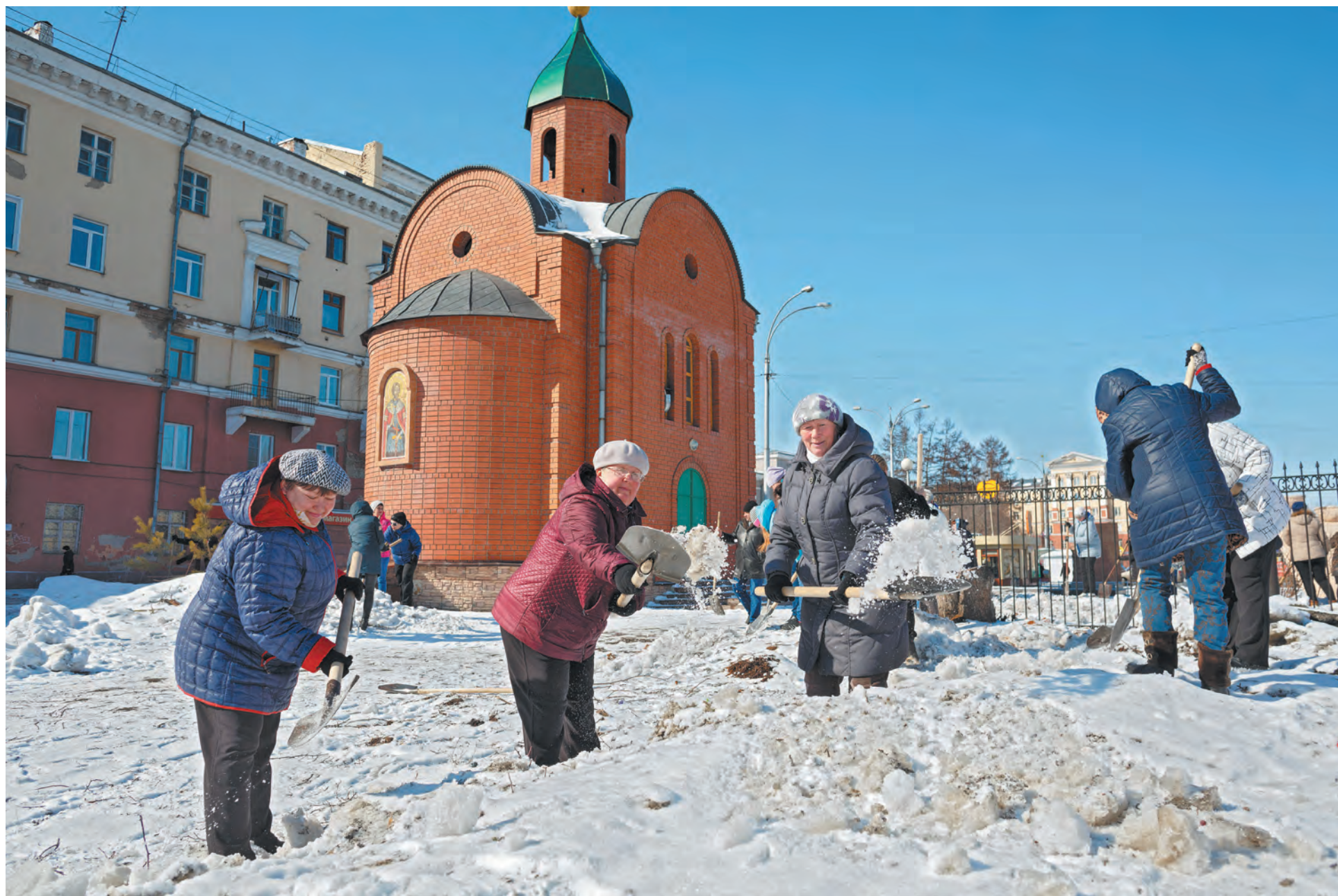
■ Вчера в Кировском районе Кемерова общественники, работники предприятий и организаций приводили в порядок бульварную часть улицы 40 лет Октября.