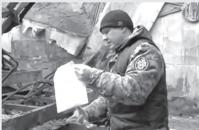
■ Следователь СКР обследует сгоревшее здание «Зимней вишни».