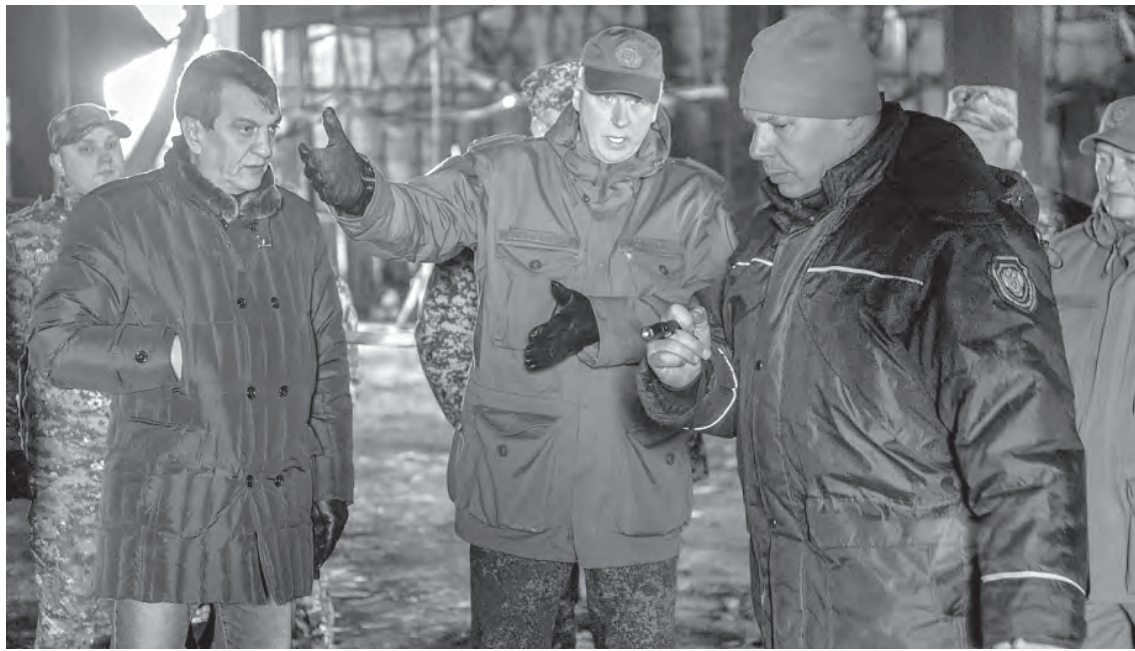
■ Полпред президента России в СФО Сергей Меняйло (слева) и председатель СКР Александр Бастрыкин (в центре) на месте трагедии.