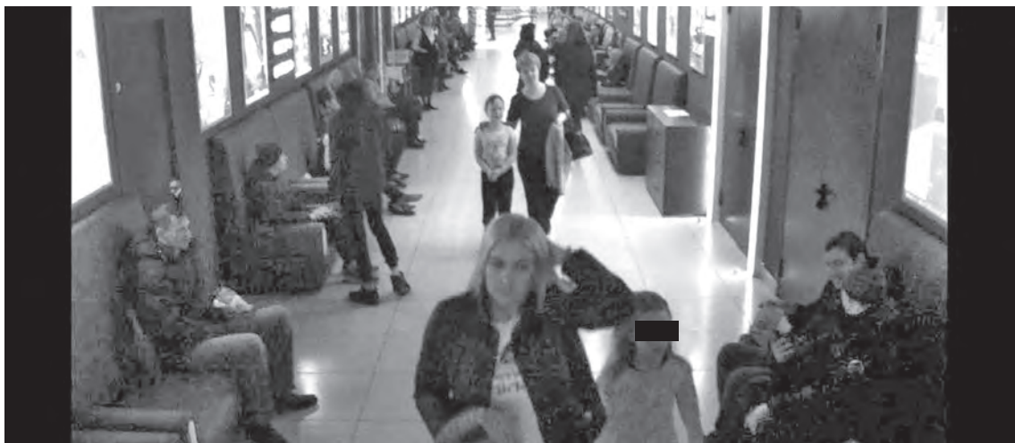
■ По мнению следствия, эта молодая женщина может помочь дополнить картину происшедшего в «Зимней вишне». Ее просят откликнуться.

Также следователи убедительно просят всех, кто узнал эту молодую женщину на скриншоте, не оставаться в стороне и