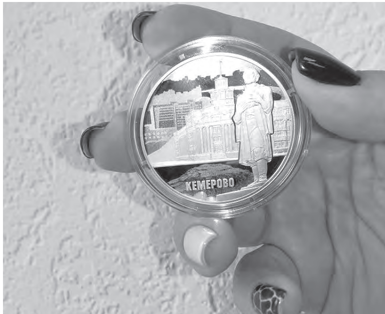
■ Номинал монеты – три рубля, при этом стоит она пять тысяч.

Памятная монета к 100-летию основания Кемерово изготовлена из серебра 925-й пробы, качество чеканки «пруф», вес – 31,1 грамма. На реверсе монеты рельефно изображены памятник Михайло Волкову и здание мэрии, надпись «Кемерово». На аверсе – традиционный двуглавый орел, надпись «Банк России», метка монетного двора и номинал (монеты явля-