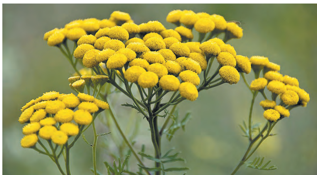
■ Цветет пижма.