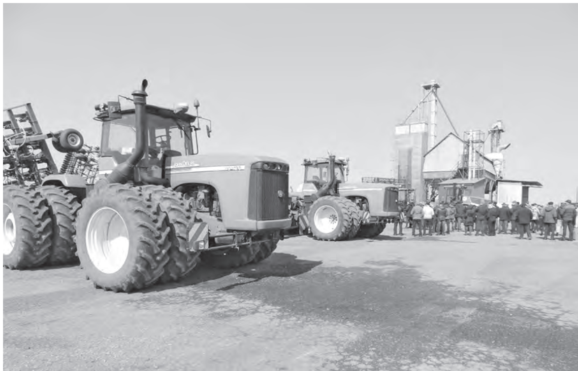
■ Деревня Красноярка, во время районной агроконференции.