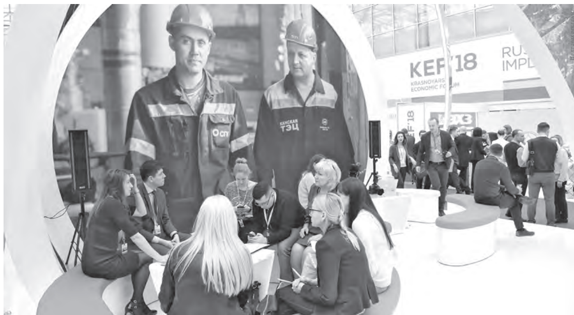
■ Стенд СГК на Красноярском экономическом форуме-2018.

Если не будет серьезных предпосылок со стороны федеральной власти, новый метод будет