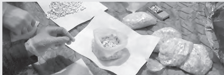
■ Контрабандные таблетки «экстази», изъятые полицейскими у наркоторговцев.

Рассмотрев материалы уголовного дела, Кемеровский областной суд признал обоих фигурантов виновными в инкриминируемых деяниях. Один из них приговорен к двенадцати годам лишения свободы, другой – к семнадцати, отбывать наказание они будут в исправительной колонии строгого режима. Как уточнили в пресс-службе ГУ МВД России по Кемеровской области, изъятые наркотики, которые проходили по уголовному делу в качестве вещественных доказательств, теперь подлежат уничтожению.