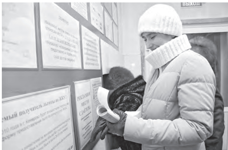
■ Не переплачивать за услуги ЖКХ, зная законы, – реально.

Откуда же берется этот самый норматив? Из соответствующих постановлений. Их два. «Об утверждении нормативов потре-