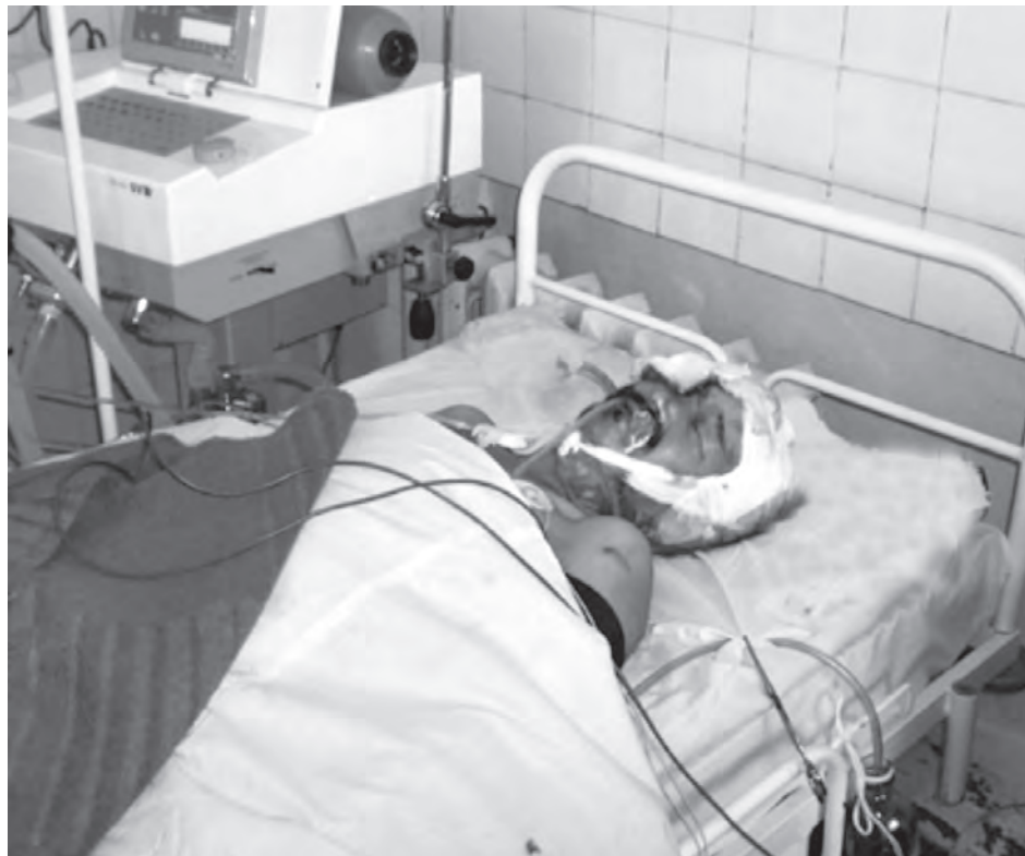
■ В таштагольской больнице ему, возвращая кожу головы на место, наложили почти 100 швов.