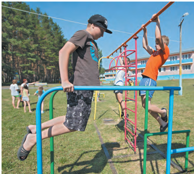
■ Почти восемьсот лагерей примут кузбасских детей предстоящим летом.

Поправки вообще предусматривают широкое использование интернета для информирования всех желающих о возможностях детского отдыха в регионах. В частности, региональным органам исполнительной власти отныне предписано не только вести реестр организаций, предоставляющих услуги такого рода, но и размещать его на своем официальном сайте. Чтобы родители могли изучить информацию по всем интересующим их детским лагерям, сравнить преимущества их расположения, продолжительность сезонов, стоимость путевок,