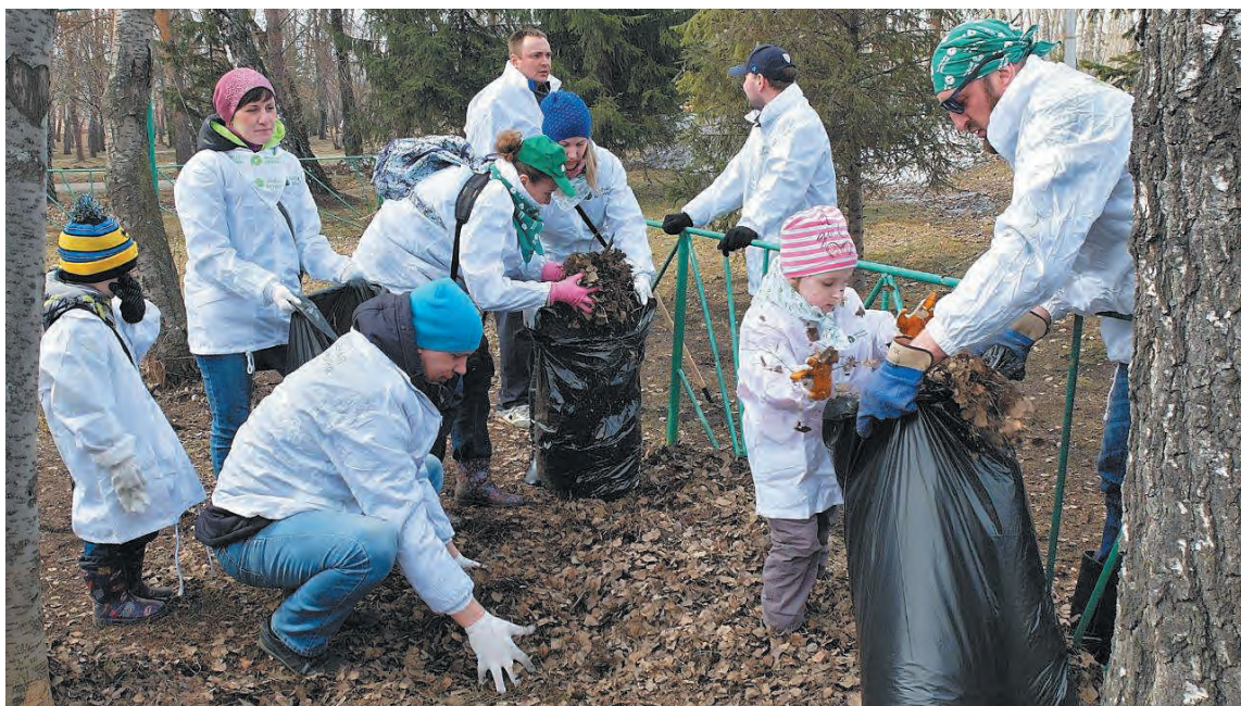
■ «Зеленая дружина» СГК на субботнике в парке Веры Волошиной.

Сейчас ветеринары оценивают ситуацию как критическую. В планах – стабилизировать состояние совы, крыло – удалить. Но общий прогноз неблагоприятный.