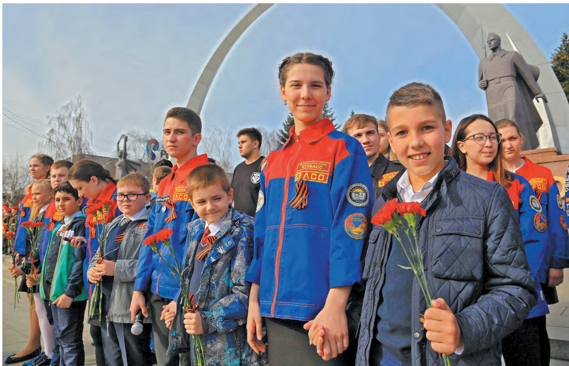
Во время акции «Георгиевская ленточка» в Новокузнецке волонтеры вручили горожанам этот символ мужества и героизма.