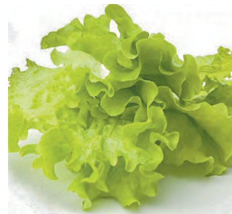
■ Салат латук листовой.

чить азот, чтобы не способствовать накоплению нитратов. Лучше пользоваться гуматами.