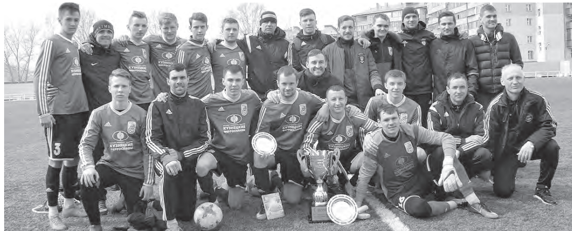
■ В прошлом году новокузнецкий клуб заработал четыре титула, выиграв чемпионат и Кубок Сибири, чемпионат и Кубок Кузбасса.

– Деление «Востока» на две группы – «Сибирь» и «Дальний Восток» – обусловлено жела-