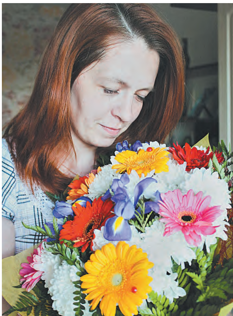
■ Её любимые герберы.

И всё. До самого автовокзала женщина не проронила больше ни слова.