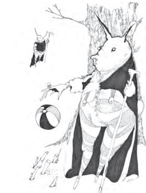
■ Одна из загадочных работ артиста.