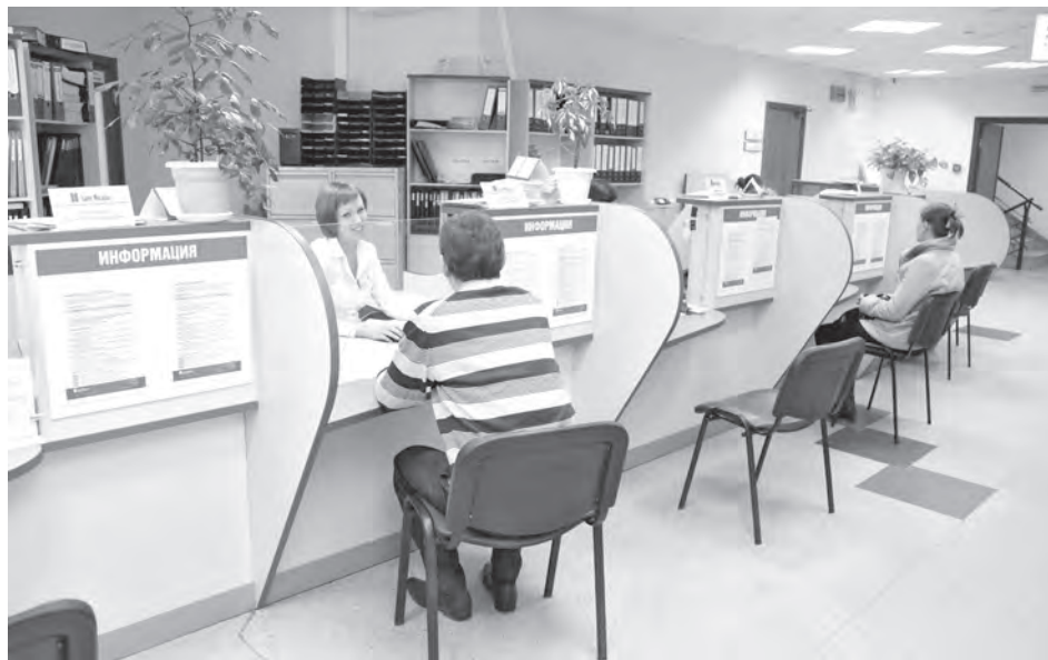
■ Перед подписанием договор лучше прочитать дома.

Число жалоб в областное управление Роспотребнадзора на компании, оказывающие финансовые услуги, в 2017 году увеличилось на 3,5%. Среди наиболее частотных нарушений банков, МФО и страховых компаний – мелкий шрифт договора кредитования или вклада, который не позволяет в него вчитаться. А в договоре, в свою очередь, масса острых «подводных камней». Как не напороться на них, рассказывает эксперт Банка России.