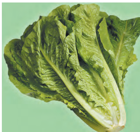
■ Салат латук спаржевый.

Уход за растениями состоит из прополок, рыхления, регулярных поливов и прореживания. Последнее весьма важно, поскольку загущенные посадки легко поражаются гнилями и вредителями. Полив необходимо проводить утром, чтобы не создавать высокой влажности воздуха около растений (это провоцирует ложную мучнистую росу и другие болезни). При внесении подкормок следует исклю-