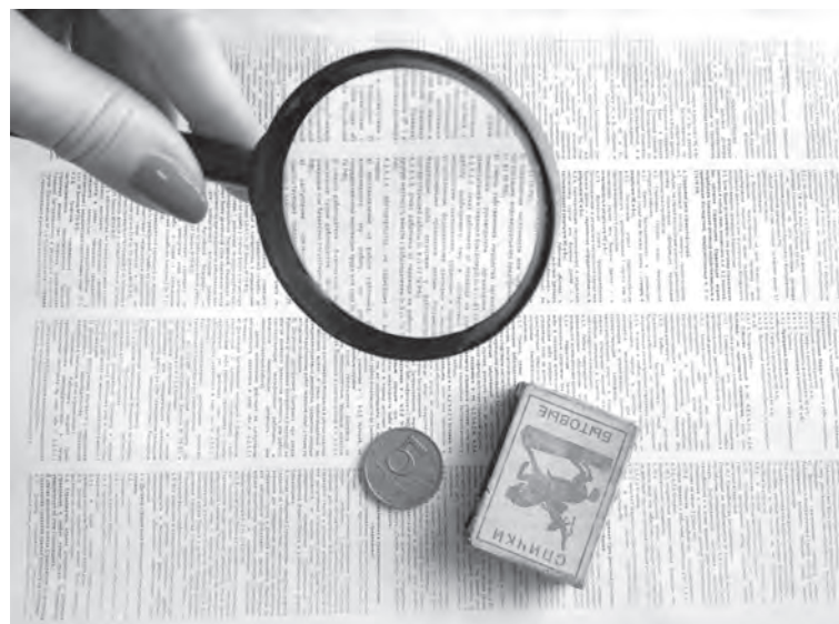
■ Таким шрифтом банк «ВТБ-24» напечатал «Особые условия по страховому продукту «Единовременный взнос». Микроскоп клиентам не предложили...