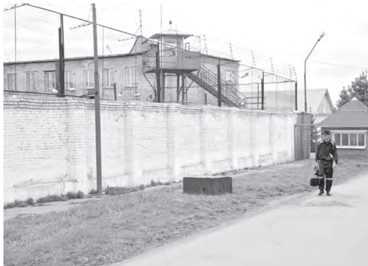
■ По закону, все работающие осужденные имеют право на ежегодный 18-дневный отпуск. И в ряде кузбасских исправительных учреждений есть профилактории для их проведения.

Вообще говоря, в соответствии с Уголовно-исполнительным кодексом РФ все работающие осужденные имеют право на ежегодный 18-дневный отпуск. Другое дело, что по тем или иным причинам провести его за пределами исправительного учреждения могут далеко не все. Поэтому в ряде исправительных учреждений имеются профилактории для проведения отпусков. Они созданы, например, в ИК-5 (Кемерово), ИК-22 (Кемерово), ИК-35 (Ма-