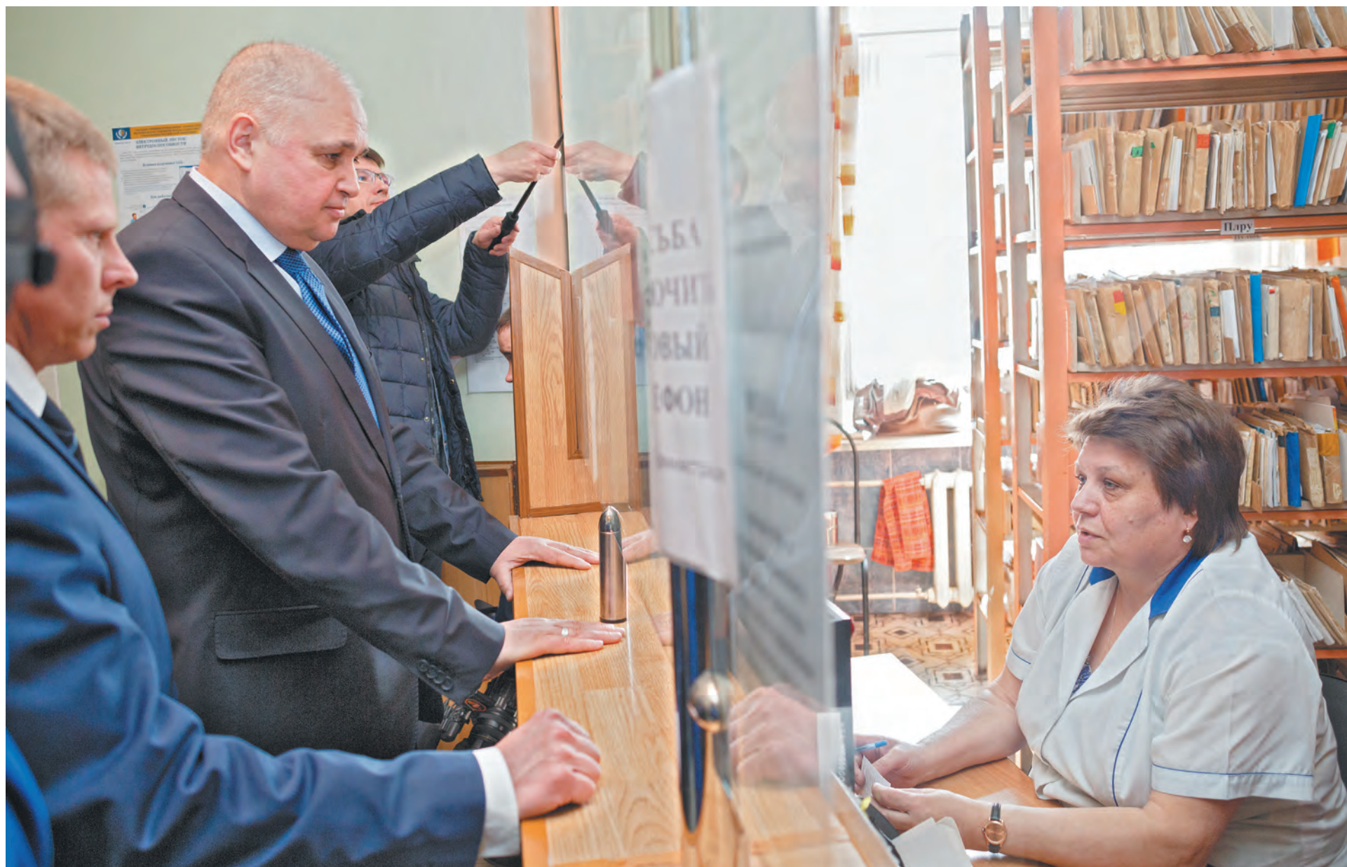
■ Руководитель региона в регистратуре Центра здоровья «Инской».