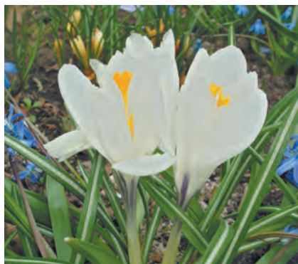
■ Крокусы Жанна д'Арк.

С высадкой та же история: по агронауке клубнелуковичкам следует обеспечить теплую сушку до сентября; практики предпочитают делать это едва ли не сразу после выкопки. Если, конечно,