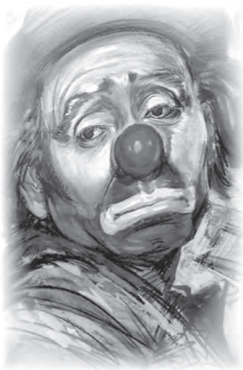
■ Автопортрет Панина. Роль рыжего клоуна из спектакля «Смертельный номер» была Андрею Владимировичу очень близка.

спонтанно, а являются отражением состояния его души и эмоций в определенный момент времени. Панин почти никогда не подписывал свои работы, для него это было просто самовыражением, отдыхом и любимым делом. Благодаря жене актера Наталье Рогожкиной многие рисунки Панина были сохранены и теперь вызывают огромный интерес. Вдова артиста планирует издать его посмертный альбом и организовать выставки. Не только загадочная гибель Панина, но и целый пласт его творчества вызывает массу вопросов: многие из оставленных им рисунков поражают воображение своими причудливыми сюжетами.