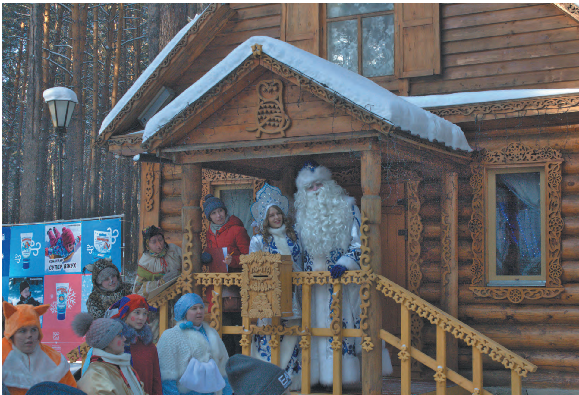
■ В резиденции Кузбасского Деда Мороза гостям всегда рады.