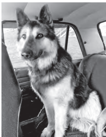
■ Мальчик сам сел в машину Ирины.

На следующий день этого пса (которого, как удалось выяснить