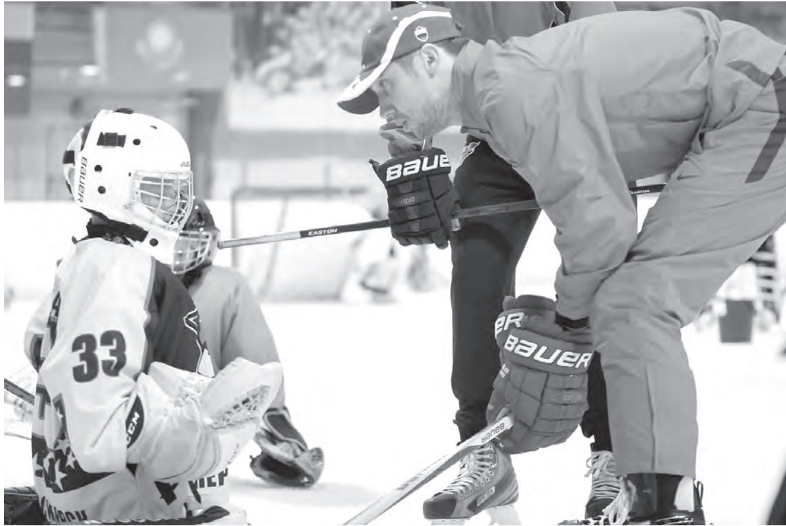
■ Чемпион мира-2014, лучший вратарь Национальной хоккейной лиги Сергей Бобровский не забывает родную хоккейную школу Новокузнецка и регулярно проводит мастер-классы для юных коллег по амплу.

Сейчас дисквалифицированным олимпийцам стараются оказать квалифицированную