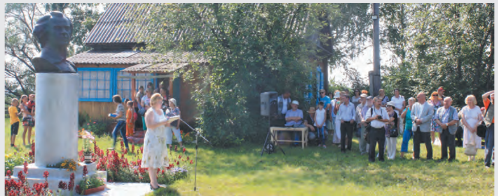
■ На предыдущих Фёдоровских чтениях в Марьевке собралось немало ценителей поэзии.