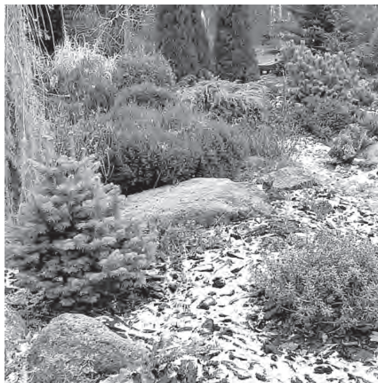
■ В саду родилась елочка...