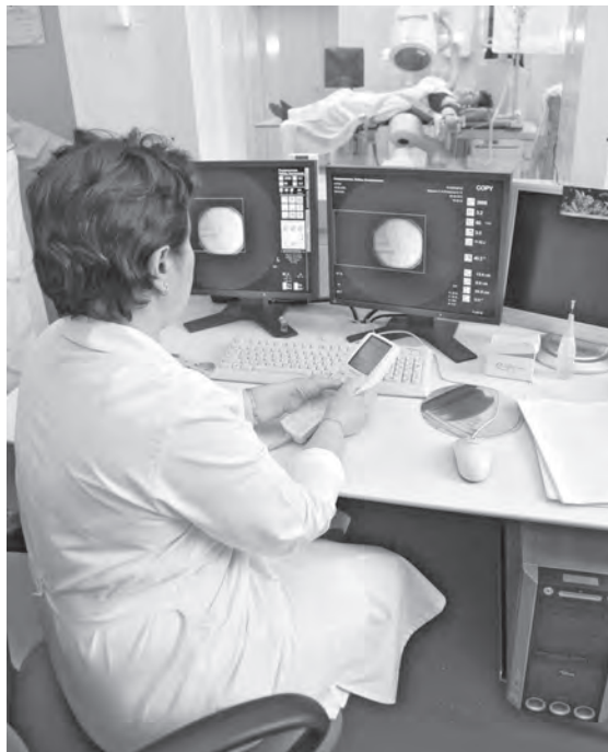
■ В наступившем году высокотехнологичная медицинская помощь станет доступней кузбассовцам.

Особый акцент в новом году будет сделан и на реабилитацию пациентов, перенесших тяжелые заболевания или операции. Трудно переоценить значение высокотехнологичной медицинской помощи для сохранения качества жизни населения. Но без качественной реабилитации она далеко не всегда дает ожидаемый эффект. Поэтому заложенные в терпрограмму расходы на реабилитацию заметно увеличатся. Прежде всего это отразится на больных после инсульта, а также на пациентах с тяжелой патологией опорно-двигательного аппарата, перенесших, например, сложную операцию на позвоночнике или замену тазобедренного сустава. Реабилитация, которая будет начинаться