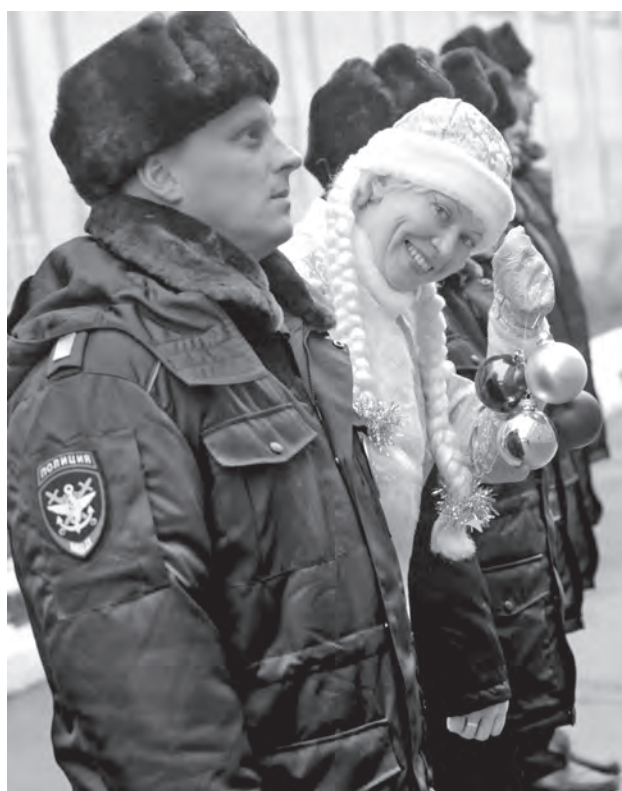
■ В новый год в одном строю! Для того чтобы праздничные каникулы в нашем регионе прошли достойно и спокойно, сотрудники правоохранительных органов работают в усиленном режиме, многие из них встретили 2018 год прямо на службе. Среди них и кузбасские транспортные полицейские, которые обеспечивают безопасность пассажиров.

Однако лукавство изворотливого драгдилера раскрылось без особых проблем. Несмотря на полное внешнее и генетическое сходство братьев-близнецов, у обвиняемо-