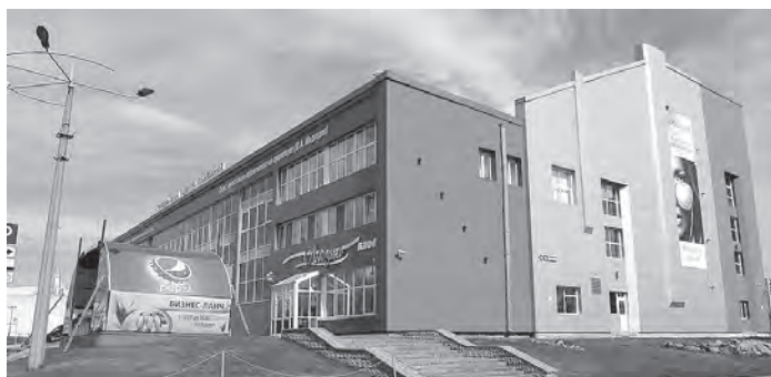
■ Сейчас первый 50-метровый плавательный бассейн Кемерово «дорос» до статуса губернского центра плавания и носит название «Лазурный».