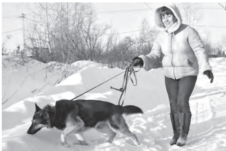
■ Гулять вместе они могут хоть целый день.