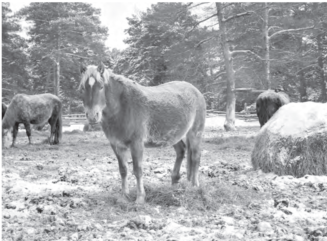
■ Кони, как и агробизнес, чаще для души, а не для денег.

Выводы: надо сделать определенную диверсификацию в производстве, в частности, по зерновым культурам. Может, активнее заняться техническими культурами, то есть уходить от классики, когда основа – пшеница. У нас кроме нее