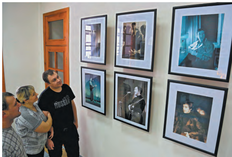
■ На открытии выставки «Я, конечно, вернусь».

Вполне понятно, что ажиотаж вокруг тех концертов был необыкновенный, на них было не попасть. А вот Владимиру Богачёву повезло, билетик на первое выступление достался. При этом к Высоцкому практически никого не пускали, фотографировать не разрешали. Но он снимал из зала почти тайком. А на другой день подъехал к служебному входу театра уже с готовыми фотографиями. В это время проходил администратор Высоцкого, которому понравились снимки. Он-то и привел Владимира