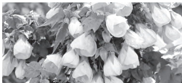
■ Цветущий абутилон.