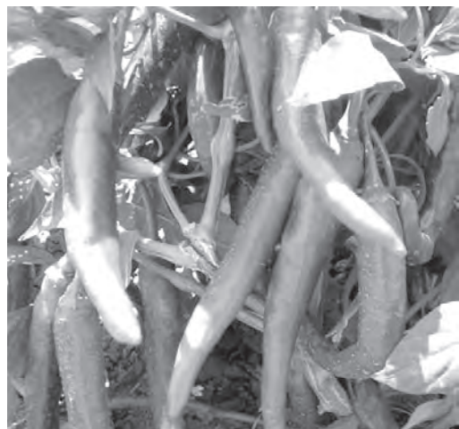
■ Острый перец сорта Импала.