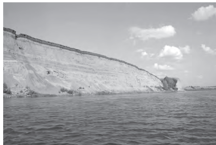
■ Шестаковский яр, динозавр сибиротитан отдал пока лишь несколько своих фрагментов.