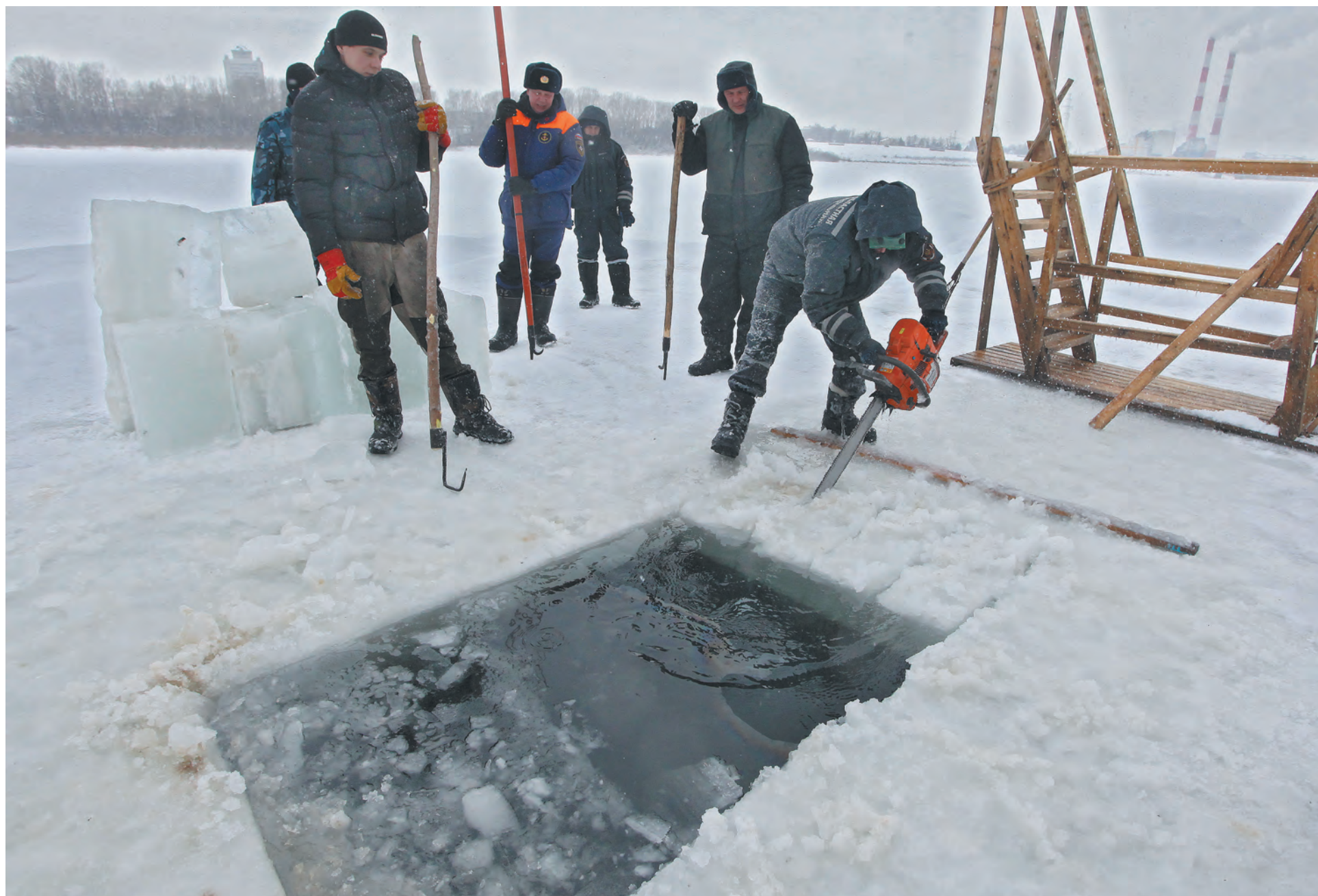
■ Подготовка купели возле базы ГИМС в Кемерове.