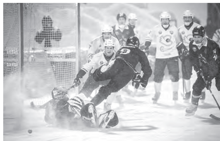
■ В первом домашнем матче года хоккеисты «Кузбасса» (в темной форме) в напряженной борьбе переиграли нижегородский «Старт» – 5:3.