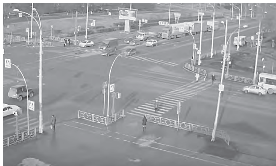
■ Перекресток проспекта Ленина и улицы Терешковой до (слева) и после устранения нарушений.