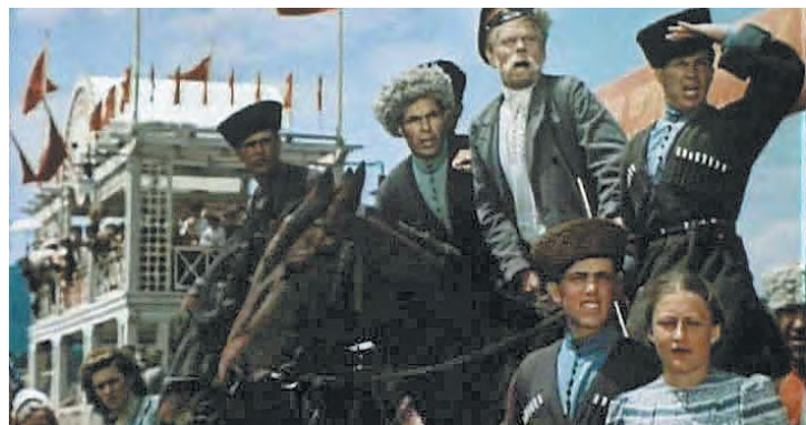
■ Кадр из фильма «Смелые люди» (1950 г.).

Особенно большой успех у зрителей имеют лучшие советские художественные фильмы, выпущенные в послевоенные годы. Например, кинокартину «Сталинградская битва» просмотрело свыше 662 тысяч зрителей Кузбасса. «Падение Берлина» – 1 миллион 197 тысяч 415 зрителей. Советский приключенческий фильм «Смелые люди» за один месяц просмотрели 183 тысячи 834 зрителя.