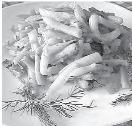
■ Фасоль спаржевая тушеная.