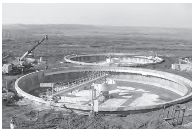
■ Этап реконструкции аэротенков.

Департамент по недропользованию по Сибирскому федеральному округу (Сибнедра) объявляет аукционы: