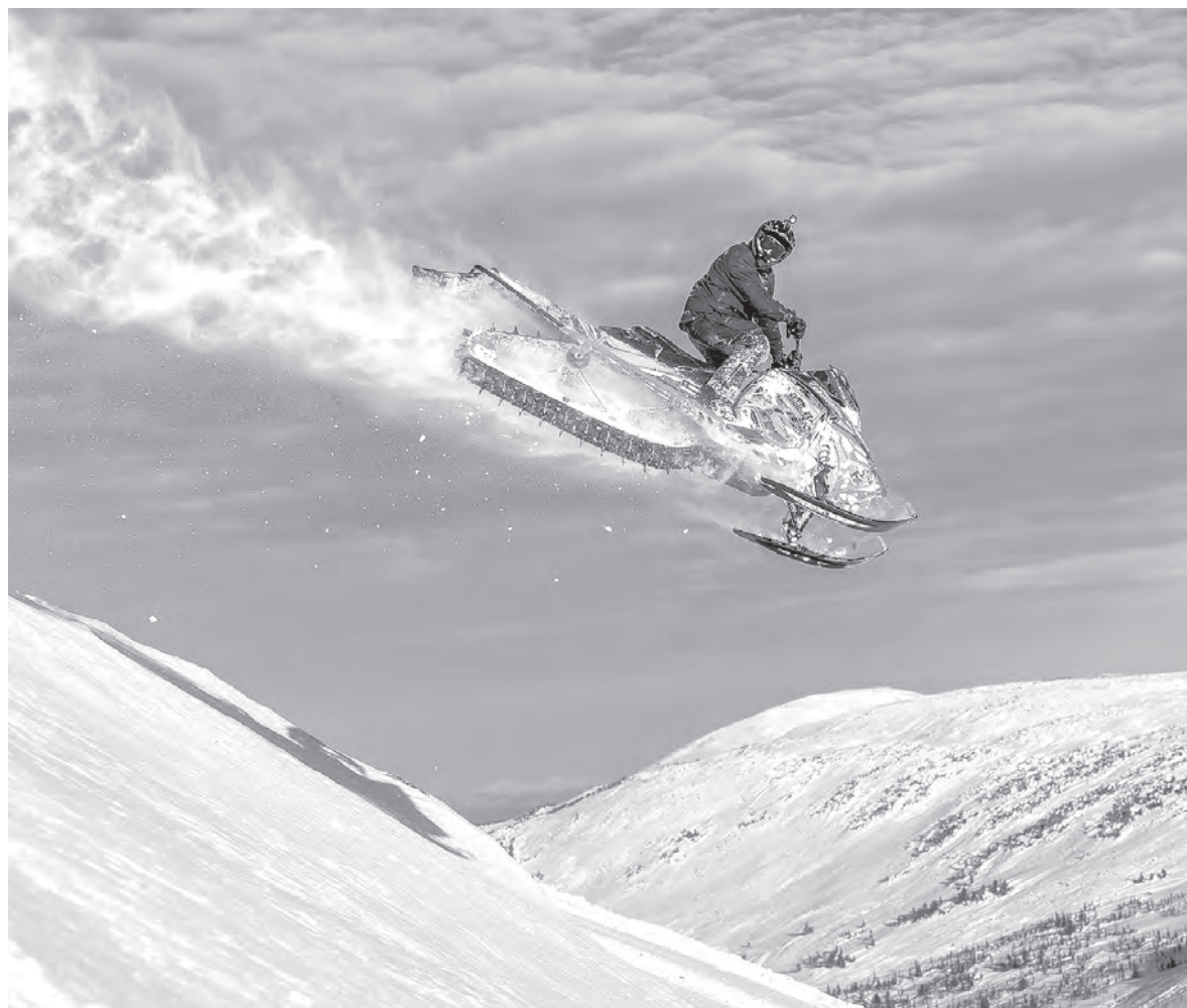
■ Кадр из фильма Владислава Шитенка.