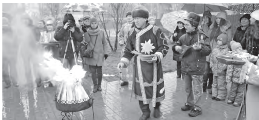
■ Момент торжественного открытия после ремонта сквера имени Тунекова.