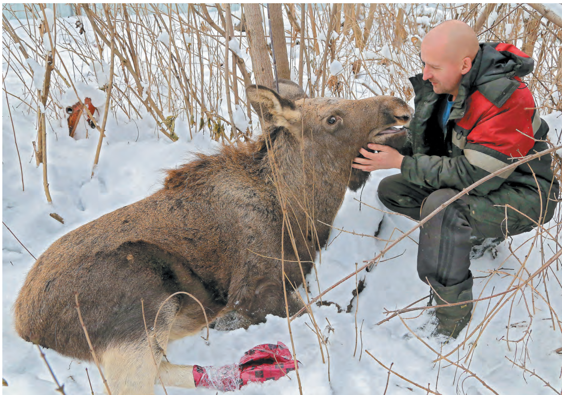
■ Маленькая лосиха Пуговка очень боится людей, но спасших ее сотрудников приюта «Верный» к себе подпускает.