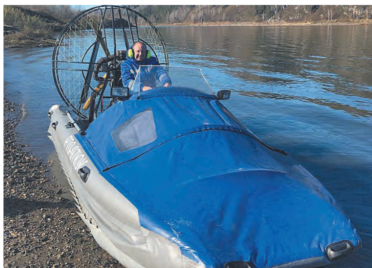
Благодаря аэроглиссеру пострадавшего удалось быстрее доставить в больницу.