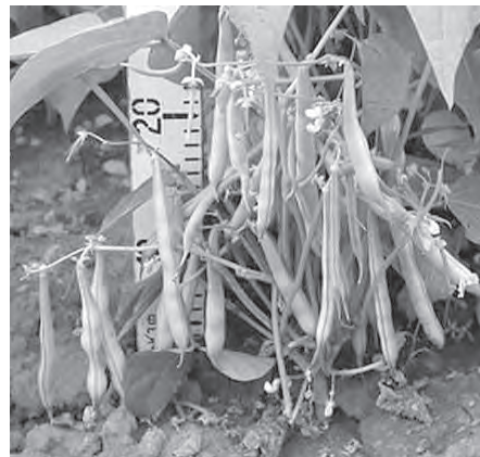
■ Фасоль кустовая зерновая.