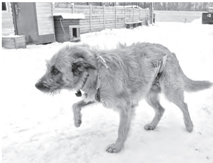
■ Еще один обитатель приюта «Верный» получает здесь всю возможную помощь.

А для содержащихся здесь собак и кошек традиционно нужны сухие корма, мясная обрезь, куриные лапки и головы. В списке самого необходимого также пледы, одеяла, коврики, идущие на