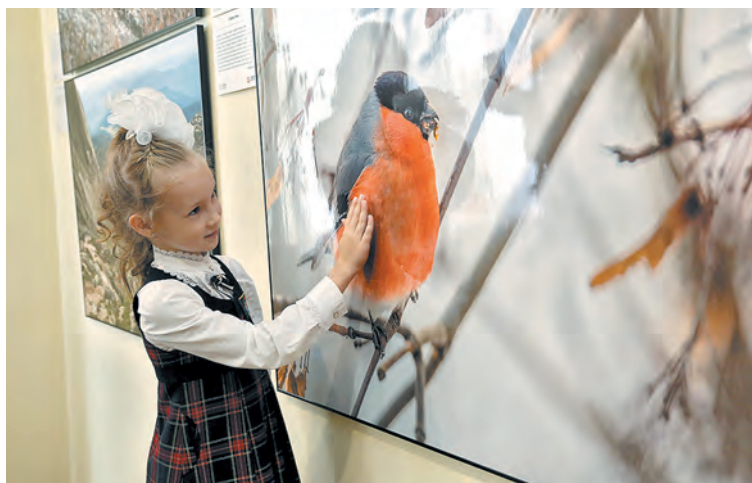
■ Прикоснуться к природе легко!

Этикетки к работам описывают, какая местность, какое животное на них изображены, иногда – при каких обстоятельствах. Например, на фото Валерия Малеева «Виды Байкала» на фоне зимних гор со спины запечатлена лиса – животное будто любит пейзажем. Оказывается, этот лис, прозванный Кузей,