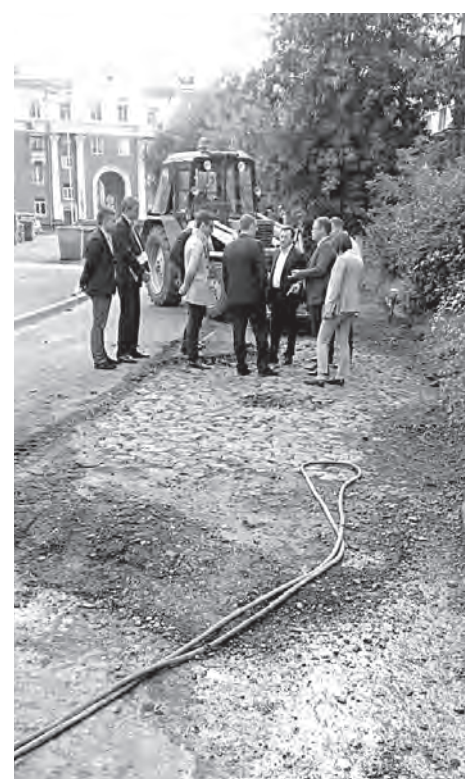
■ Изначально дорожники освободили от асфальта кусочек мостовой приблизительно два на шесть метра.