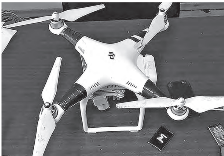
■ Дрон, с помощью которого злоумышленник пытался переправить средства мобильной связи на территорию исправительной колонии в Белове.

Нередко запрещенные предметы осужденным пытаются передать в посылках. Тайники могут быть оборудованы, например, в консервах, пакетах со сладостями, пачках чая, банках с медом, вареньями или соленьями. Причем человеку непосвященному разглядеть подвох бывает довольно сложно. Однако по закону сотрудники колоний обязаны проверять содержимое всех посылок, при-