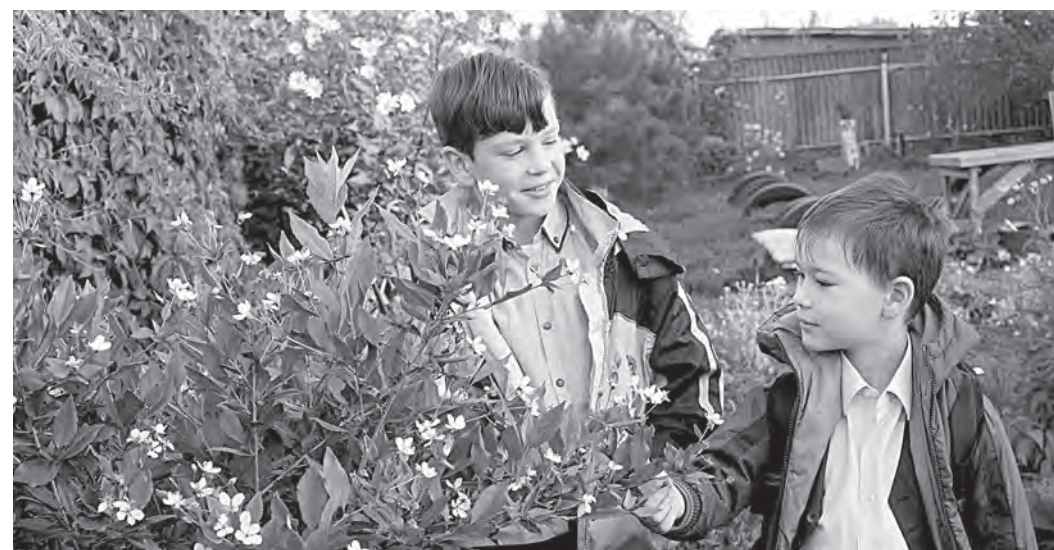
■ В Кемерове вновь зацвела вишня!