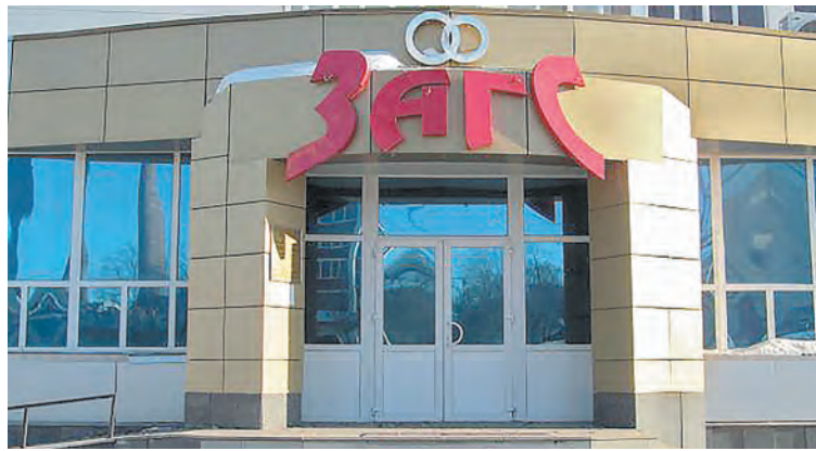
■ Сюда – только по любви!

– И давно вы сами себя жалее-те? – спрашиваю.