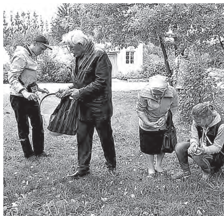
■ Урожай в Сосновом бору собирают юные экологи и их помощники — пенсионеры.