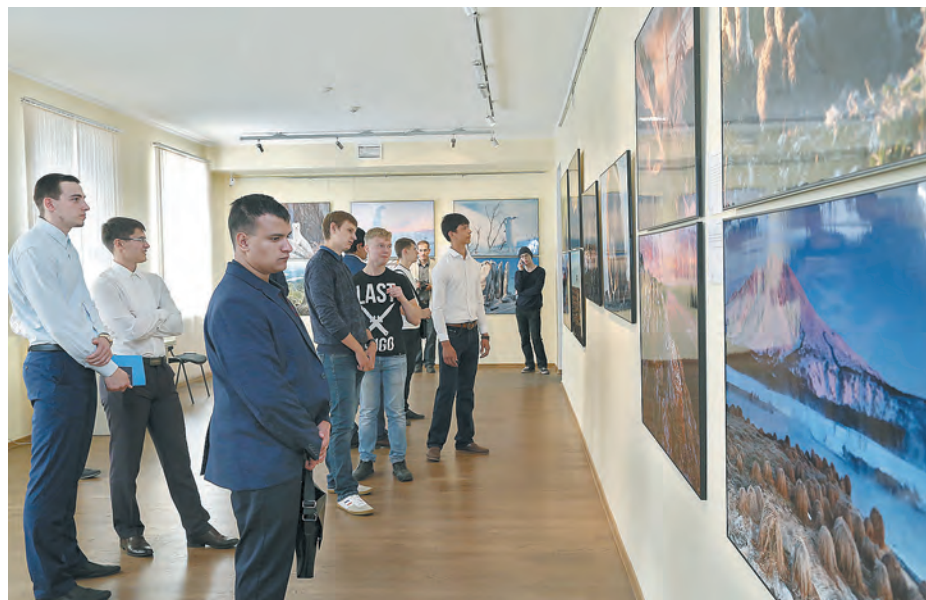
■ Будущие горняки понимают экологическую ответственность.

В Кемеровском областном музее изобразительных искусств в рамках общероссийского фестиваля «Первозданная Россия», поддержанного СУЭК, работает фотовыставка. 150 лучших работ российских фотографов-натуралистов – яркие, выразительные пейзажи самых труднодоступных и красивых уголков страны от Калининграда до Камчатки, портреты диких животных, тайны подводных глубин и микромира – посетители музея могут увидеть абсолютно бесплатно.