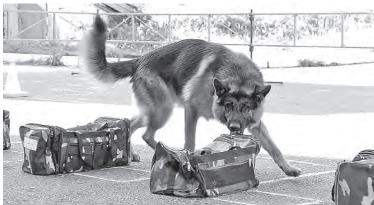
■ Немалую лепту в обнаружение нелегальных посылок вносят и специально обученные служебные собаки, состоящие в штате подразделений кузбасского ГУФСИН.

ло, злоумышленники используют для этого более традиционные каналы, которые нам хорошо известны. Чаще всего мобильники и другие запрещенные предметы пытаются перебросить с воли через ограждения. Этот способ так и называется – «переброс». Для того чтобы посылка достигла цели, пособники осужденных используют различные метательные приспособления – от обычных рогаток (правда, оснащенных сильными резинками) до довольно мощных арбалетов, которые сейчас легко купить в специализированных магазинах. Но поскольку периметр колоний контролируется с помощью видеокамер и круглосуточно охраняется часовыми, большинство таких попыток пресекается.