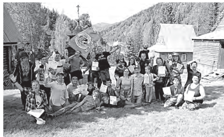
■ Фото Вячеслава Светличного.