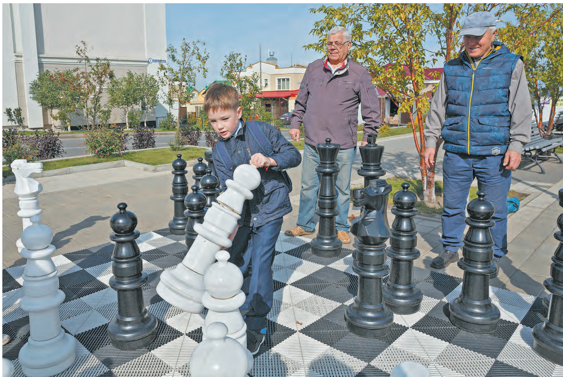
■ В городе-спутнике Лесная Поляна парковыми фигурами играет и стар и млад.