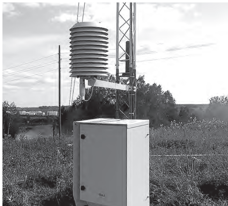
■ АМС в Лесной Поляне.