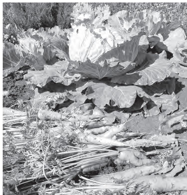
■ Морковь – в закрома, капусту погодим.